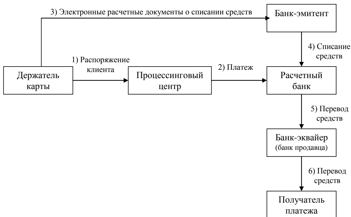
Рис. 4.1. Схема расчетов с использованием банковских карт

Стандартная упрощенная схема расчетов с использованием банковских карт выглядит следующим образом: