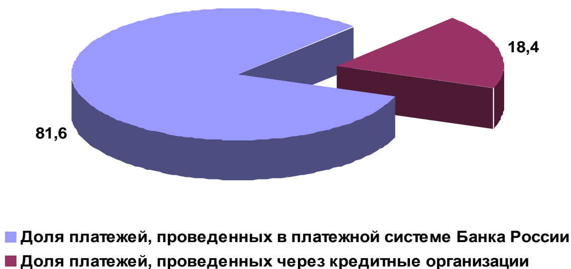
Рис. 2.2. Структура платежей, проведенных платежной системой России в 1 квартале 2010 г. (по объему, в %)

Несмотря на достигнутые результаты, Банк России при планировании направлений дальнейшего совершенствования своей платежной системы не мог не учитывать современные тенденции развития платежных систем в мире. Как свидетельствует мировая практика, наиболее перспективными являются системы валовых расчетов в режиме реального времени (ВРРВ), функционирующие под эгидой центральных банков, и неттинговые системы, операторами которых являются, как правило, организации негосударственного сектора экономики.