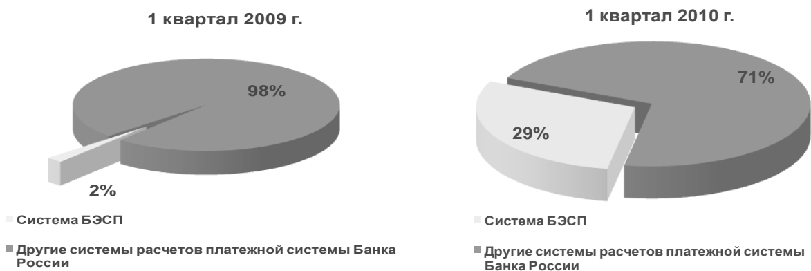
Рис. 2.4. Динамика доли платежей, проведенных в системе БЭСП

Доля платежей, проведенных в системе БЭСП, в общем объеме платежей, проведенных через платежную систему Банка России, постоянно возрастает, что наглядно представлено на рис. 2.4.