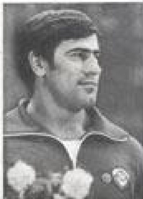
РИКЕРТ ДАВИД АДАМОВИЧ , заслуженный мастер спорта, олимпийский чемпион, абсолютный чемпион мира, автор 43 мировых рекордов.