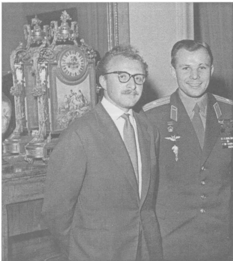
Каир. 1961 г.