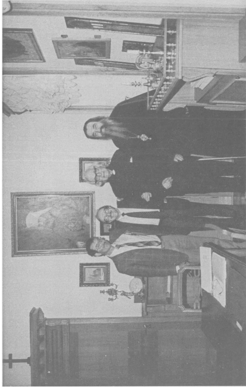
На II-ой Международной научной церковной конференции "Богословие и духовность русской православной церкви". Москва, 11.10.1987 г.