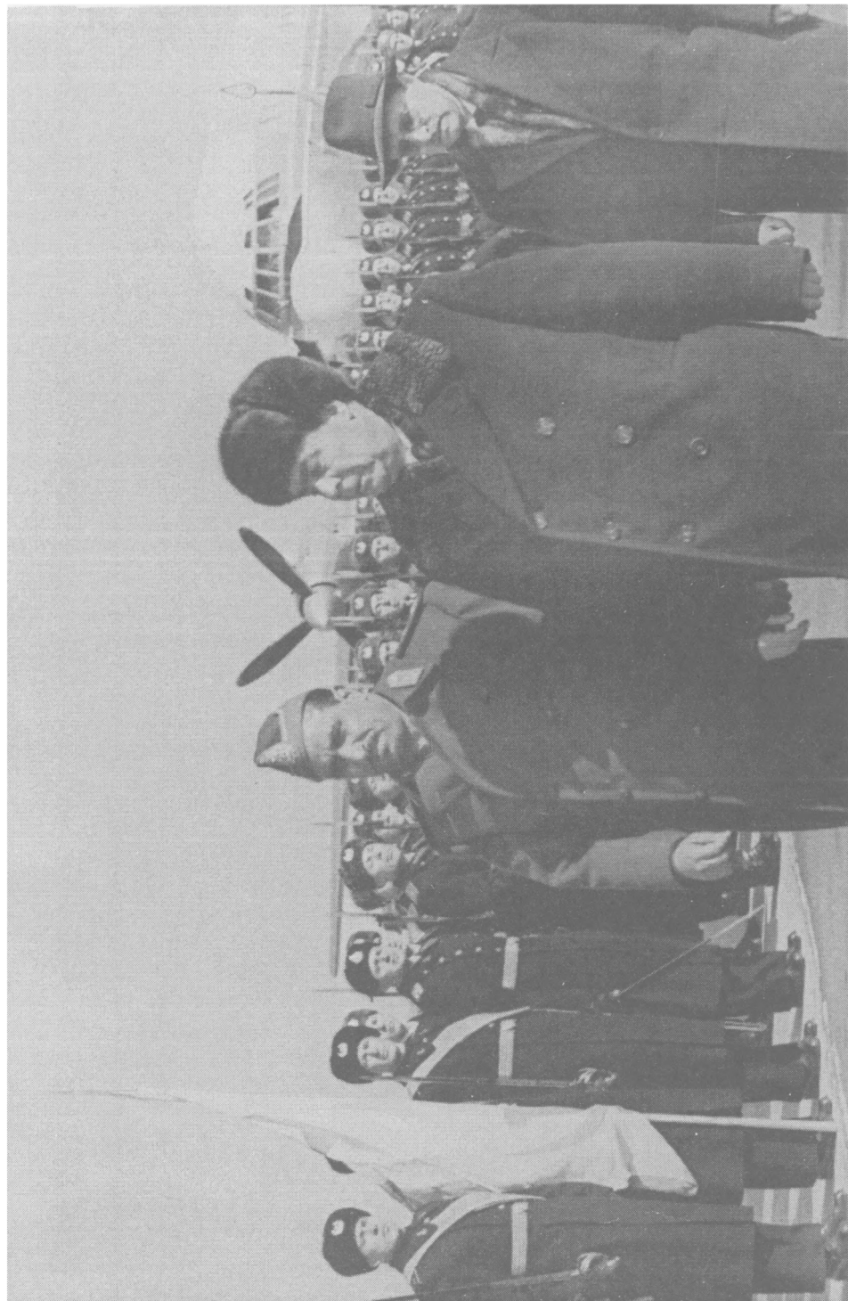
Москва, февраль 1977 г.