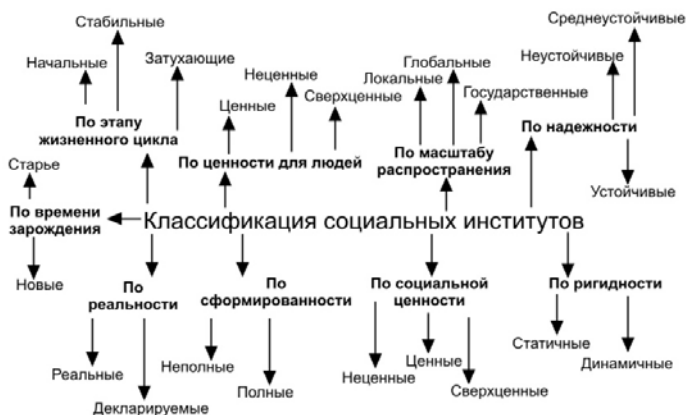
Рис. 2. Классификация социальных институтов

Хочу подчеркнуть, что, несмотря на обилие там различных оснований, вероятно, и она неполная, а вопрос окончательной классификации социальных институтов, скорее всего, является предметом специальной монографии. Тем не менее представленная классификация, на мой взгляд, более или менее полно отражает все многообразие социальных институтов в их вариабельности.