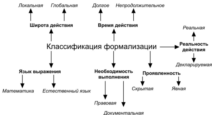
Рис. 1. Классификация формализации

Кроме того, можно выделять реальную (обязательную) и декларированную формализацию. Реальная формализация представляет собой набор правил, которым действительно необходимо следовать. Декларированные – это продемонстрированные правила, т. е. правила, о которых говорят. При этом она может быть как реальная и формальная, так и скрытая и явная, а также естественная и логическая (да, логическая, далеко не все и не всегда следуют правилам логики, нарушение их в обществе и для человека – это дело обычное). Подробнее о реальном и декларированном см. далее. Общая классификация формализации представлена мной на рис. 1.