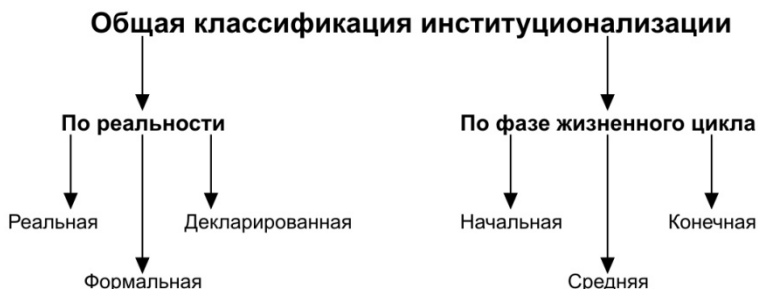
Рис. 5. Общая классификация институционализации

Рассматривая классификацию институционализации, необходимо отметить следующее. Литература об этом отсутствует полностью. Общепринятым считается, что есть процесс институционализации как таковой. Между тем, на мой взгляд, не все так просто. Общая классификация институционализации приведена на рис. 5.