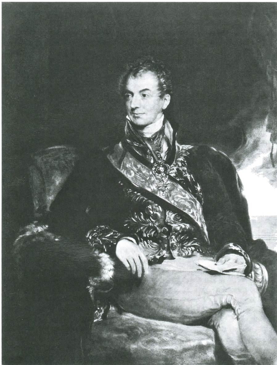
Сэр Томас Лоуренс, «Портрет князя Меттерниха». Этот фотомеханический оттиск воспроизводит выполненный британским художником портрет Клеменса Венцеля, князя Меттерниха, ведущей фигуры реакционного Священного Союза в 1815—1848 годах.