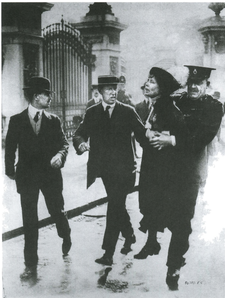
«Арест миссис Панкхёрст». Миссис Эммелин Панкхёрст была лидером британских суфражисток. Несмотря на то, что в то время ее много критиковали за воинственную тактику, сейчас ей придается значительная роль в обретении женщинами Великобритании избирательного права. Этот снимок был сделан 2 июня 1914 года, когда Панкхёрст направлялась с петицией в парламент, и напечатан New York World-Telegram & Sun (публикуется с разрешения отдела печатных копий и фотографий Библиотеки Конгресса).