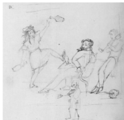
иллюстрация 4. Ранний рисунок Пушкина: бес, скелет и череп

На выскочив дом Глядел я косо. Если в эту пору Пожар его бы обхватил крутом, То моему б озлобленному взору Приятно было пламя.