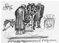
иллюстрация 1. Посадение в опричнину. Зарисовка Эйзенштейна к несуществующей сцене «Ивана Грозного»

Все больше склоняясь в пользу взять , Эйзенштейн решает сделать приказ об аресте и — что важно — просодику такого приказа лейт-мотивом фильма. Вот еще одна ранняя заметка: «Все казни одним словом, напр., „взять!“ („схватить“), которое от Андрея Шуйского (второе „взять!“) до Федьки Басманова (или духовника) идет в одной почти интонации» 17 .