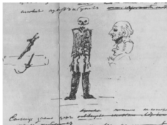
иллюстрация 5. Рисунок Пушкина: иллюстрация к «Гробовщику»

Гротескные символы «маленького скелета» и черепа можно видеть в самом начале восстановленной Т.Г. Цявловской родословной пушкинских «адских» композиций — на первом плане на раннем пушкинском рисунке с сидящим хвостатым бесом и разнузданной женщиной, расшвыривающей бутылки (илл. 4).