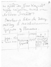
иллюстрация 2. Арест Пимена. Звукозрительная разработка Эйзенштейна для несуществующей сцены «Ивана Грозного»

Взглянем на предварительную разработку сцены, в которой грозный царь Иван приходит в дом архимандрита Пимена с целью взять хозяина под арест. Цель разработки — не откладывая на потом (как это обычно происходит в кинопроизводстве) наметить на бумаге звукозрительную канву «темы казней», пользуясь которой Сергей Прокофьев будет писать музыку к фильму.