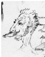
иллюстрация 3. Рисунок Пушкина: Сатана с дымом, вырывающимся из поздрей

В «Уединенном домике» история старушки и ее дочки конча- ется пожаром, уничтожающим домик (в дыме мерещится лицо Сата- ны, поздри которого дымятся; возможно [Цявловская 1960: рис. 7], он изображен Пушкиным — см. иллюстрацию 3; ср. [Шульц 1987: 120–121], [Эфрос: 189]).