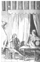
иллюстрация 1. Рисунок Пушкина (иллюстрация к «Домике в Коломне»)