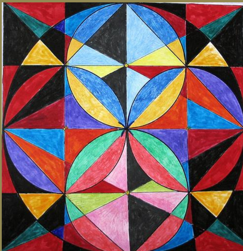
Meditation , Minneapolis, Minnesota, July 2008, photo © 2008 by QuoinMonkey. All rights reserved.