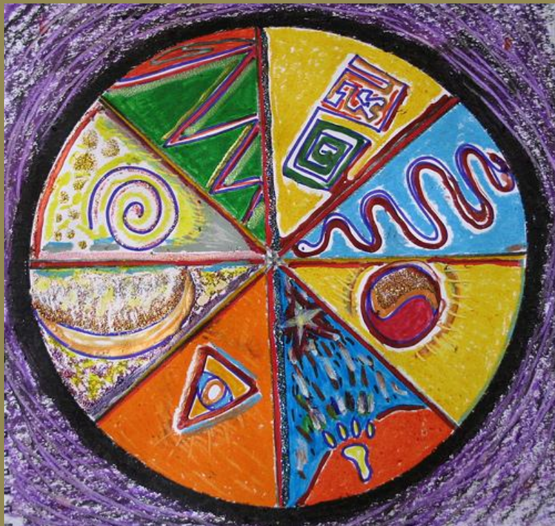
Mandala Shield , hand-drawn mandala, Minneapolis, Minnesota, May 2008, photo © 2008 by QuoinMonkey. All rights reserved.