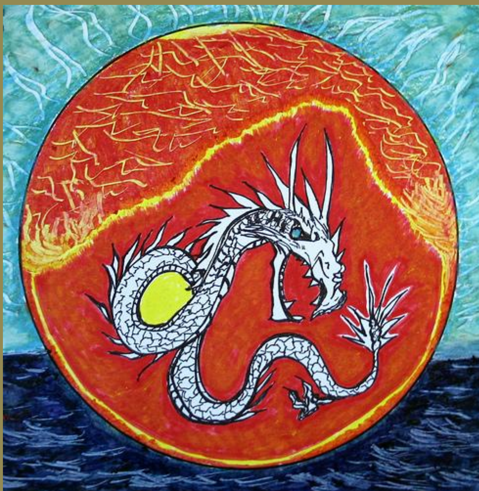
Befriending The Dragon , hand-drawn mandala, Minneapolis, Minnesota, June 2008