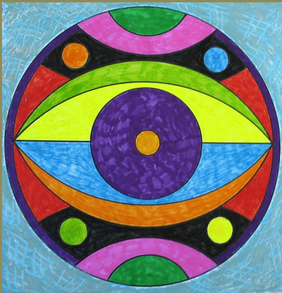
Eye Of The Beholder II , Minneapolis, Minnesota, June 2008, photo © 2008 by QuoinMonkey. All rights reserved.