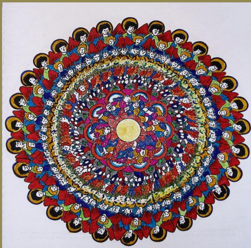
Hildegard Of Bingen's Vision , Minneapolis, Minnesota, May 2008