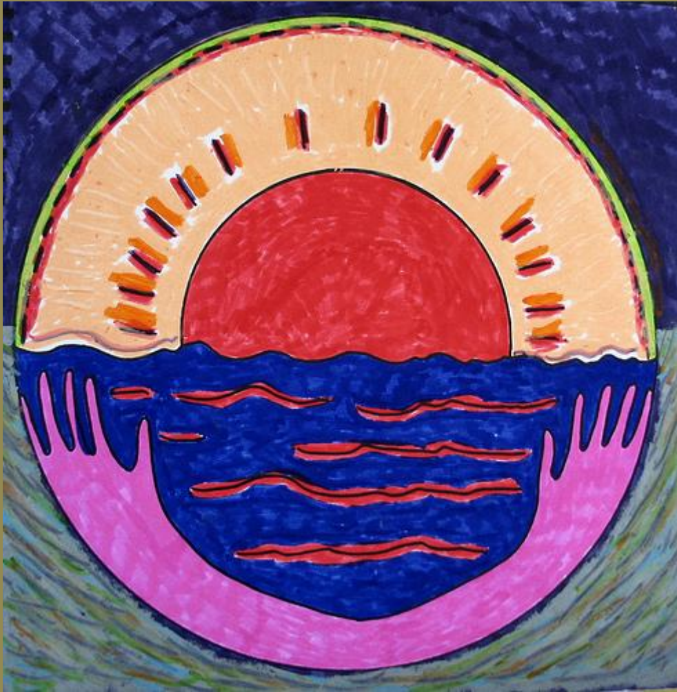
Mother Earth, Father Sky , Minneapolis, Minnesota, June 2008, photo © 2008 by QuoinMonkey. All rights reserved.

Дракон, с которым идет битва, это уроборос символизирующий архитепических родителей. Их влияние пребывает и живет в нас в виде внедренных установок, директив, приказаний наших родителей, которые сильны потому, что подпитываются из архитепических родителей.