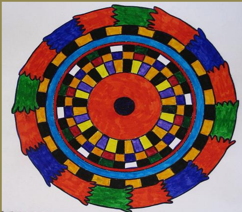
Protection , Minneapolis, Minnesota, May 2008