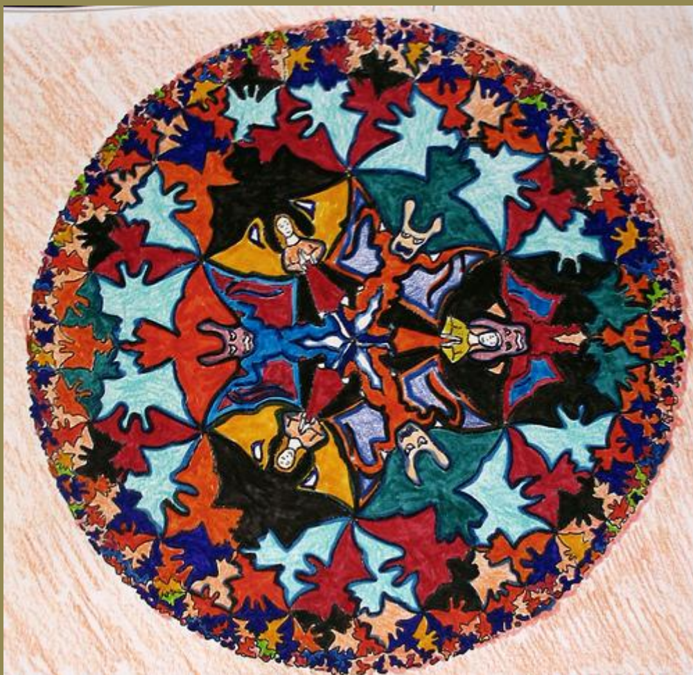
Escher's Dragons , Minneapolis, Minnesota, June 2008