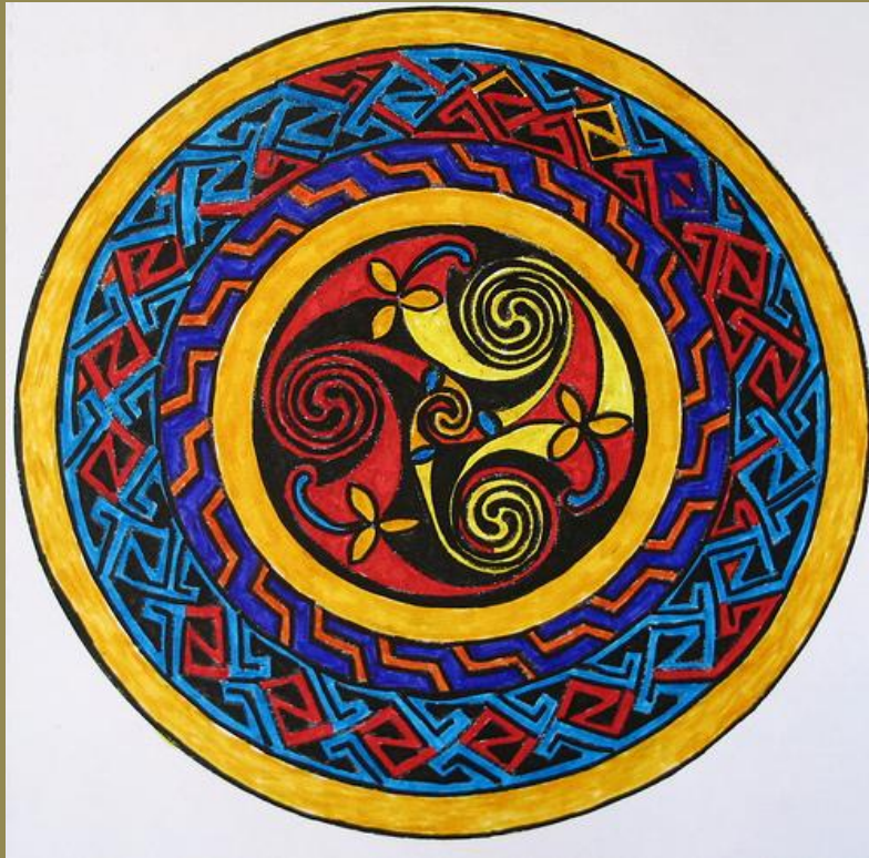
Celtic Mandala , Minneapolis, Minnesota, May 2008, photo © 2008 by QuoinMonkey. All rights reserved.