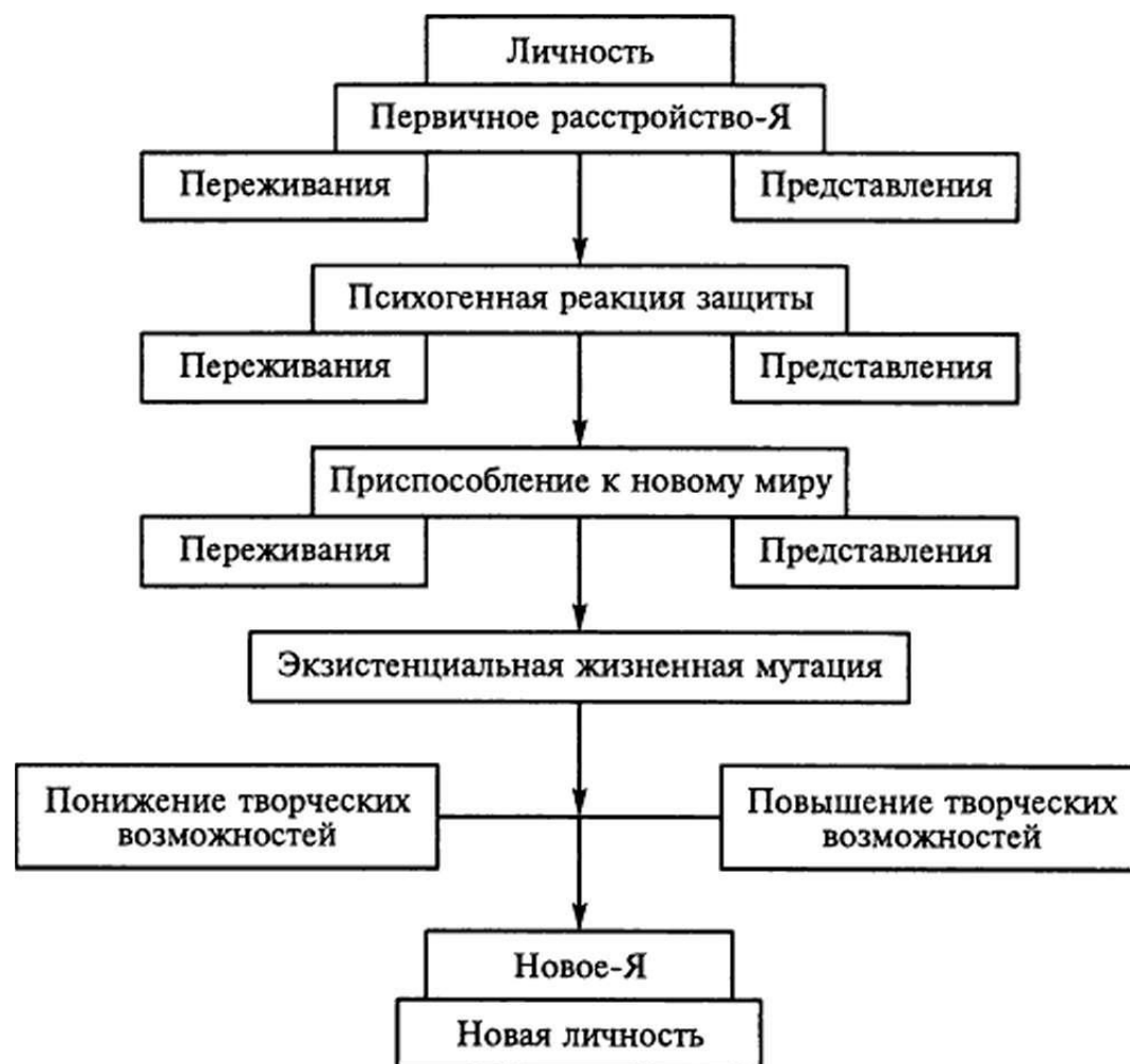
Рис. 2. Динамика изменений самосознания в период кризиса

ством А. Ф. Шадуры в лаборатории социально-психологической реабилитации личности Института развития личности (Шадура А.Ф., Осухова Н.Г., 1999).