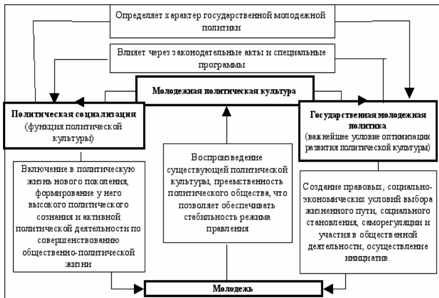
Схема 1. Процесс формирования молодежной политической культуры

способны эффективно развивать и использовать инновационный потенциал молодежи.