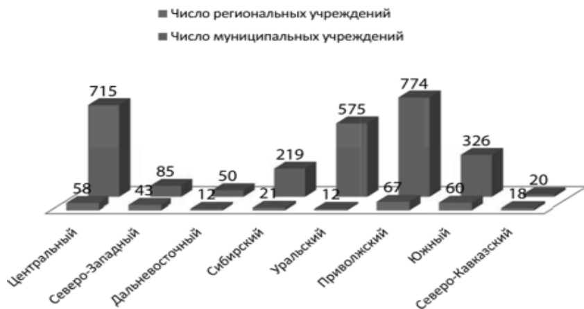
Рисунок 1. Распределение учреждений органов по делам молодежи по субъектам РФ

На рисунке 1 представлено распределение учреждений органов по делам молодежи по субъектам РФ (по данным мониторинга Росмолодежи 2012-2014 гг.).