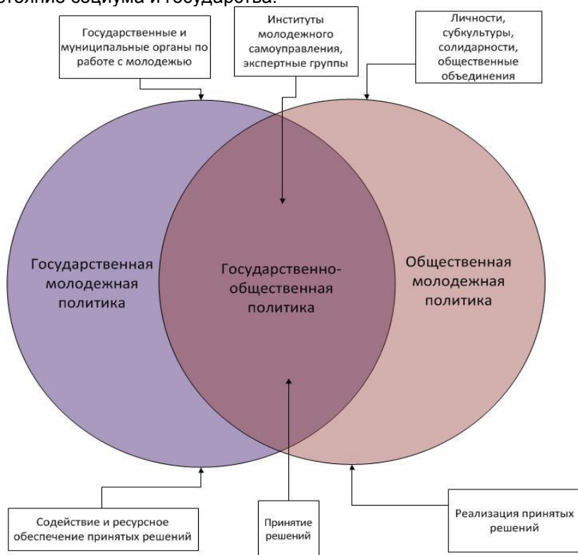
Схема 2. Государственно-общественная молодежная политика: субъекты и их полномочия

литических и общественных отношений. Целью ГМП является оказание воздействия на социализацию и политико-социальное развитие молодых людей, способствовать их вовлечению в политическую жизнь общества, и посредством этого влиять на будущее состояние социума и государства.