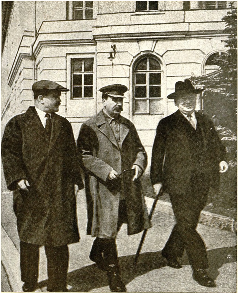
И. В. СТАЛИН, В. М. МОЛОТОВ и М. М. ЛИТВИНОВ