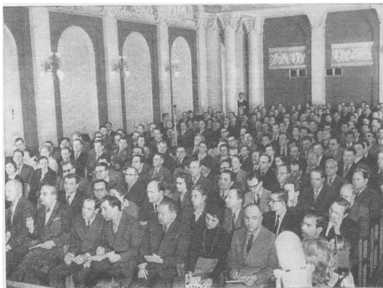
Октябрьский зал Дома Союзов во время пресс-конференции

Так, на балконе оперного театра были повешены 12 советских граждан; на Стрелецкой площади на глазах жителей города расстреляны 15 человек; на углу улиц Дзержинского и Ивана Франко убиты старик и две женщины; на улице Зыбликевича был выброшен на мостовую из окна третьего этажа грудной ребенок; в районе дрожжевого завода было вывезено на автома-