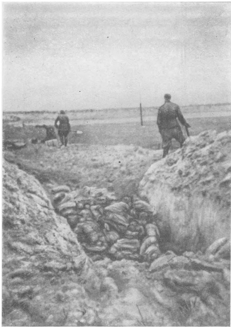
Трупы расстрелянных гитлеровцами на Северном Кавказе мирных советских людей