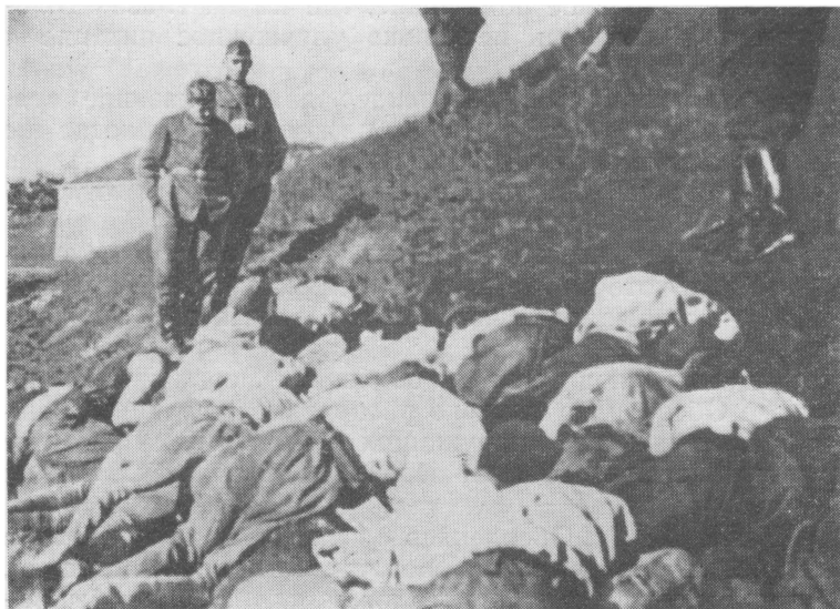
Гитлеровские солдаты у трупов расстрелянных ими мирных советских граждан на Северном Кавказе

Именно эти подразделения отличались особой жестокостью в расправе с мирными советскими гражданами, партизанами и военнопленными, отказывавшимися служить немцам. Особенную жестокость они проявили в районе Нальчика, где были уничтожены сотни невинных людей. Эти же подразделения являлись арьергардом на всём пути отступления «Бергманн» до Тамани. Ими были угнаны большие количества крупного рогатого скота и разгромлены племенные хозяйства лошадей.