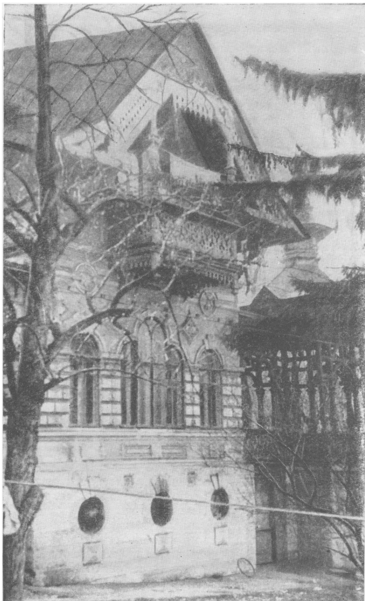
Бывшая дача Шаляпина — штаб-квартира Оберлендера в г. Кисловодске