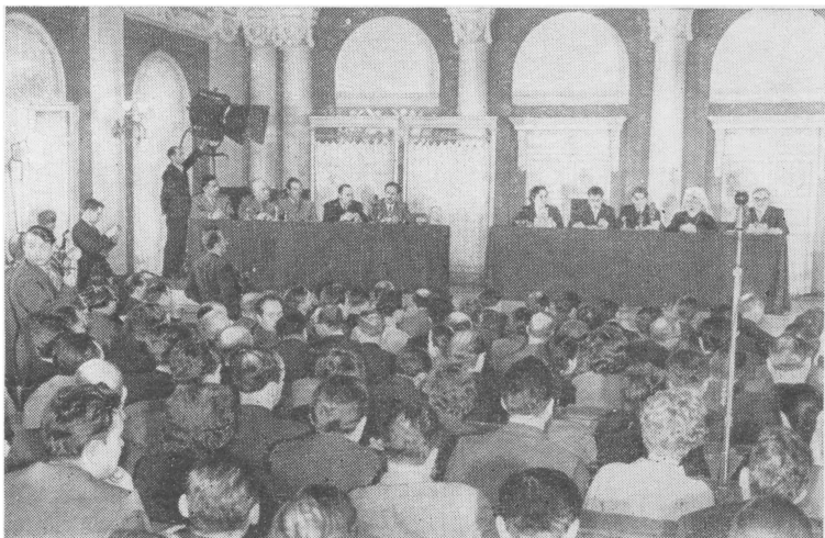
Октябрьский зал Дома Союзов во время пресс-конференции

му вопросу. Текст сообщения на русском, английском, французском, немецком, испанском языках будет роздан присутствующим.