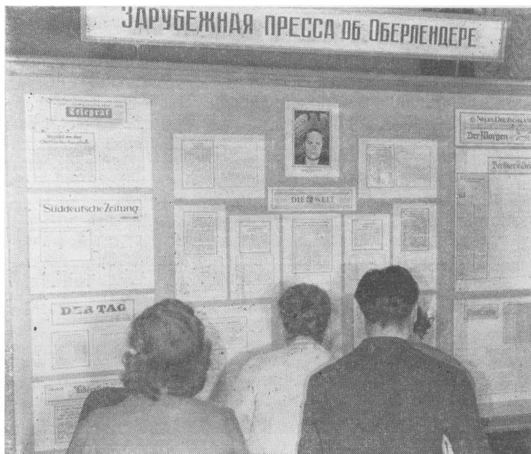
У стенда «Зарубежная пресса об Оберлендере»