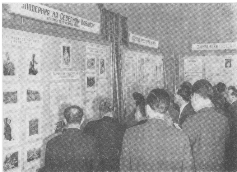
Участники пресс-конференции осматривают выставку документов о зверствах Оберлендера

Больше вопросов нет. На этом разрешите пресс-конференцию объявить закрытой.