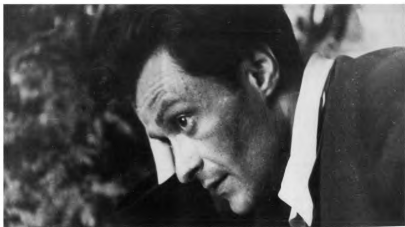
Эвальд Ильенков, 50-е годы