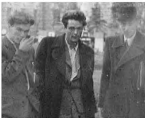
Эвальд Ильенков (в центре) 50-е годы