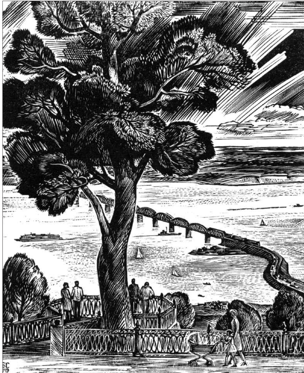
Склярук Б. Н. На Венце. 1979 г. Ксилография