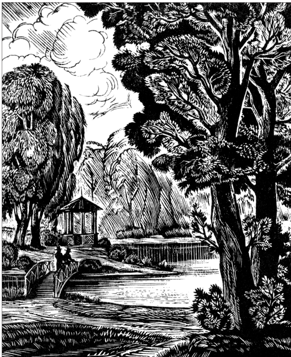
Склярчук Б. Н. Языковский парк. 1977 г. Ксилография