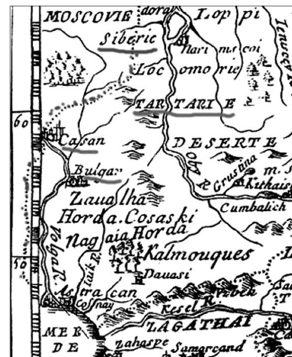
Фрагмент карты Делиля 1676 г.