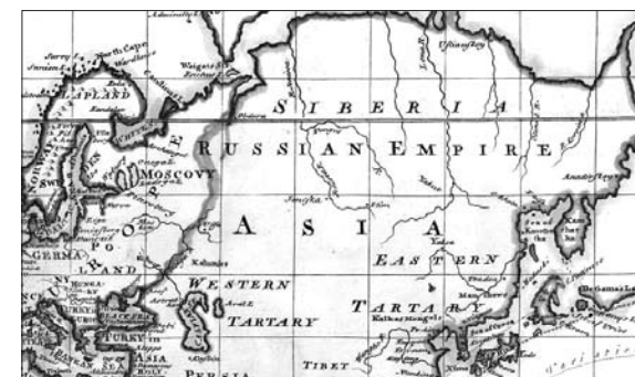
Тартария и Московия. 1744 г.