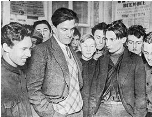
Маяковский на выставке «20 лет работы»

К концу 20-х гг. в творчестве Маяковского намечается кризисная ситуация. Малограмотные массы созерцающие окна РОСТА постепенно уступали место новому молодежному рабфаковскому поколению. Новая советская интеллигенция ждала уже не элементарного агитпропа, но злободневных образцов поэзии социалистического реализма.