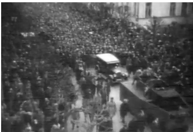
Похороны Владимира Маяковского

порыве на улицы центра Москвы вышли десятки тысяч людей, чтобы проститься с поэтом и проводить его в последний путь до кремирования за Донским монастырем. На всех балконах люди. Приглушенный грохот кровельной жести плывет над шествием: люди – на всех крышах. Толпа возле крематория буквально придавила конную милицию, лошади встали на дыбы, пришлось стрелять в воздух, это было воспринято как прощальный салют поэту.