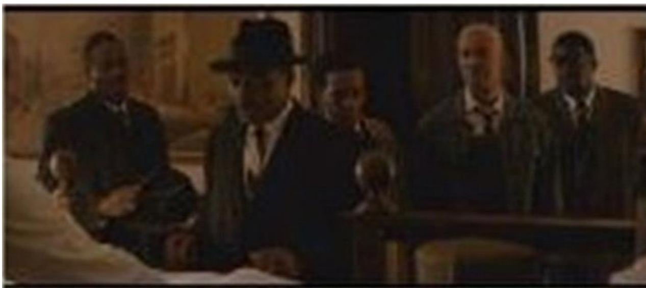
Figure 1 – Sepia (a little Golden way): enlightener historical glance

By giving some examples, this first frame is about a visit to a black guy who was victim of racial violence. The colour palette is brown based, in a kind of sepia. The black men's suits are black, as well. There is no soundtrack (musical silence) and there are the voices of some characters (verbal). All of these elements compose the integral unit of the verbivocovisual utterance, with its systemic criticism in a tone of homage (golden) to Martin Luther King in defense of the civil rights of North American blacks.