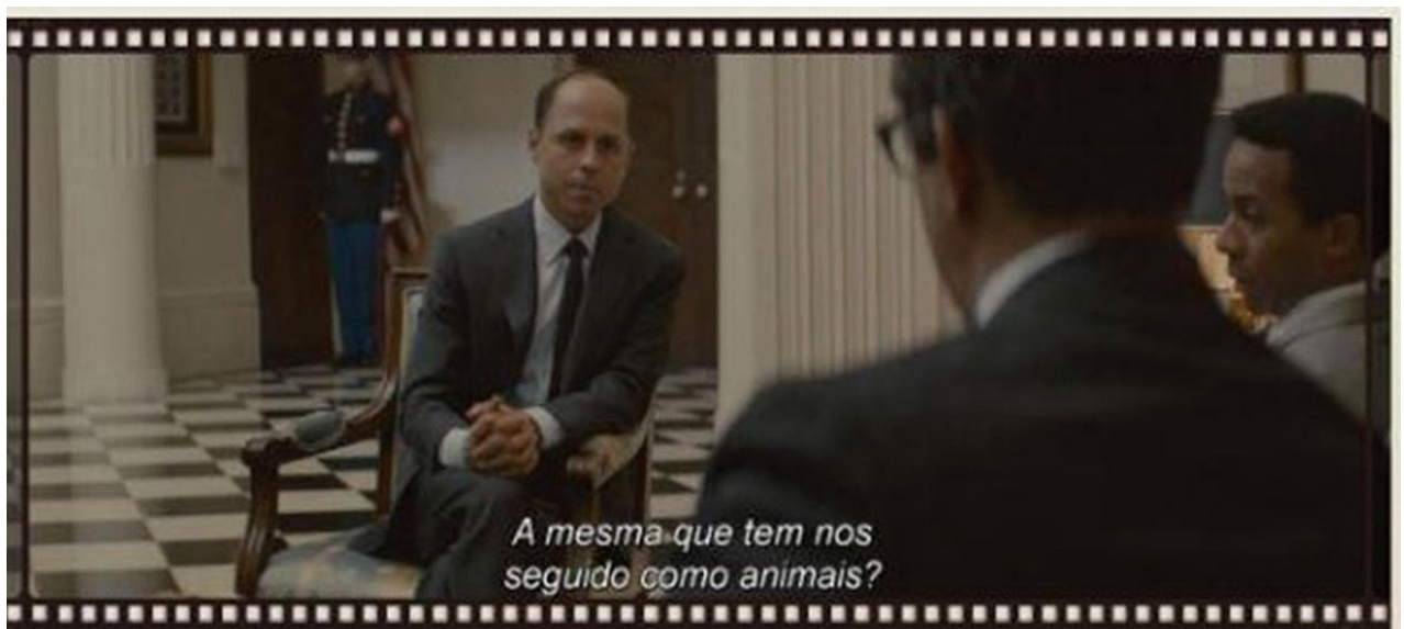
Figure 2 – Black and White: opposition settings

The conception that a global analysis of utterances is plausible and necessary, based on the interrelationship within which coexist in different semiosis, finds in the authors of Bakhtinian circle some initial, indicative discussions [as in Marxism and Philosophy of Language [2017]; Volóchinov's essay Problems of Bethoven's work; Dostoevsky's Work [2019]; Bakhtin's Problems of Dostoevsky's Poetics [2015]; Medviédev's Formal Method in Literary Studies [2012]; and Sollertinski's studies of opera, for example].