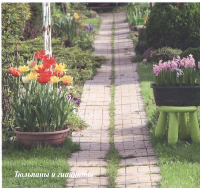
Тюльпаны и гиацинты

Не в каждом саду растет черемуха , черемуха колората май это огромное дерево, да и запах резковат. Стоит посадить не видовое растение, а например, пурпурнолистный сорт 'Колората', цветущий в начале мая кистями розовых, нежно пахнущих цветков, после отцветания листва его зеленеет. Ландыши , «первого мая привет», в Подмоскowie зацветают в двадцатых числах мая, посадите их в полутеневом месте под кустарниками или пионами, они заживут самостоятельной жизнью, не требуя ничего, кроме благодарности за их дивный аромат.