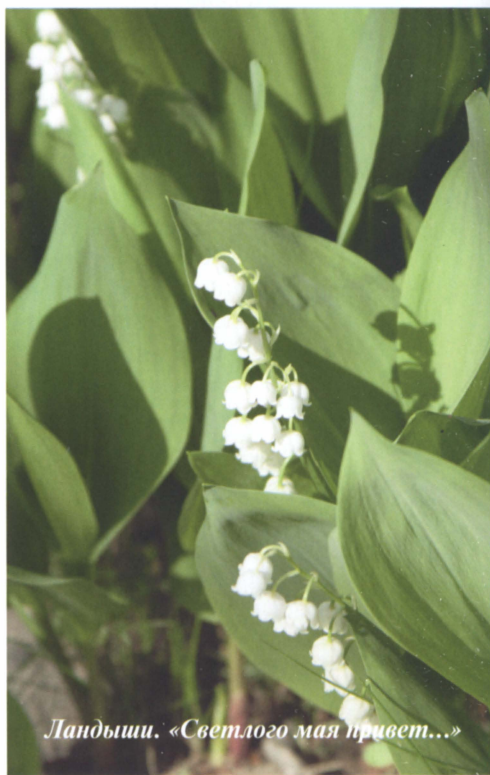
Ландыши. «Светлого мая привет...»

Июнь — пора цветения чубушника . Трудно представить себе русский сад, в котором не было бы чубушника. Все его виды и сорта предпочитают солнечное место и влажную плодородную почву, но неплохо растут и на бедных сухих почвах в полутени, хотя, конечно, цветут в этом случае не столь обильно. Для создания ароматного сада не подойдут многие махровые сорта с крупными цветками, лишенными запаха, (к счастью, существуют и махровые ароматные сорта),