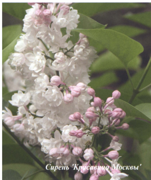
Сирень 'Красавица Москвы'