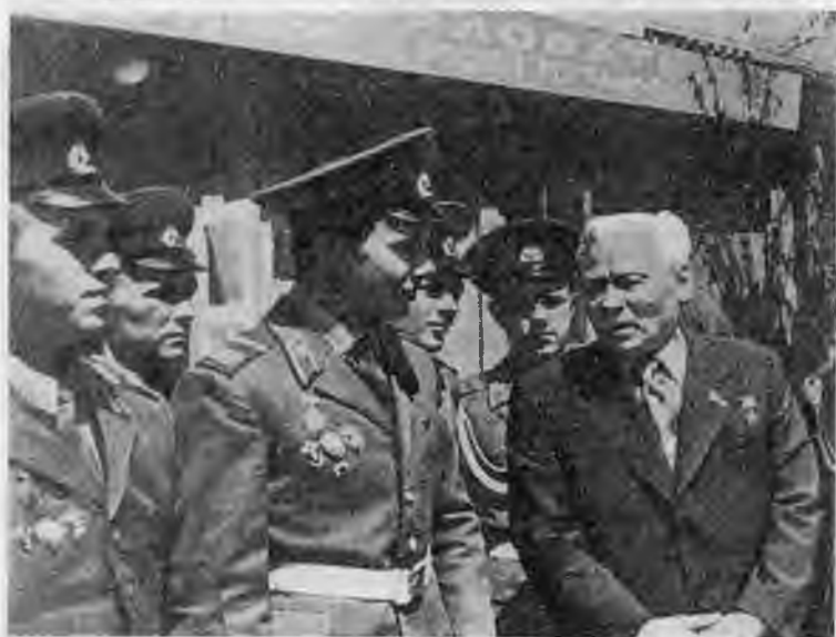
Делегаты партийной конференции погранотряда. Второй справа, в верхнем ряду — К.У. Черненко. Казахстан. 1932 г. В родном погранотряде 47 лет спустя.