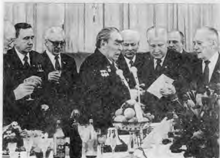
Орден Победы маршалу Брежневу. 1978 г. День рождения генсека. Еще одна награда...