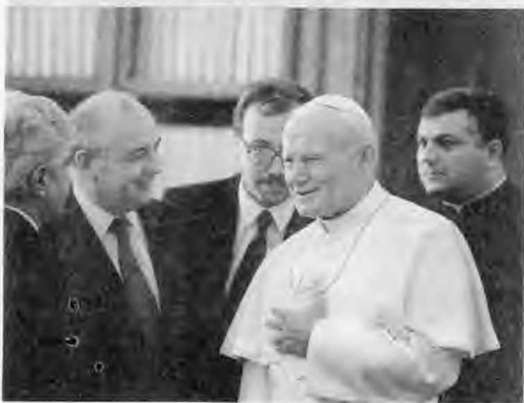
С Маргарет Тэтчер в Кремле. 1987 г.