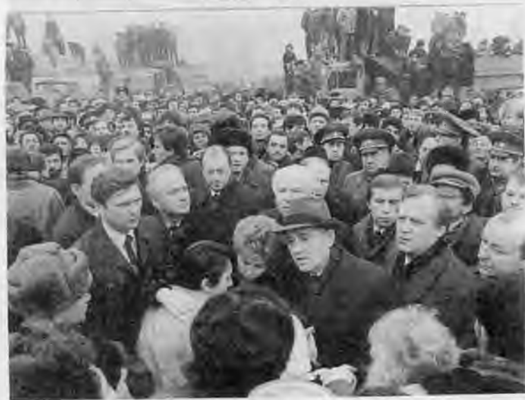
Посещение Чернобыльской АЭС. 1986 г. В разрушенном землетрясением Спитаке. 1988 г.