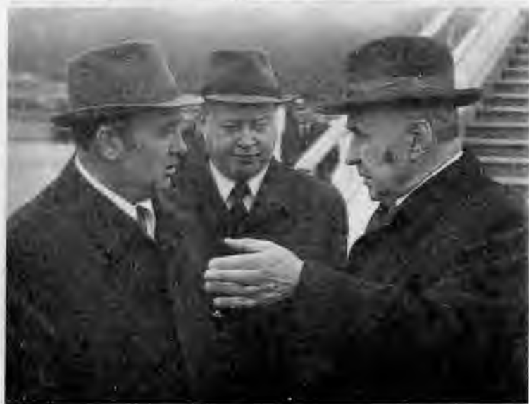
На отдыхе с Ю.В.Андроповым в Кисловодске. 1976 г. С А.Н.Косыгиным. 1972 г.