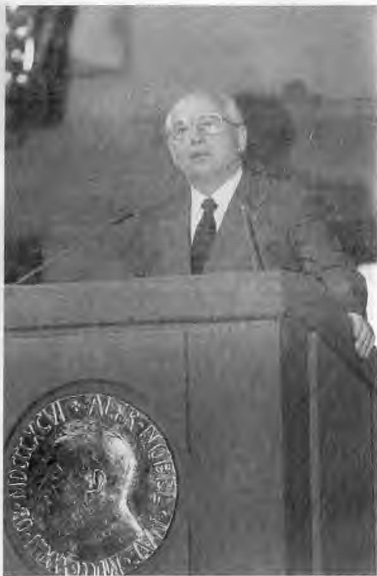
Выступление при вручении Нобелевской премии мира. Осло. 1991 г.