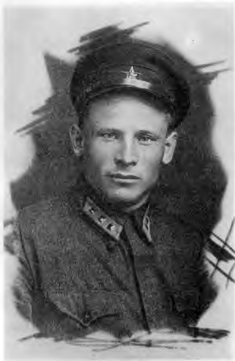
Пограничник Константин Черненко.