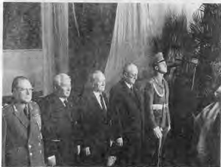
В президиуме XIX съезда ВЛКСМ. Май 1982 г. В почетном карауле у гроба благодетеля. Ноябрь 1982 г.