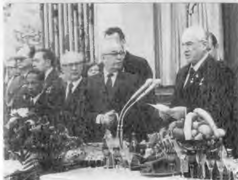
Встреча с Генеральным секретарем ООН Пересом де Куэльером. Москва. 1983 г. Праздничный прием в Кремле, посвященный 60-летию образования СССР. 1982 г.