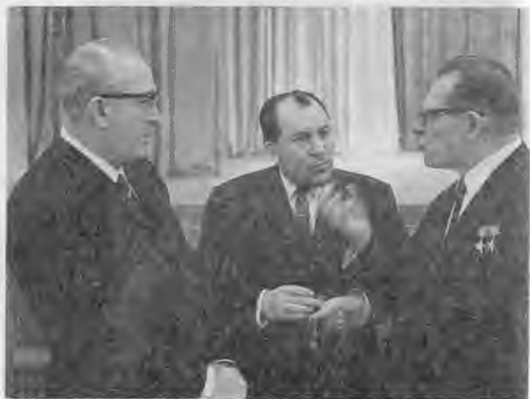
На Онежском тракторном заводе в Петрозаводске, где Андропов начинал свою политическую карьеру. 1982 г. С Д.Ф.Устиновым (справа)