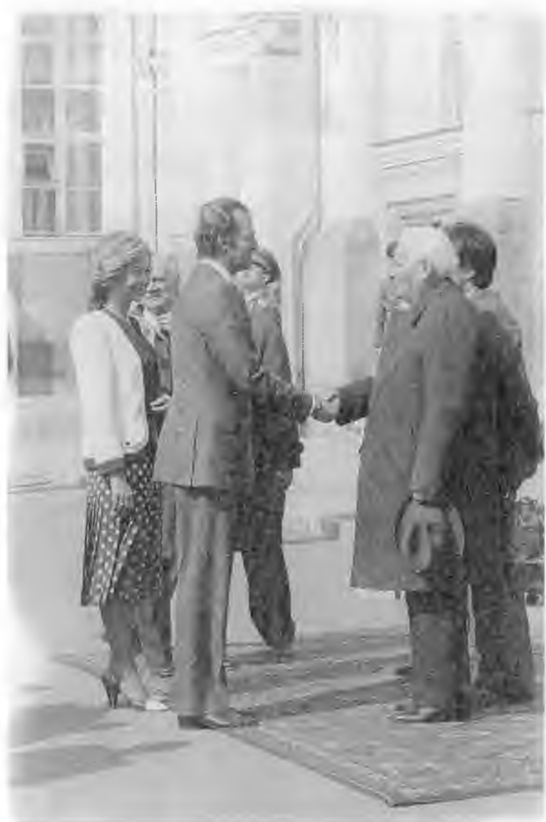
Визит в СССР короля Испании Хуана Карлоса I. 1984 г.