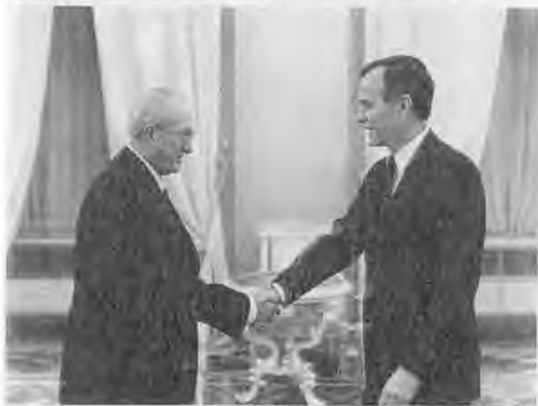
Проводы Эриха Хонеккера на Внуковском аэродроме. 1983 г. С вице-президентом США Джорджем Бушем. Москва. 1982 г.