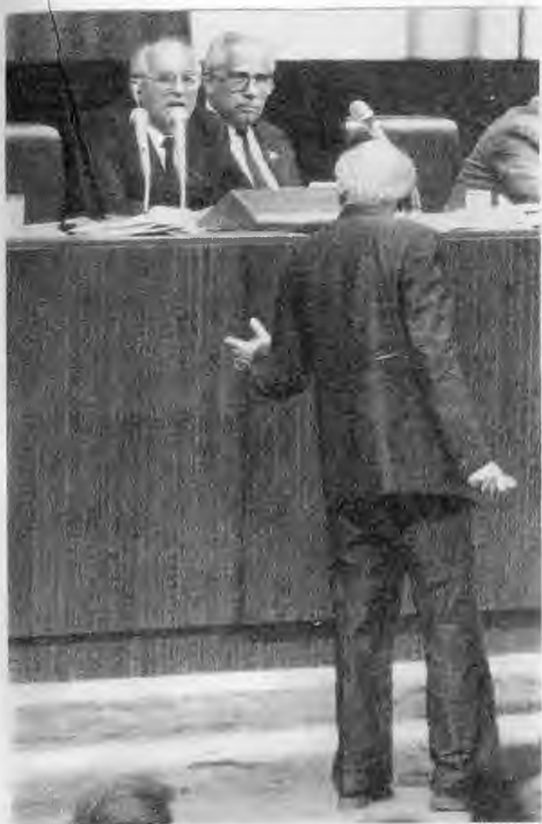
Полемика с А.Д.Сахаровым. Второй съезд народных депутатов СССР. 1989 г.