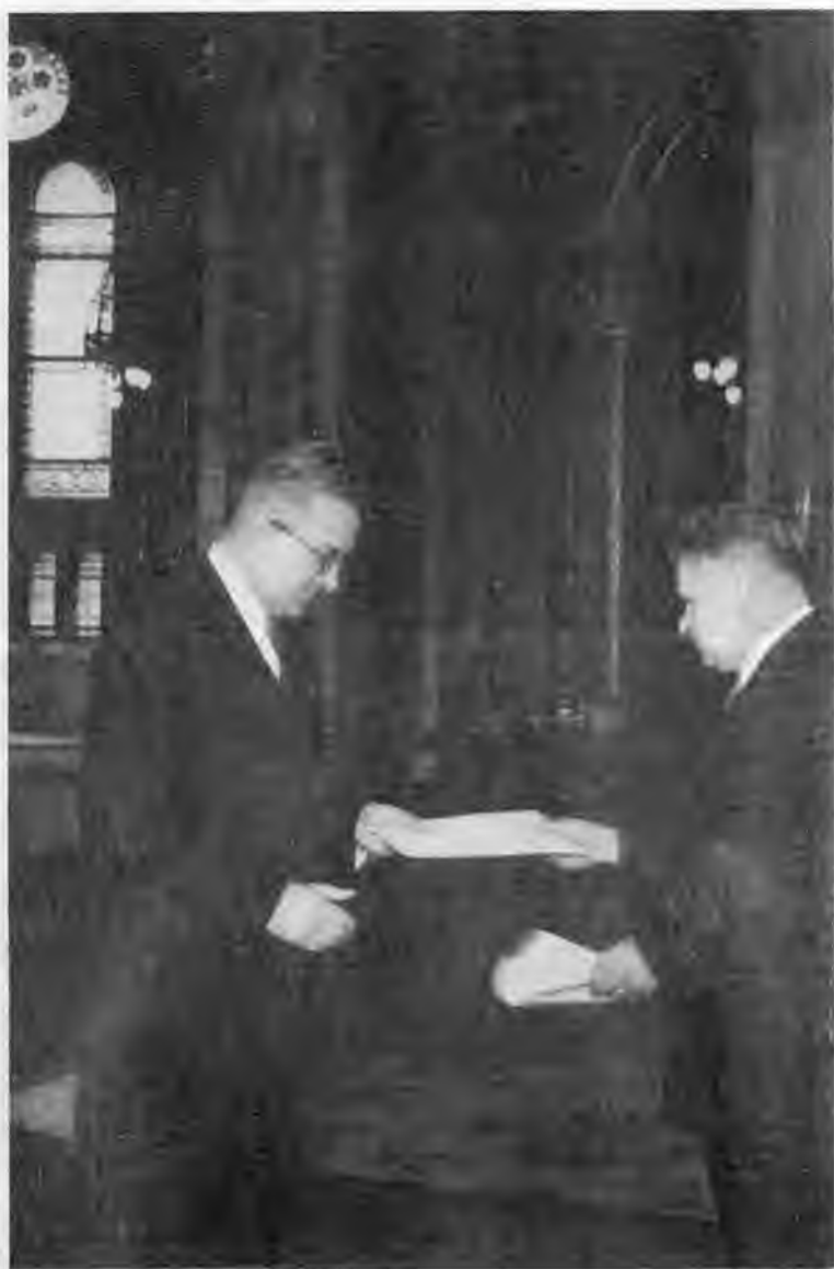
Вручение верительных грамот Председателю Президиума ВНР Иштвану Доби. Будапешт. 1954 г.