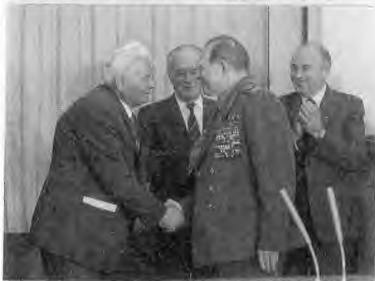
Первый прием нового генсека в Кремле. 1984 г.