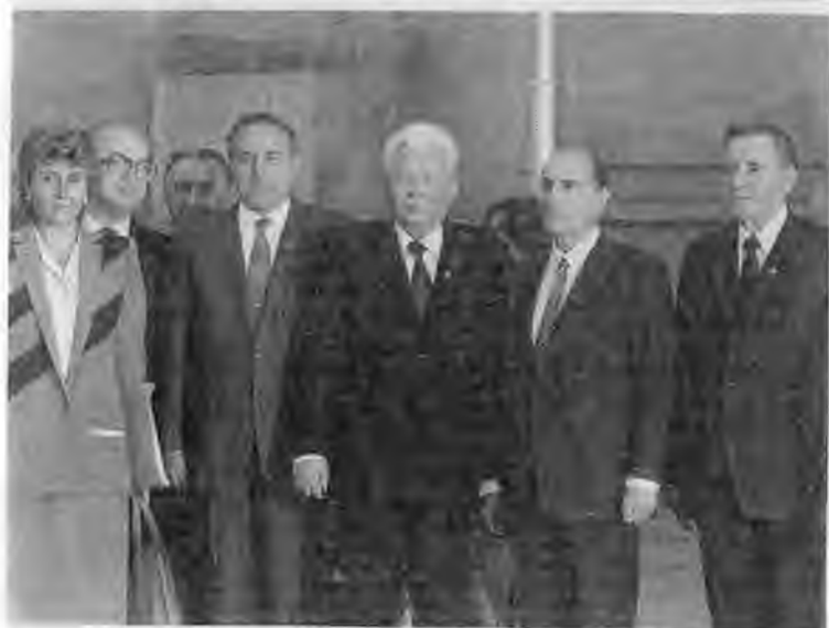
Дружеская встреча с Густавом Гусаком. В Кремле с Франсуа Миттераном. 1984 г.