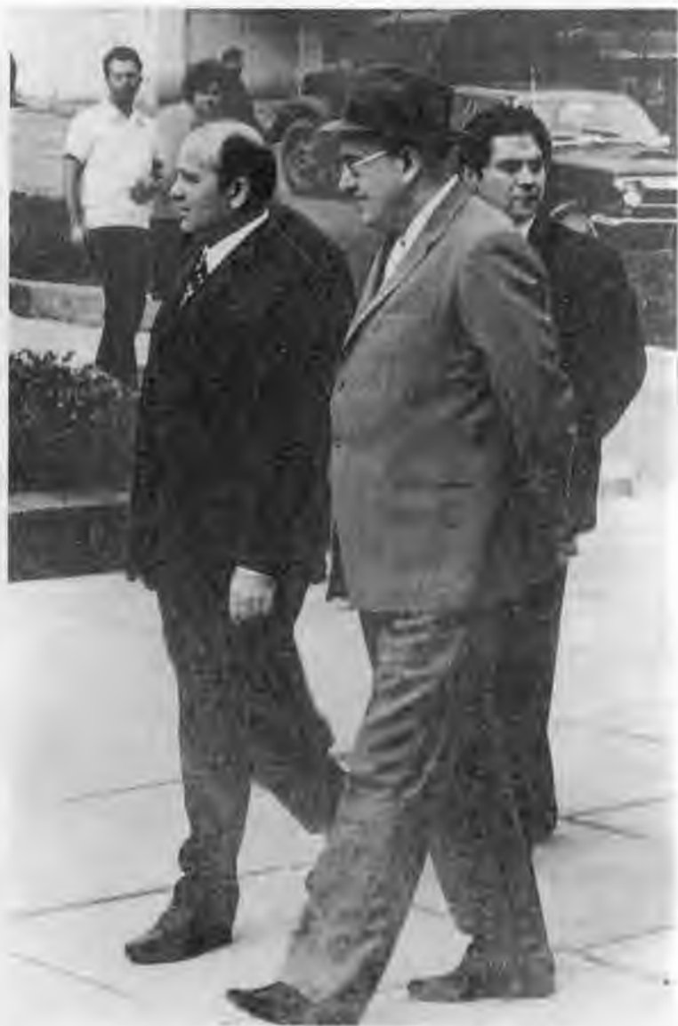
В Пятигорске состоялось близкое знакомство Ю.В.Андропова и М.С.Горбачева. 1974 г.