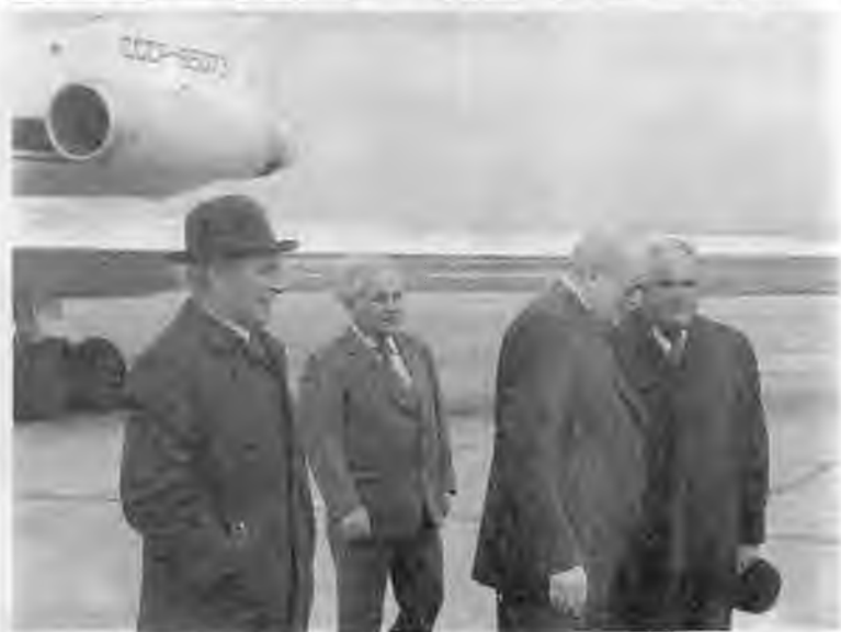
Ю.В. Андропов и А.Н. Косыгин после визита в КНДР. Владивосток. 1961 г. С первым секретарем Ставропольского крайкома КПСС В.С. Мураховским. Начало 80-х гг.