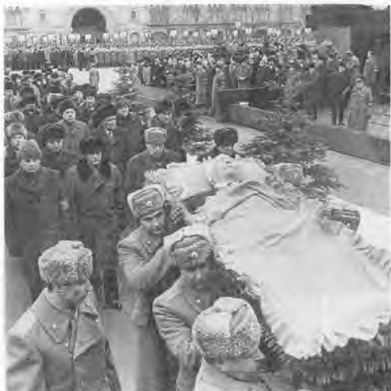
Похороны. 13 марта 1985 г.