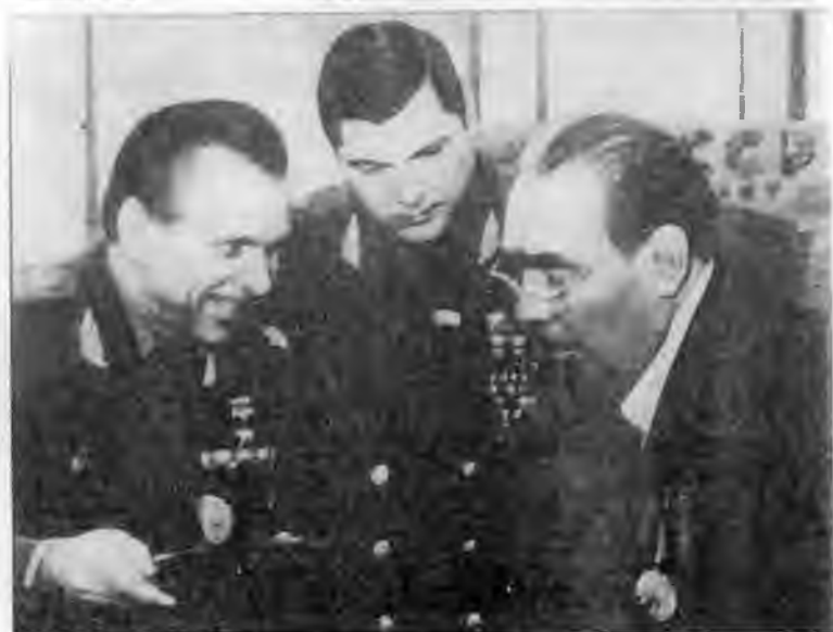
На встрече с ветеранами 18-й армии. 1980 г.

Н. А. Щелоков и Ю. М. Чурбанов преподносят генсеку к его 75-летию золотые часы, списанные министерством по акту как «подарок товарищу Гусаку». 1981 г.