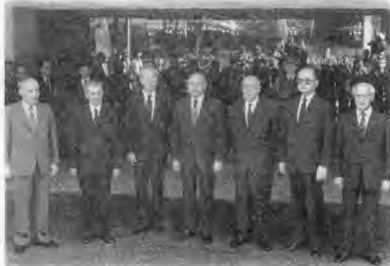
В президиуме XI съезда Социалистической единой партии Германии. Справа — Эрих Хонеккер. 1986 г.