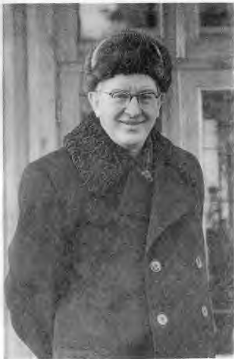
В Завидове. 1967 г.