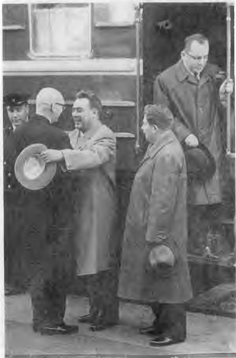
Встреча с президентом Финляндии Урхо Калевя Кекконеном в Хельсинки. 1961 г.