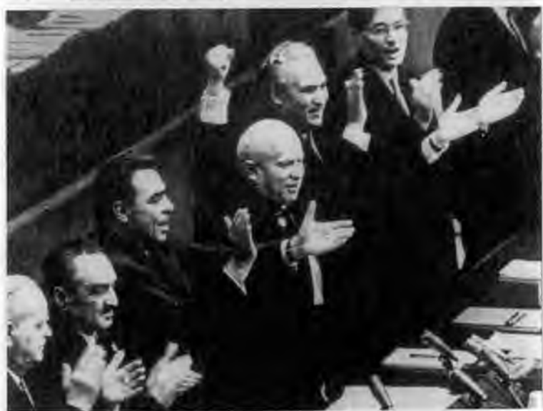
Первый секретарь Запорожского обкома партии Л.И.Брежнев на «Запорожстали». 1946 г.