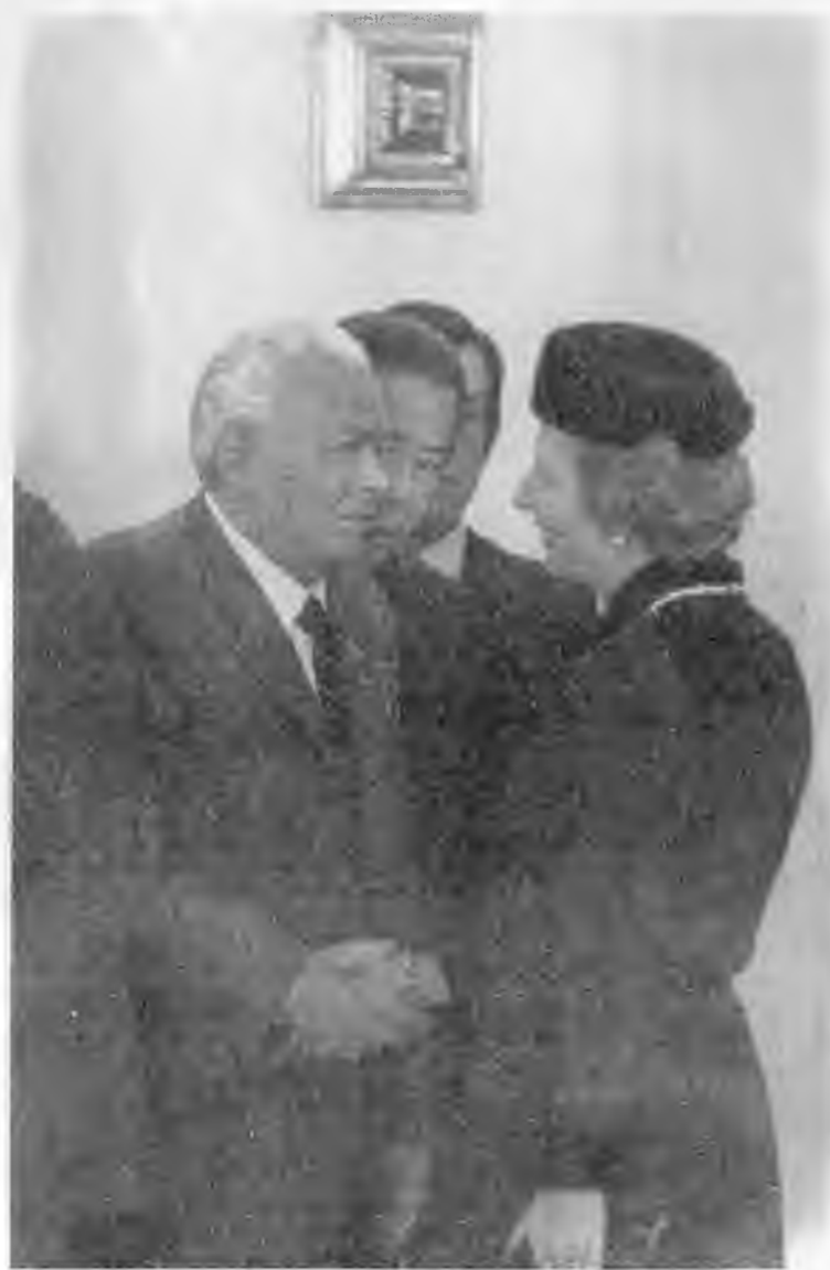
С Маргарет Тэтчер. 1984 г.