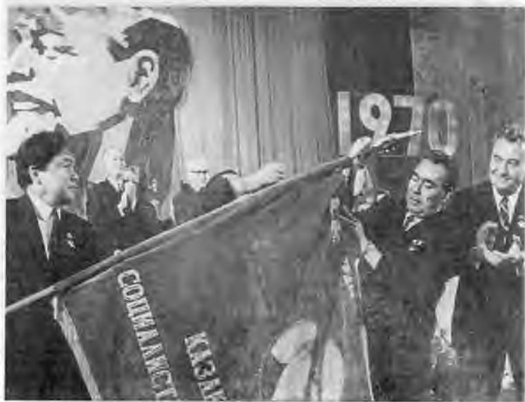
С первым секретарем Краснодарского крайкома КПСС С.Ф.Медуновым, впоследствии исключенным из партии за покровительство взяточников. Начало 70-х гг. Награждение Казахстана орденом Октябрьской революции. 1970 г.