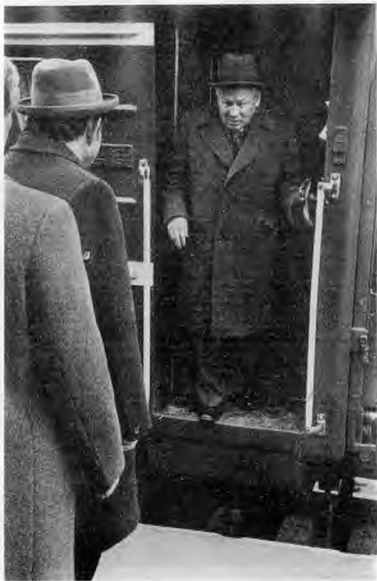
Возвращение из отпуска. 1984 г.