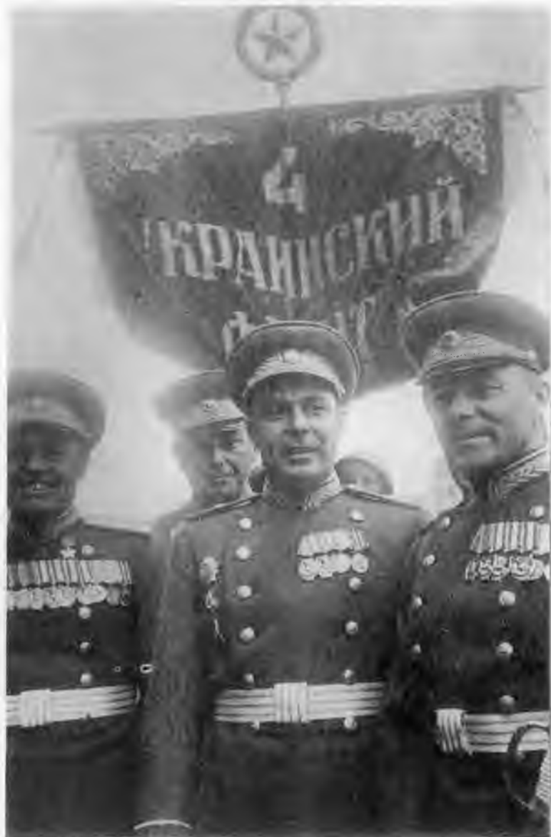
На Параде Победы. 1945 г.