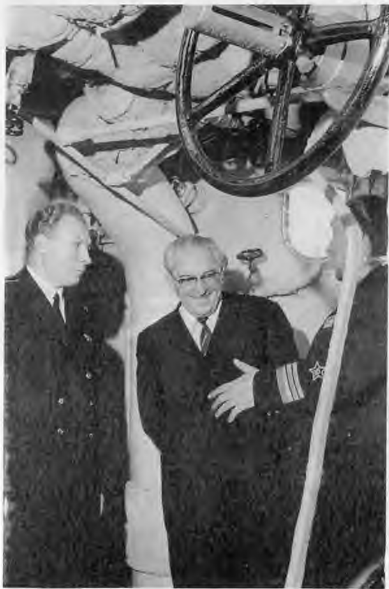
Осмотр противолодочного корабля «Кронштадт»