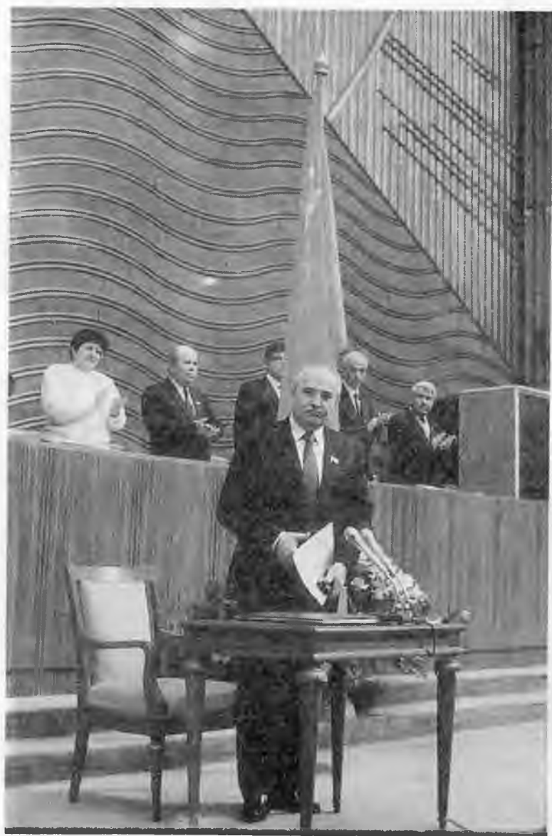
Первый президент СССР принимает присягу. 15 марта 1990 г.