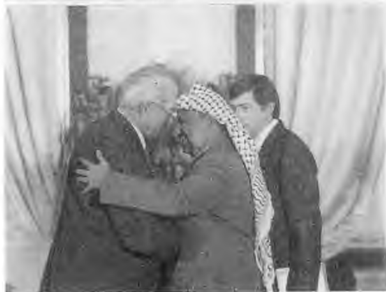
Густав Гусак встречает советскую делегацию во главе с Ю.В.Андроповым. Прага. 1983 г.