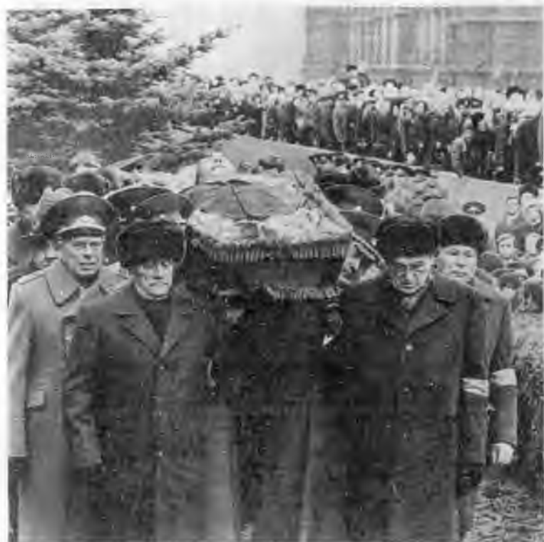
Похороны. 15 ноября 1982 г.