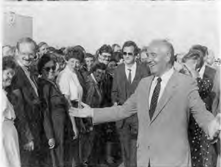
1985 год положил начало поездкам М.С.Горбачева по стране, встречам с людьми. На фото вверху: Ленинград. Май 1985 г. Внизу: с земляками в Ставрополе. 1985 г.