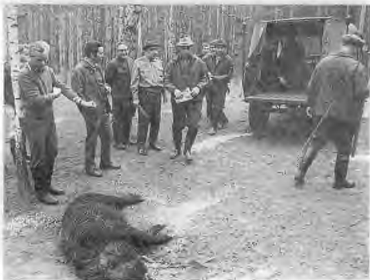
Беседа с премьер-министром Индии Индирой Ганди. Дели. 1973 г. С Генри Киссинджером после охоты в Завидове. 1973 г.