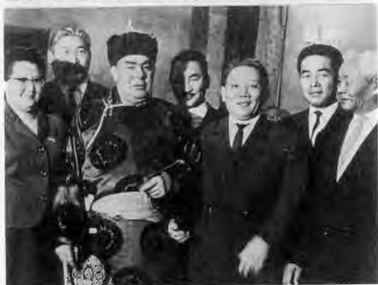
С федеральным канцлером ФРГ Гельмутом Шмидтом. Кремль. 1979 г.