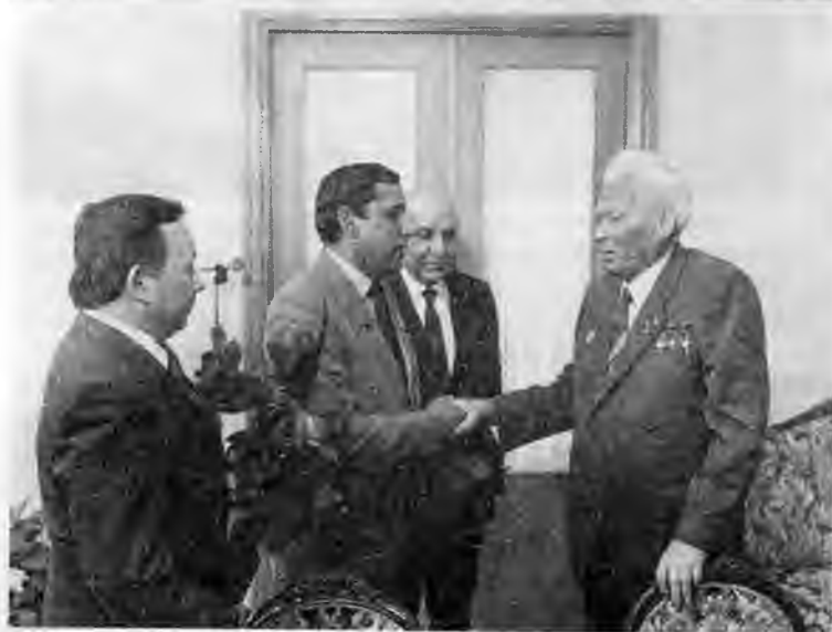
В индийском посольстве в Москве в связи с трауром по погибшей Индира Ганди. 1984 г.