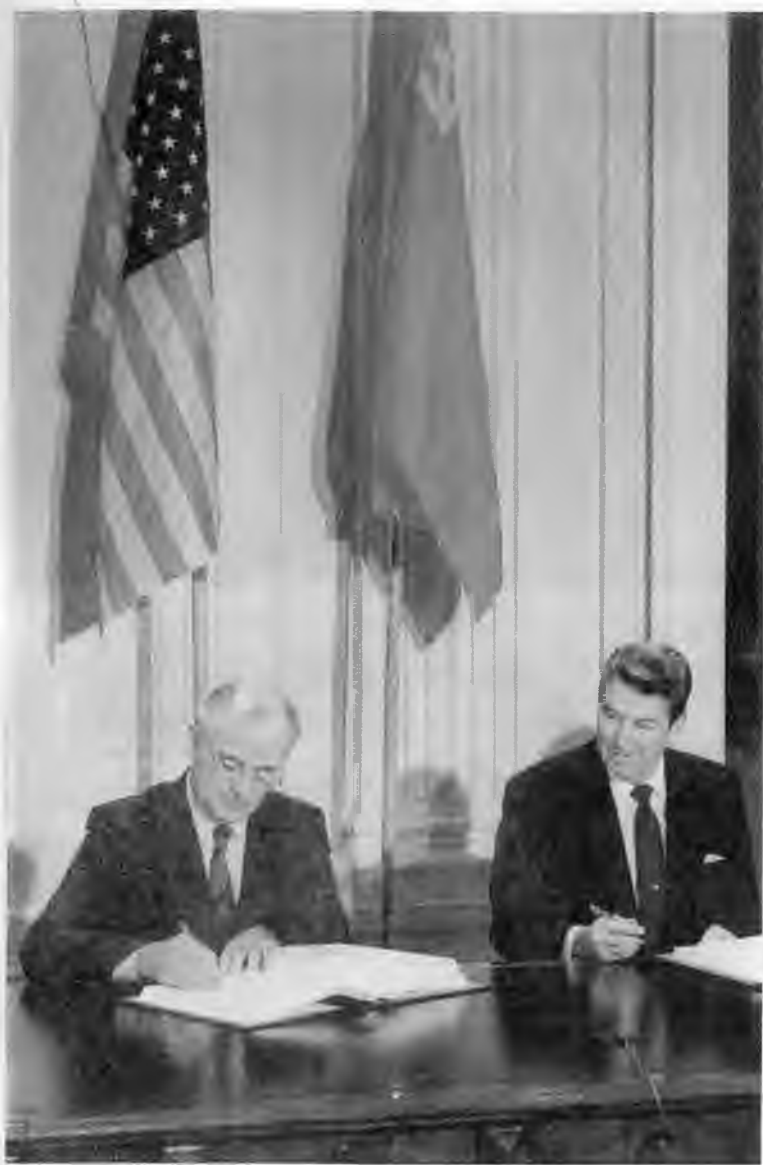
Подписание Договора между СССР и США о ликвидации ракет средней и меньшей дальности. Вашингтон. 8 декабря 1987 г.