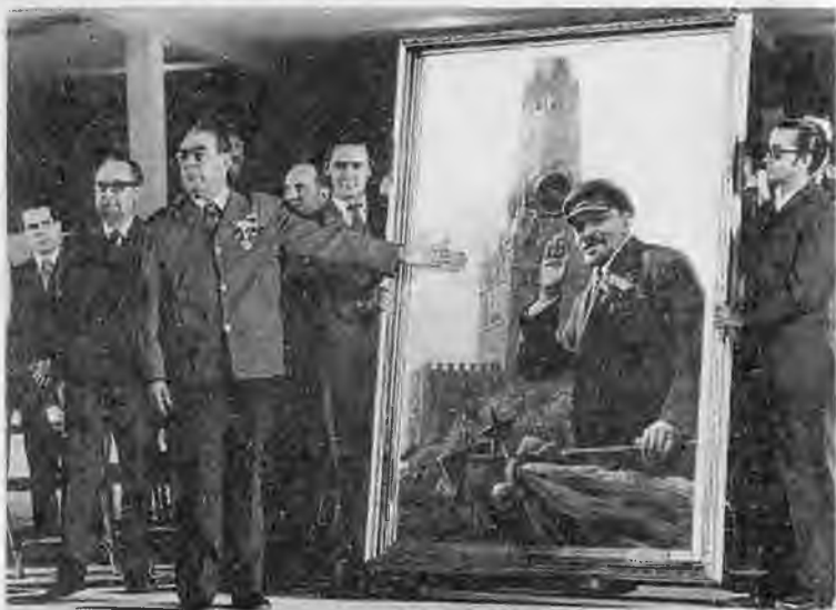
На приеме у президента Австрии Рудольфа Кириллегера во время переговоров с Джимми Картером о подписании ОСВ-2. Вена. 1979 г. Торжественное открытие школы имени Ленина на Кубе. 1974 г.