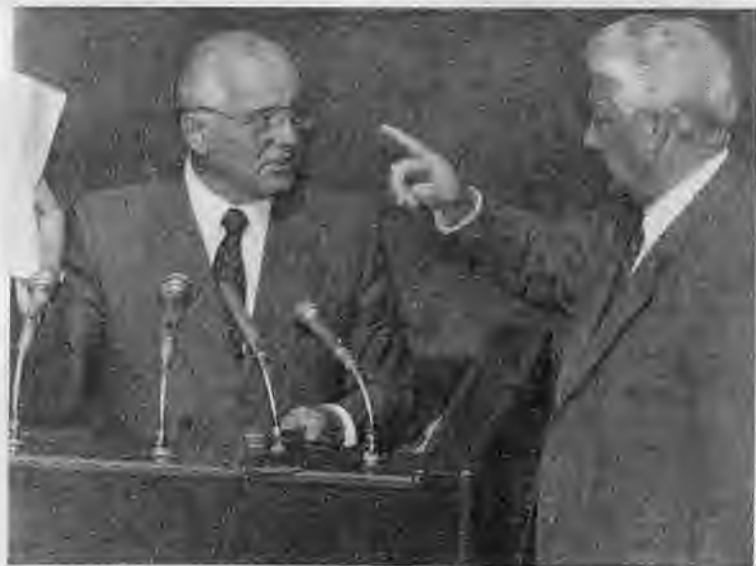
Возвращение из «форосского плена» 22 августа 1991 г.

На внеочередной сессии Верховного Совета РСФСР 23 августа 1991 г. До конца президентства Горбачева осталось четыре месяца