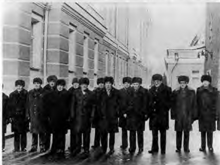
Последняя зарубежная поездка Брежнева. Встреча с председателем Христианско-социального союза Францем Йозефом Штраусом. Бонн. 1981 г.