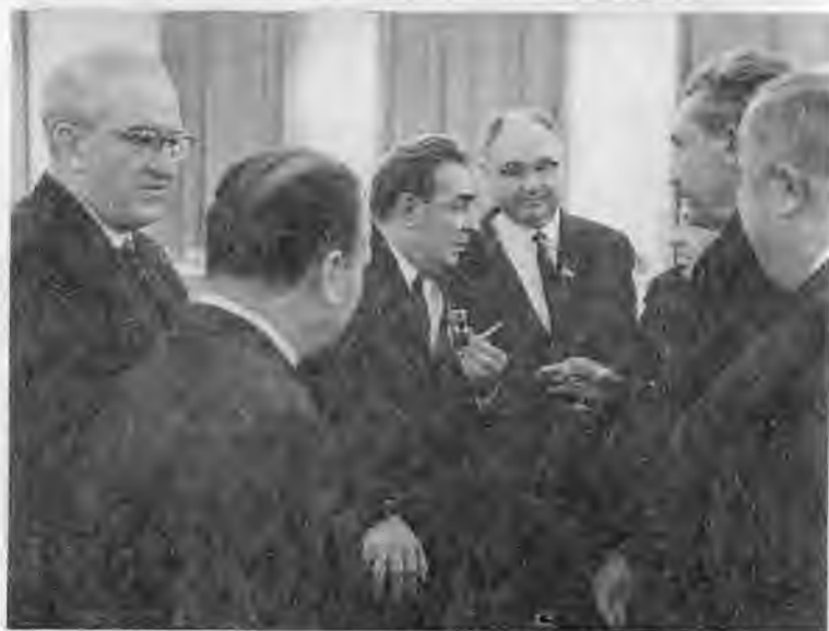
На сессии Верховного Совета СССР. Слева — Н.А.Тихонов. 1982 г. С Л.И.Брежневым. Пока на втором плане. Конец 70-х гг.