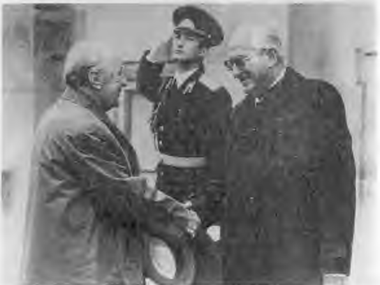
Беседа с президентом ДРВ Хо Ши Мином. 1963 г.