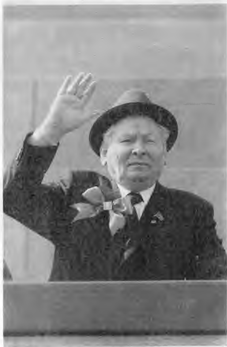
Во время праздничной демонстрации трудящихся 1 мая 1984 г.