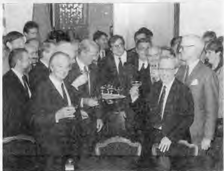
Посадка дерева дружбы с премьер-министром Японии Тосики Кайфу. Токио. 1991 г.