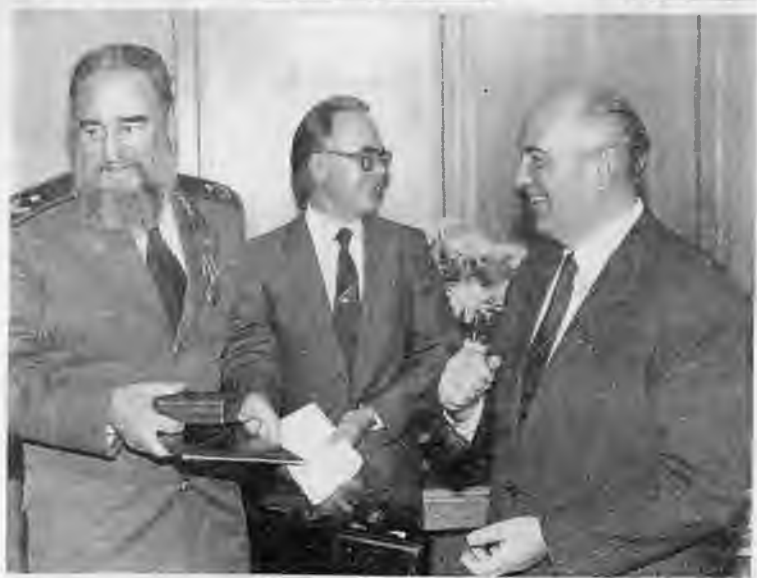
С президентом США Джорджем Бушем в Ново-Огареве. 1991 г. Вручение ордена Ленина Фиделю Кастро в Кремле. 1986 г.