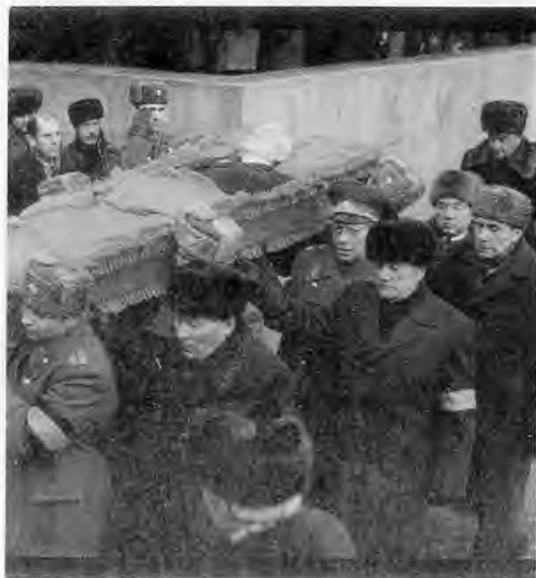
Похороны. 14 февраля 1984 г.