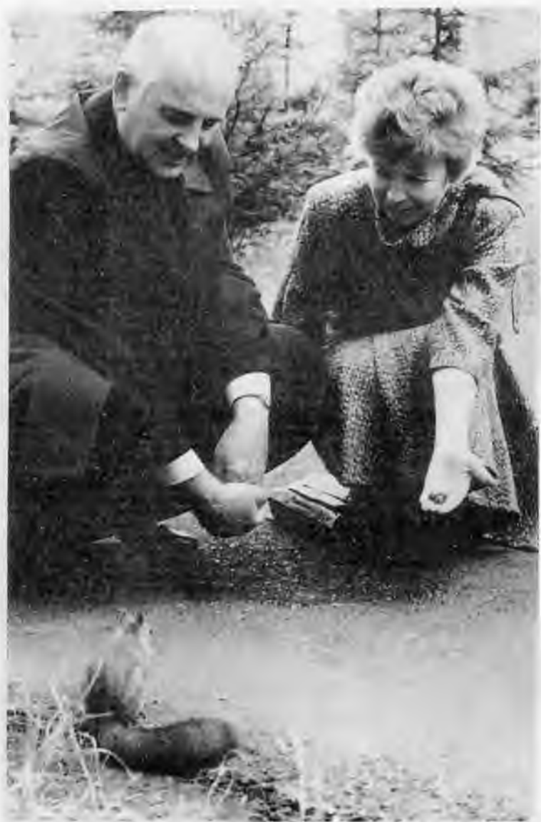
На берегу Енисея. 1986 г.