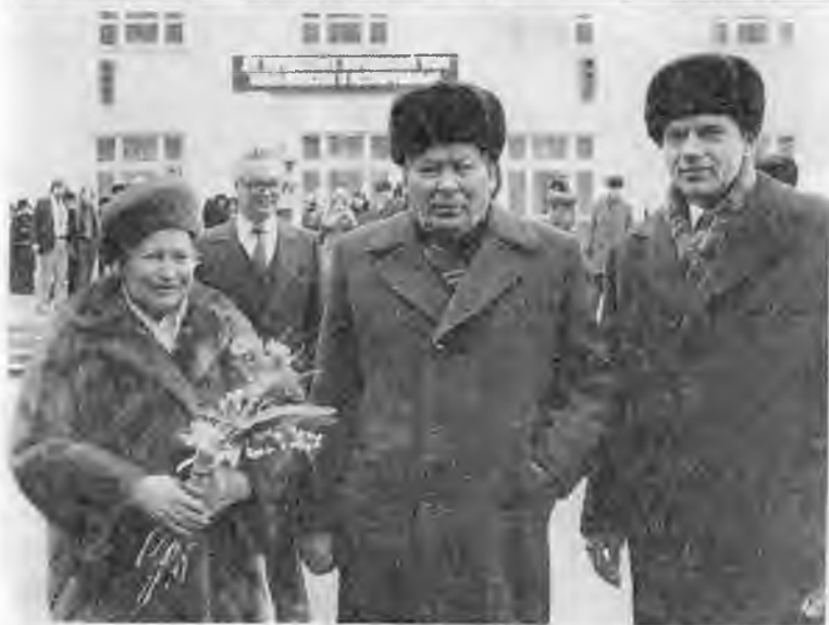
В одном президиуме с действующим генсеком и двумя будущими лидерами КПСС. Сессия Верховного Совета СССР. 1981 г.