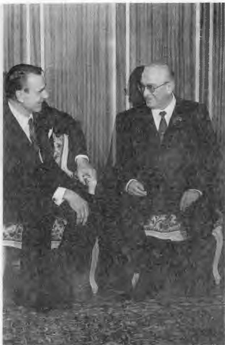
С Президентом Финляндской Республики Мауно Койвисто, Москва. 1983 г.