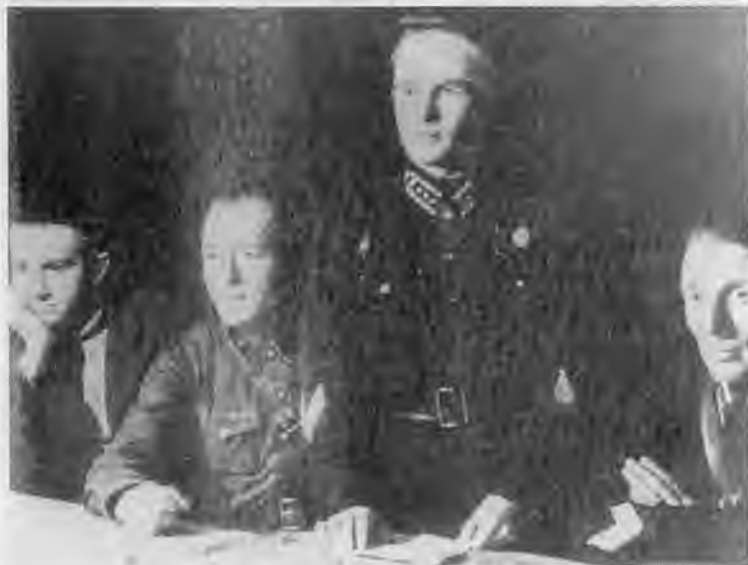
Ю.В.Андропов (в центре) — студент техникума водного транспорта. Рыбинск. 1936 г.