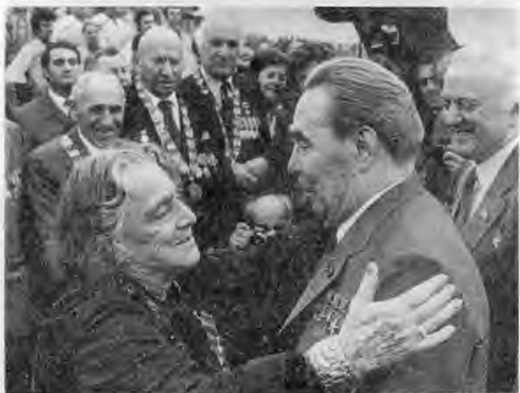
Открытие Игр XXII Олимпиады в Москве, 1980 г. «Дорогой гость». Прибытие в Тбилиси, 1981 г.