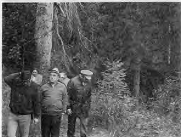
Прогулка по Черному морю На отдыхе в Кисловодске. 1976 г.