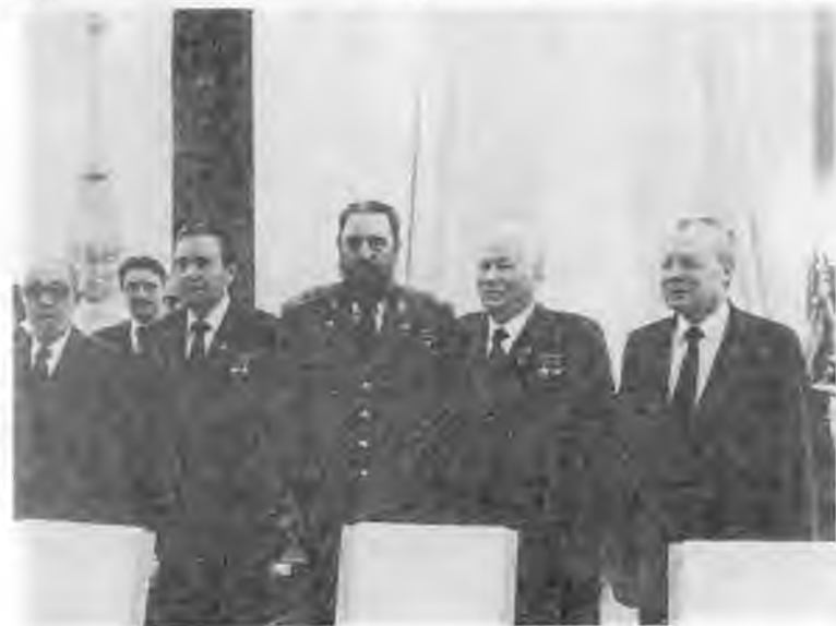
Переговоры с президентом Мадагаскара Дидье Рациракой. 1984 г. Во время встречи с Фиделем Кастро. 1984 г.