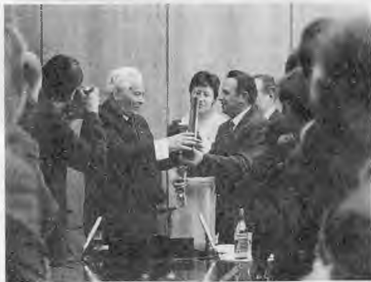
На заводе «Серп и молот»: беседа с рабочими; вручение сувенира. 1984 г.