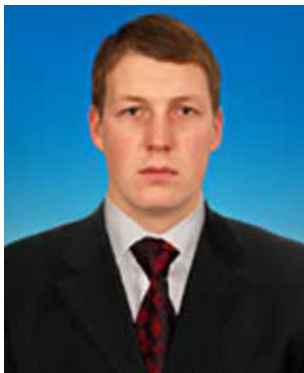
Депутат Государственной Думы РФ Роберт Шлегель

Ражан Мусаев: Сегодня вы уже депутат Госдумы, и вы всего на год старше нормативного возраста, установленного для депутатов. Получается, что вы самый молодой депутат в истории новейшей России. Испытываете ли в связи с этим какую-то особую ответственность?