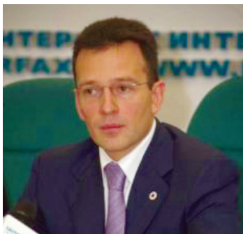
Руководитель Федерального агентства по делам молодежи Василий Якеменко