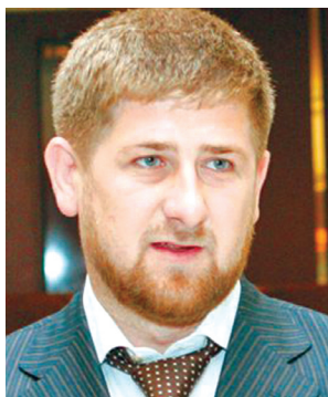
Президент Чеченской Республики Рамзан Кадыров

цветающим (конечно, не все идеально, но многое достойно высоких похвал). Интересно знать, кем вы себя считаете: представителем молодежи во взрослой политике или же вчерашним «молодежным политиком», сегодня ставшим матерым взрослым политиком?