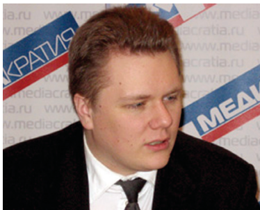
Политолог Алексей Чадаев

Р.М.: Понятно, что вы противник самого понятия «молодежная политика», но все же в нашей стране есть некая часть политики общей, которую принято называть именно так. В этой связи вопрос: а когда молодежная политика зародилась в нашей стране?