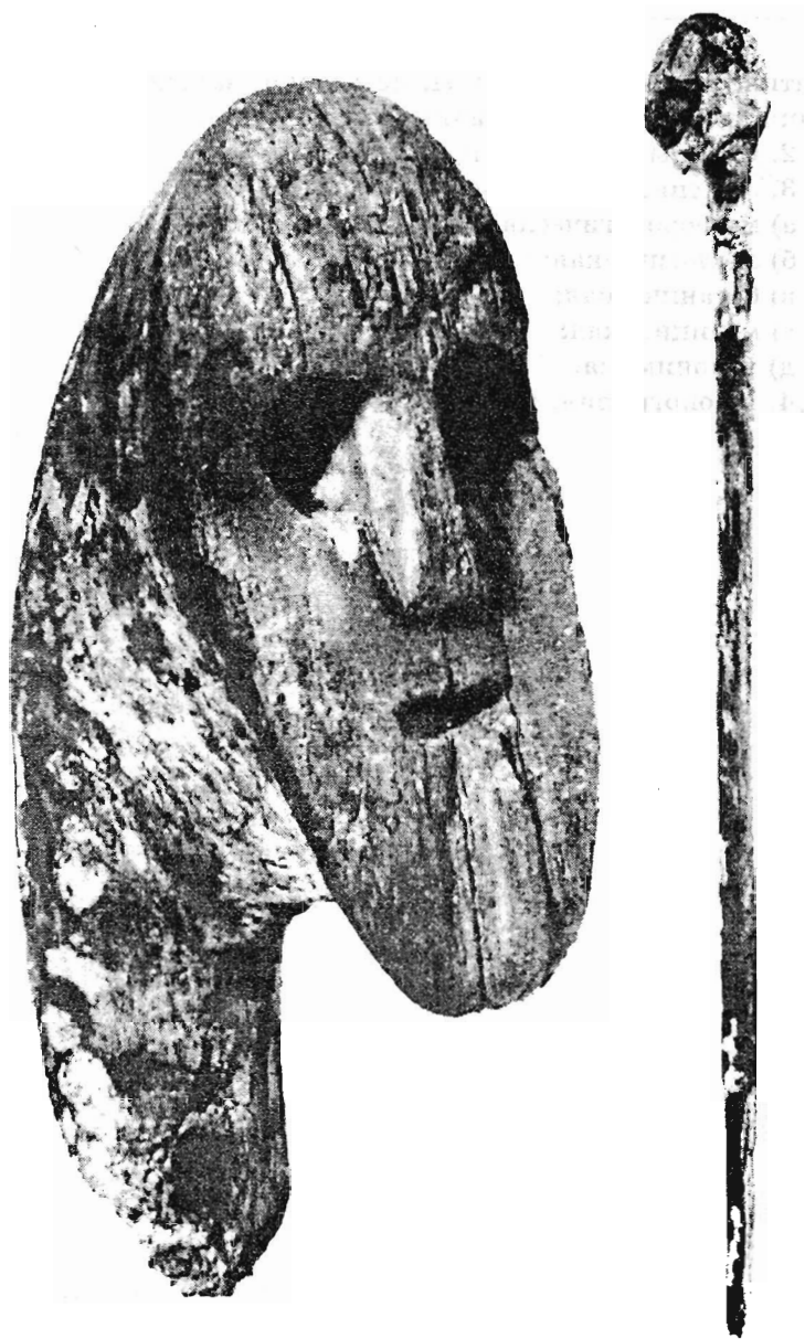
Ритуальный жезл и навершие ритуального жезла (?). Дерево. Новгород. Рубеж X-XI вв.