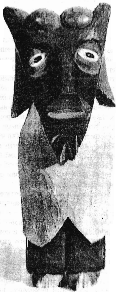
Лесной дьявол. Народная деревянная скульптура. Польша, Ленчицкое воеводство