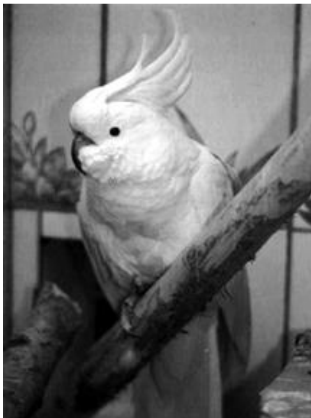
Большой желтохохлый какаду Мэтьюса.

Какаду, обитающих в Австралии, Индонезии, Новой Гвинее и на Филиппинских островах, насчитывается около 20 видов. От этих попугаев довольно трудно получить потомство в неволе, поэтому местные жители ловят птенцов какаду в их естественной среде обитания, приучают к искусственному корму, а затем продают морякам или торговцам птицами.