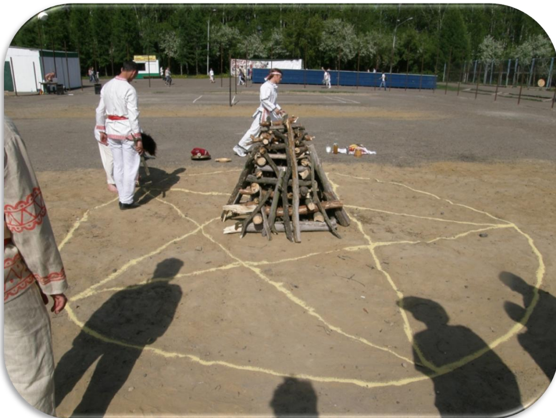
4. Владимир и жрецы готовят церемонию Ярилы Вешнего. Буревестник. 1 июня 2008 г.