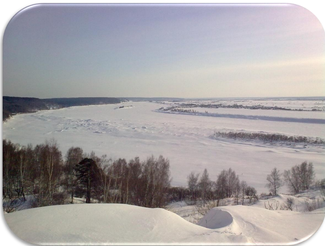
37. Природа Томска. Зима 2009-2010 гг.

сидит, отгородил пространство и щелкает время от времени "хлыстом", если кто-то в этом пространстве "не так" себя вести начинает из людей приехавших (обычные деревенские люди, две женщины, мужик и внук, верующие). Мы все на узкой тропинке-пяточке разойтись пытаемся, а он сидит - лишних сил не тратит, "медитирует", выжидает. Четко все, строго и по теме. Молодец!