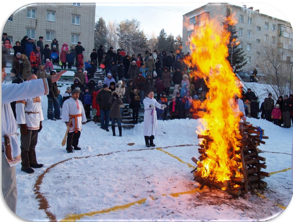
19. Огонь церемонии Коляды. Академгородок. 21 декабря 2008 г.