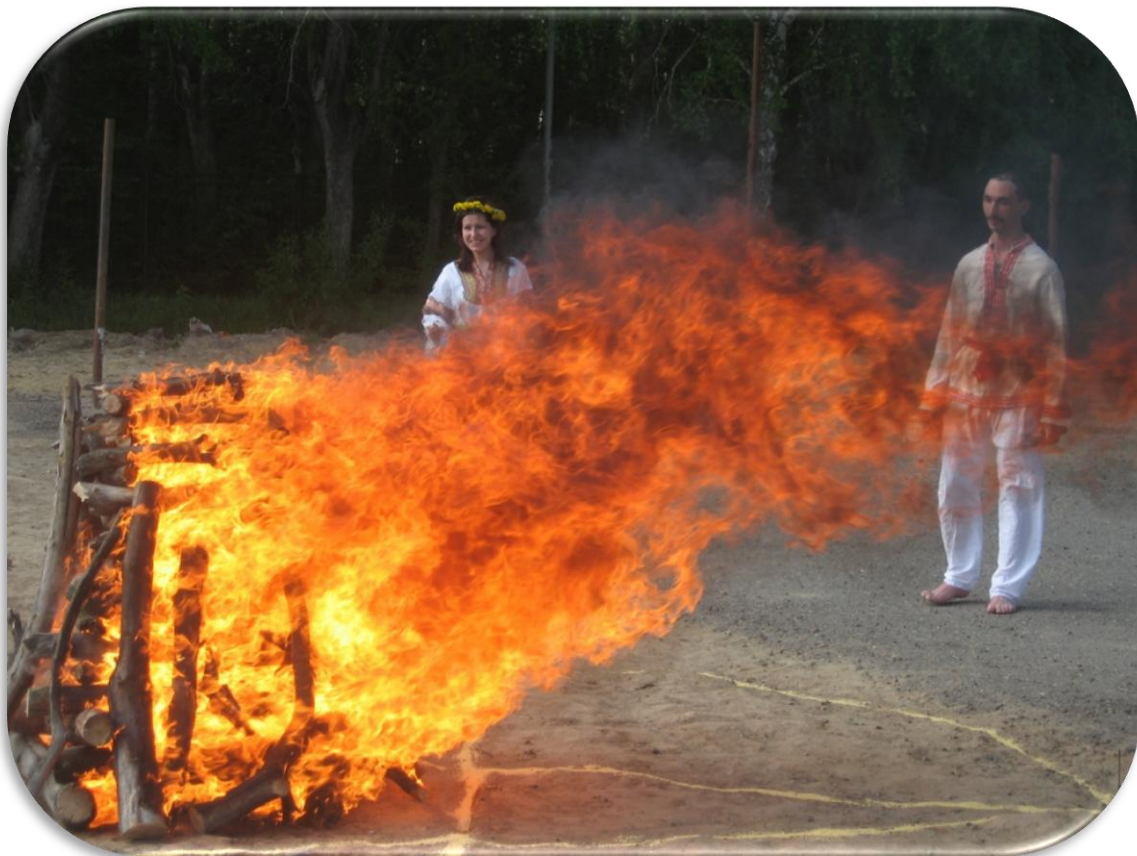
6. Огонь церемонии Ярилы Вешнего. Буревестник. 1 июня 2008 г.