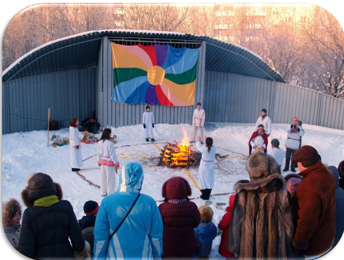
20. Огненная церемония Коляды и зрители. Академгородок. 21 декабря 2008 г.