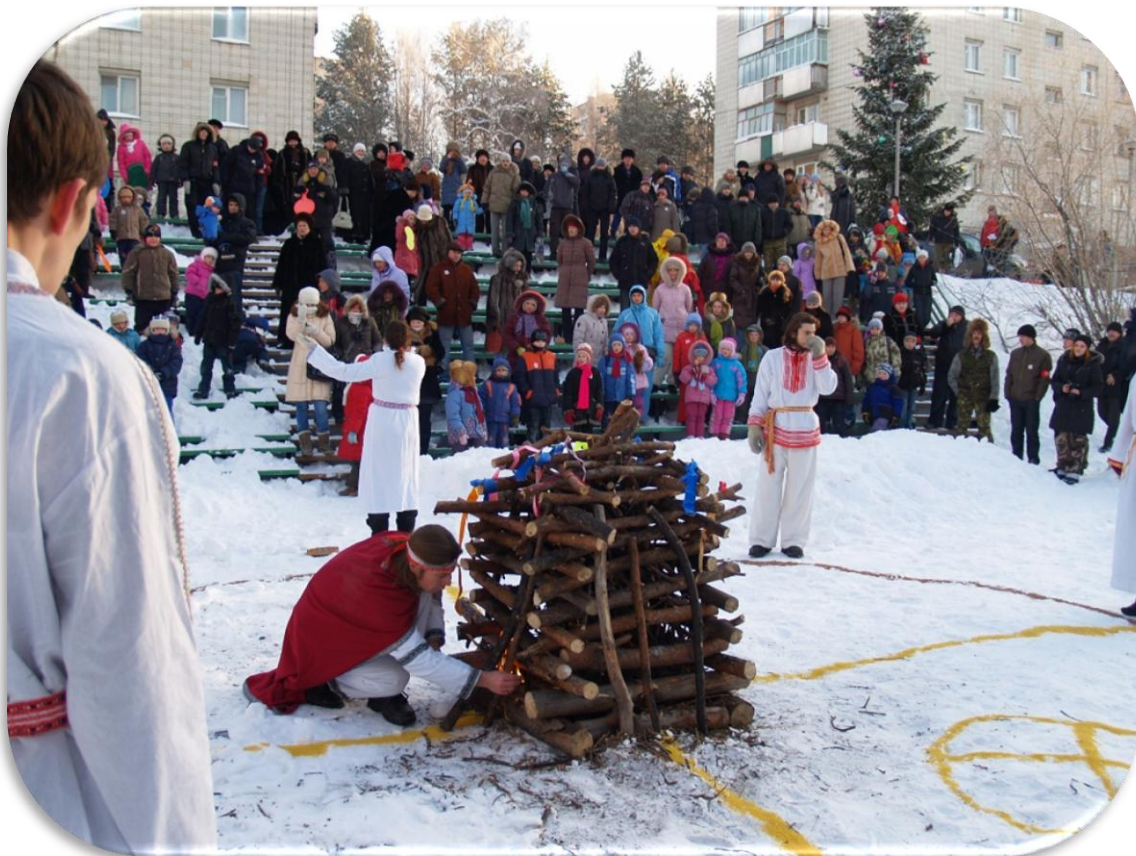
18. Возжигание огня церемонии Коляды. Академгородок. 21 декабря 2008 г.