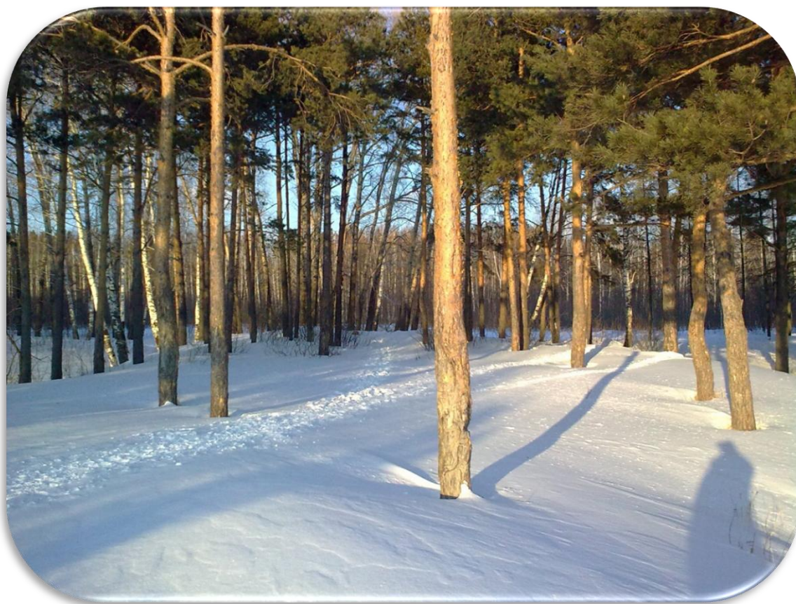
38. Природа Томска. Зима 2009-2010 гг.