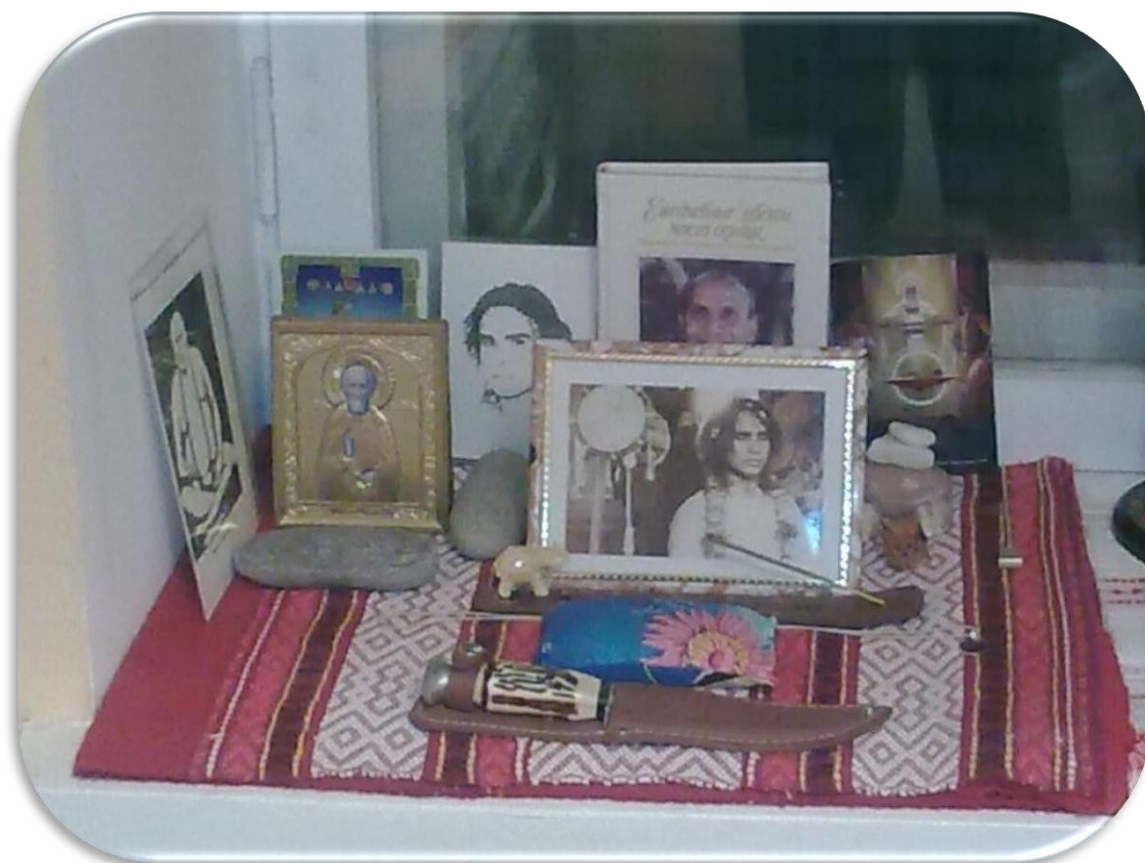
34. Мой алтарь на кухонном подоконнике. Зима 2009-2010 гг.

Дело совсем серьезный оборот принимает, вижу. Само не пройдет и никто не поможет, ночь уже, звонить никому нельзя, буду сам, будь, что будет. Кое-как приготовил себе постель на полу (нагибаться уже не мог), не смог помыть за собой посуду (а я никогда не оставляю на ночь в своей комнате-кухне грязной посуды), затянул какой-то тряпкой обруч вокруг головы (боль частично перешла в тошноту), открыл свой алтарь, поставил перед Бабаджи свечку круглую, еле смог лечь, положил на аджну сердоликовый талисман-свастику и лежу, не двигаясь, поскольку любое движение причиняет сильную боль голове. И я понял, или я сейчас прорвусь, или завтра уже не встану похоже, самим собой так точно.