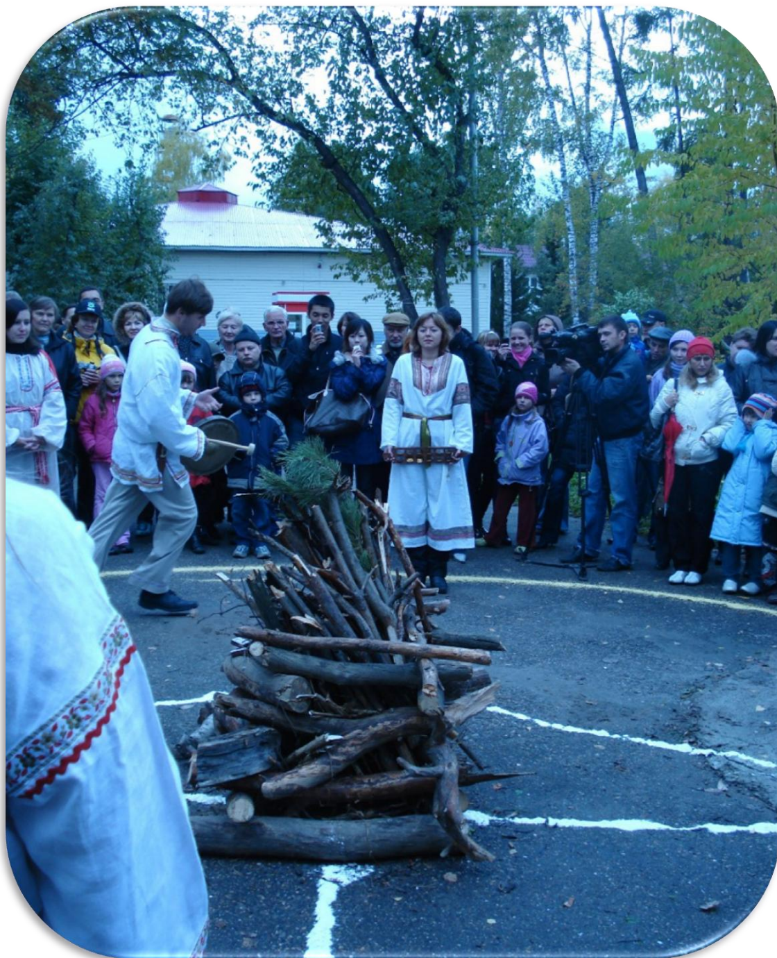
14. Начало церемонии Световиту. Горсад. 20 сентября 2008 г.