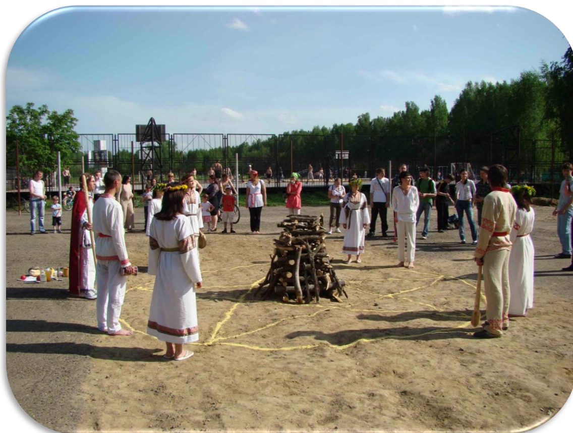
5. Начало церемонии Ярилы Вешнего. Буревестник. 1 июня 2008 г.