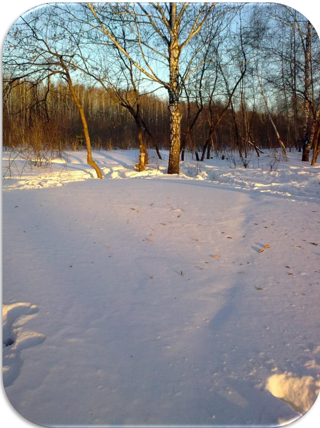
36. Природа Томска. Зима 2009-2010 гг.

совершать лишних движений, не произносить лишних слов, даже на некоторое время закрывал глаза. Я осознавал происходящее со мной, что это не есть хорошо, но, что тут поделаешь, надо было просто пережить. Думаю, то, как я выглядел, сильно контрастировало с тем, как люди привыкли меня видеть.