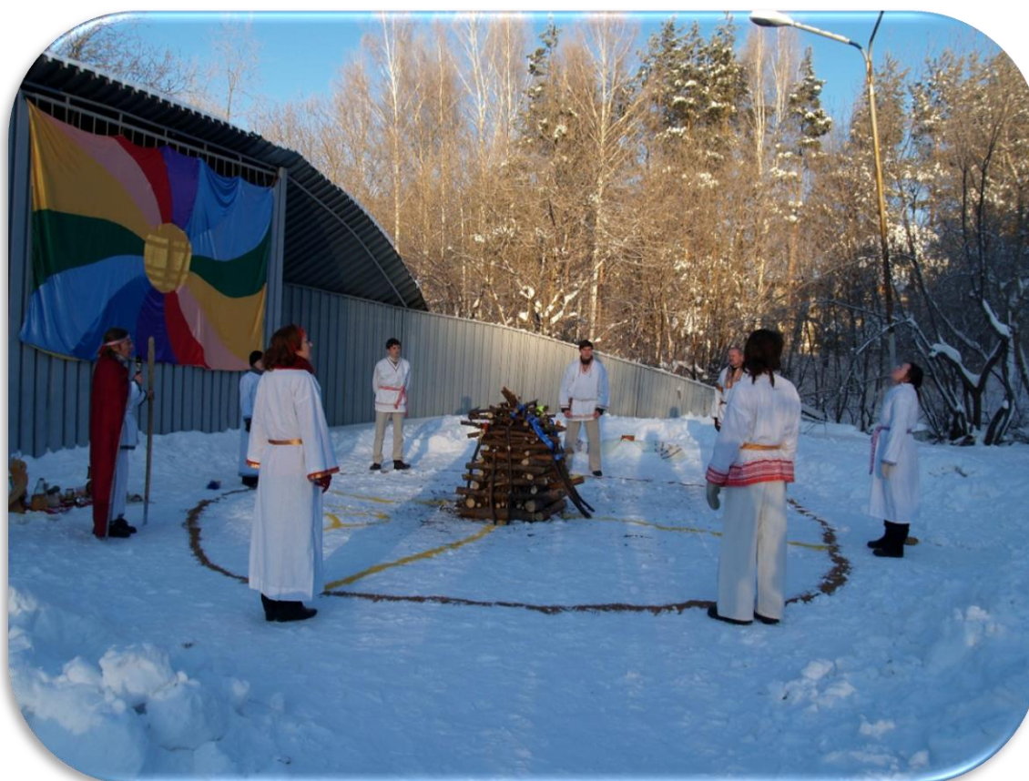
17. Начало церемонии Коляды. Академгородок. 21 декабря 2008 г.