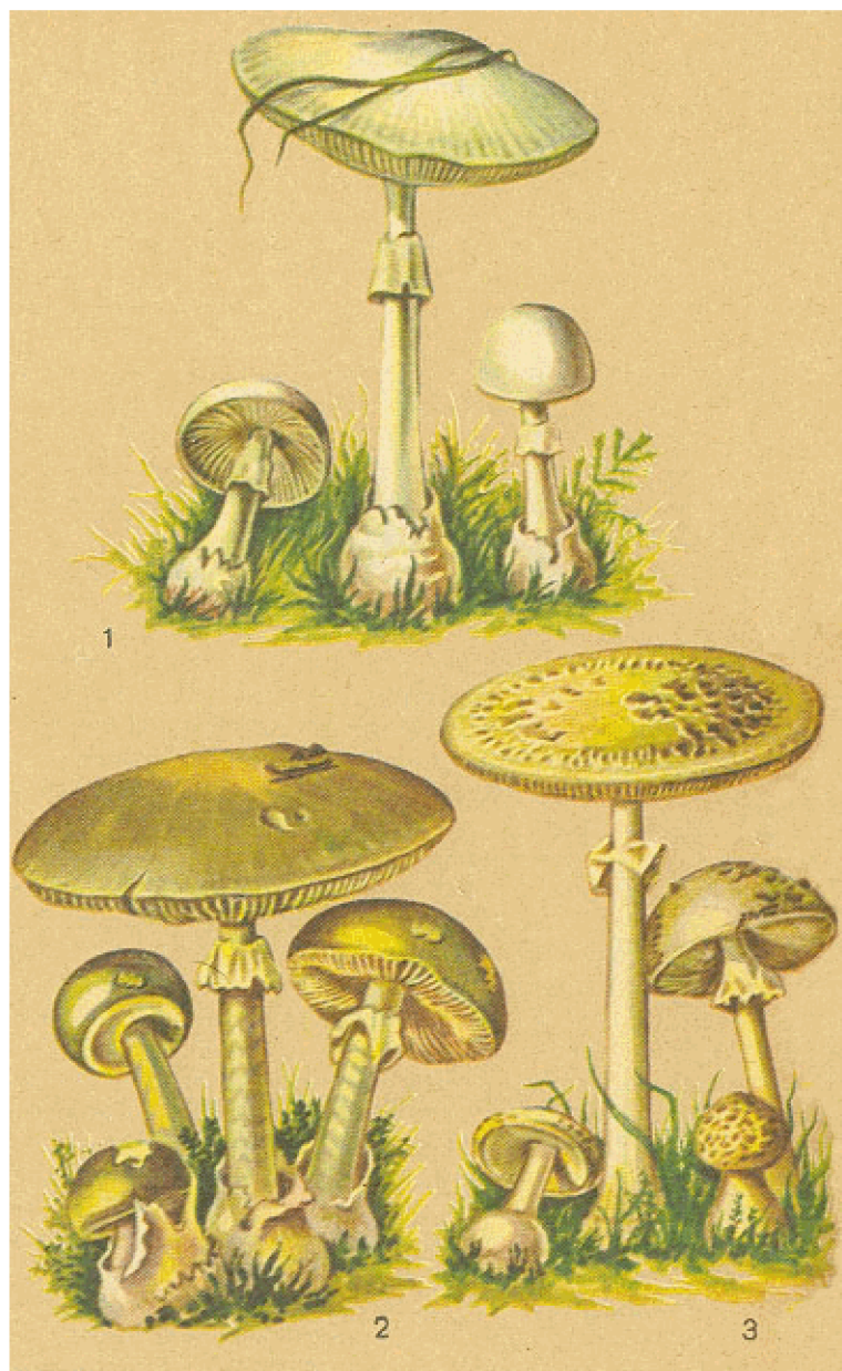
1. Поганка белая. 2. Поганка зеленая. 3. Поганка желтая

Еще в 1891 г. предпринимались экспериментальные исследования бледной поганки. Немецкий токсиколог Р. Коберт обнаружил, что водные и солевые вытяжки из нее обладают сильным гемолитическим действием. Яд разрушал красные кровяные шарики многих животных даже в очень маленьких концентрациях (при разведении 1 : 125 в расчете на сухое вещество). Коберт вначале ошибся, решив, что имеет дело с одним ядом, который он назвал фаллином. Он установил, что фаллин распадается при нагревании и теряет активность в присутствии слабых кислот и ферментов. Однако яд бледной поганки был стоек и сохранялся при длительном кипячении. Его не уничтожало ни высушивание (окисление кислородом воздуха), ни спирт, ни уксус.