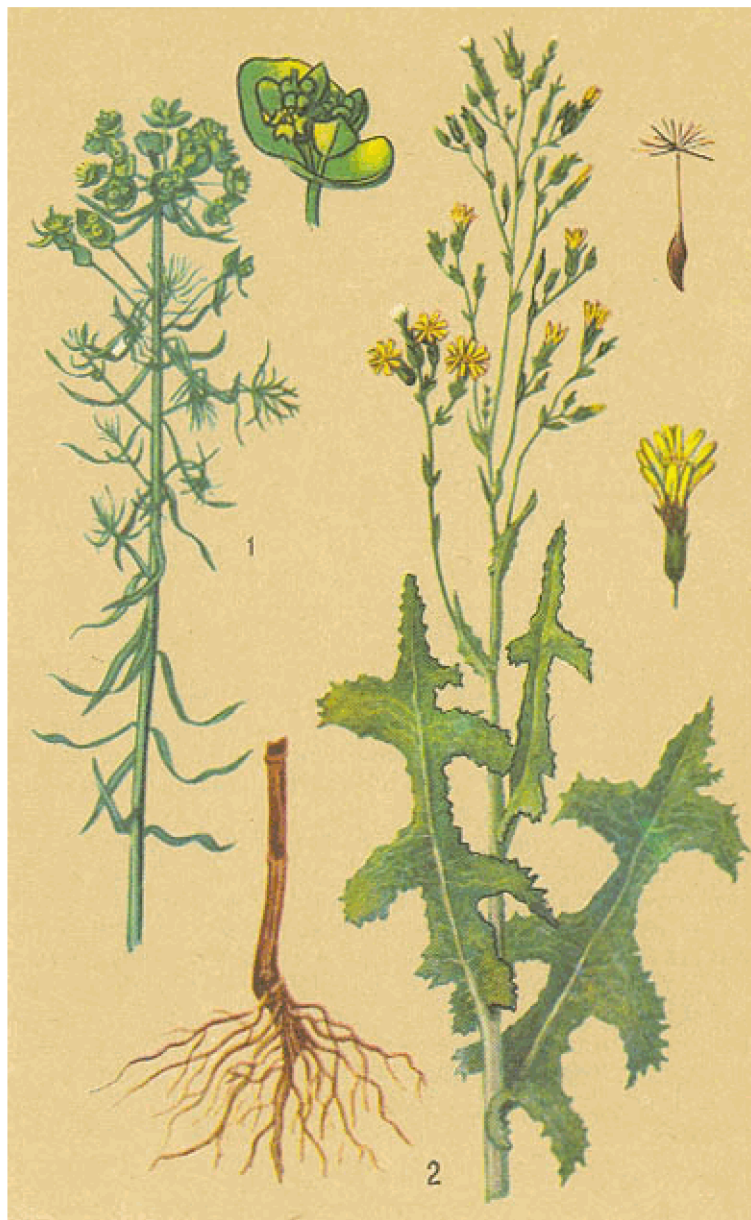
1. Молочай кипарисный. 2. Латук степной

Молочаи в отличие от молоконов принадлежат к другому семейству — Молочайных. О некоторых из них — кротоне, клещевине, маниоке, тунге, канделябровом молочае — уже шла речь в предыдущих разделах книги. Те из молочаев, которые встречаются в нашей стране, называли когда-то «бесовым молоком». Все представители молочайных ядовиты, причем по разнообразию ядовитых веществ в млечном соке они занимают первое место среди представителей других растительных семейств. В их соке содержатся алкалоиды, сапонины, ядовитые смолы, жирные кислоты, углеводороды и камфара, а также гликозиды, токсины и горькие экстрактивные вещества.