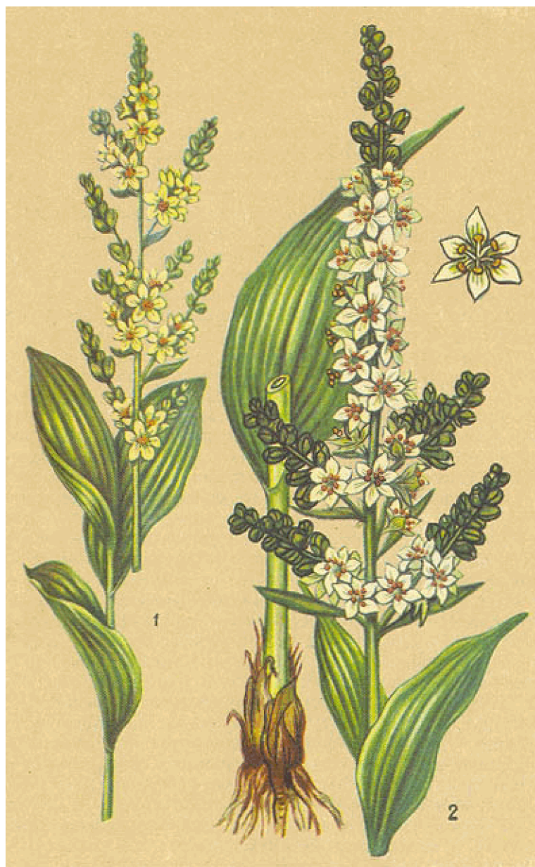
1. Чемерица Лобеля. 2. Чемерица белая

В ветеринарии отвары чемериц применяют как рвотное (для свиней и собак), как средство, облегчающее пищеварение у крупного рогатого скота при переполнении кормами рубца (одного из отделов желудка), и наружно — для борьбы с кожными паразитами.