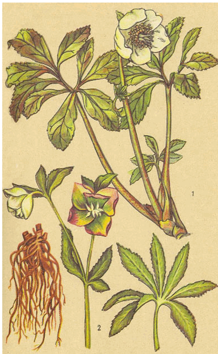
1. Морозник кавказский. 2. Морозник черный

Известно несколько видов морозника: морозник зеленый ( H. viridis ), морозник вонючий ( H. foetidus ) и морозник Кавказский ( H. caucasicus ). Официальной медициной приняты морозник черный и кавказский.