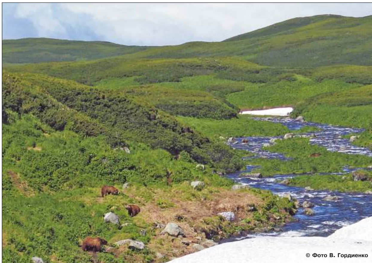
Рис. 18. Медведи на нерестилище, июль