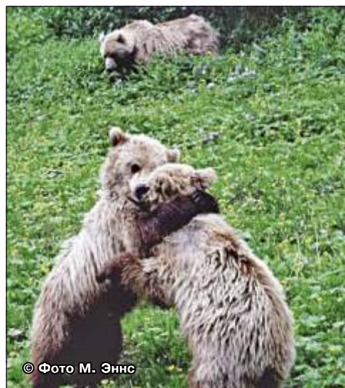
Рис. 34. Медвежата-сеголетки очень часто могут увлечься игрой и подойти близко, но медведица всегда где-то рядом. Южная Камчатка

Чаще всего человек случайно оказывается между матерью и медвежатами. Камчатские медведицы – очень заботливые матери и защи-