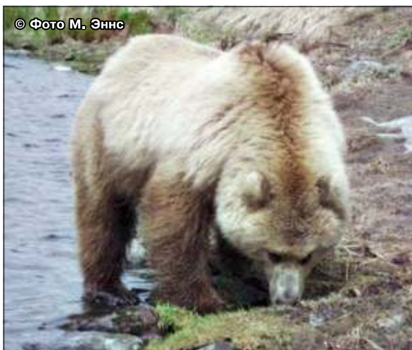
Рис. 21, 22. У бурых медведей – крупный нос и прекрасное обоняние, мощная мускулатура шеи, плечевого пояса и хорошо выраженная холка

– мощную мускулатуру шеи, плечевого пояса и высокую холку (чтобы копать) (рис. 22),