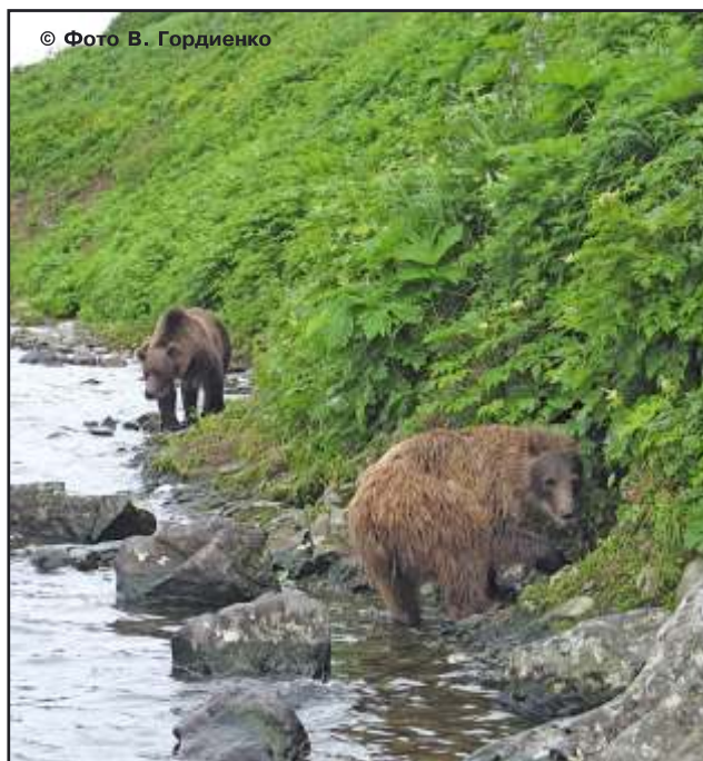
Рис. 53, 54. На заднем плане – самец 5–6 лет, на переднем – медвежонок – лончак. Самец опустил голову – один из признаков готовности к агрессивным действиям. Медвежонок уступил дорогу более сильному животному

имеет опыт общения с людьми. Такое поведение медведей характерно для заповедных территорий, где у медведей нет доступа к человеческой пище, нет ассоциаций «человек – источник пищи», нет охоты на медведя (т. е. у медведей нет страха как результата преследования человеком). Но вам все-таки лучше медленно, без резких движений уйти в сторону от предполагаемой траектории перемещения животного, держа его в поле зрения, но не разглядывая в упор, изображая какое-либо всецело поглотившее вас занятие (к примеру, поедание ягод).