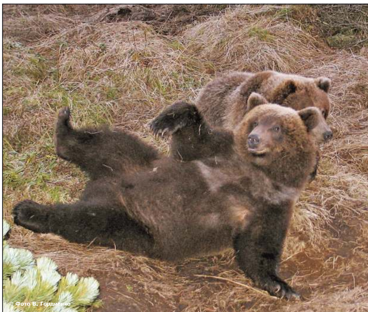
Рис. 46. Это поза полного комфорта