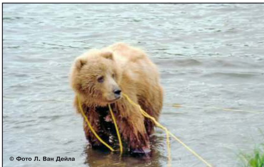
Рис. 44. Молодые медведи часто попадают в неприятные истории. Аляска

Но именно эти любопытные звери, если получают существенный урок отрицательных впечатлений (сирена, сигнальная ракета, выстрел и удар резиновой пулей, электрический забор и т. д.), одновременно получают отрицательный опыт – опыт избегания человека. Положительный опыт, т. е. подкрепление вторжения человеческой пищей, приведет к развитию и быстрому закреплению опасных для человека форм поведения.