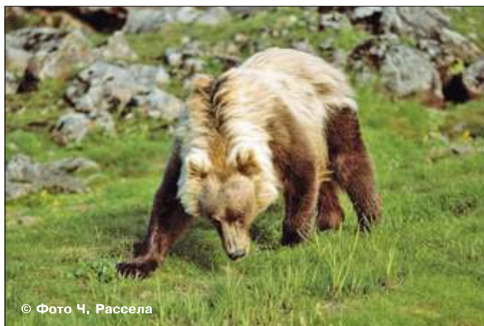
Рис. 7. Самец медведя очень красивого окраса