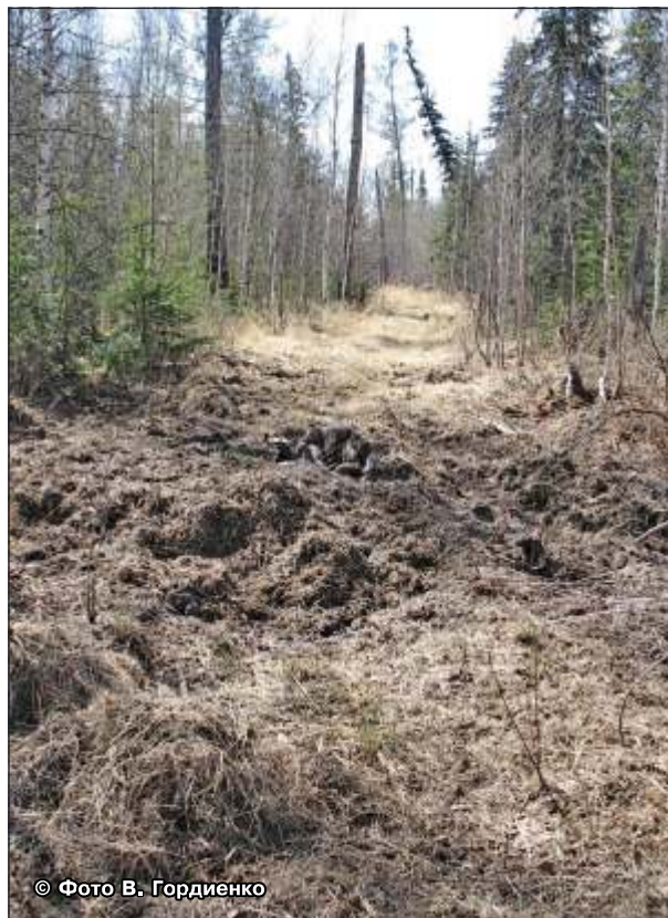
Рис. 35–36. Куча земли на лесной дороге – присыпанные медведем останки убитого им лося, сверху кучи лежат обглоданные фрагменты скелета, слева у кустов череп. Медведь находился в 50 м от добычи и был отогнан собакой. Середина мая, Мильковский район