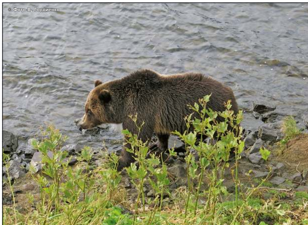
Рис. 61. Когда расстояние между вами станет, по мнению медведя, безопасным, а путь – свободным, он спокойно пройдет мимо

Если вы встретились с медведем на узкой тропе, и он явно не собирается уходить, уступите дорогу медведю. Зверь, принимающий решение что делать, останавливается, опускает голову, принохивается, водит ушами, может начать медленное движение в вашу сторону. Возможно, он хочет подтвердить свой социальный статус или просто пройти мимо. Спокойно, без резких движений, медленно отходите в сторону от тропы (лучше вверх по склону), держа зверя в поле зрения, избегая смотреть ему в глаза, разговаривая с ним низким голосом. Когда расстояние между вами станет, по мнению медведя, безопасным, а путь – свободным, он спокойно пройдет мимо (рис. 61).