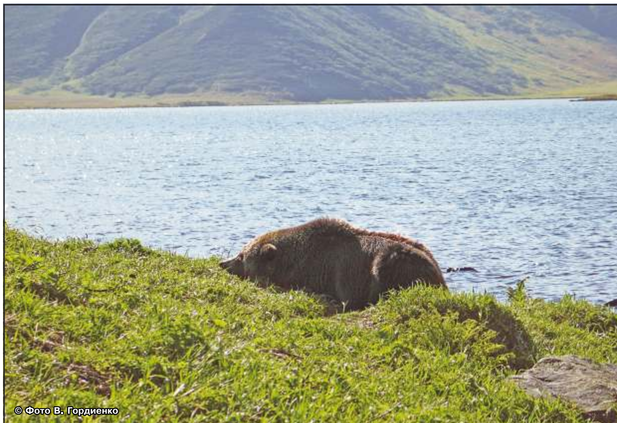
Рис. 42. Медведь спит на берегу нерестового озера, начало сентября