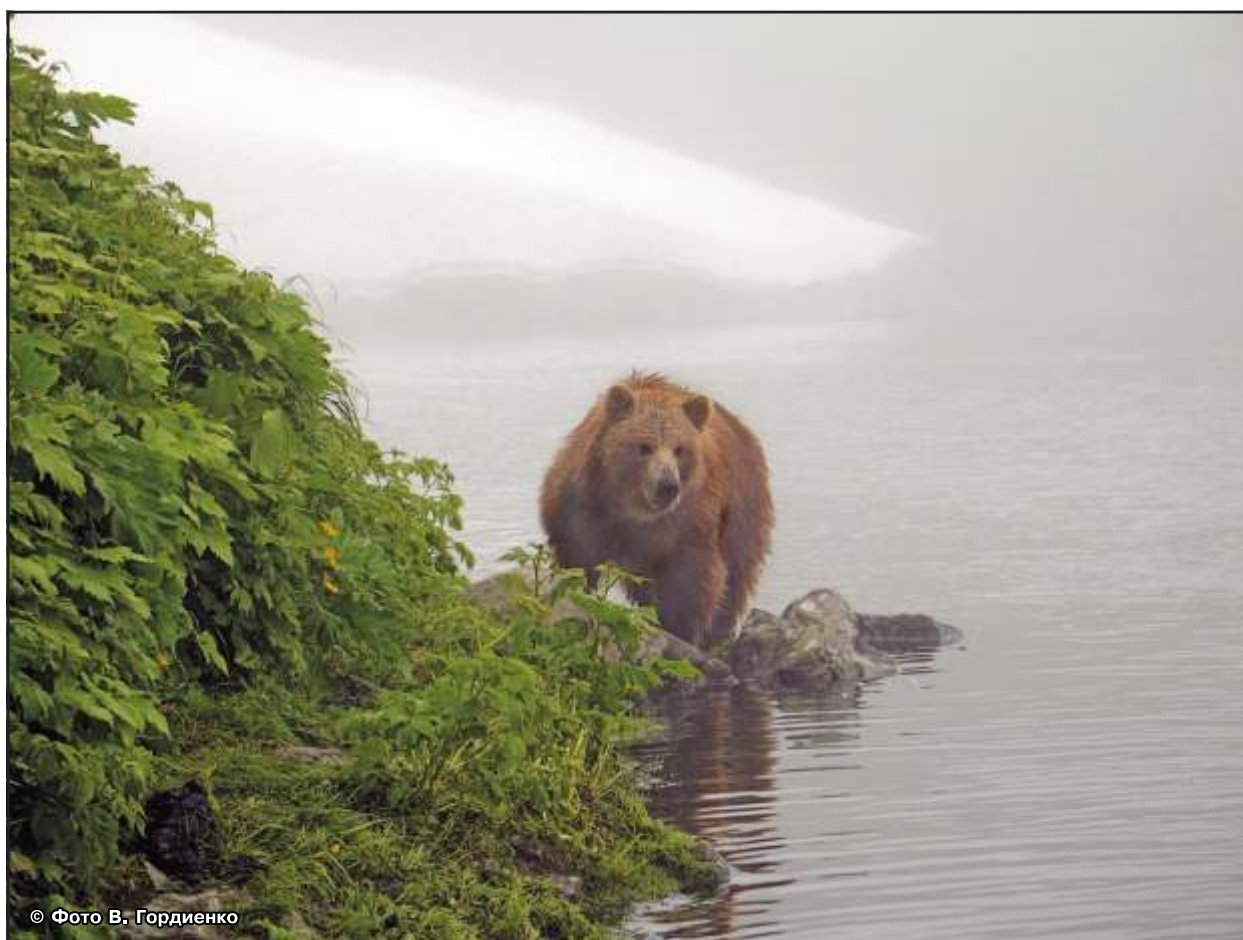
Рис. 43. Встреча на медвежьей тропе на берегу нерестового озера, июль