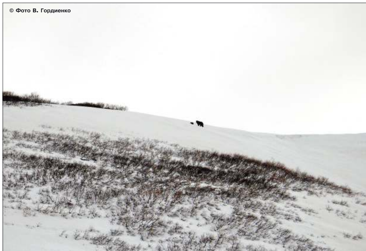
Рис. 13. Медведица с сеголетком, белое безмолвие, начало июня

Весна – голодный период в жизни медведей. Растительности еще нет, а возможности найти белковую пищу крайне ограничены (рис. 13). Одни медведи выходят на первые проталины на склоны сопок и участки приморских равнин в поисках корней растений, мышевидных, сусликов и сурков, перезимовавшей ягоды (шикши и брусники), прошлогодних орехов кедрового стланика. Другие приходят на морской берег в поисках выбросов моря, охотятся на морских млекопитающих, разоряют птичьи колонии. Третьи (это медведи Центральной Камчатки, севера Корякии) довольно успешно охотятся на стельных и поэтому малоподвижных самок и на новорожденный молодняк северных оленей и лосей. Медведи поедают падаль (тех же копытных, своих собратьев и т. д.) в любой степени разложения, собирают со дна водоемов останки отнерестившихся прошлогодних лососей.