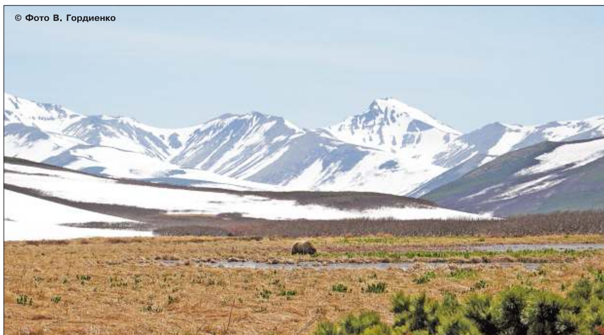
Рис. 14. Бурый медведь на первой зелени, середина июня, Южная Камчатка

Снег постепенно тает, обнажаются борта и дно речных долин, появляется первая зелень. Самые первые растения, которые начинают вегетацию и становятся пищей для бурых медведей – это разные виды хвощей, осок, вейников и герань волосистоцветковая. Медведи появляются на этих оттаявших участках и начинают пастьбу на первой зелени (рис. 14).