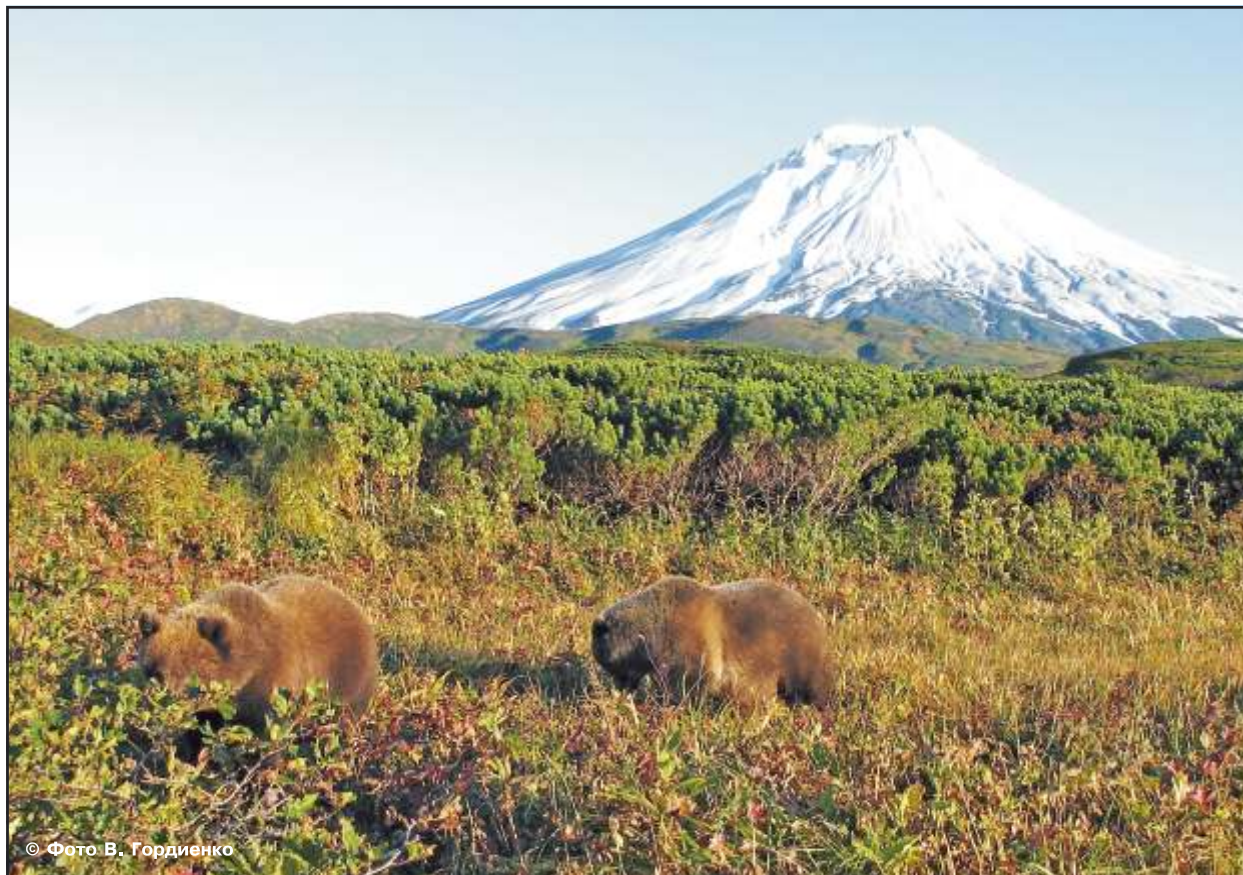
Рис. 1. На Камчатке обитает крупная и естественная популяция бурых медведей. Южно-Камчатский заказник, конец августа

• Полуостров Камчатка – один из последних оставшихся уголков на нашей планете, где обитает крупная естественная популяция бурого медведя (рис. 1).