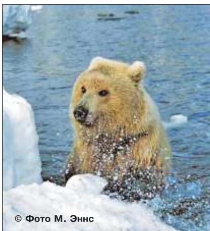
Рис. 6. Медведица песочного окраса