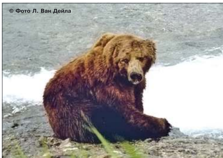
Рис. 19. Очень старый самец бурого медведя, Аляска, США

Эта особенность биологии медведя очень важна для существования медвежьего сообщества и вида в целом. Как уже отмечалось, бурые медведи живут долго (рис. 19).