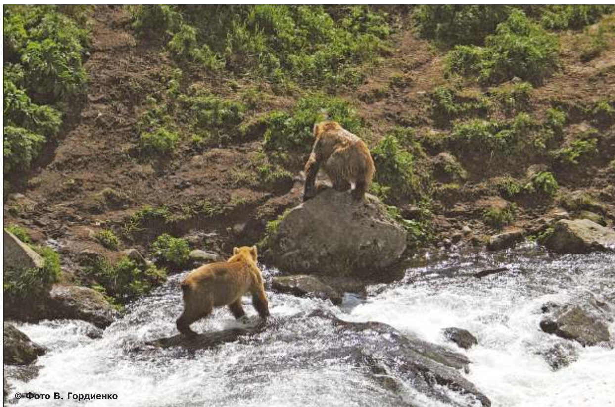
Рис. 20. Старый медведь с рыбой (вверху на камне) покидает место рыбалки, а молодой (слева внизу) тут же занимает его рыболовное место

То, что мать-медведица учит медвежат основам рыбалки, всем известно. А вот пример «считывания» чужого опыта. Так, на реке Камбальной в Южно-Камчатском заказнике при появлении первой нерестящейся нерки старый, но еще в прекрасной физической форме самец тратил на вылов лосося в известном ему на перекате месте не более 10 минут. В это же время другие самцы 4–6 лет не могли поймать рыбу на том же перекате по часу и более. Пока старик неторопливо ел нерку в кустах в 30–50 м от переката, одни молодые медведи подбирали остатки его трапезы, другие, наблюдавшие за действиями старика, пытались «рыбачить» на его месте. Интересно отметить тот факт, что уровень «социального напряжения» в ожидающем первую нерку медвежьем сообществе реки Камбальной был так велик, что старый зверь во избежание конфликтов с голодной молодежью уходил поедать рыбу в заросли стлаников (рис. 20).