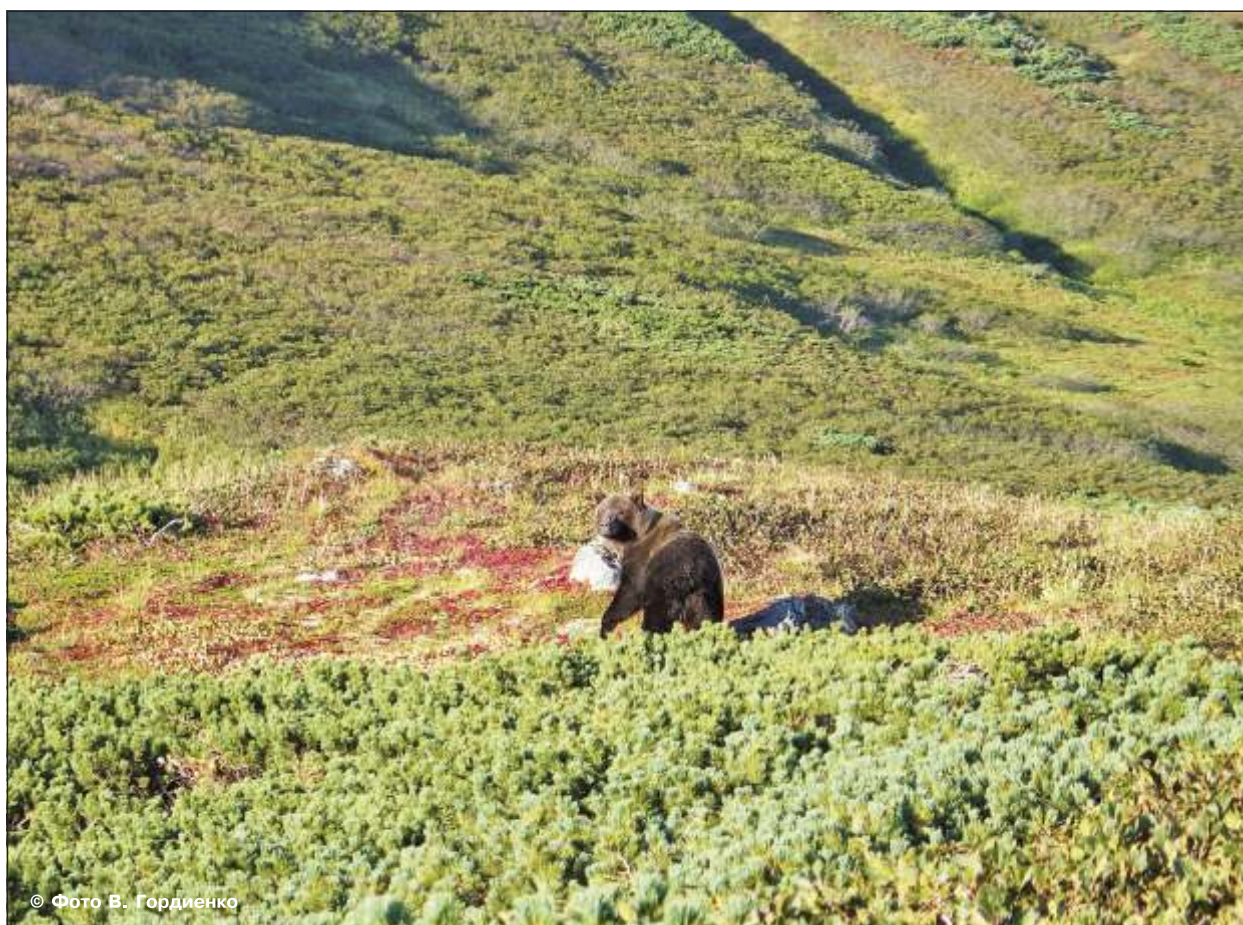
Рис. 2. Каменноберезовые леса с куртинами кедрового стланика – лучшие места обитания бурого медведя на Камчатке