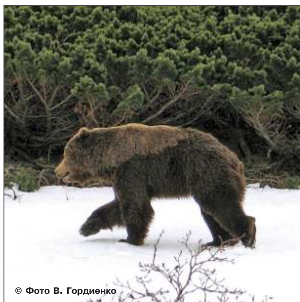
Рис. 37–40. Эти фотографии демонстрируют последовательность нападения самца медведя на человека. Слева сверху медведь услышал приближение человека и стал выходить из зарослей, в которых осталась медведица. Справа сверху он еще двигается медленно и оценивает ситуацию. Слева внизу – нападение (медведь двигается галопом и смотрит человеку в глаза). Справа внизу – клячая челюстями, пуская пену, медведь медленно возвращается назад к медведице. Атака была остановлена в 10 м от человека выстрелом из карабина над головой зверя. Южная Камчатка

не боятся. У них выработались определенные стереотипы поведения, отклонение от которых приводят к стрессу. Чрезмерное напряжение «мыслей» для быстрого решения сложной задачи, такой, как встреча «нос к носу» с опасностью в виде человека, может привести к мгновенному нервному срыву, срыв – к нападению как способу защиты, затем, как правило, к убеганию. На все эти действия у медведя может уйти несколько секунд.