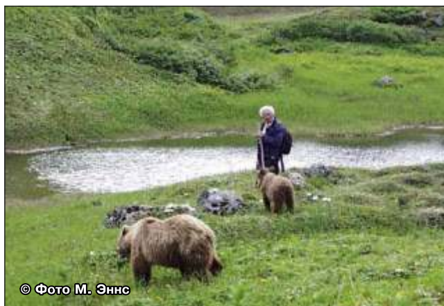
Рис. 33. Медведица-резидент Бранди с лончаком, август

Экспериментальная научно-исследовательская программа изучения возможностей мирного сосуществования человека и медведя, со строгими правилами поведения, но только человека на территории медведей, выполнялась в 1996–2003 гг. в федеральном заказнике «Южно-Камчатский», в районе озера Камбального. Кроме осиротевших медвежат, возвращаемых в дикую природу по специальной методике, одним из основных объектов исследований была крупная медведица-резидент Бранди. Бранди относилась к человеку с большой терпимостью, не проявляя агрессии или интереса; за время исследований у нее было три выводка медвежат, и медведица позволяла своим любопытным медвежатам подходить к человеку очень близко (рис. 33). Подрастая и взрослея, медвежата также терпимо и нейтрально относились к человеку.