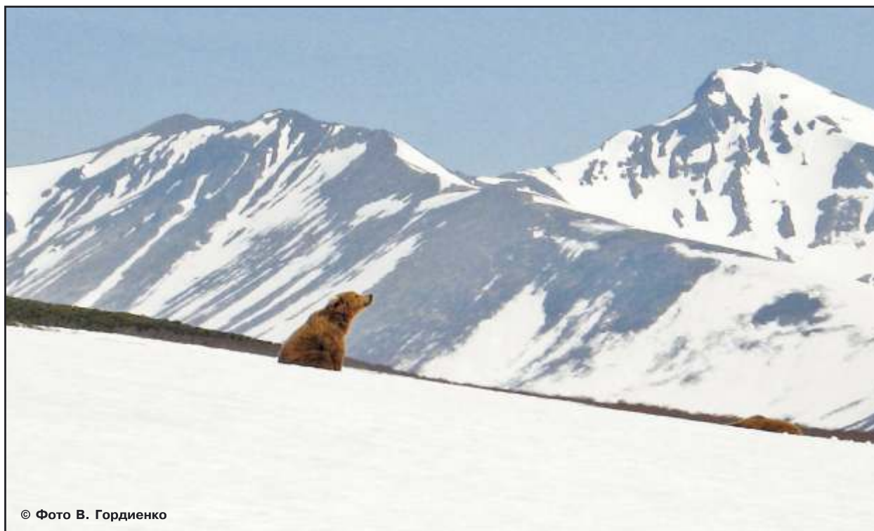
Рис. 45. Медведям ничто прекрасное не чуждо?