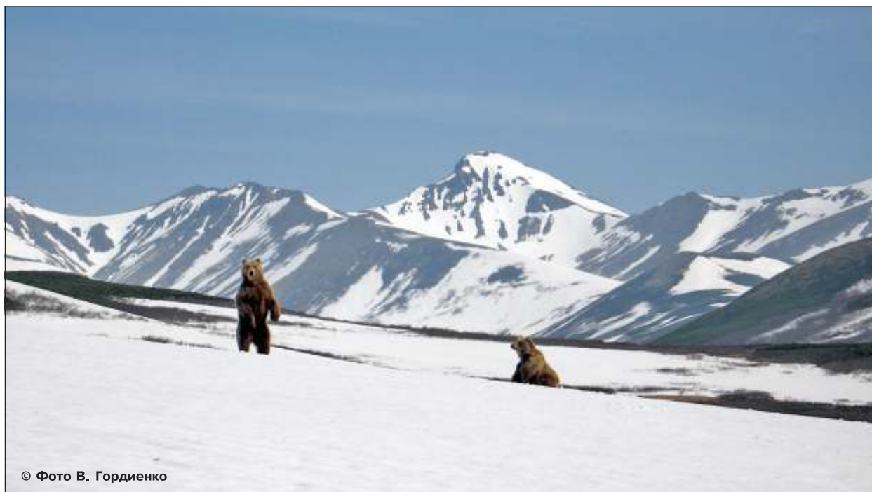
Рис. 10. Брачная пара (самец стоит на задних лапах), середина июня

лизм. Самка, потерявшая весной медвежат (в том числе в результате нападения самца), опять принимает участие в гоне.