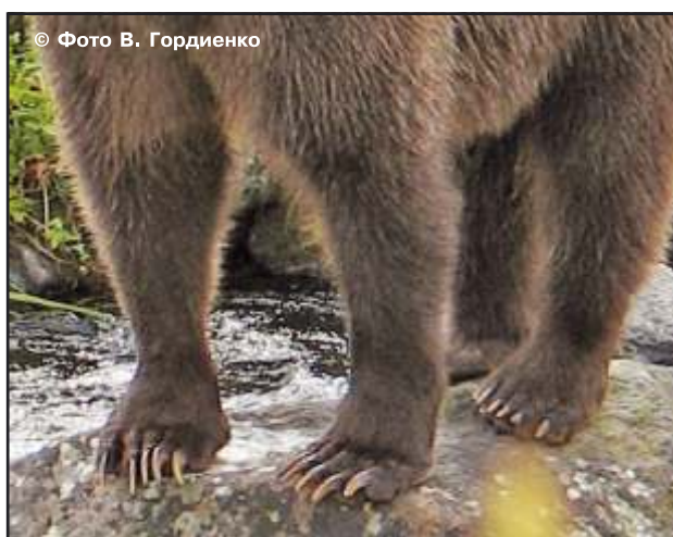
Рис. 8, 9. Когти бурых медведей

• Половой зрелости медведи достигают на пятый-шестой год жизни. Самыми продуктивными являются звери в возрастном диапазоне от 5–6 до 12 лет. На Камчатке была помечена радиоошейником 18-летняя медведица с двумя медвежатами.