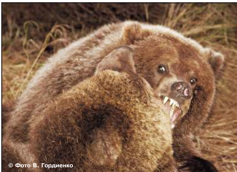
Рис. 58, 59. Игры медвежат-лончаков, рычание «пасть в пасть»

том она проявляется в суровой реальности (рис. 58, 59). Медведица, защищая медвежат, в случае сильного стресса может броситься даже на уже убегающего врага.