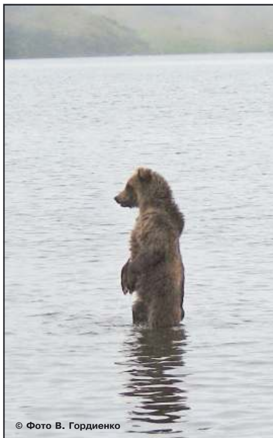
Рис. 47. Медведица услышала приближение другого зверя