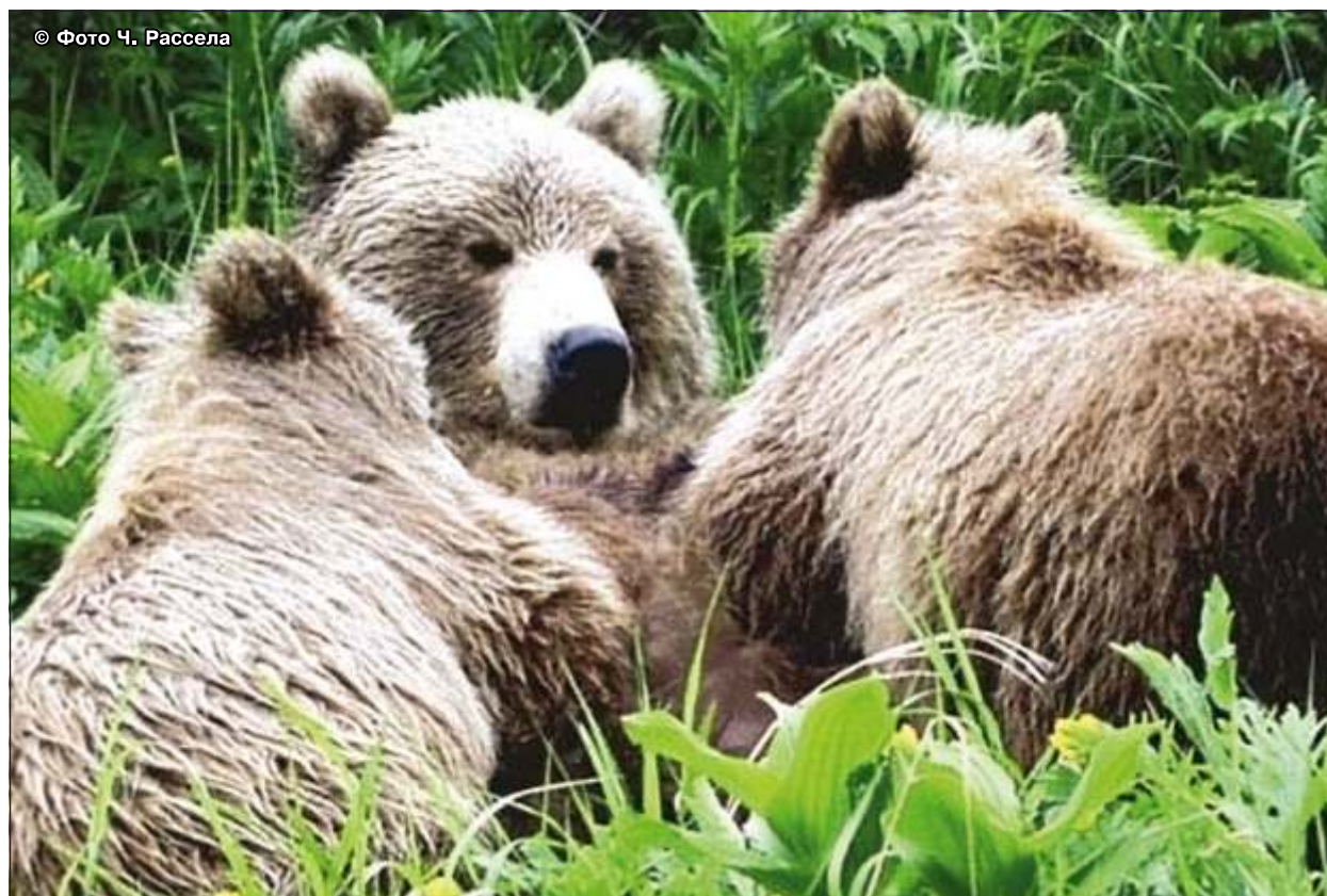
Рис. 24. Медведица и новорожденные медвежата. Музей медведя «Ноборибетси», Хоккайдо, Япония