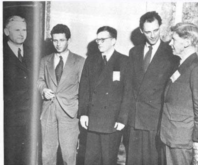
В 1949 г. под давлением Сталина Шостакович приехал в Нью-Йорк на Культурную и научную конференцию за мир во всем мире. У него сохранились очень неприятные воспоминания о путешествии, особенно о назойливости американских репортеров. Слева направо: официальный глава советской делегации писатель Александр Фадеев, Норман Мейлер, Шостакович, Артур Миллер, доктор Уильям Олаф Стэплдон из Англии.