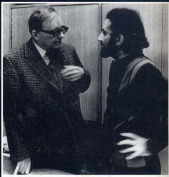
Dmitri Shostakovich and Solomon Volkov, Moscow 1974.

This seemingly endless surge of interest can be attributed, at least in part, to Testimony , the powerful memoirs the ailing composer dictated to the young Russian musicologist Solomon Volkov. When Testimony was first published in the West in 1979, it became an international bestseller, received the coveted ASCAP-Deems Taylor Award for excellence in writing about music, and was called "the book of the year" by The Times of London. More recently, the authoritative New Grove Dictionary stated, " Testimony changed the perception of Shostakovich's life and work dramatically, and influenced innumerable performances of his music." The Guardian proclaimed Testimony to be the "most influential music book of the 20th century." And Vladimir Ashkenazy in his new foreword to this 25th anniversary edition writes, "Shostakovich sublimated his personal experience to the level of universality. For that, we should be eternally grateful to him. And Testimony helped countless Western music lovers to re-evaluate Shostakovich's message. For this, we should be grateful to Solomon Volkov."