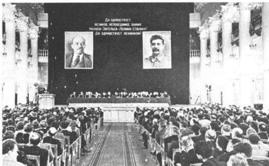
Съезд единогласно осудил «формалистов»: Шостаковича, Прокофьева, Хачатуряна и других ведущих композиторов.

Я очень часто вспоминаю Мейерхольда, чаще, чем можно было бы предположить. Ведь мы теперь своего рода соседи. Я регулярно прохожу или проезжаю мимо мемориальной доски, на которой изображен какой-то отвратительный монстр, и содрогаюсь. Гравированная надпись гласит: «В этом доме жил Мейерхольд». Надо бы добавить: «...и была зверски убита его жена».