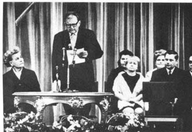
Шостакович зачитывает одну из своих бесчисленных официальных речей. Слева – Екатерина Фурцева, в то время министр культуры Советского Союза.

Соломону Волкову в память о «НОСЕ» – Геннадий Рождественский 16.10.75