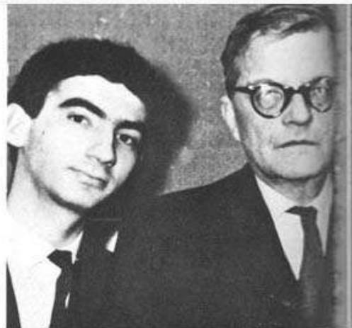
С Соломоном Волковым. Ленинград, 1965 г.