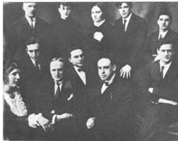
Восемнадцатилетний Шостакович (стоит вторым слева) среди других учащихся своего преподавателя по фортепиано в Ленинградской консерватории, Леонида Николаева (сидит четвертым слева). Ленинград, 1924 г. Обратите внимание еще на две важные персоны: пианистов Марию Юдину (стоит третьей слева) и Владимира Софроницкого (сидит первым справа).