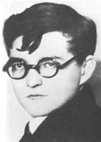
Молодой Шостакович: «Мне нравилось, когда со мной обращаются уважительно».