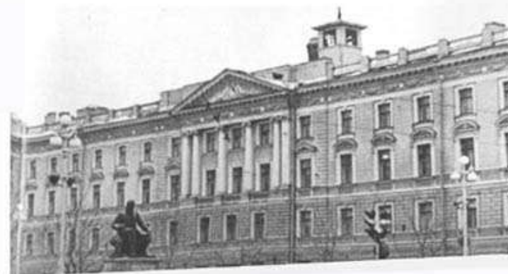
Ленинградская консерватория. Старейшее и самое престижное музыкальное учебное заведение России. Перед фасадом — памятник Н. А. Римскому-Корсакову.