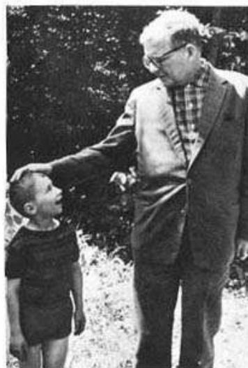
На своей даче под Москвой с внуком.

На репетиции оперы «Нос», воскрешенной в Советском Союзе после сорокачетырехлетнего забвения: смена линии партии. Справа налево: Шостакович, дирижер постановки Геннадий Рождественский, Соломон Волков. Посвящение гласит: «Соломону Волкову в память о «Носе» – Геннадий Рождественский. 16.10.75»