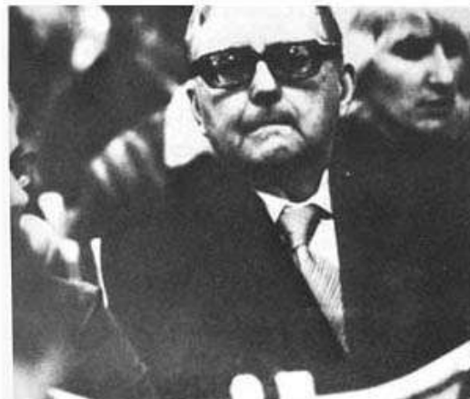
На представлении своего последнего квартета. Ленинград, 1974 г.

Начав работать над этой книгой, Шостакович подарил Волкову партитуру своей тринадцатой симфонии («Бабий Яр») с посвящением: «Дорогому Соломону Моисеевичу Волкову с наилучшими пожеланиями. Д. Шостакович. 3 V 1975. Репино»