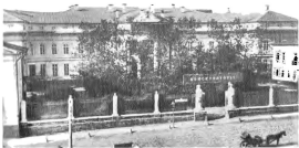
Московская консерватория Вид здания до перестройки