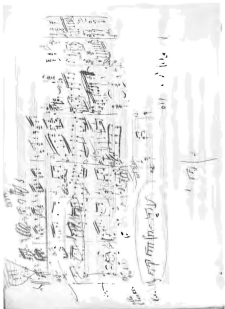
Страница первой симфонии c-moll Автограф С. Н. Танеева