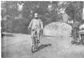
С. Н. Танеев на велосипеде в Селенге. фотографии конца 19-го тысяч