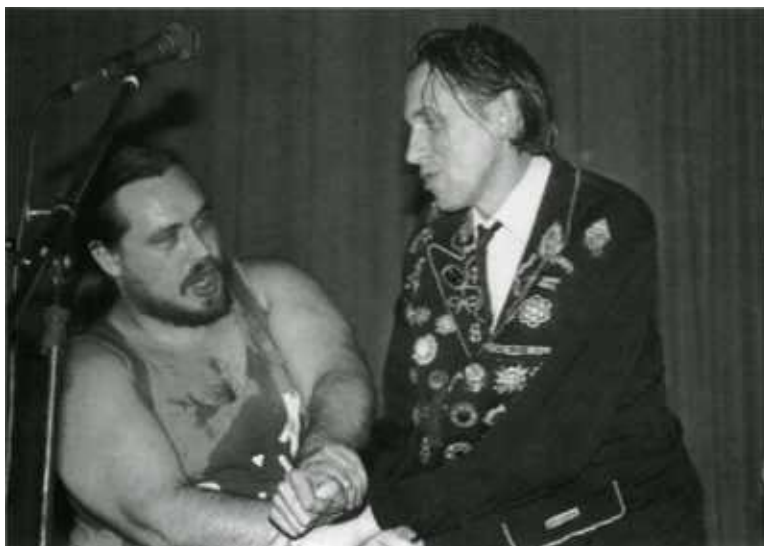
Озерский-Гаркундель: поэтический армлестлинг.