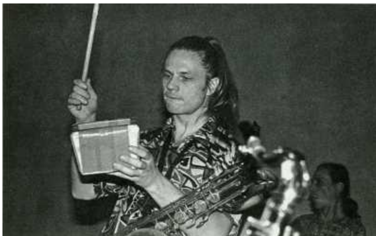
Когда не требуется дудеть, Колик может и постучать.