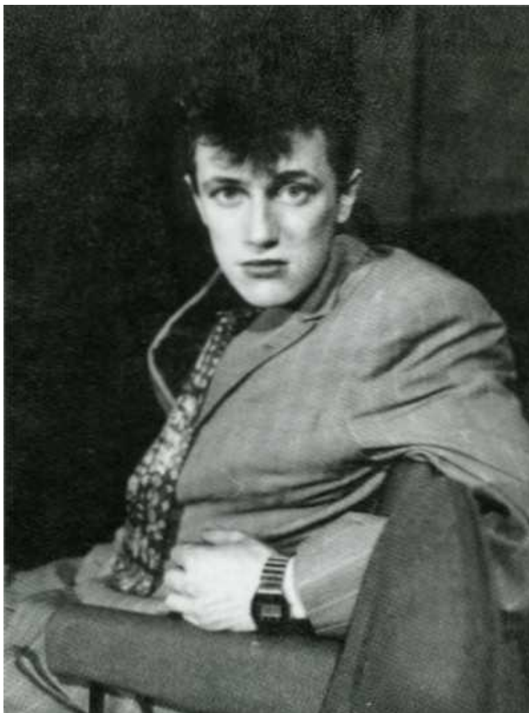
Федоров середины 1980-х.