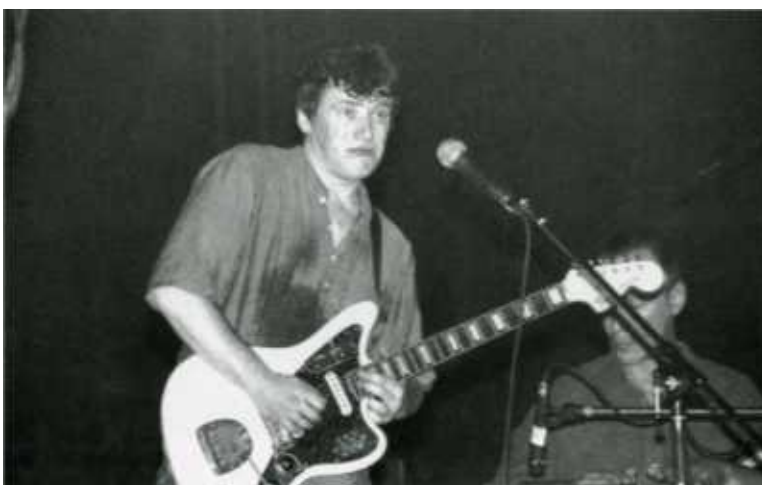
" Я невезучий, радость моя, прощай..."