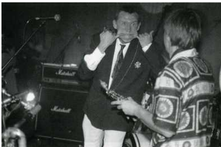
Сейшен "Б" в столичном кинотеатре "Улан-Батор". Гаркуша уже трезвай. Это заметно...