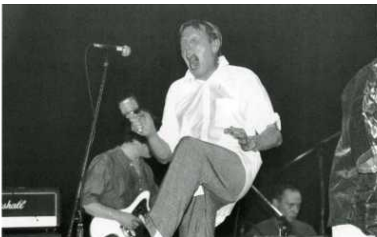
Мальчик как мальчик.