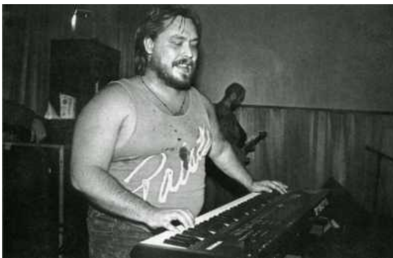
Клавиши для Озерского это "три нотки и ту-ту-ту".