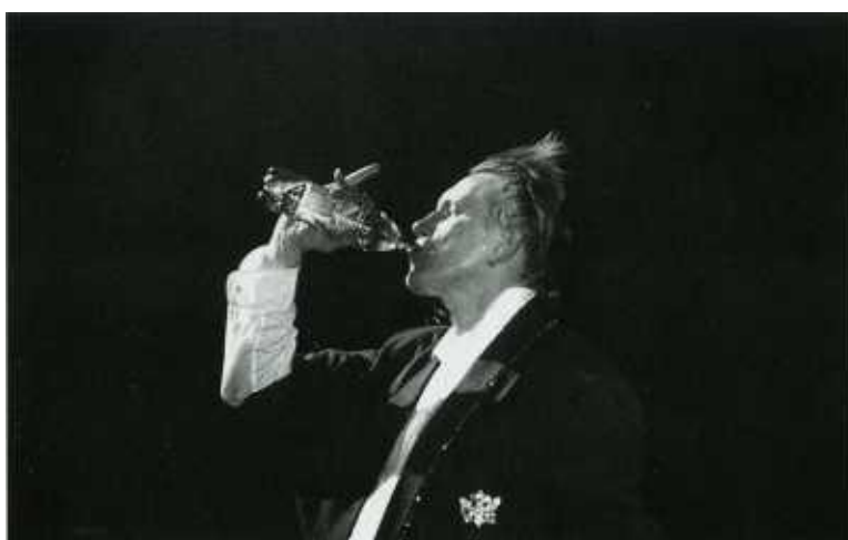
Тотем "АукцѲона". Привычки не лечатся.