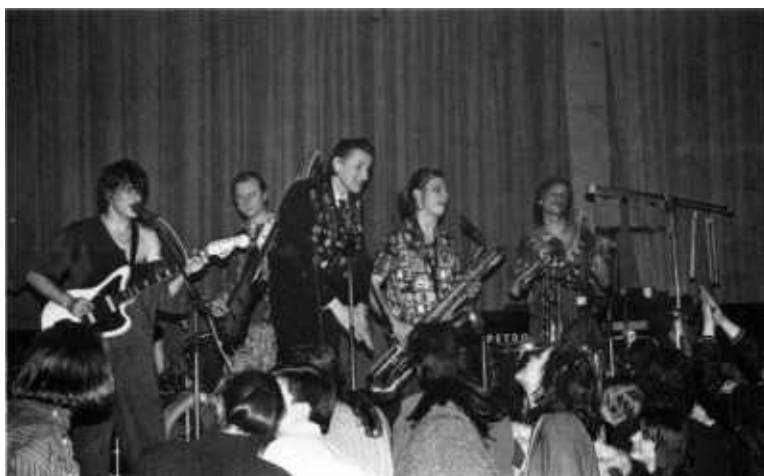
Концерт в "А-клубе". Москва. 17 декабря 1993-го.