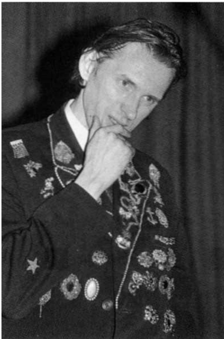
Геркундель. Пора "завязывать"? Декабрь 1993-го.