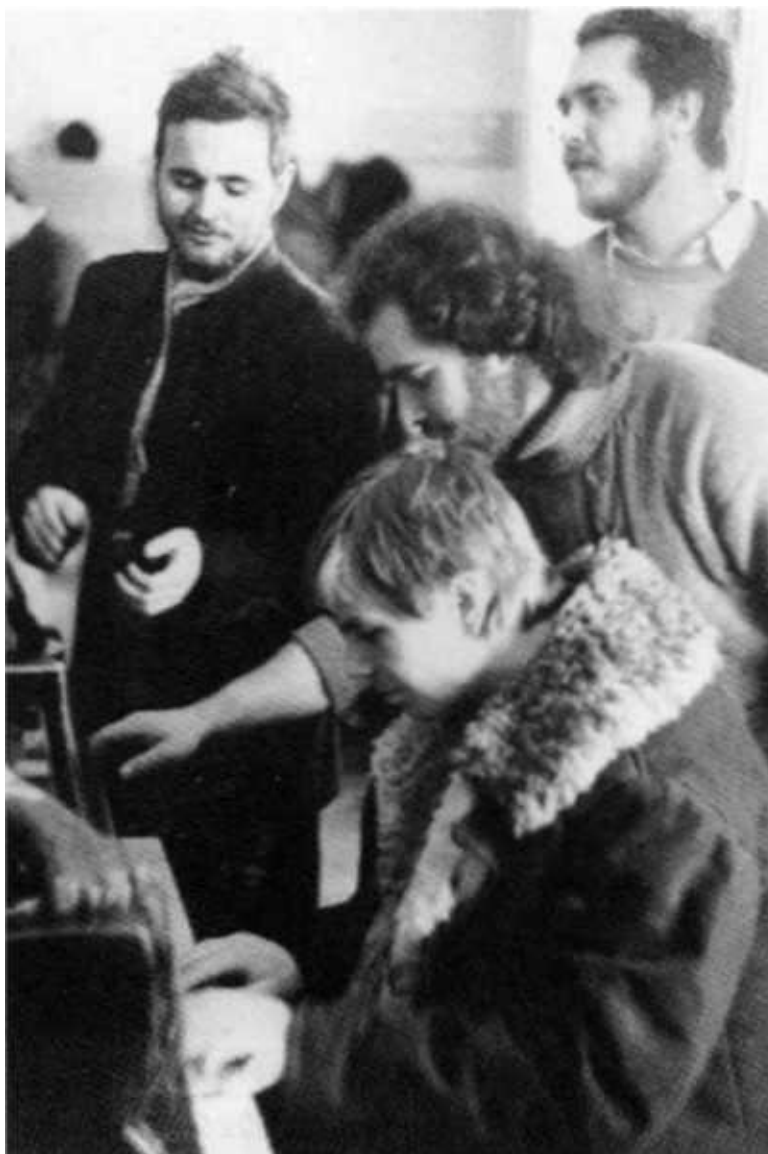
Москва. Январь 1988-го. Колик за фортепиано под присмотром Матковского, Раппопорта и Озерского (слева направо).