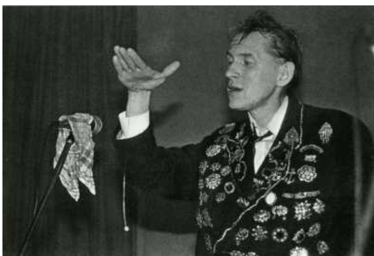
Случались моменты, когда Гаркушу понимали только неодушевленные предметы.