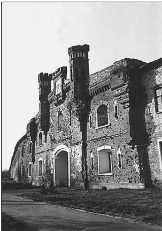
Брестская крепость. 1941 г.

В мемориальном комплексе «Брестская крепость-герой» хранится один весьма ценный экспонат. Это обгоревший будильник, стрелки которого остановились от взрыва на 3 часах 55 минутах. Он самый ценный источник начала войны, буквально доказывающий, что фашисты напали на Советский Союз раньше 4 часов. Ибо первые выстрелы на берегу Западного Буга раздались на 30 минут раньше.