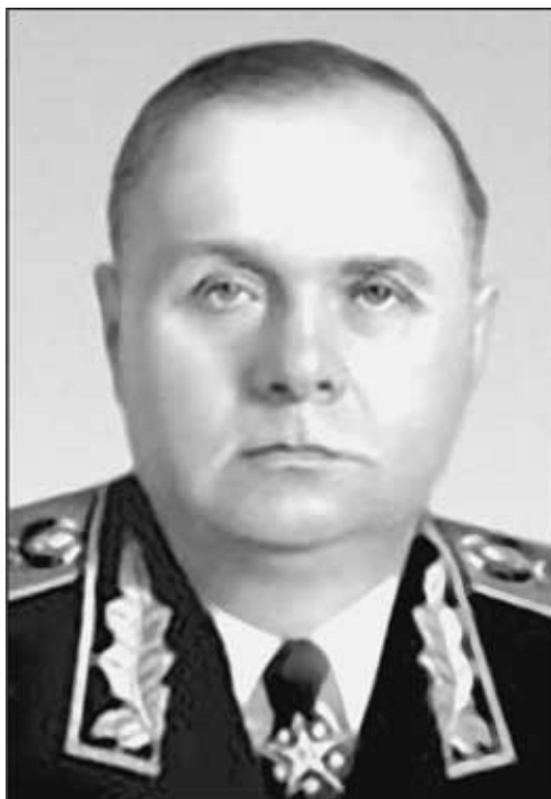
К. А. Мерецков