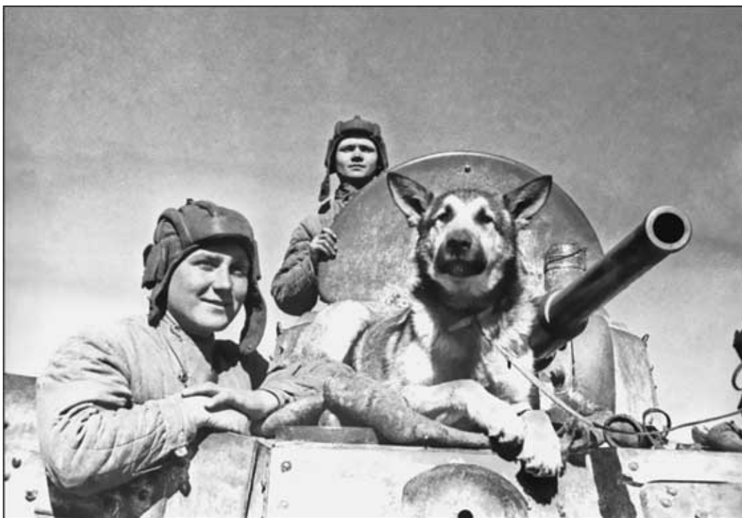
Джультбарс с танкистами. 1943 г.