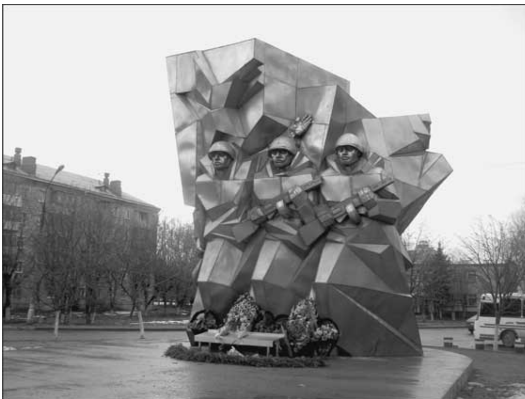
Памятник Подольским курсантам в г. Подольск

Курсанты хоронят погибших... Время остановилось для них, но на руке одного все еще идут часы. Жизнь продолжается, продолжается война. Но страшно погибать. Это противоестественно. Это против самой природы человеческой. Особенно когда это напрасно, бесполезно. От отчаяния и бессилия кремлевские курсанты стреляют в горизонт... Так ведь шли мальчишки на фронт, когда война для них еще не началась по-настоящему, но над ними, уже как тень, нависло: «Убиты! Убиты! Под Москвой...»