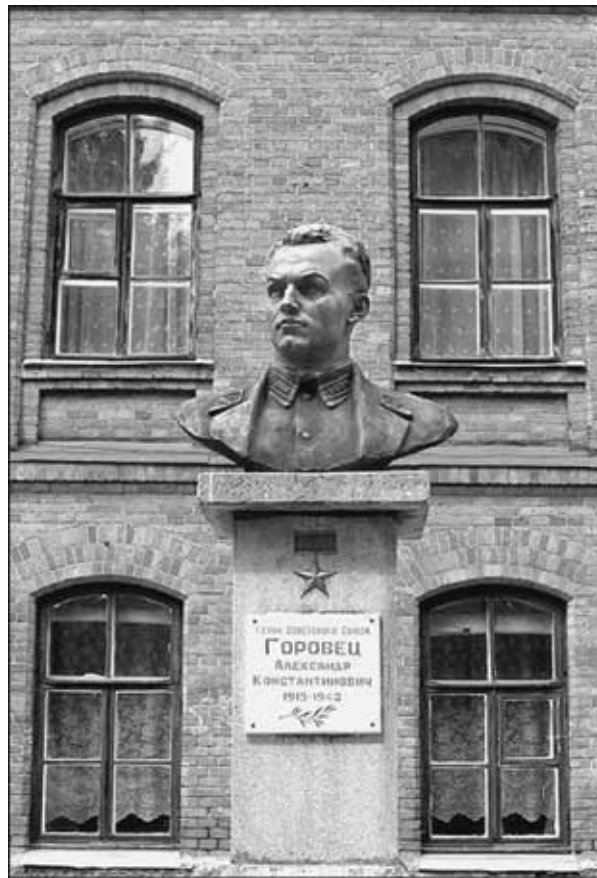
Бюст А. К. Горовца, установленный в г. Полоцк

единственным подтверждением его побед стало донесение от одного из соединений наземных войск о воздушном бое одиночного Ла-5 с большой группой немецких самолетов. С земли видели, как неизвестный летчик с близкой дистанции обстреливал «юнкерсы». Были хорошо видны черные следы от падения самолетов. Словом, конкретное подтверждение было. И этот факт неоспорим. Теперь о количестве сбитых Горовцом самолетов противника. Так как над данным районом шли ожесточенные бои, а на ограниченном участке земли насчитали обломки девяти немецких самолетов, то всех их засчитали погибшему летчику.