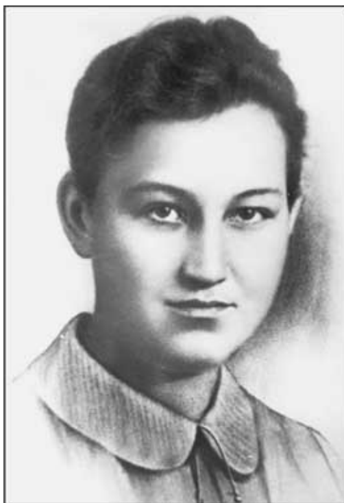
З. А. Космодемьянская

31 октября 1941 года в 9 часов Зоя Космодемьянская вышла из своего дома и направилась напрямик к кинотеатру «Колизей» (ныне театр «Современник»), где был назначен сбор добровольцев, отобранных для действий в тылу врага. А отобрали около 2 тысяч человек. Всех их (девушек и юношей) обучали разведывательному и диверсионному делу только три дня, по ускоренной программе.