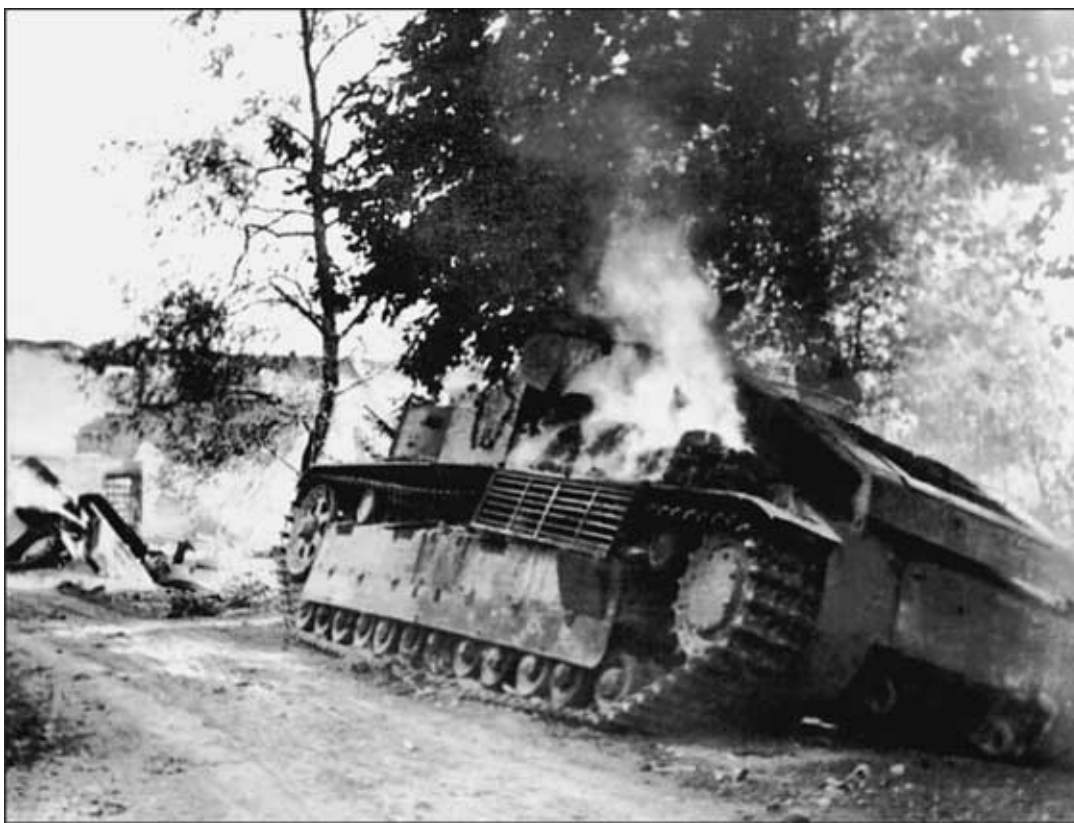
Горящий советский танк Т-28. 1941 г.