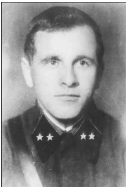
Л. М. Доватор