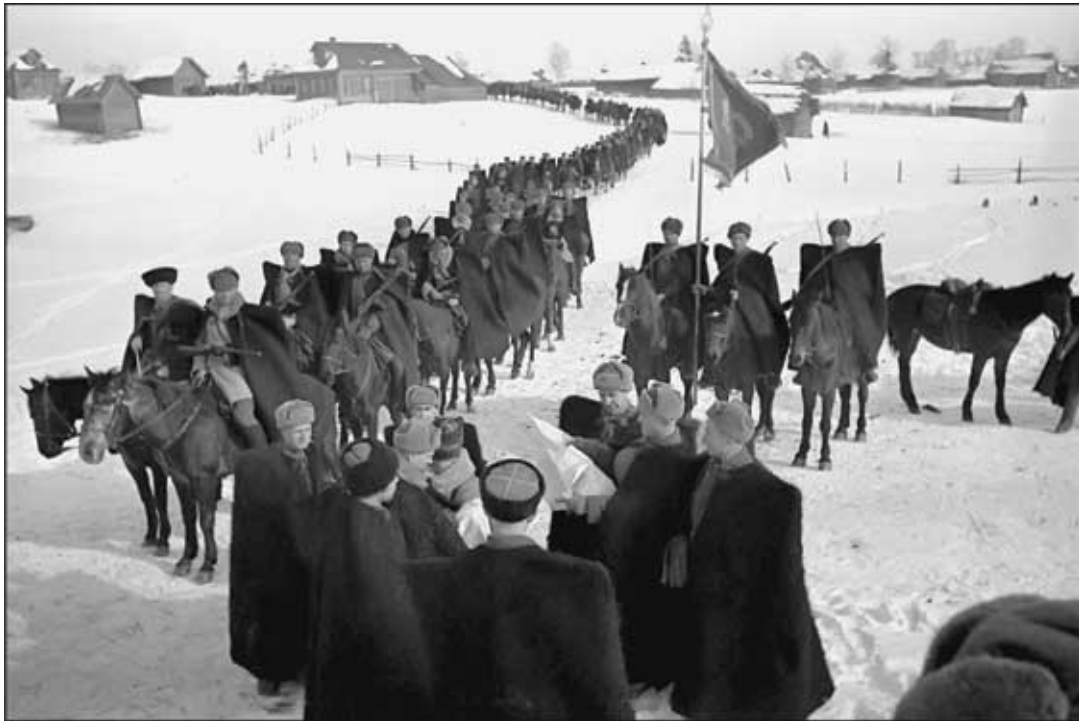
Гвардии генерал-майор Л. М. Доватор с кавалеристами своего корпуса

С боем перейдя линию фронта на рубеже Устье – Подвязье, казаки содействовали частям Красной армии, оттеснив немцев на запад на расстояние 30 километров.