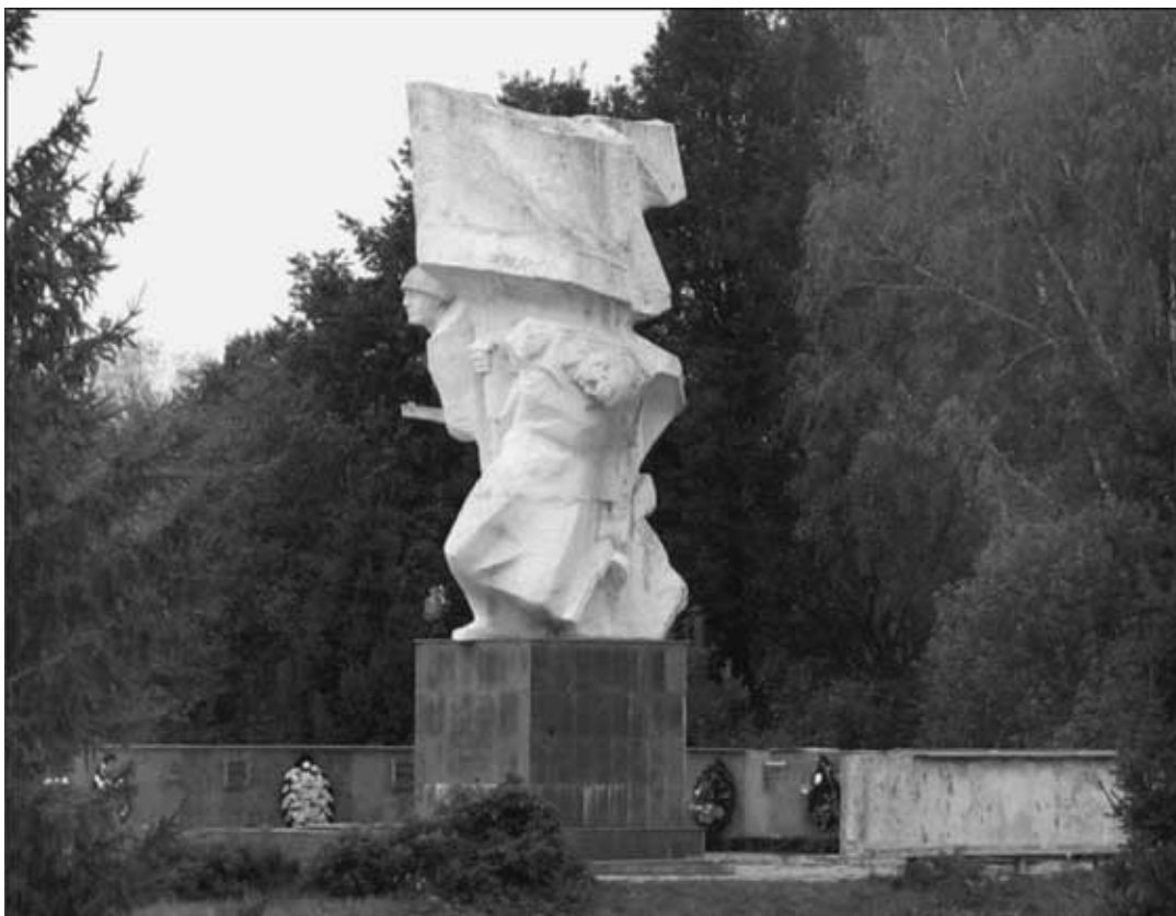
Курган Славы с памятником Подольским курсантам. Пос. Ильинское, Калужская область

17 октября командный пункт подольских курсантов был перемещен в Лукьяново. Еще в течение двух дней мальчишки обороняли Лукьяново и Кудиново. В этот день вечером 17 танков противника проскочили на Малоярославец через Черкасово. «Вести борьбу с танками нам было нечем, – свидетельствуют курсанты. – Командование полка решило пропустить танки, а пехоту задержать. Бутылок с КС и керосином у нас не было. Пехоту мы задержали и оттеснили в Черкасово. Танки прошли в Малоярославец и через некоторое время стали проходить обратно». Когда были обнаружены 40 бутылок с КС, тут же организовали группу подрывников. Первый танк удалось повредить при помощи связки гранат, однако все бутылки были брошены неудачно... Все же немцы ушли, утащив за собой на буксире поврежденный танк.