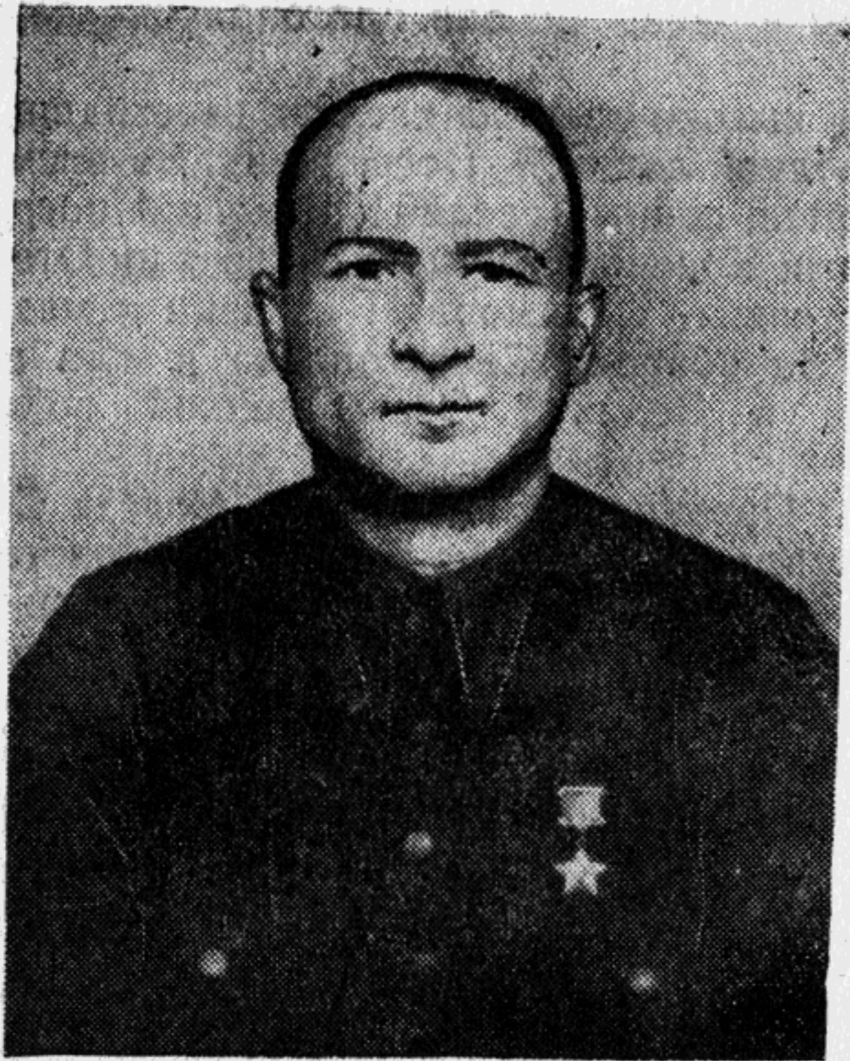
Мелитон Варламович Кантария

Мелитон Варламович Кантария вписал одну из самых ярких страниц в историю Великой Отечественной войны. Он вместе с бойцами батальона капитана Неустроева штурмовал фашистское логово—Берлин. Мелитон и его боевой товарищ Михаил Алексеевич Егоров водрузили знамя Победы над рейхстагом. Никогда не забудет советский народ подвига этих двух героических воинов.