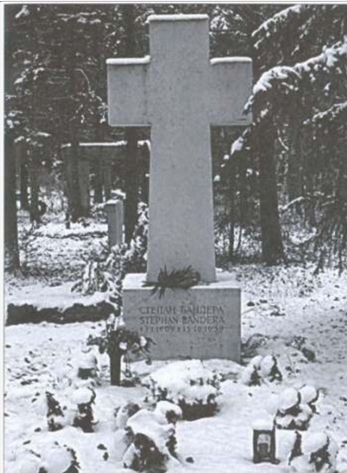
Могила Бандеры в Мюнхене