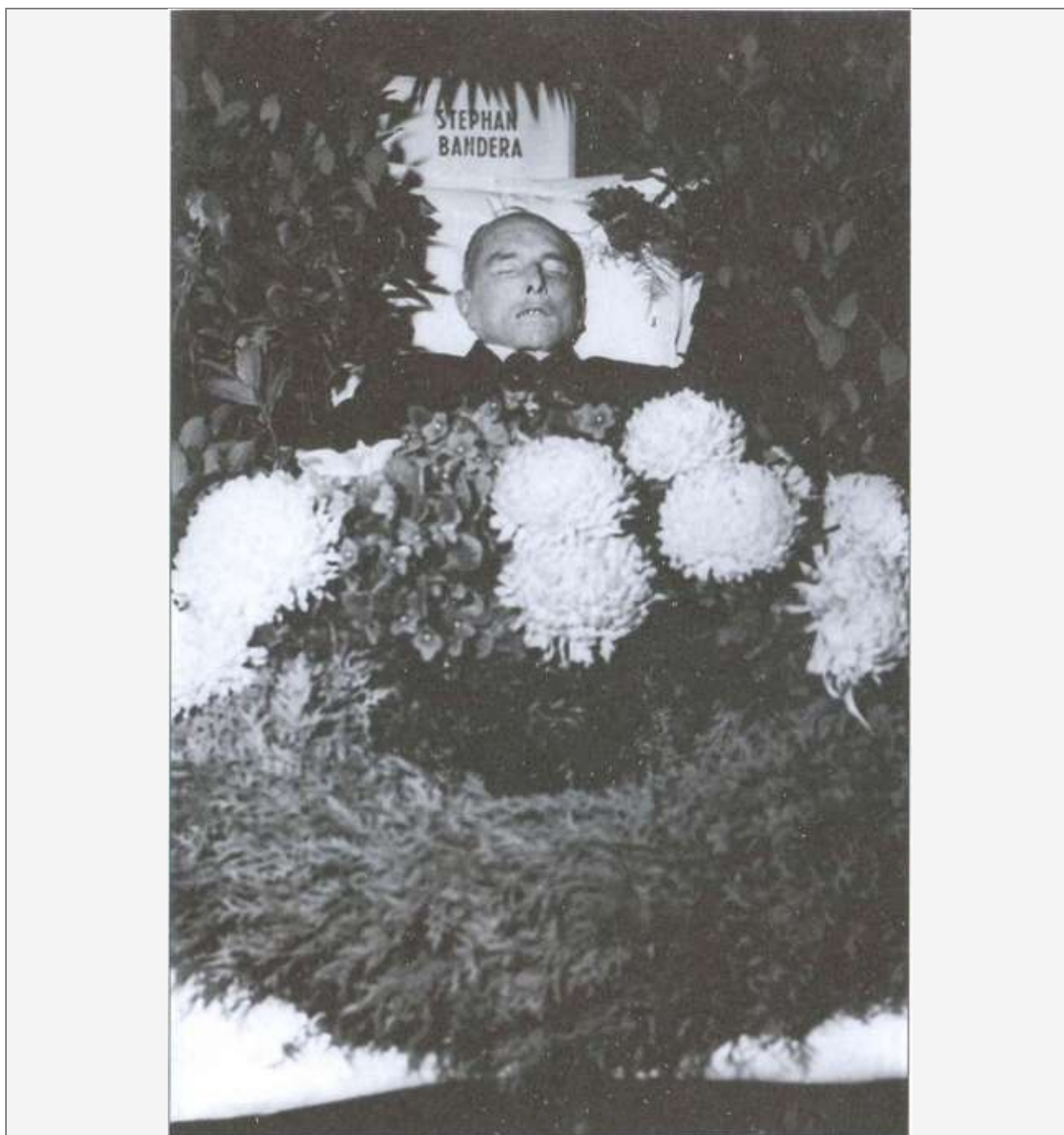
Степан Бандера в гробу