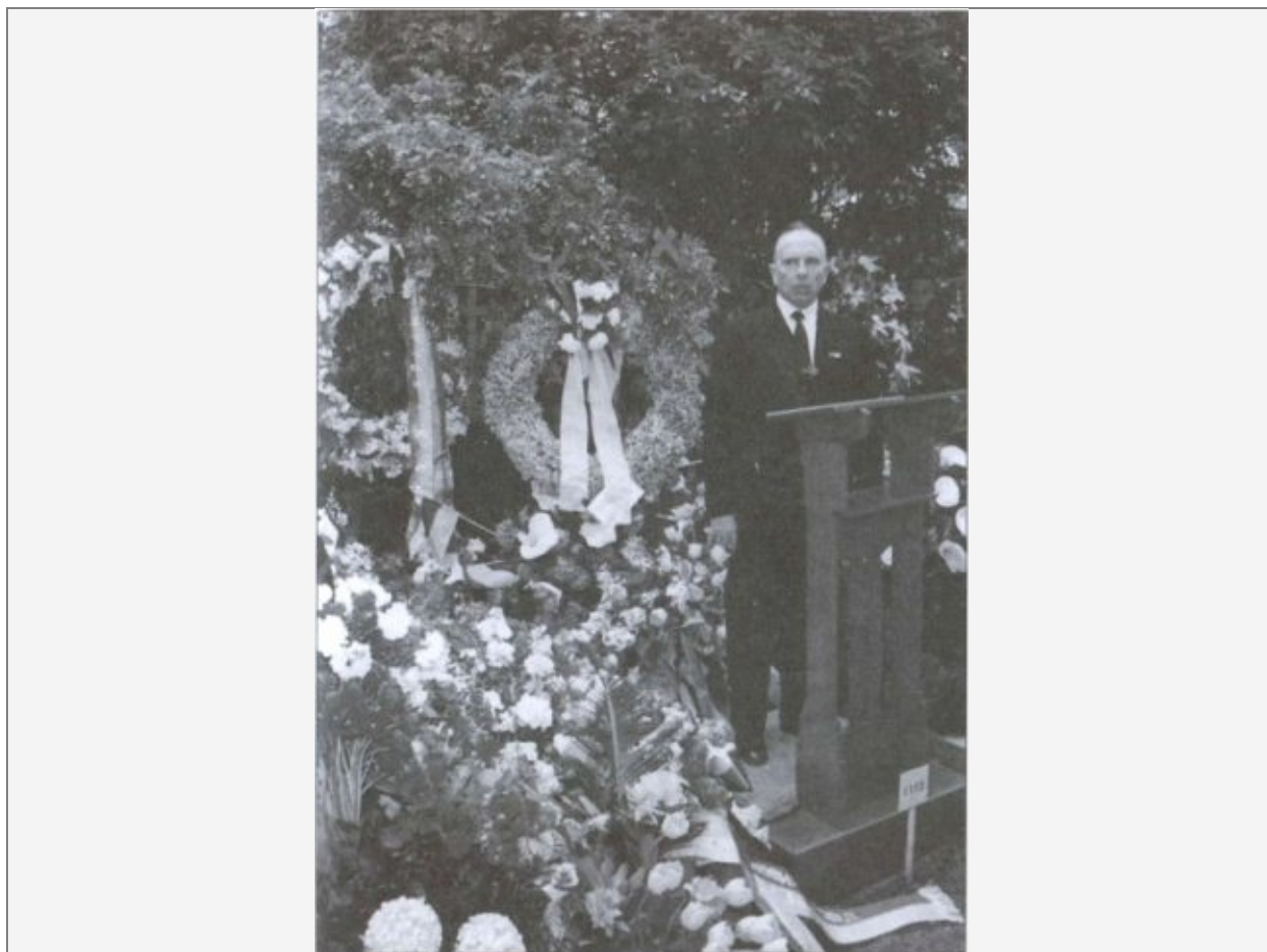
Выступление Бандеры 23 мая 1958 г. на могиле Коновальца в день 20-летия со дня гибели