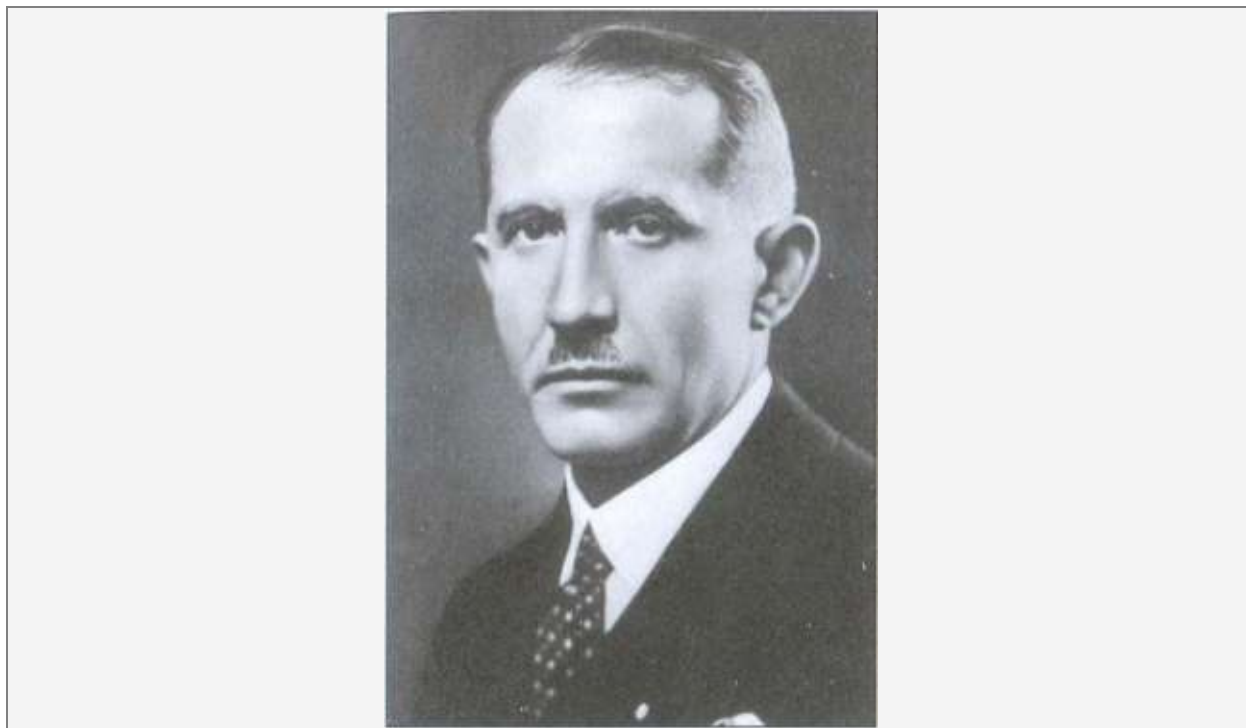
Полковник Евгений Коновалец