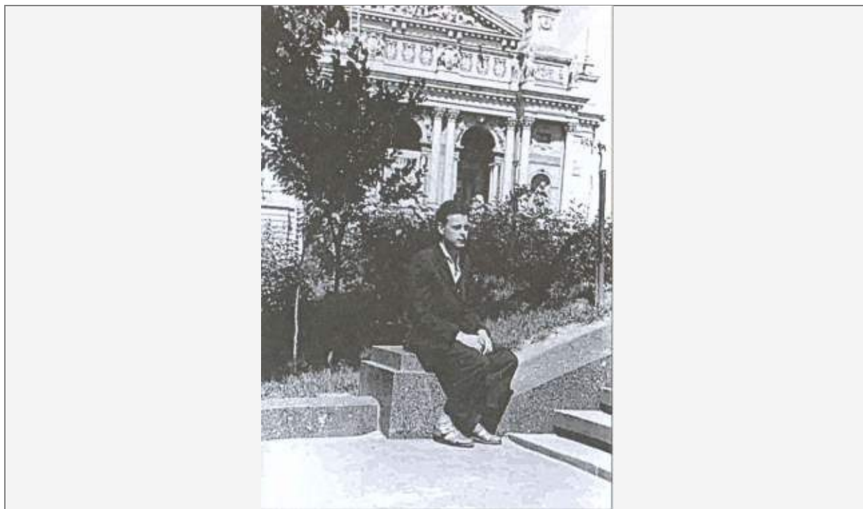
Убийца Бандеры — Богдан Сушинский