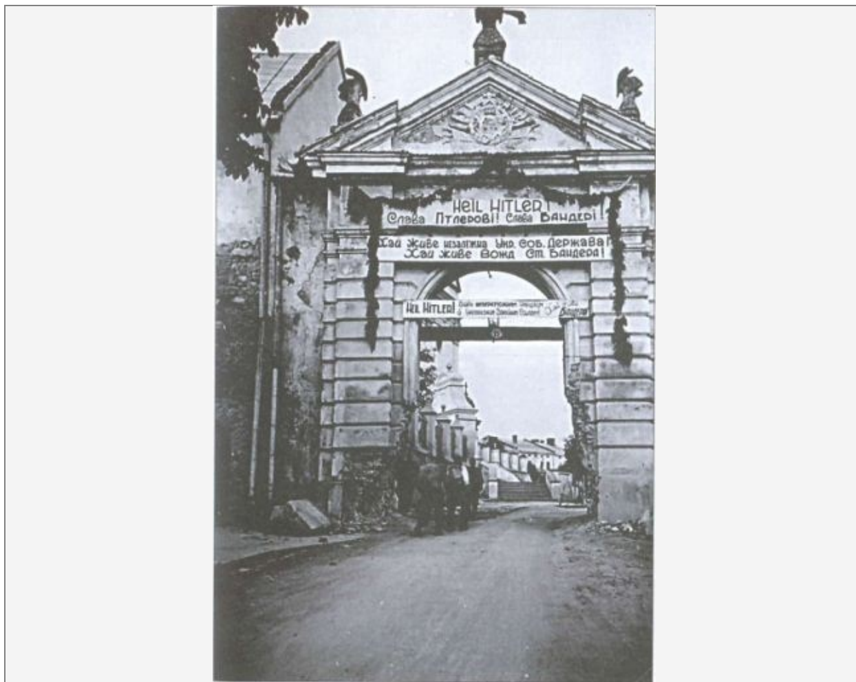
Приветствие от бандеровцев Гитлеру