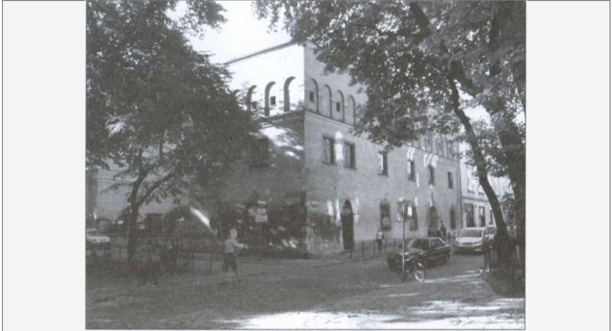
Церковь, где венчался Бандера