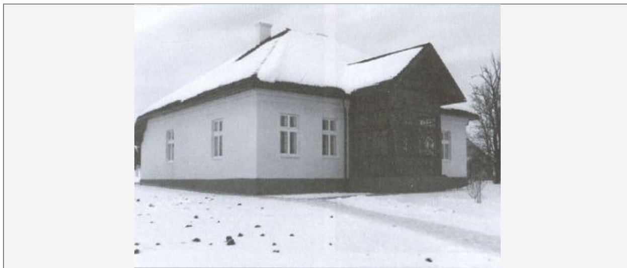
Дом семьи Баядеры в Старо-Упринове