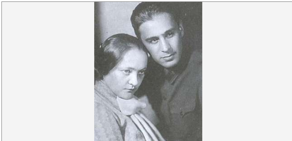
Павел Судоплатов с супругой