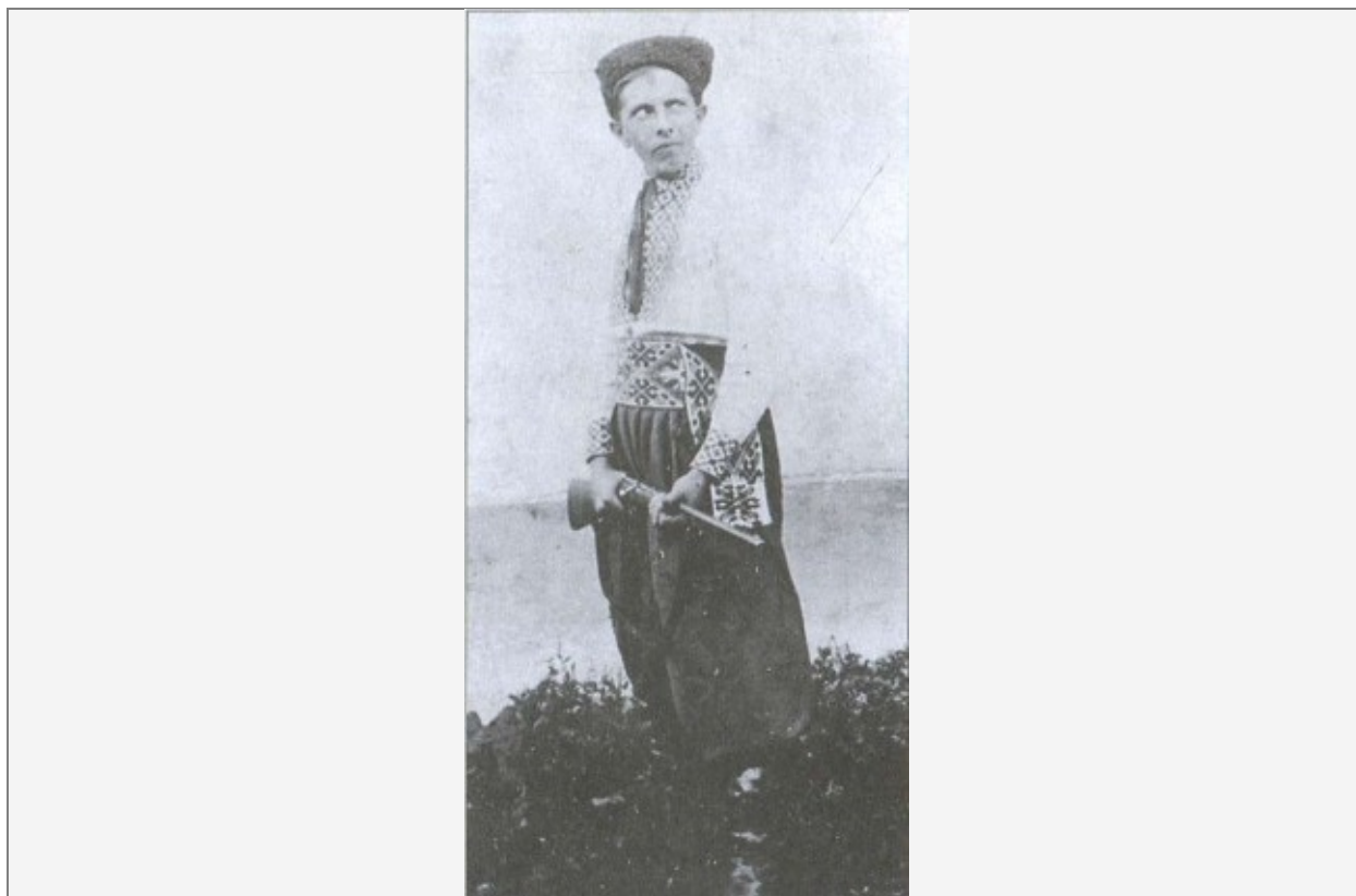
Бандера в казачьем костюме