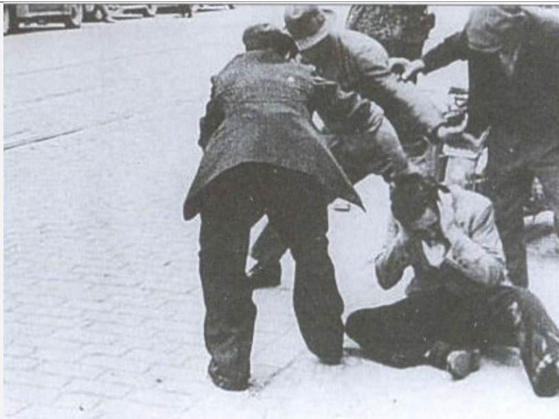
Еврейский погром во Львове.

Июль 1941 г. Украинские националисты избивают еврея