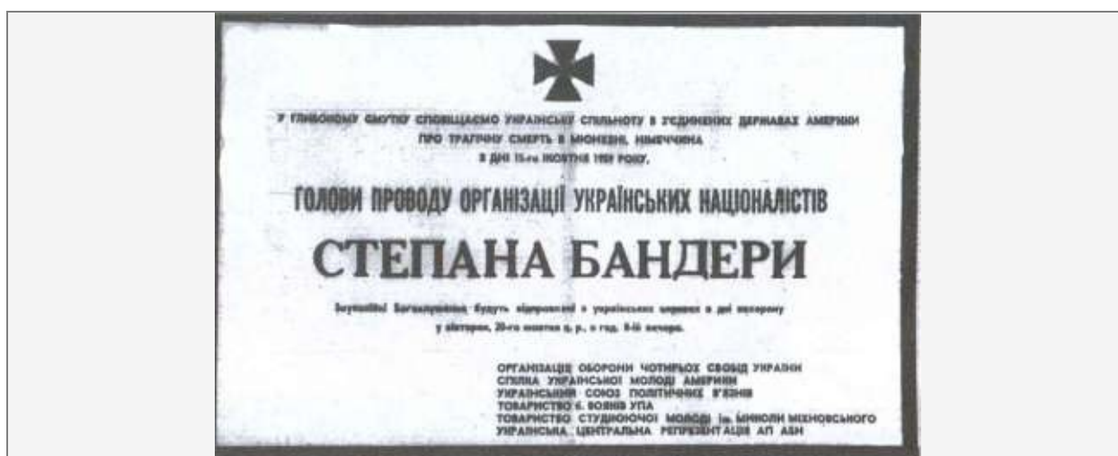
Сообщение о смерти Бандеры