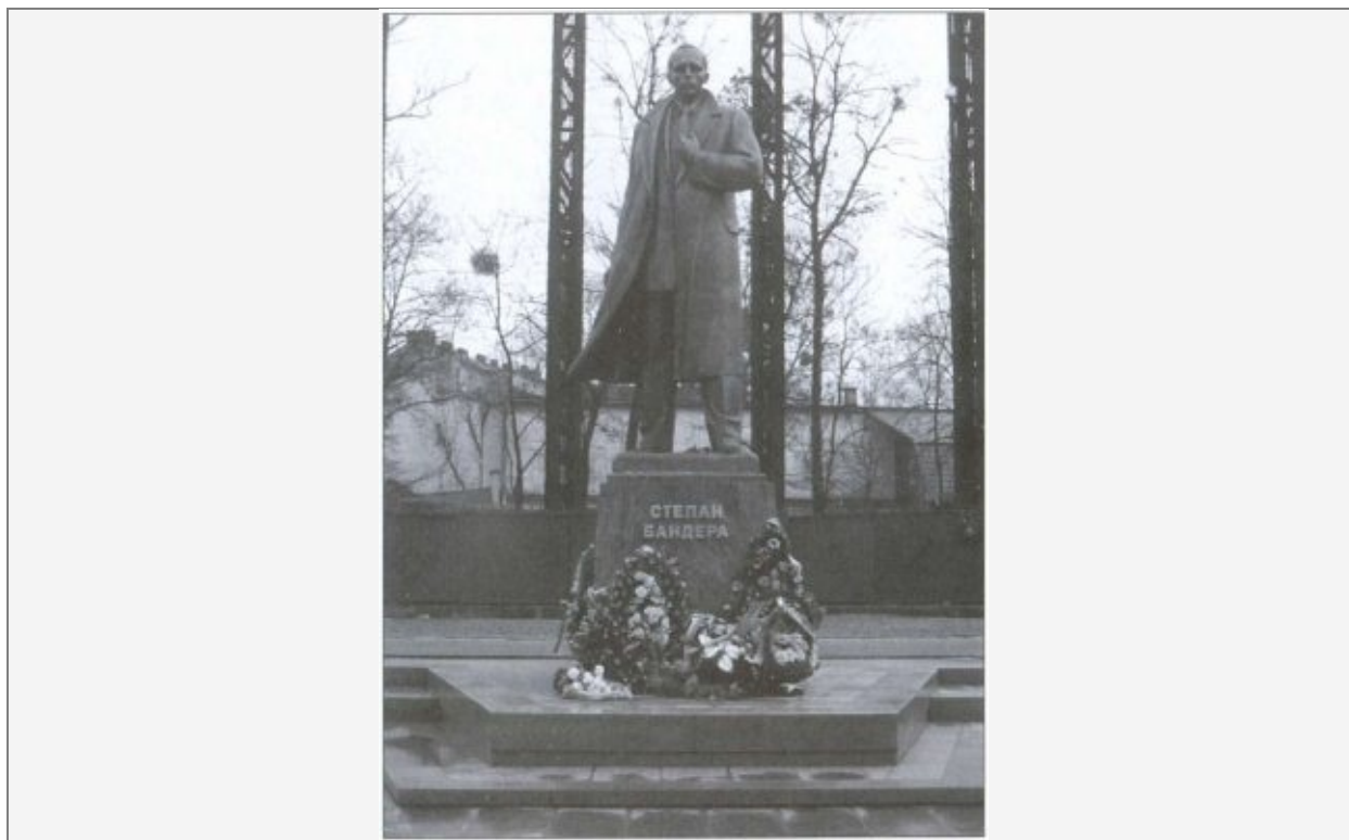
Памятник Степану Бандере во Львове