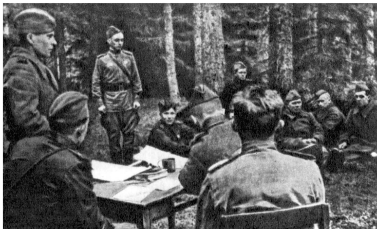
Прием в партию