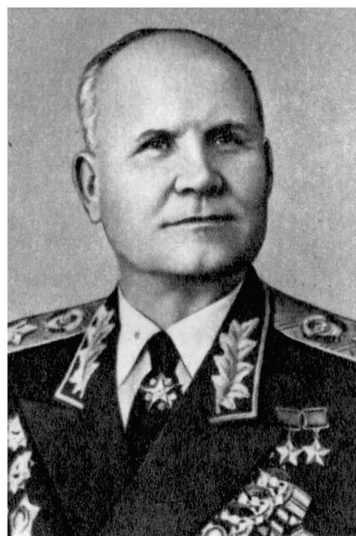
И. С. Конев