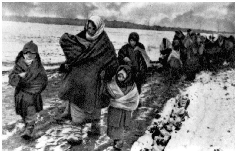
Из фашистской неволи на Родину