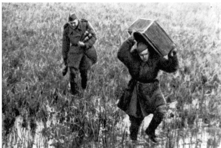
Одер. Доставка боеприпасов через пойму реки