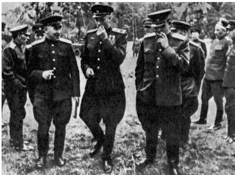
В последний день войны