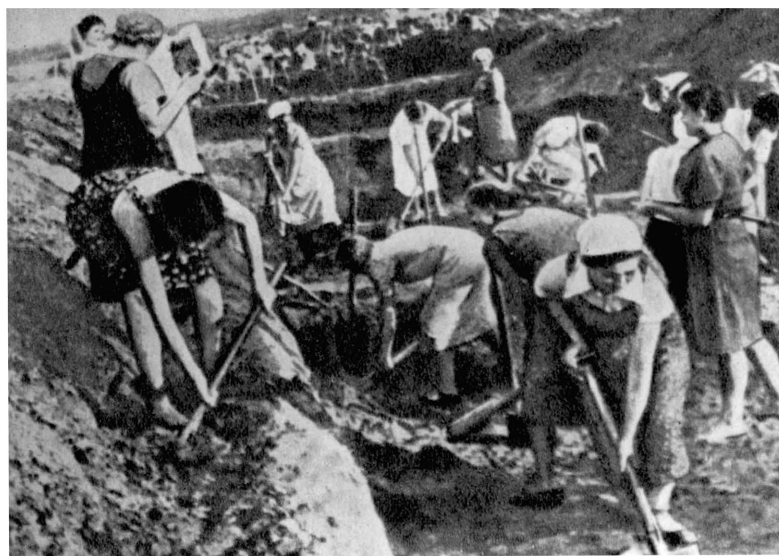
Ленинградцы на строительстве оборонительных рубежей