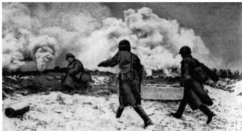
На Невской Дубровке. Бойцы роты химзащиты ставят дымовую завесу перед переправой