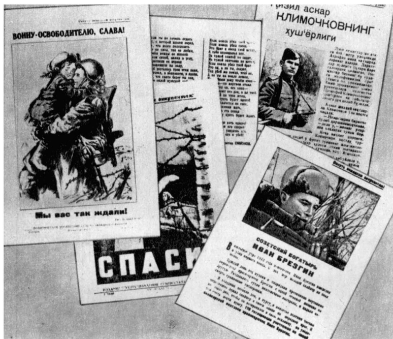
Листовки, изданные политуправлением Северо-Западного фронта