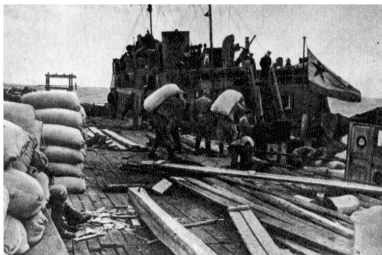
Порт Кобона. Мука для осажденного Ленинграда