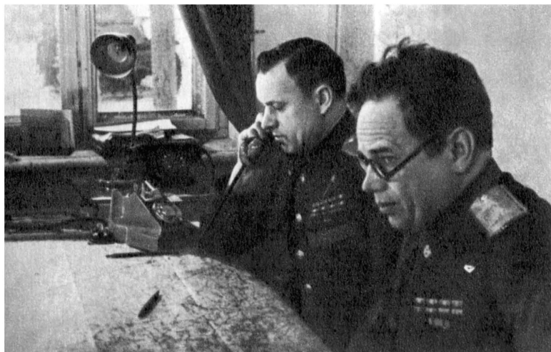
В «штаб-квартире». К. К. Рокоссовский и А. Н. Боголюбов