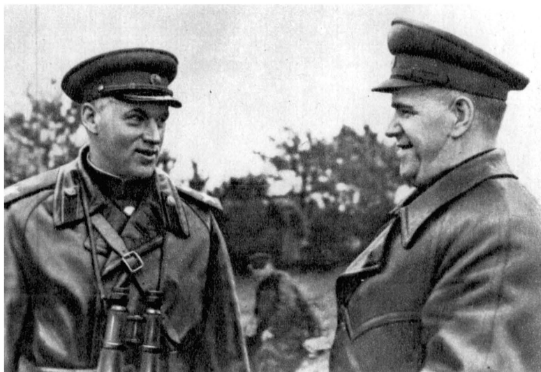
К. К. Рокоссовский и Г. К. Жуков