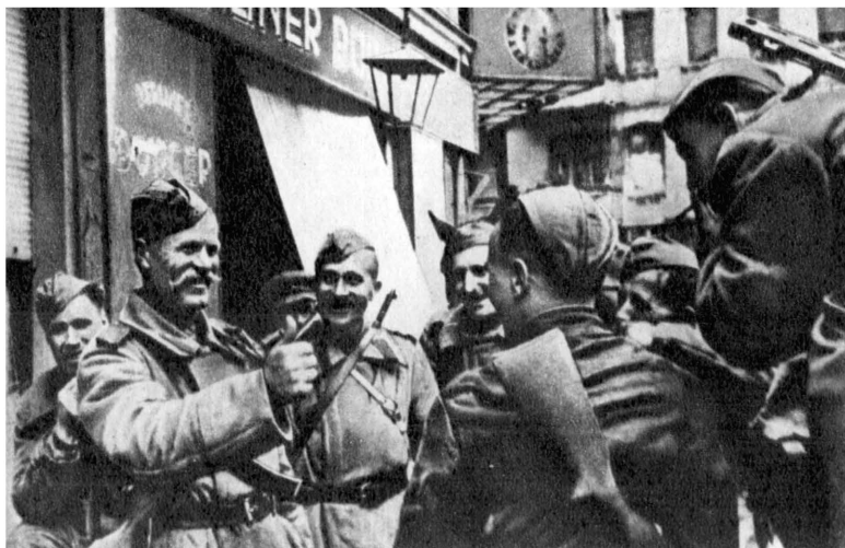
В каждой роте был свой Теркин...