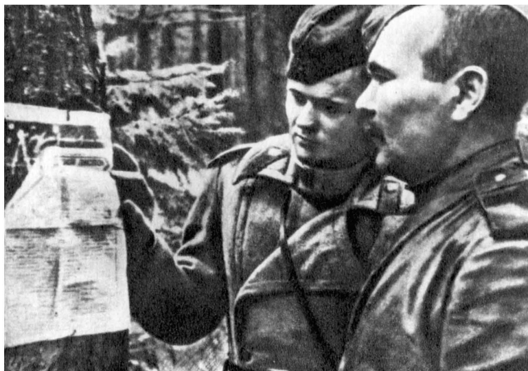
Свежий номер боевого листка