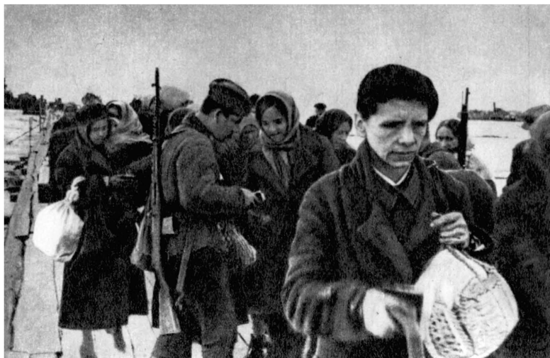
Эвакуированные ленинградцы на восточном берегу Ладоги