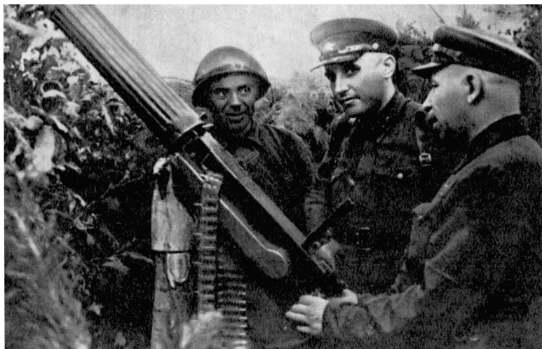
Приморский плацдарм. Испытания самодельной «зенитной установки»