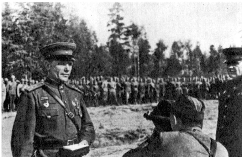
Вручение правительственной награды Герою Советского Союза Я. И. Вилхелмсу