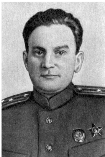
В. Н. Глазунов