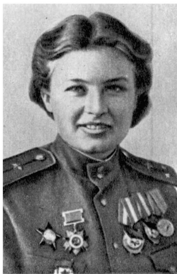
Герой Советского Союза Н. Меклин