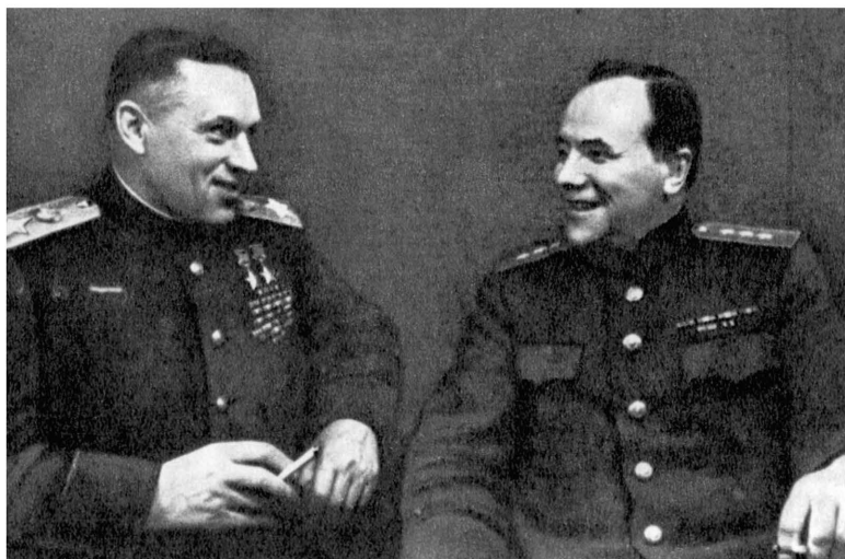
К. К. Рокоссовский и И. В. Шикин