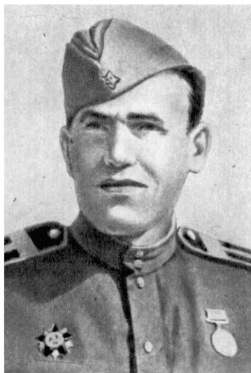
Герой Советского Союза Ф. Е. Санников