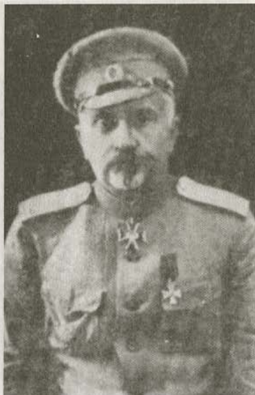
Генерал от инфантерии Ю.Н. Данилов