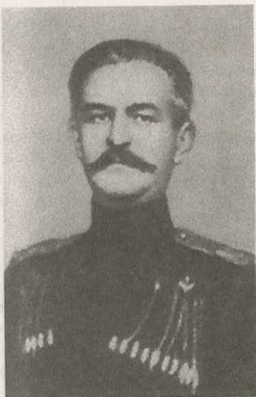
Генерал-майор В.М. Ткачев