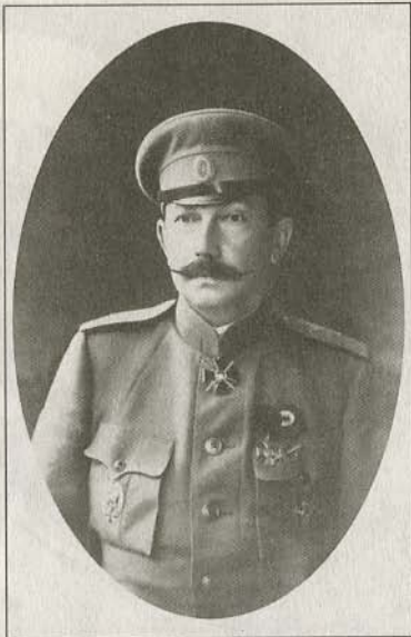
Генерал-лейтенант А.П. Богаевский