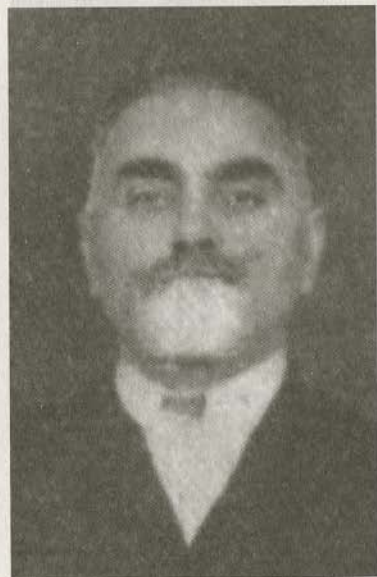
Генерал-майор Г.Б. Андгуладзе