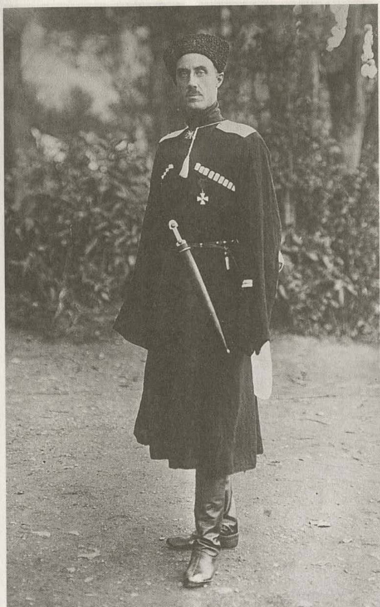
Барон П.Н. Врангель