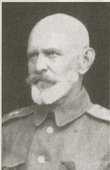
Генерал-лейтенант Д.М. фон Зигель