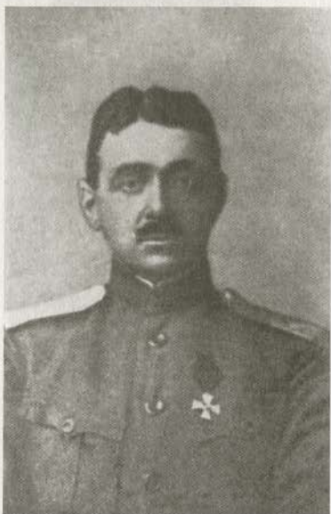
Генерал-лейтенант С.Г. Улагай