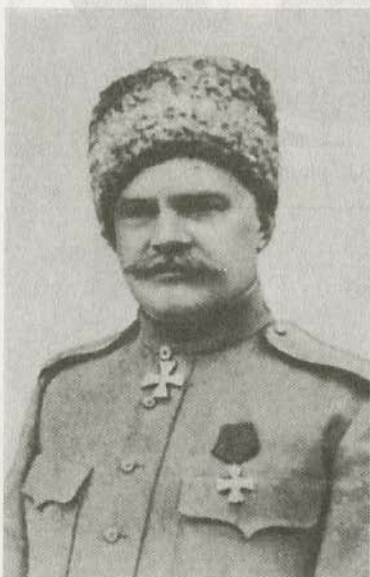
Генерал от кавалерии А.М. Драгомиров