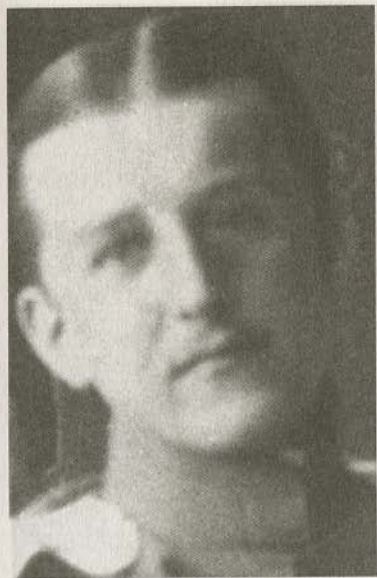
Генерал-лейтенант Я.А. Слащев