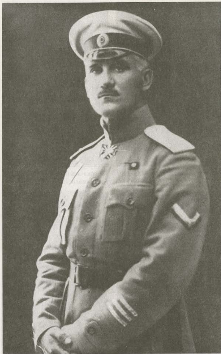
Генерал-лейтенант П.К. Писарев