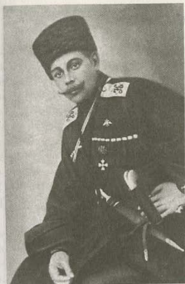
Генерал-майор Н.Г. Бабиев