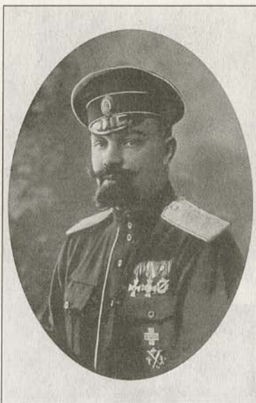
Генерал от инфантерии А.П. Кутепов