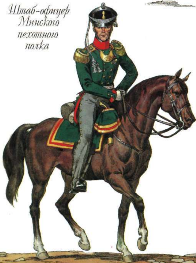
Штаб-офицер Минского пехотного полка