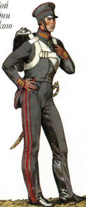
Нестроевой Лейб-гвардии Измайловского полка