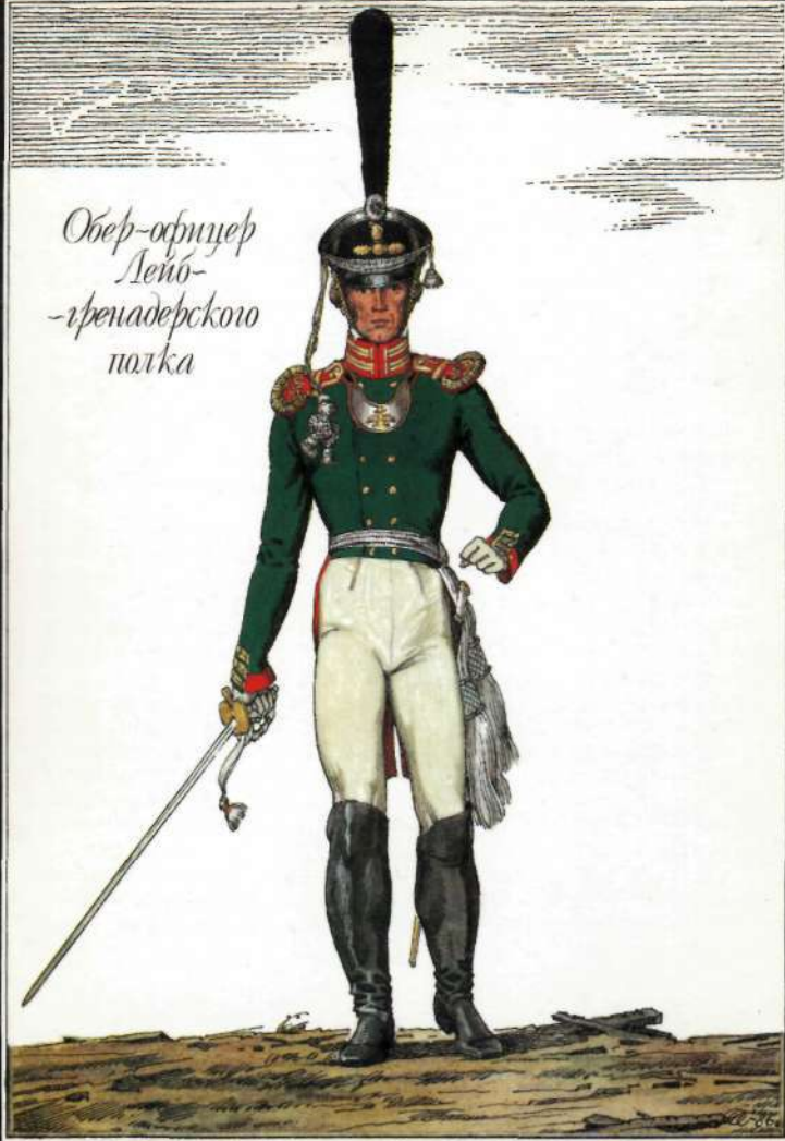
Обер-офицер Лейб- -гренадерского полка