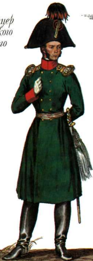
Обер-офицер Белозёрского пехотного полка