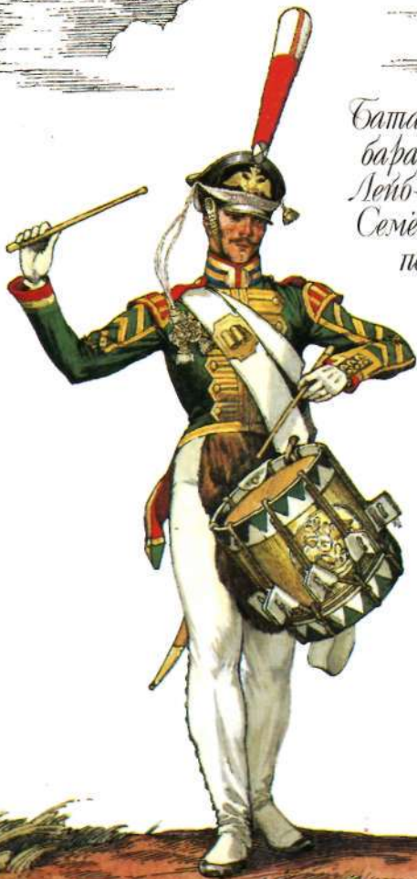
Батальонный барабанщик Лейб-гвардии Семёновского полка