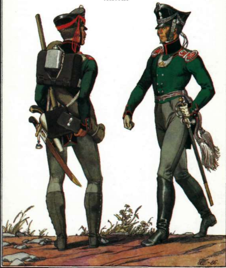
Рядовой и обер-офицер 1-го пионерного полка