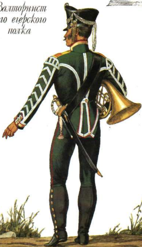
Валторнист 1-го егерского полка