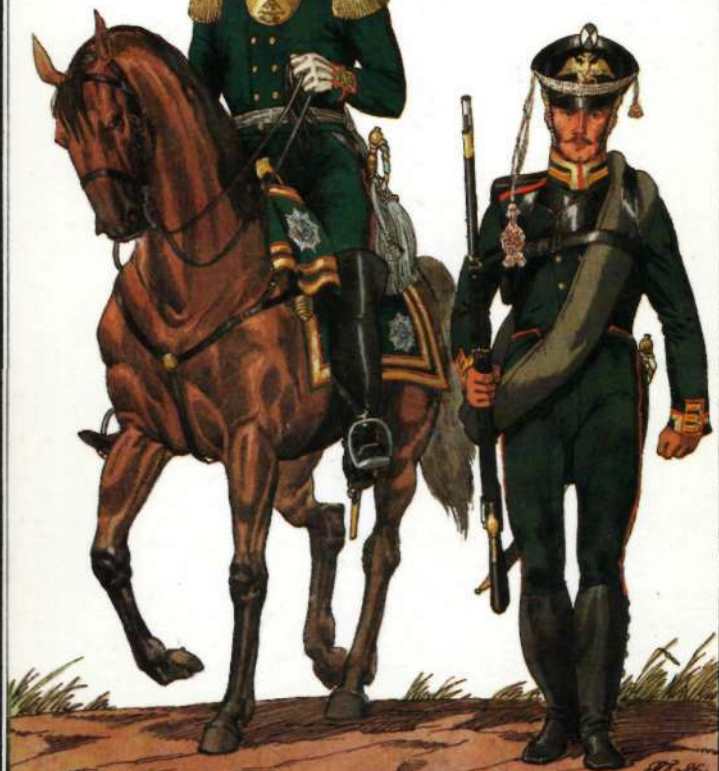
Штаб-офицер и унтер-офицер Лейб-гвардии Егерского полка