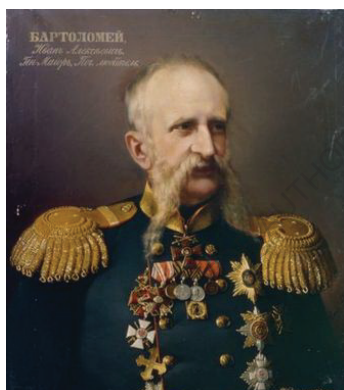
И.А. Бартоломей https://ru.wikipedia.org/wiki/Бартоломей,_Иван_Алексеевич#/media/File:BARTOLOMEI_Ivan_Alekseevich.jpg