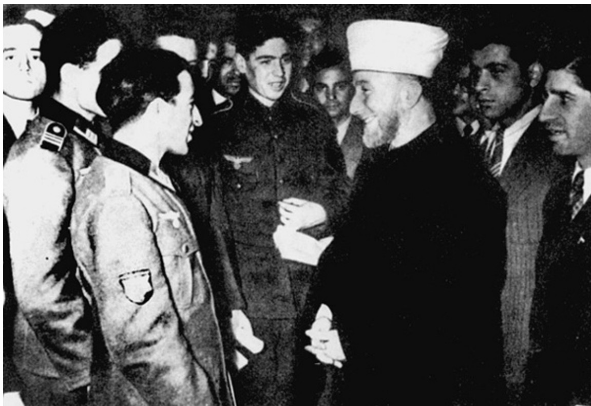
Верховный муфтий Иерусалима беседует с волонтерами из азербайджанского легиона