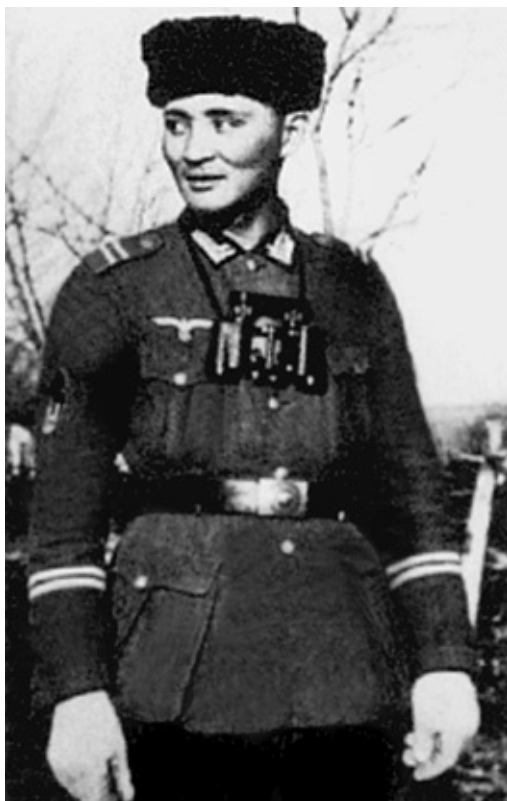
Военнослужащий Туркестанского легиона