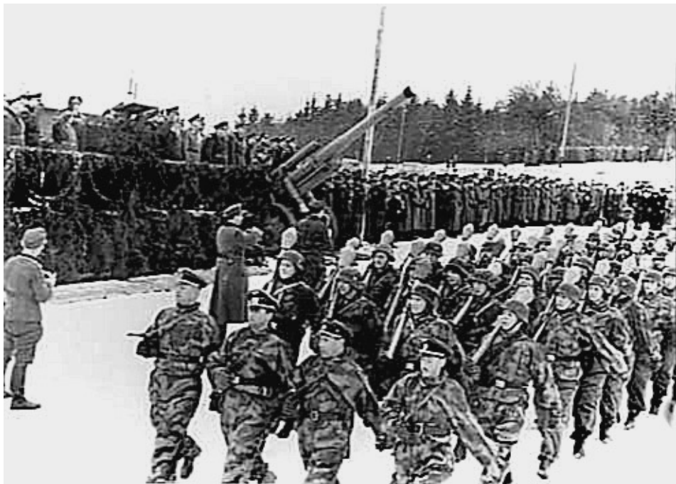
Парад войск РОА