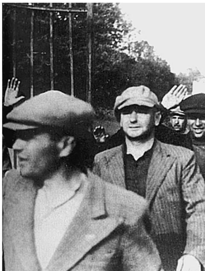
Отряды самообороны в Литве