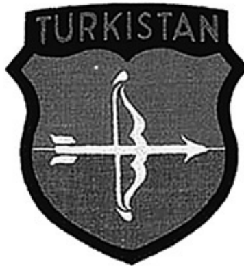
Эмблемы восточных легионов