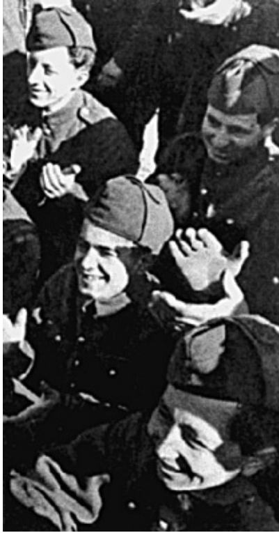
Крымские татары – добровольцы