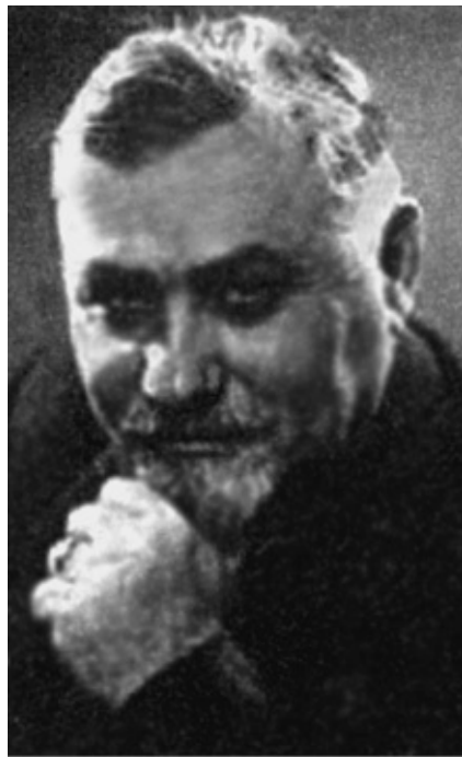
Д. Канаян (Дро) – создатель Армянского легиона вермахта