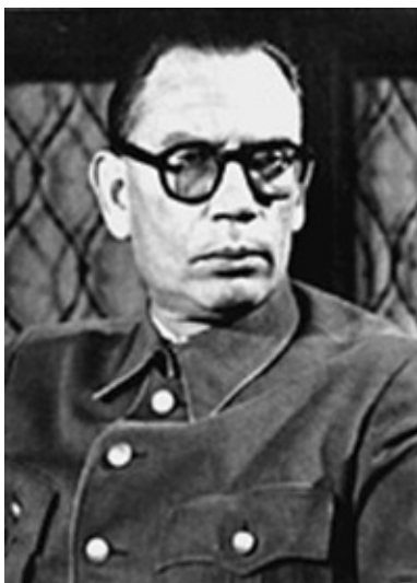
Генерал-лейтенант ВС КОНР А. Власов