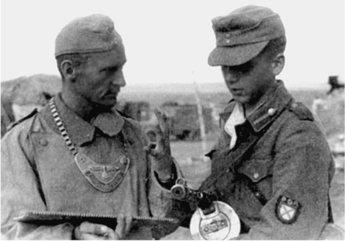
Военнослужащий РОА и жандарм