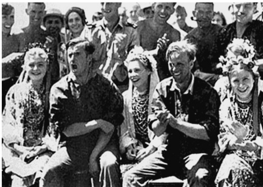
Украинские девушки и немецкие солдаты