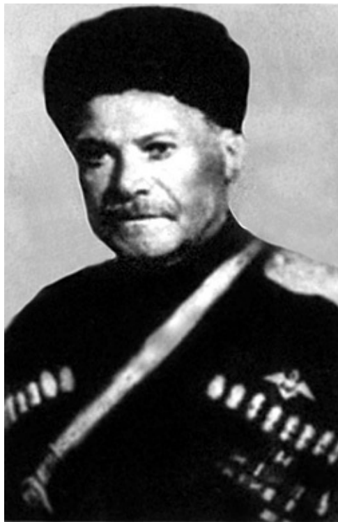
Генерал-лейтенант А. Шкуро