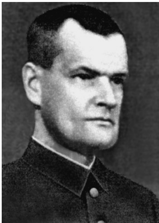
Генерал-майор ВС КОНР Ф. Трухин, член НТС