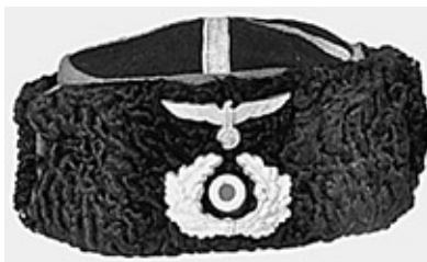
Кубанка с символикой вермахта