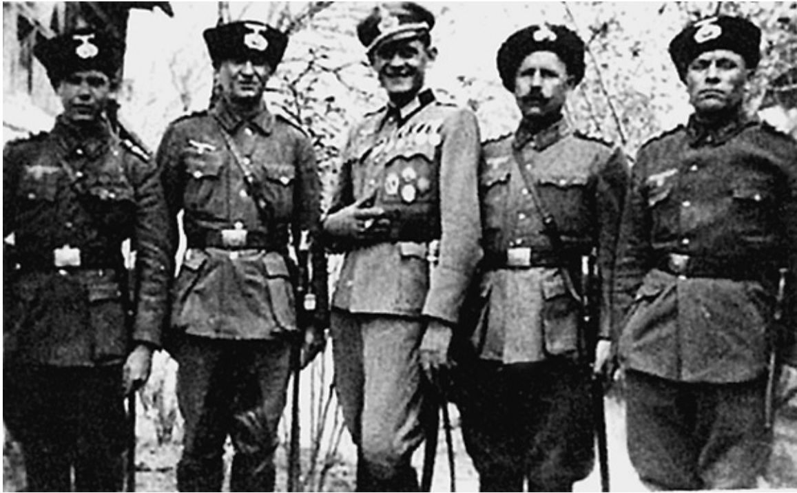
Казак в вермахте