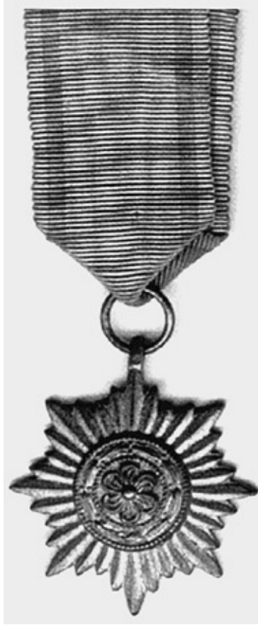
Знак отличия за храбрость и заслуги для восточных народов