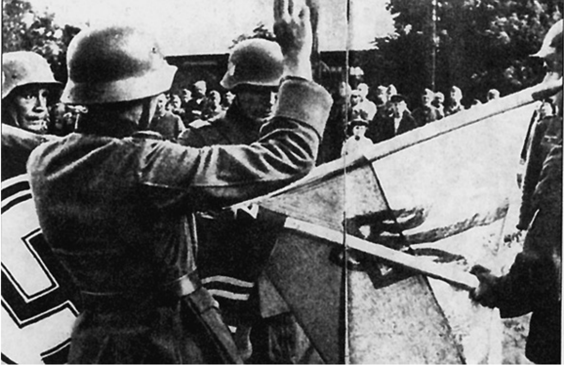
Украинские добровольцы с германским и украинским военными флагами во время церемонии приветствия