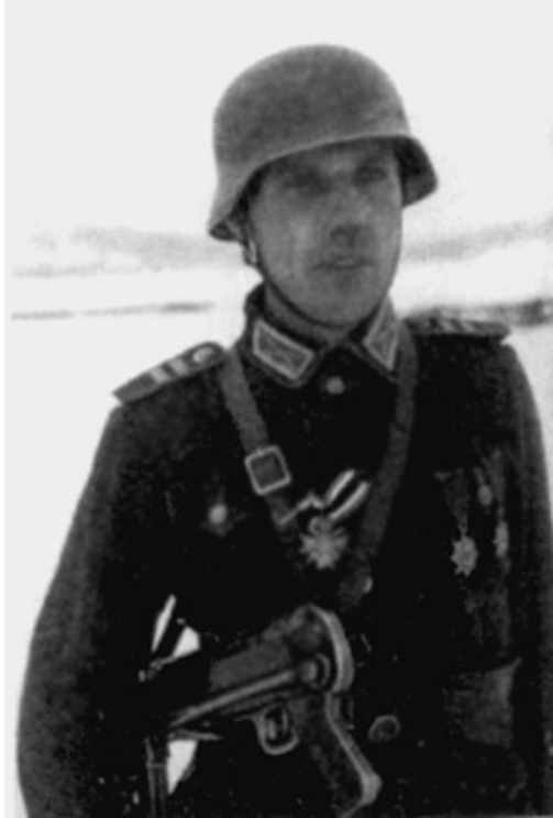
Казак 1-й кавалерийской дивизии фон Панвица