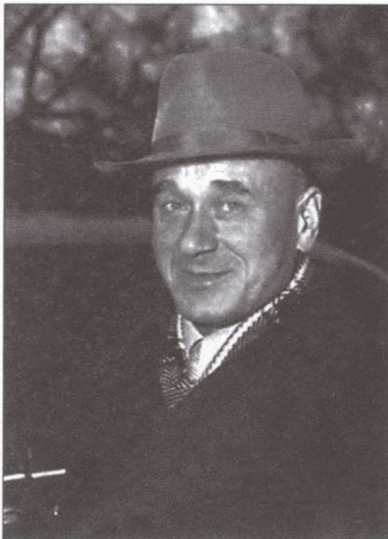
Генерал И. Серов