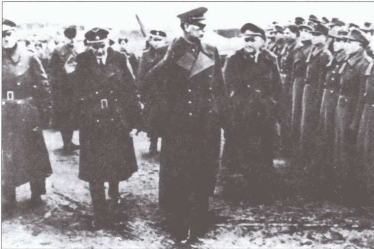
А. Власов и В. Мальцев обходят строй летчиков РОА