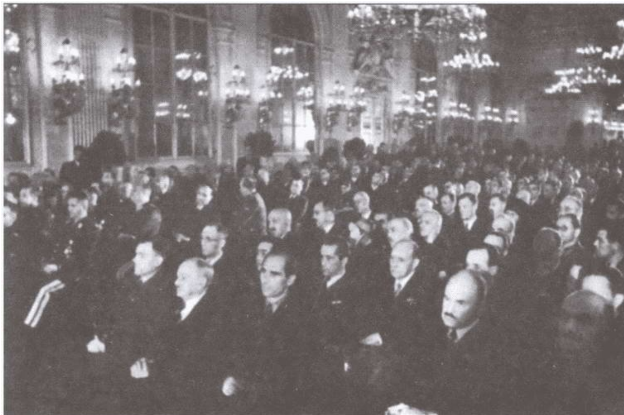
Учредительное заседание КОНР в Праге