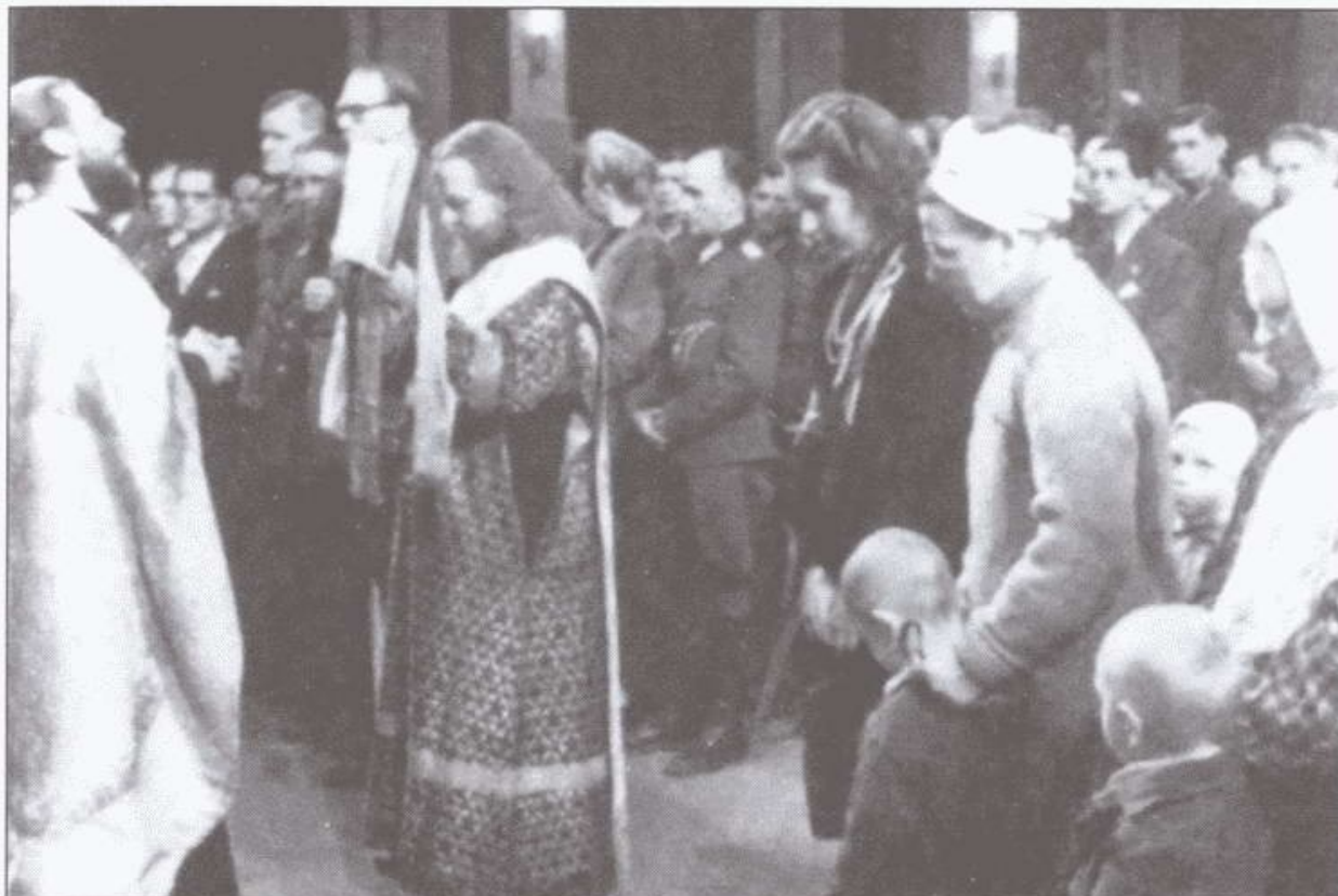
Генерал Власов присутствует на молебне