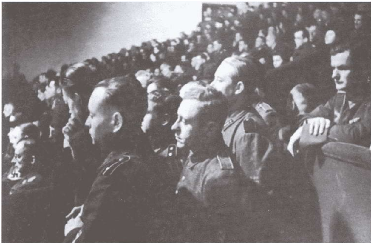
Собрание членов КОНР в Берлине. 1944 г.