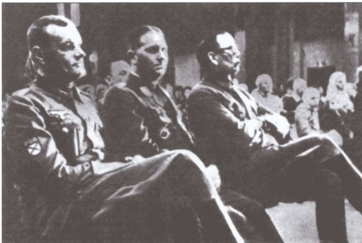
Генералы Ф. Трухин, Г. Ашенбреннер и А. Власов на встрече с восточными рабочими в Берлине. 1945 г.