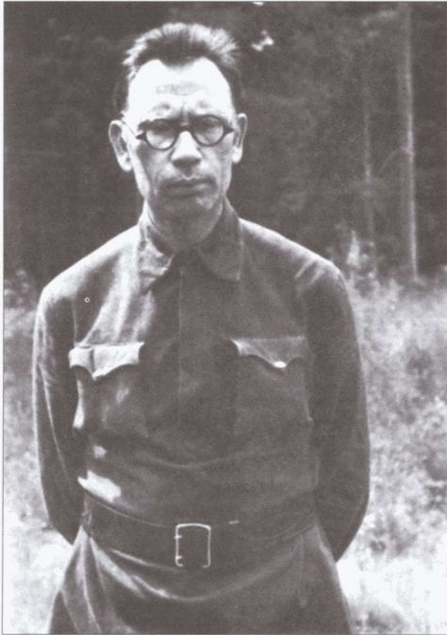
Власов после пленения