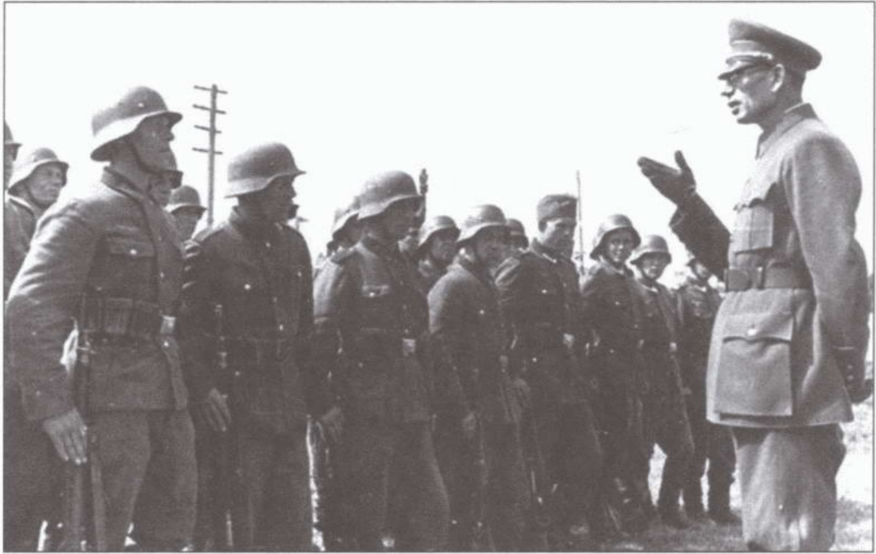
Генерал Власов перед строем бойцов РОА