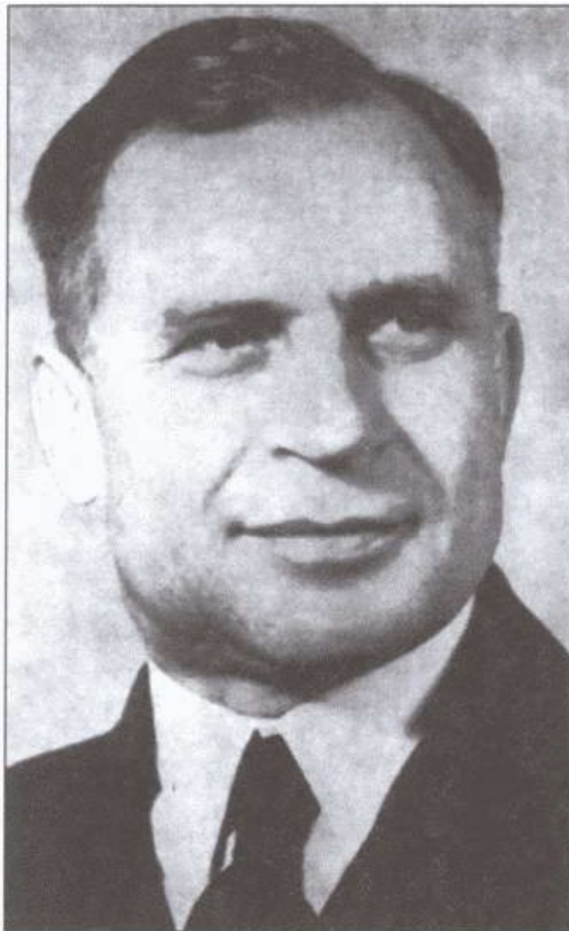
Генерал В.Ф. Малышкин