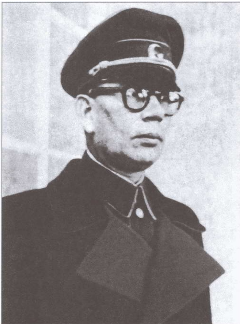
Генерал-лейтенант А.А. Власов