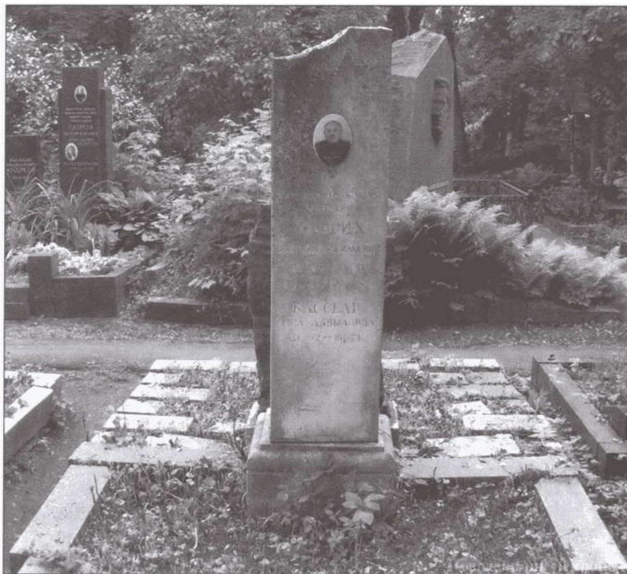
Могила В. Ульриха на Новодевичьем кладбище в Москве