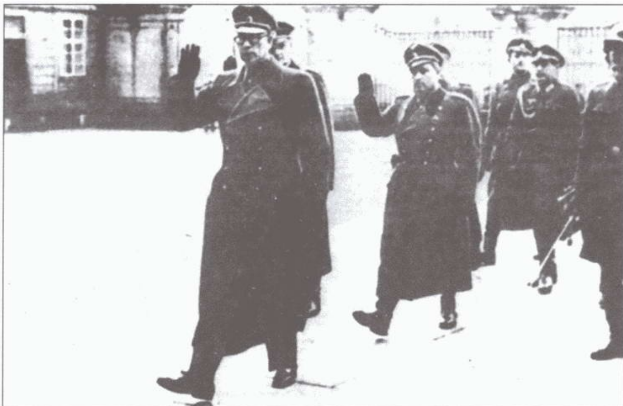
А. Власов и другие чины РОА в Праге