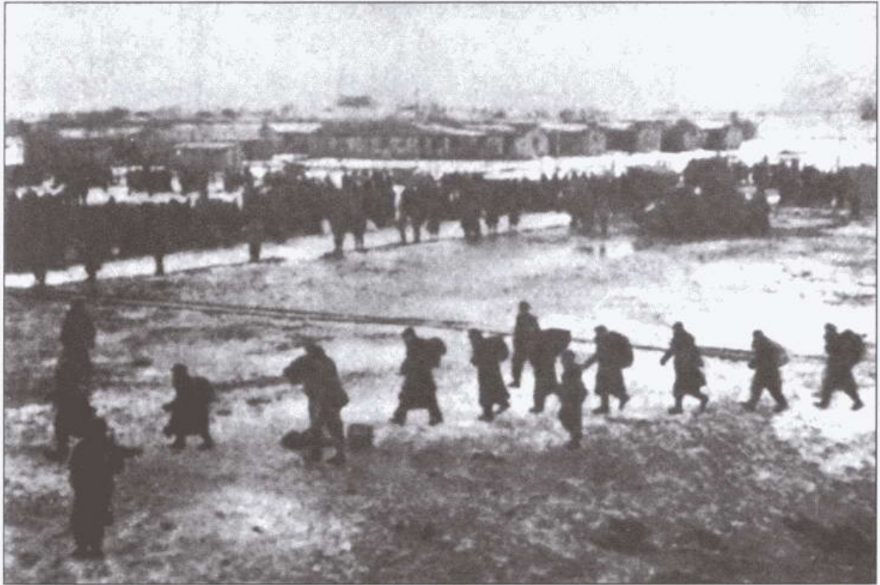
Депортация власовцев в СССР из американского лагеря военнопленных. 1946 г.