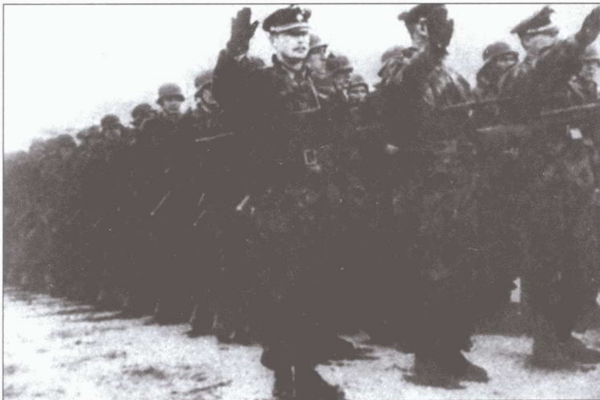
1-я дивизия РОА