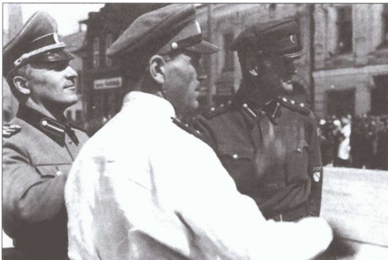
Генерал Жиленков (крайний слева) полковник Кромиади (в белом) и полковник Боярский с сослуживцами в Пскове. 1943 г.