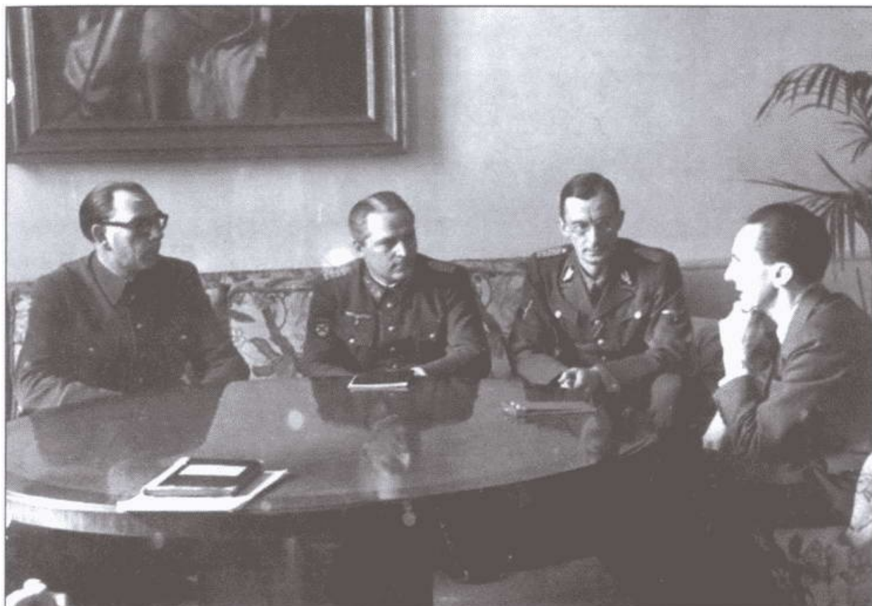
Встречал. Власова с Й. Геббельсом