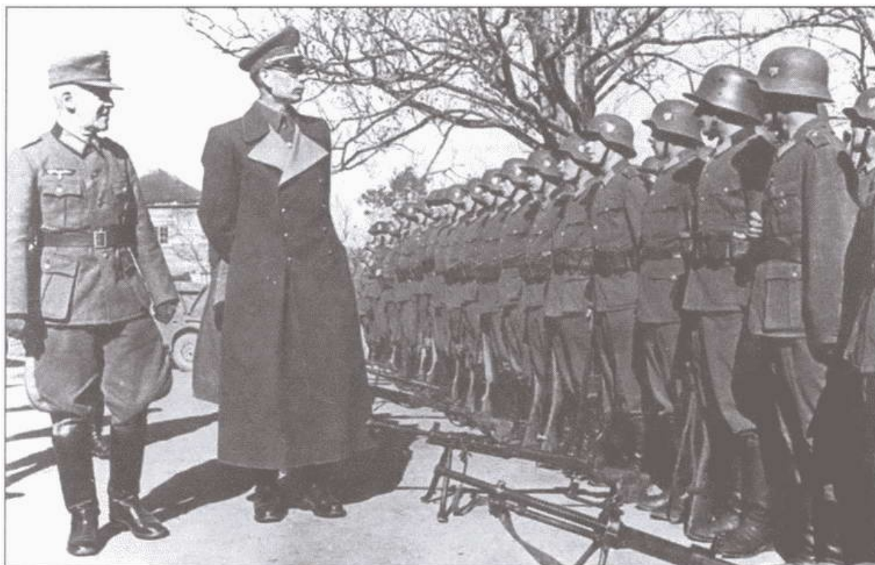
Генерал Власов инспектирует бойцов РОА