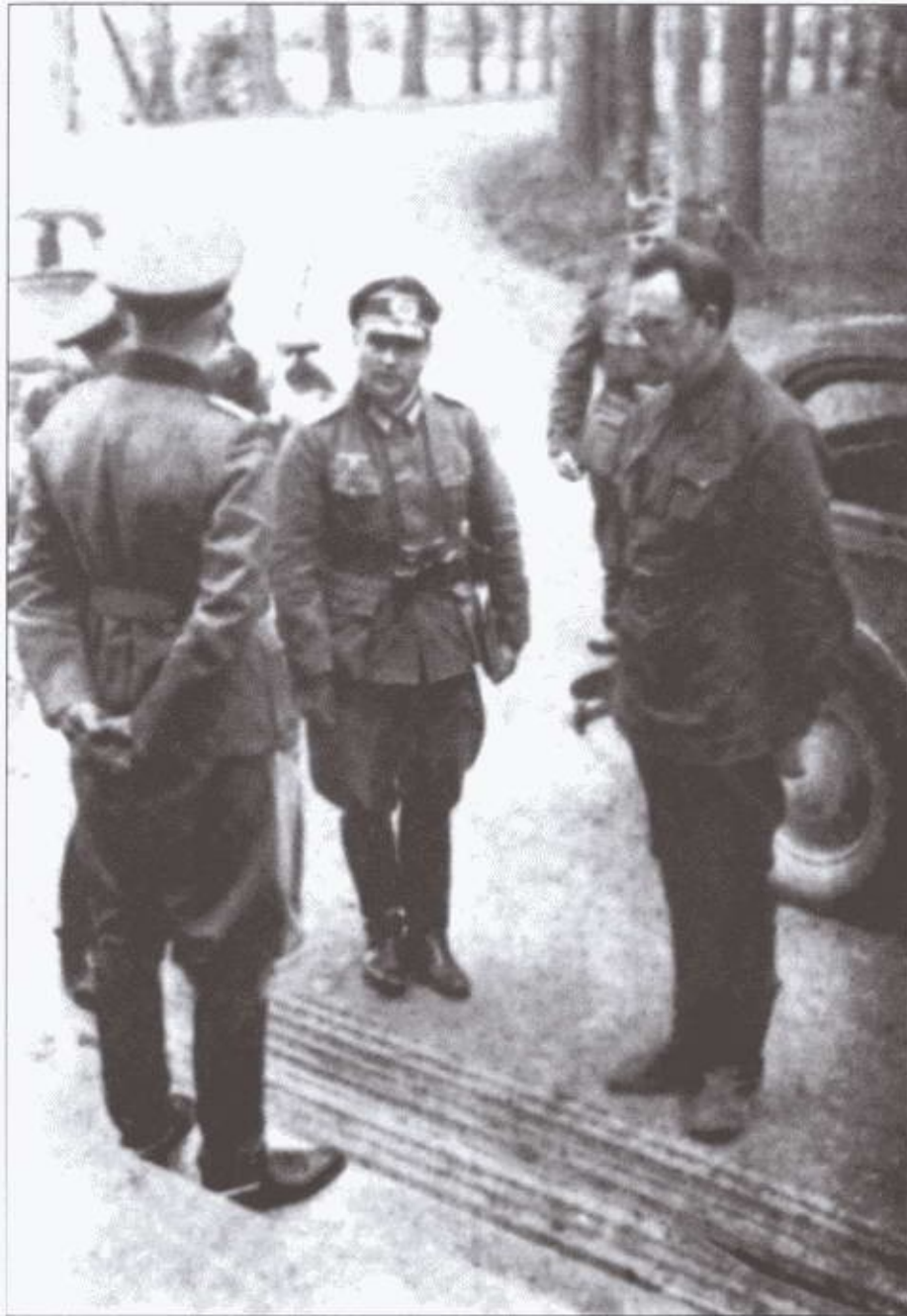
Генерал А.А. Власов доставлен в штаб 18-й армии