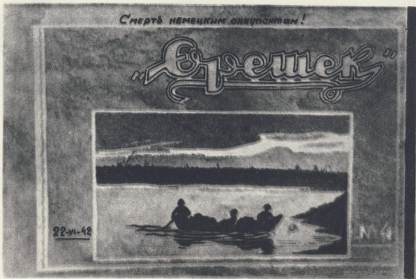
Обложка окопного журнала «Орешек».