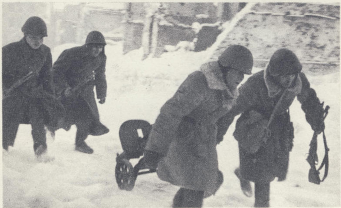
Пулеметчики выходят на огневую позицию.