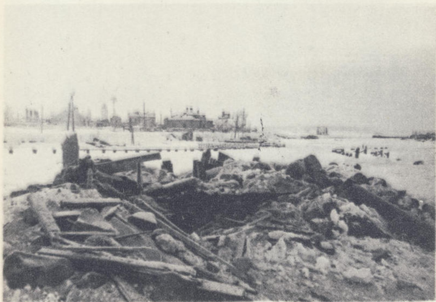
Разбитая огневая точка фашистов на бровке Ново-Ладожского канала.