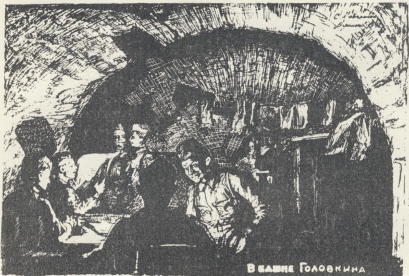
В башне Головкина.