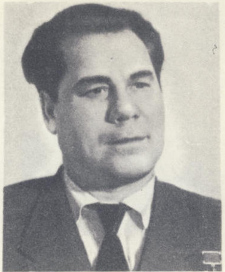
И. С. Зенин, Герой Советского Союза.