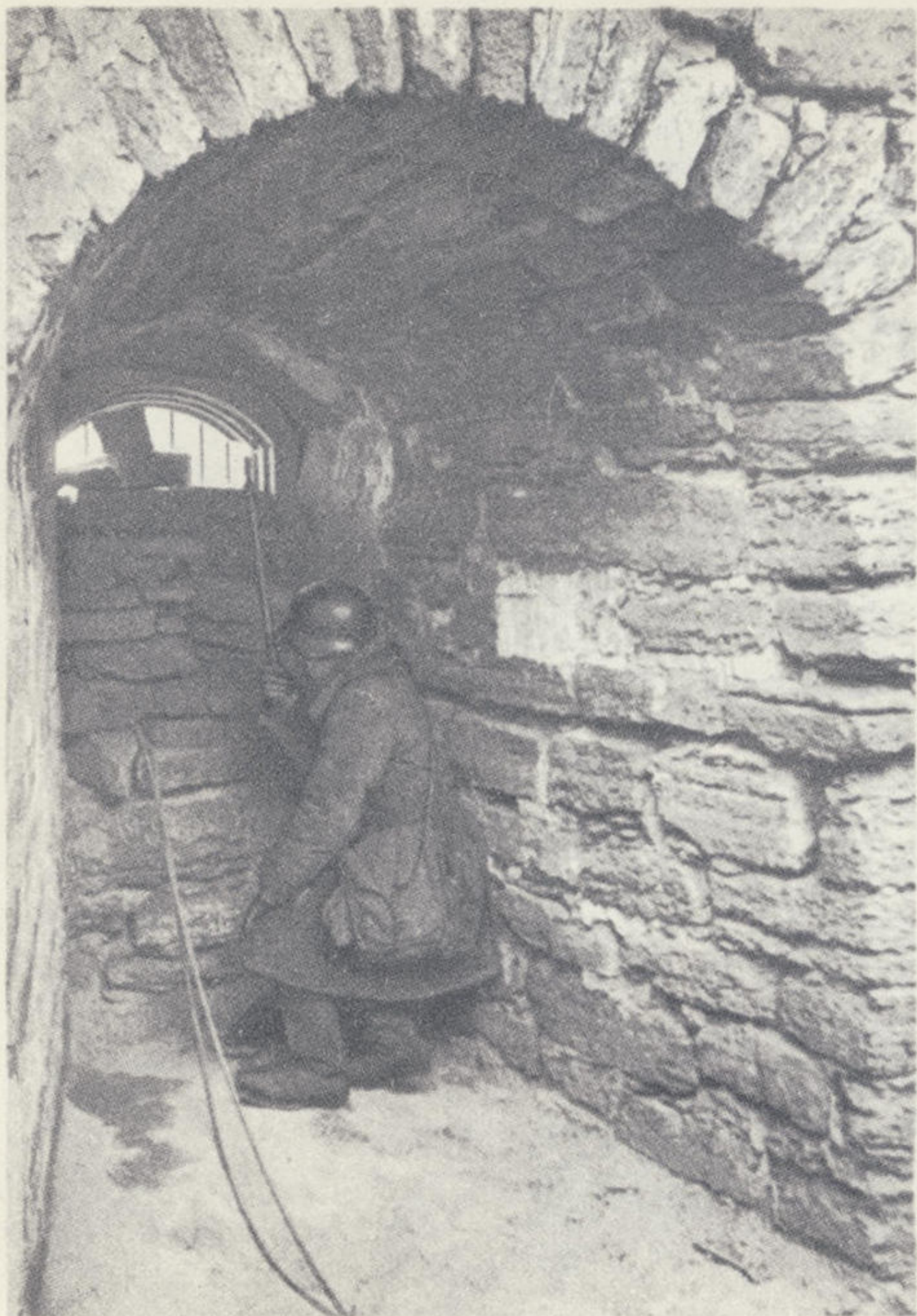
На наблюдательном пункте артиллеристов.