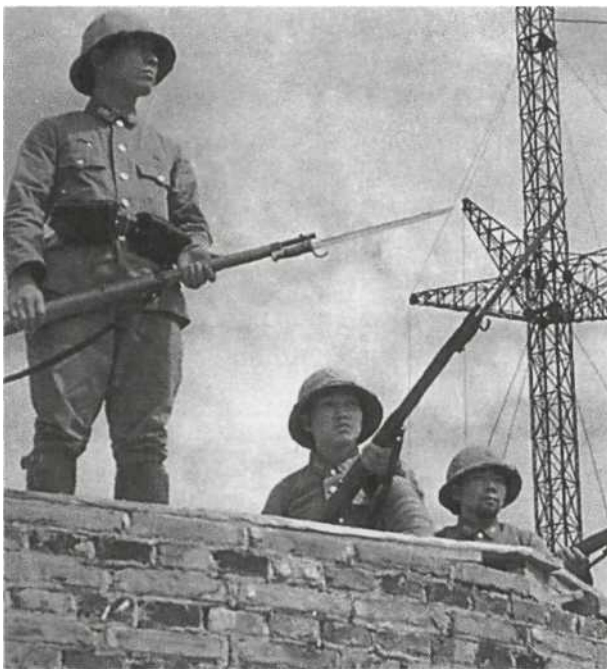
Китай, 1940 г. Трое японских часовых позируют на крыше блокпоста возле радиостанции Ченджу, примерно в 30 милях от Шанхая. Все одеты в униформу Тип 98 (1938 г.); над правым нагрудным карманом у стоящего слева солдата можно разглядеть нашивку в виде литеры «М», цветом по роду войск. Пробковые шлемы солдатского образца (второй вариант солнцезащитного шлема) — наиболее распространенная модель. При исполнении обязанностей в карауле снаряжение сведено к минимуму: только поясной ремень с двумя подсумками.

громадные территории. Однако захват сырьевых ресурсов на юге не снял стоявшую перед Японией главную проблему — продолжение войны в Китае. Здесь громадные пространства с рассеянными на них войсками поглощали большую часть материальных средств и личного состава японской армии. Из-за этого пришлось отказаться от планов по захвату Цейлона и, возможно, даже Австралии, и сосредоточиться на концентрации сил для обороны.