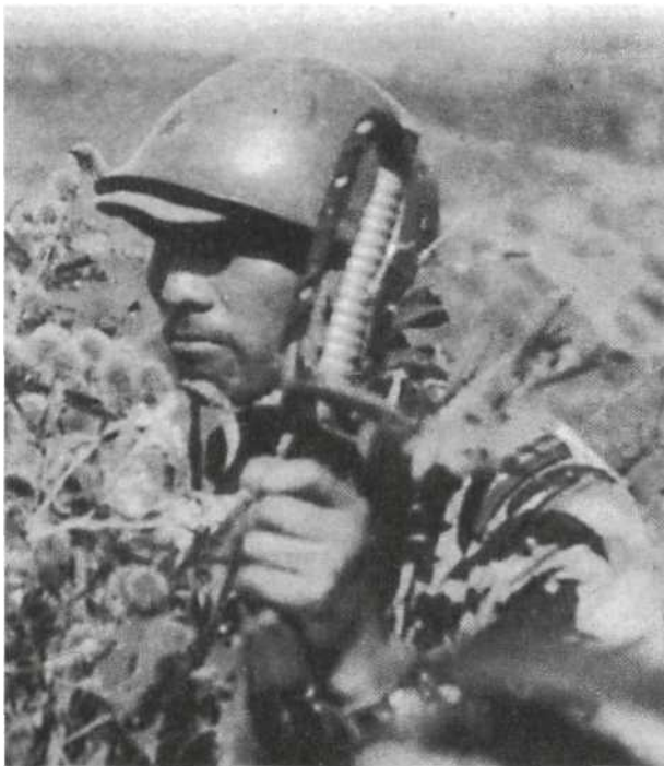
Китай. 1938 г. Второй лейтенант в наблюдении — он все еще носит на своем летнем мундире образца 1930 г. контрпогоны. Согласно распространенной практике, полевое кепи надето под стальной шлем. В левой руке кю-гунто — офицерская сабля европейского образца с темляком и кистью от меча шин-гунто, намотанными на дужку гарды.

а над шинелью привязывалась свернутая плащ-палатка. Остальное снаряжение носилось отдельно: оно включало брезентовую «сухарную суму», металлическую флягу (выпускались в нескольких вариантах) и противогазную сумку.