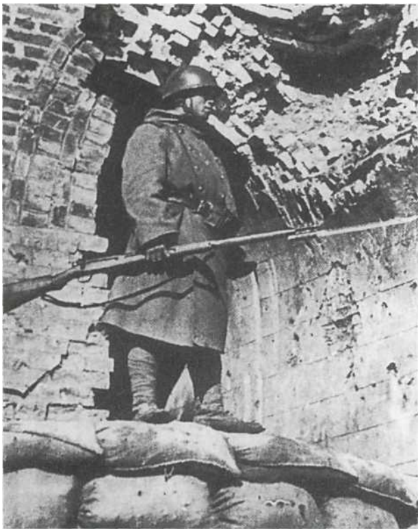
Часовой в Китае в форме для сурового зимнего климата — двубортной шинели образца 1930 г/ (Тип 90) с пристегнутым капюшоном. На фотографии хорошо видна 6,5-мм винтовка Арисака Тип 38 (1905 года) с примкнутым длинным штыком — основное стрелковое оружие в течение всей войны.

такого типа с номерами от 58-го по 70-й (за исключением 61-й и 64-й) применялись преимущественно для ведения антипартизанской борьбы в Китае. Например, 69-я (Хиросакская) дивизия состояла из 82—86-го и 118—120-го отдельных пехотных батальонов, комплектовавшихся в префектурах Акита, Ямагата и Аомори, а также 69-х инженерной и транспортной частей.