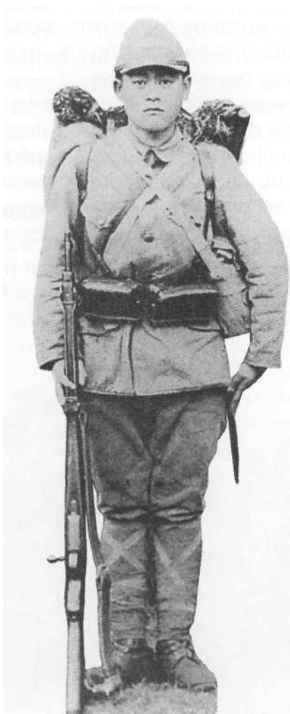
Стандартная зимняя униформа Тип 98 (1938 г.) из плотной шерстяной ткани, без видимых знаков различия. Обратите внимание на различный цвет отдельных элементов форменной одежды: полевое кепи и мундир заметно светлее брюк. Поверх обмоток наложена характерная брезентовая лента. Солдат несет полную маршевую выкладку с ранцем из коровьей шкуры; брезентовый малый ранец и фляга на кожаном ремне надеты через правое плечо и сдвинуты назад (они не видны на фотографии); под левой рукой — противогазная сумка; стандартный кожаный поясной ремень с двумя подсумками спереди (третий размещен на поясе сзади). Винтовка — 7,7-мм Арисака Тип 99 с проволоочной одноногой сошкой.

Защитные пробковые шлемы также выпускались в двух модификациях. Летние шлемы покрывались хлопчатобумажной тканью, а зимние снабжались меховой подкладкой. Летние шлемы удерживались на голове с помощью кожаного подбородного ремня, который у основания шлема делился на две части, оставлявшие уши открытыми. У зимнего варианта шлема верхняя часть подбородного ремня была заменена наушниками на меху. Существовал и еще один