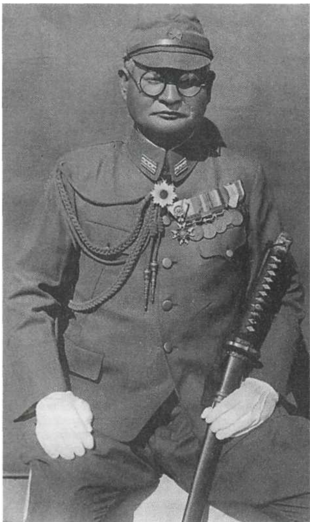
Студийный портрет полковника в служебной форме 1938 г., при белых служебных перчатках. Обратите внимание на знаки различия на воротнике и на ряд наград на груди. Среди наград орден Восходящего Солнца, орден Священного Сокровища, а также медаль «За пограничный инцидент», врученная участникам боев с Красной Армией на монгольской границе. Аксельбанты полагались адъютантам и военным атташе.

шее внимание на недостатки японского оружия. Оружие, поступавшее на вооружение между 1931 и 1941 гг., в целом было удовлетворительного качества, но часто устаревшей конструкции. Оно соответствовало требованиям начального периода войны на Тихом океане, но вплоть до 1941 г. новых видов вооружения в армию почти не поступало. Японцы должны были обходиться, чем есть, тогда как их противники постоянно снабжали свои войска новым, все более совершенным оружием.