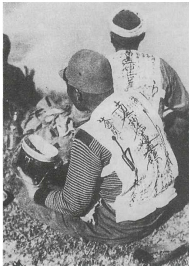
Китай, 1930-е гг. Двое японских солдат сбросили свои мундиры на время обеда. Один из них одет в пуловер гражданского образца; оба носят короткие «епанчи» — ритуальную «защиту»: на этих накидках начертаны «сутры лотоса» и просьбы о благословении Будды.

Гражданское общество всеми средствами поощрялось и принуждалось к сплочению вокруг национальных интересов, которые определяло правительство. Плотная и все покрывающая сеть контроля опуты-