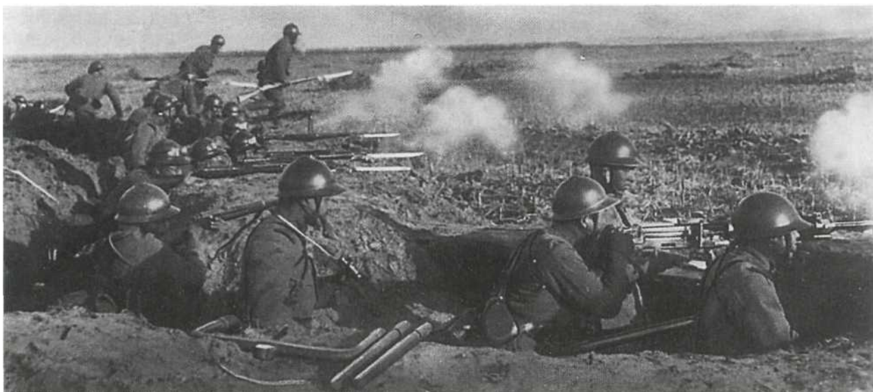
Маньчжурия, начало 1930-х гг. Постановочная пропагандистская фотография, изображающая начальную фазу атаки японской пехоты. Почти все солдаты носят первую модель стального шлема с «цветком сакуры» на своде - эти каски, очень похожие на французские шлемы «Адриан», проходили испытания в войсках в 1930 г. Тем не менее, у солдата справа (одного из номеров расчета станкового пулемета Тип 3) стальной шлем образца 1920 г., похожий на британскую каску. Обратите внимание, что некоторые из солдат в траншее носят на стальных шлемах очки: возможно, что это моторизованная часть.

ленты завязывались под подбородком. В принципе, завязать ленты можно было по-разному, и в армии и на флоте были приняты отличающиеся варианты. Позже, в ходе войны, была принята упрощенная система лент. Внутри стального шлема имелось несколько завязок для подгонки под нужный размер. Стальной шлем образца 1932 г. имел невысокую репутацию: он обеспечивал недостаточно надежную защиту. Материалом для него служила хромово-молибденовая сталь невысокого качества, которая легко пробивалась пулей или деформировалась. Шлемы, как правило, снабжались матерчатыми камуфляжными чехлами, выкраиваемыми из четырех сегментов. Чехлы крепились к шлемам завязками, а спереди имели нашитую желтую звездочку.