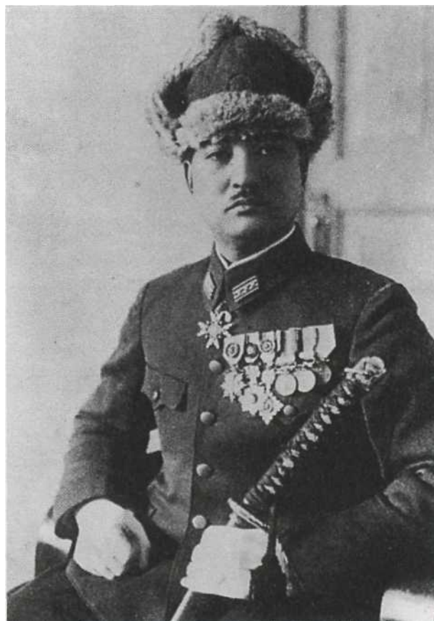
Полковник Императорской армии позирует для студийного портрета где-то в Китае. Он одет в униформу образца 1938 года с офицерской меховой шапкой, в руке — меч шин-гунто традиционного самурайского образца. Воинское звание тай-са отчетливо видно на воротнике: на узкой красной петлице с золотым кантом три серебряных звездочки поверх трех золотых полосок.

Именно этот головной убор стал в рассматриваемый период наиболее характерной чертой облика японского солдата. Полевые кепи выпускались в нескольких немного различающихся вариантах, но в целом их вид оставался неизменным вплоть до 1945 г. Иногда эти головные уборы описывают как «пилотку с козырьком»: колпак «пилотки» плотно надвигался на голову и вы-