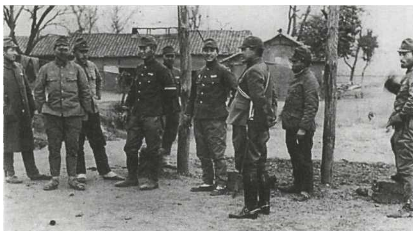
Китай, 1940 г. Интересная групповая фотография офицеров и солдат во внеслужебной обстановке. Самый левый солдат одет в однорортную шинель образца 1938 г., остальные носят мундиры образца 1938 г. (слева и справа) и модифицированный мундир 1930 г. (в центре); обратите внимание также на разные оттенки ткани цвета хаки. Обувь — коричневые кожаные ботинки, таби и сандалии, у сержанта (четвертый слева) — кожаные гетры. Среди знаков различия можно увидеть красно-белую нарукавную повязку, означающую выполнение временных обязанностей в течение недели (четвертый слева) и желто-красный шеврон капрала, призванного из запаса (справа). Офицер (в центре) с красно-белым шарфом через плечо, обозначающим выполнение временных обязанностей в течение недели.

Стальной шлем образца 1932 г. фиксировался на голове системой лент, связанных между собой на затылке и спускавшихся за ушами и в области скул;