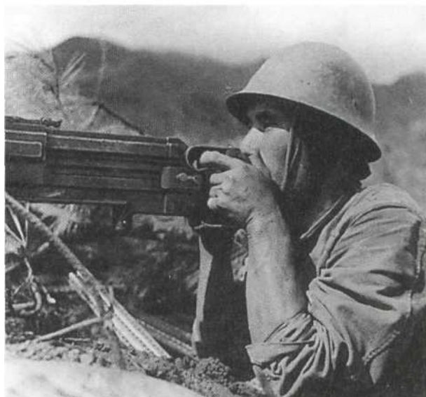
Китай. Пулеметчик одет в летний мундир образца 1930 года со знаками различия, переставленными на воротник. Он ведет огонь из станкового 6,5-мм пулемета Тип 3. Этот пулемет, принятый на вооружение в 1914 г., был разработан на базе французского «Гочкиса».

Рабочая одежда. В японской Императорской армии существовали различные типы рабочей одежды. Первый, для использования в летнее время, пред-