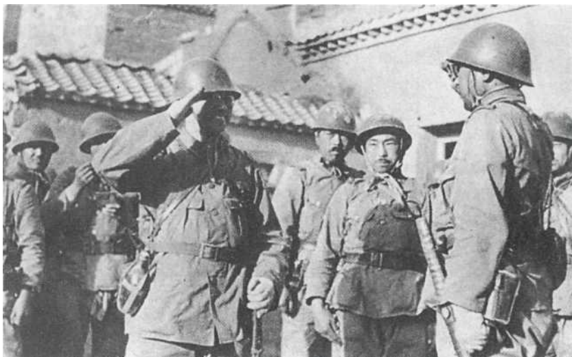
Китай, конец 1930-х гг. Двое офицеров приветствуют друг друга во время перерыва в боях против отрядов Гоминдана. Все изображенные на фотографии носят летнюю униформу образца 1930 г. со стандартными стальными шлемами образца 1932 г. У офицера на переднем плане справа хорошо видны неуставной меч-катана с обвитой кожей рукоятью и фляга ранней модели; у второго офицера фляга позднего образца, более округлой формы.

Далее командование последовательно шло от командующего личным составом Имперского Генерального штаба к нескольким армейским группам (например, Китайской экспедиционной армии), состоявшим под руководством маршала или полного генерала. В армейскую группу входило два или более именных или номерных фронта под командованием полного генерала или генерал-лейтенанта, во фронт — две или более номерные армии и в некоторых случаях — воздушная армия. Так, Центрально-Китайский фронт имел в своем составе 11-ю, 13-ю и 23-ю армии. Армия (по сути, соответствовавшая корпусу в западноевропейских вооруженных силах) состояла под командованием генерал-