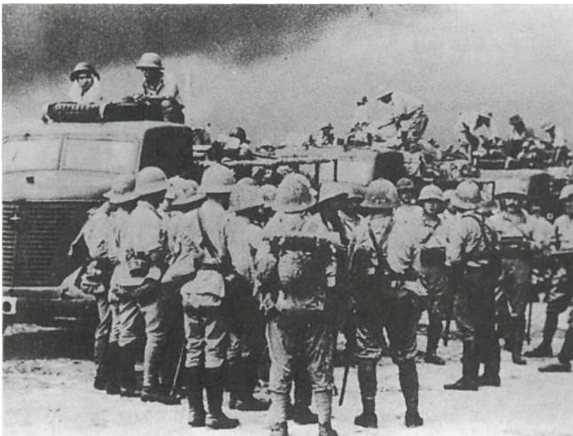
Пехотная часть готовится к погрузке на грузовики «Ниссан 80» во время наступления на Тихом океане в 1942 г. Все солдаты и офицеры одеты в униформу для тропиков и пробковые шлемы 2-го образца, многие в рубашках с коротким рукавом. Моторного транспорта явно не хватало, но тот, что был в наличии, всегда широко применялся в наступательных операциях.