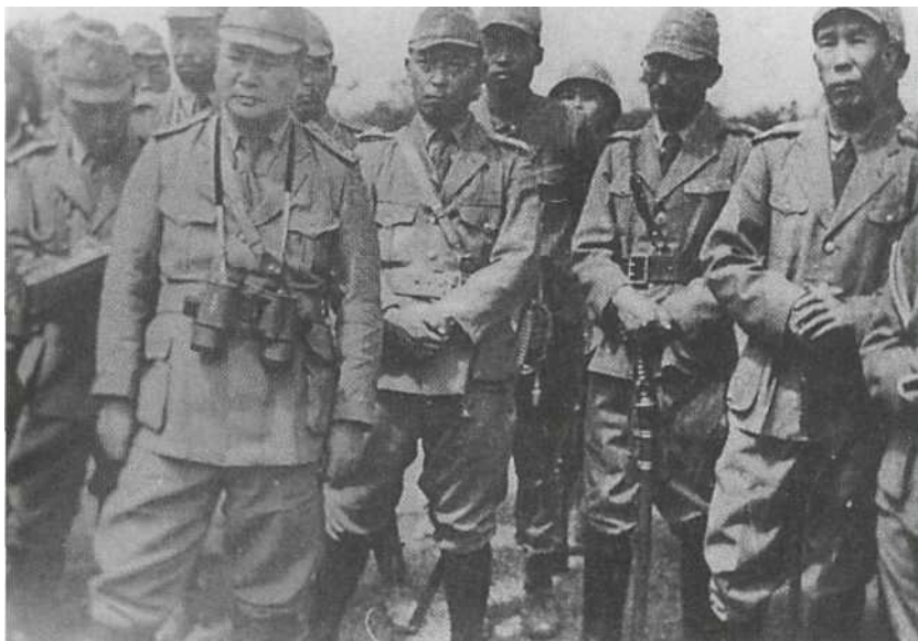
Шанхай, Китай, лето 1937 г. Офицеры наземных сил флота осматривают место высадки. Они одеты в мундиры образца 1937 г. «морского» зеленого цвета с раскрытым воротом над рубашкой с галстуком. Военские звания обозначены на погонах — у капитана на переднем плане слева три цветка сакуры, соответствующие армейским звездочкам. У всех полевые кепи с небольшим золотым знаком в виде якоря.

пространение националистических идей среди офицерской армейской молодежи вело к тому, что «традиционные» мечи все больше вытесняли «европейские» сабли. В конце концов это движение было поддержано официальным введением в 1934 г. меча Тип 94 шин-гунто , или «нового военного меча»: современной версии тати , выпускавшейся промышленным способом. Этот меч носили в расписанных металлических или деревянных ножнах, иногда плотно закрытых матерчатым чехлом. К поясному ремню ножны подвешивались одним или двумя пассиками, причем нижний мог отстегиваться.