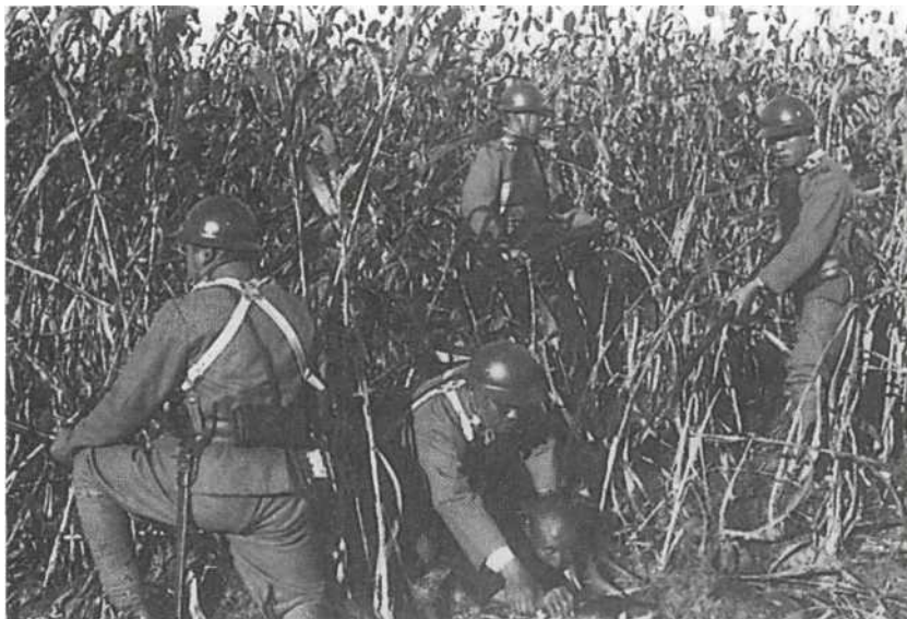
Маньчжурия, начало 1930-х гг. Постановочный снимок, изображающий японский патруль при задержании вооруженного пистолетом китайского партизана на поле гаюляна. Все солдаты носят блестящие новые стальные шлемы, увенчанные изображением цветка сакуры, и униформу образца 1930 г. из шерстяной ткани. У солдата слева хорошо виден поддерживающий ремень вертикальный матерчатый хлястик, расположенный между ремнями Y-образного крепления штыковых ножен. Особенно интересны нагрудные металлические кирасы раннего образца, которые носят солдаты. Кирасы застегиваются на спине перекрещивающимися кожаными ремнями из светлой кожи.

Стандартный батальон (командир батальона — майор) был четырехротного состава, по 181 человеку в роте. Кроме того, в батальоне имелась пулеметная рота (12 станковых пулеметов) и батальонный артиллерийский взвод (2—70-мм орудия). Стрелковой ротой командовал капитан