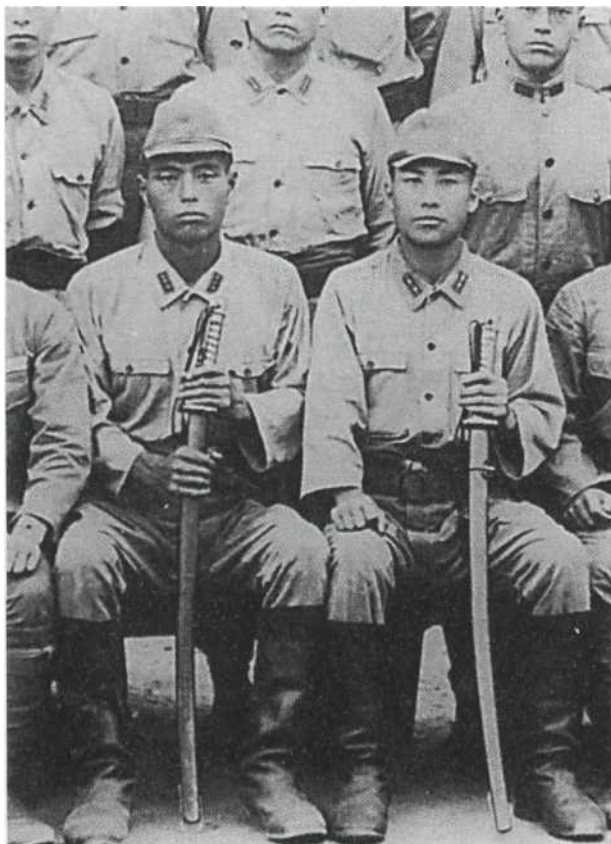
Август 1940 г. Старший рядовой (слева) и сержант в летних рубашках со знаками различия на воротнике и в коричневых кожаных сапогах. У обоих - унтер-офицерские мечи шин-гунто образца 1935 г. с коричневыми кожаными темляками-ремнями. У некоторых солдат на фотографии мундиры образца 1930 г. со знаками различия, переставленными на воротник. (Из коллекции Ричарда Фуллера)

лую металлическую накладку, прикрывающую вентиляционное отверстие, еще по паре вентиляционных отверстий имелось справа и слева; для фиксации шлем снабжался коричневым кожаным ремешком. Вообще-то тропические шлемы такой конструкции предназначались офицерам японской армии, но на фотографиях той поры можно видеть и солдат в солнцезащитных шлемах такого образца.