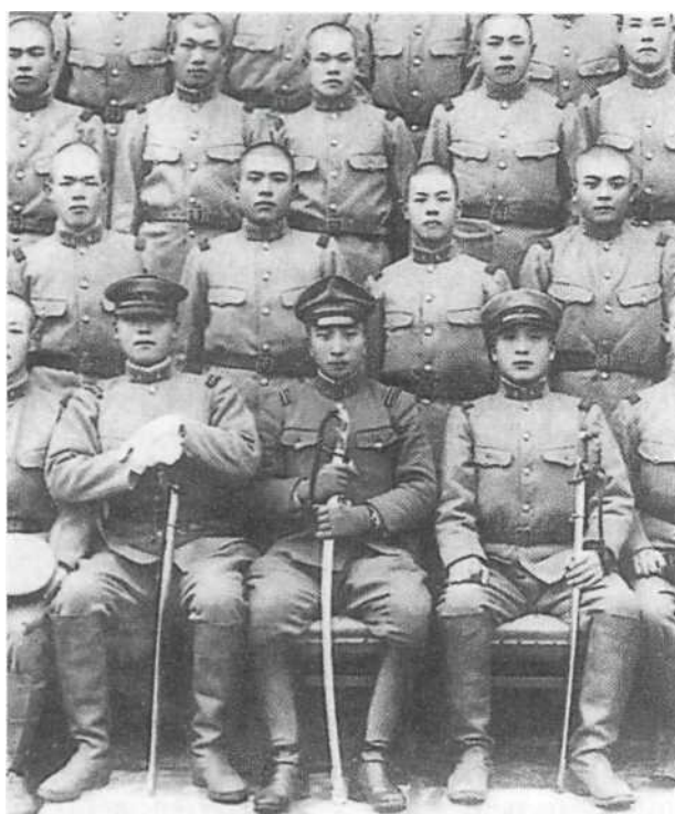
Часть групповой фотографии офицеров и солдат кавалерийской части, состоявшей на службе марионеточного государства Маньчжоу-Го в 1930-х гг. Военнослужащие одеты в униформы Тип 90 с зелеными петлицами с латунными или медными цифрами по номеру части. Капитан (в центре) сильно загнул тулью фуражки — неуставная, но распространенная практика в то время. Обратите внимание на сабли европейского типа — кию-гутто.

лии. Ввоз стратегического сырья из так называемой «Южной сырьевой области» (в основном европейских и американских колоний в Юго-Восточной Азии и на тихоокеанских островах) не давал гарантий бесперебойных поставок в случае усиления международной напряженности и тем более войны. В Японии к власти пришло милитаристское, шовинистически настроенное правительство — после 1932 г. 9 из 11 премьер-министров страны были военными. Милитаризация Японии неизбежно вела к росту международной напряженности и введению торговых эмбарго, что в