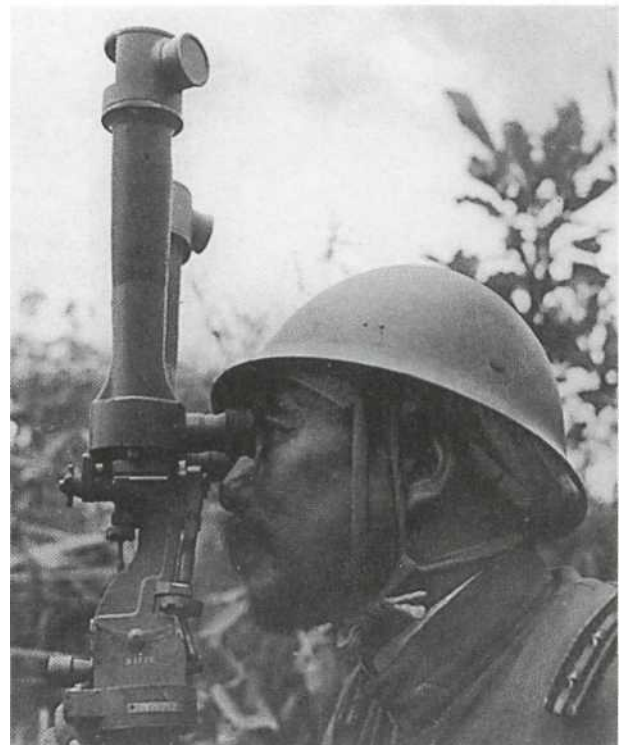
Китай, середина 1930-х гг. Этот бородатый капитан, который смотрит в стандартный бинокулярный телескоп командира батареи, вероятно артиллерист. Поэтому «ласточкины хвосты» на воротнике его мундира образца 1930 г. должны быть желтыми. Обратите внимание на длинный поперечный контрпагон с обозначением звания и на сложную систему ремней, поддерживающих шлем образца 1930/32.

Полевое снаряжение офицеров обычно включало перевязь для меча, полевую сумку (планшет), бинокль в коричневом кожаном футляре и флягу. Пере-