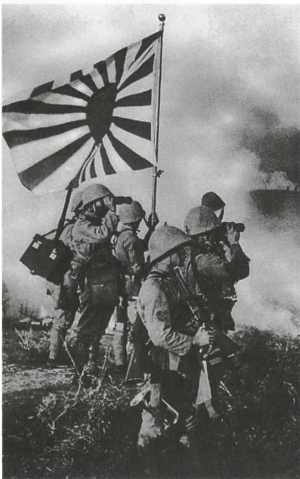
Филиппины, весна 1942 г. Военнослужащие наземных сил флота наблюдают за артиллерийским обстрелом американских частей, отступающих вглубь полуострова Батаан, к северу от Манильского залива. Японцы одеты в униформу наземных сил флота «морского» зеленого цвета с брезентовыми чехлами на стальных шлемах. У горниста на переднем плане на рукаве видна нашивка со скрещенными якорями — знак различия матроса второй статьи. Военно-морской флаг (с солнечным диском, смещенным к древку) увенчан золотым шаром.