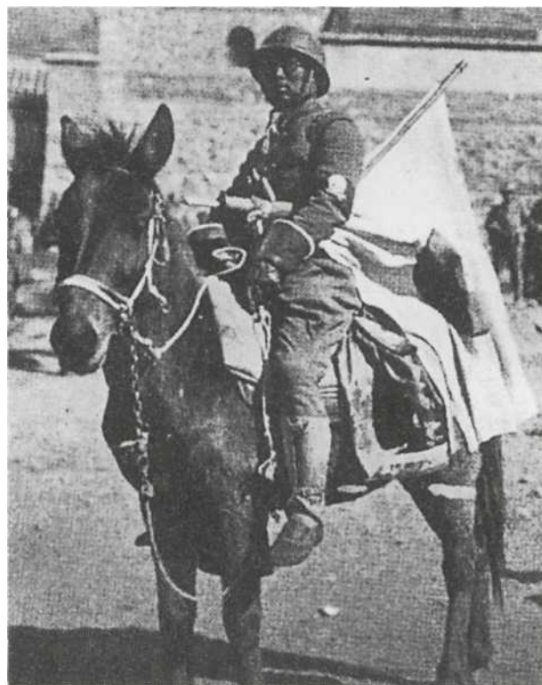
Маньчжурия, 1932 г.: неизвестный офицер на коне. Он одет в зимнюю униформу Тип 90 (1930 г.) из плотной ткани, дополненную кожаными гетрами и подбитыми мехом перчатками с крагами. На рукаве — повязка с «мертвой головой»; не известно никаких официальных источников относительно таких эмблем, и сама символика скорее западного, чем восточного происхождения. Тем не менее некоторые источники упоминают о существовании таких эмблем у элитных штурмовых частей в Маньчжурии; За пояс заткнут короткий «штатский» меч вакидзаси.

Красная повестка ( акагами ) вручалась через местную полицию и военного чиновника, как правило, рано утром. Родственники и соседи призывника должны были провожать его с благословениями, устраивая праздник, вывешивая флаги и выказывая свою радость. В военное время женщины из семьи призывника и соседки дарили ему «пояс с тысячью стежками» ( сенинба-