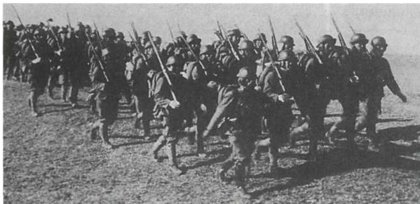
Маньчжурия, 1931 г.: колонна японской пехоты на марше — поверх меховых шапок солдаты надели стальные шлемы 2-го образца (введенные в 1930 г.): эти каски напоминают германские, но имеют удлиненные козырьки.

гибели имя солдата будет занесено в списки токийского храма Ясукуни — там поминались все японцы, павшие в битвах. В определенном смысле призванный в армию человек уже считался мертвым: его жизнь полностью принадлежала императору, представители которого могли использовать ее, как считали нужным. Флаг с красным солнцем должен был развеиваться над домом солдата до его возвращения или до гибели, в этом случае к флагу добавлялся черный вымпел. При гибели солдата семья могла надеяться на получение небольшой коробочки, в которой, как считалось, находился прах покойного; на самом деле, в войну коробочки часто были пустыми или содержали пепел тех из убитых сослуживцев, которым посчастливилось быть кремированными после смерти.