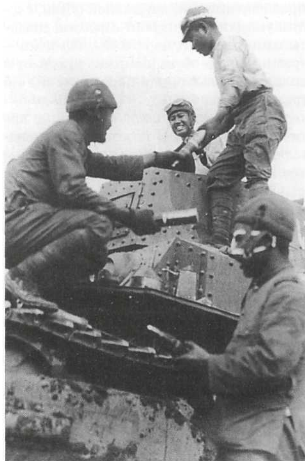
Экипаж среднего танка Тип 89В из 13-го танкового полка в Китае загружает через башенный люк боеприпасы для 57-мм пушки. У троих танкистов — легкие летние противоударные танковые шлемы, у танкиста в башне шлем дополнен защитными очками. У солдата на переднем плане внизу, по-видимому, перевязана рана на лице.

Короткие пелерины (длиной до пояса) носили офицеры в конном строю и чины военной полиции; существовали образцы пелерин Тип 90 и Тип 98. И та, и другая пелерина застегивались на груди на пуговицы, но вариант 1938 г. отличался знаками различия по чинам, нашитыми на стояче-отложной воротник.