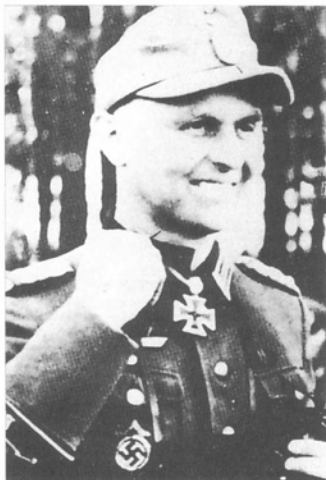
Подполковник Карл-Гейнц Эстервиц из 800-го показательного строительного полка специального назначения в момент получения дубовых листьев к Рыцарскому кресту. В нижней части правого рукава заметна редко носившаяся лента «Бранденбург»; над ней должна располагаться нарукавная нашивка егерских частей с изображением пучка дубовых листьев.

или были убиты жаждавшими мести чехами, но некоторые, воспользовавшись своими навыками, смогли пробраться на Запад, выдавая себя за беженцев.