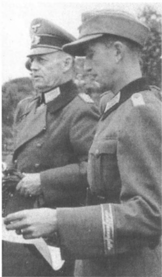
Лейтенант, сопровождающий генерал-фельдмаршала фон Рундштедта, не носит «боевых рук» на погонах, но на его рукаве хорошо виден последний вариант дивизионной ленты Feldherrnhalle.

После разгрома 119-го пехотного полка вместе с 57-й пехотной дивизией, наследником традиций полка «Лист» вновь