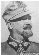
Генерал горнострелковых войск Юлиус Рингель, командир 5-й горной дивизии, в период боев за Крит. Популярный и узнаваемый «Папа» Рингель неизменно носил усы и бородку.

летнего поля. Поскольку каждый самолет мог принять на борт всего 12 солдат со снаряжением и вооружением, требовалось совершить большое число рейсов. Вторую волну планировалось переправить морем, высаживая десант там же в Малемесе. Для этого командир дивизии генерал-лейтенант Юлиус «Папа» Рингель решил использовать флотилию более чем из 60 небольших греческих рыболовных судов (каиков). Катастрофа произошла 19 мая, когда кайки были перехвачены в море боевыми судами британского флота: из двух полных батальонов, размещенных на суденышках, Крита достигли всего 52 человека.