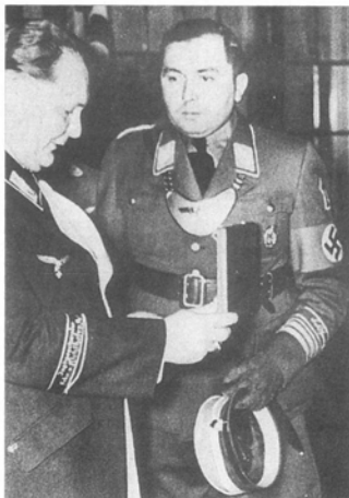
Дивизия «Фельдхеррхалле» имела крепкие политические корни. Этот бригадфюрер СА, отдающий рапорт рейхсмаршалу Гиндле, носит такой же горжет и нарукавную ленту, как и в армейских частях «Фельдхеррхалле». (Джозеф Чарита)

кроя. Она была разработана и официально принята в 1939 г., но так и не получила широкого распространения. Предполагалось, что эта форменная одежда должна стать стандартной формой части после окончательной победы над противником. Специальная форменная одежда включала мундир ( Wafferrock ) и шинель; головной убор и брюки полагались стандартного образца.