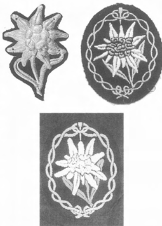
Эдельвейс — символ горных войск: Вверху слева — значок для ношения на головном уборе. Выполнен из белого металла, тычинки цветка выкрашены в золотистый цвет. Вверху справа — вышитая машинным способом на рукавную нашивку. Используются золотисто-желтые, белые и тускло-зеленые нити, веревка и скальный крюк серебристо-серые. Внизу — тканый вариант на подложке.

стрелковая не входила в число соединений, предназначенных для участия в этой операции: ее включили в последний момент из-за недостатка наличных сил. Со своей базы в Греции дивизия была перевезена на Крит, чтобы поддержать уже высадившихся там парашютистов. Первую волну десанта 1 транспортными самолетами люфтваффе Ju52 должны были перебросить на аэродром Малемеса сразу после захвата