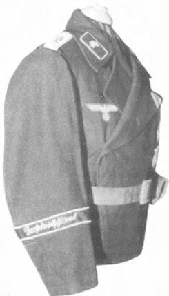
Уникальный экземпляр куртки танкиста, проходившего службу при штаб-квартире Гитлера в составе бригады сопровождения фюрера. Вместо традиционных розовых «танкистских» кантов, на петлицах и погонах выпушки белого цвета. На левом рукаве лента «Führerhauptquartier», на правом — «Großdeutschland». (Круп Бунцайер)

Чины подразделения полевой полиции дивизии ( Feldgendarmietrupp «Großdeutsch-