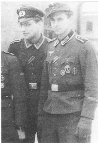
Унтер-офицер справа носит наркукавную ленту «Feldherrnhalle» и «боевые руны» СА на погонах. Полный набор знаков отличия в дивизии носили редко; на многих фотографиях у солдат отсутствуют либо руны на погонах (чаще всего), либо наркукавная лента, либо и то, и другое. Вероятно, еще до войны для частей СА запасли много наркукавных лент, и снабдить ими войска оказалось легче всего. (Роберт Носс)

В составе группы армий «Север» 93-я дивизия вела наступление, прорываясь к Ленинграду. Дивизия понесла тяжелые потери: к октябрю 1941 г. почти две трети ее личного состава выбыло убитыми и ранеными. Осенью 1942 г. оставшийся на северном секторе фронта 271-й пехотный полк в память о его связях с СА получил почетное наименование «Фельдхернхалле». Весной 1943 г. дивизию отвели в Польшу для отдыха и пополнения, а 271-й пехотный полк направили во Францию, где на его базе развернули 60-ю моторизованную дивизию. Соответственно, 93-ю пехотную дивизию вернули на Восточный фронт в район Ленинграда, где взамен 271-го она получила 273-й пехотный полк. Дивизия сражалась при отступлении от Ленинграда и в тяжелых оборонительных боях в Курляндском котле, откуда ее не эвакуировали морем в Восточную Пруссию. В марте 1945 г. дивизия была уничто-