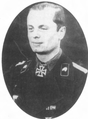
Капитан Вольфганг Кольтерман, командир 3-й роты 507-го тяжелого танкового батальона. Кольтерман был очень маленького роста, что, однако, компенсировалось его отвагой.

но был перехвачен Советской армией и взят в плен.