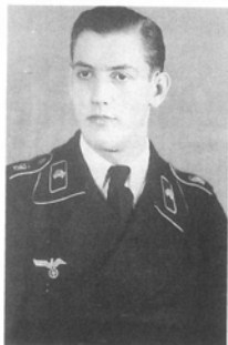
Молодой солдат танкового полка «Великая Германия» позирует перед фотоаппаратом в своей черной танкистской форме. Обычно при такой форме одежды надевали не белые, а серые рубахи. На погонах из черной ткани видны шифровки «GD», вышитые розовой нитью.