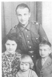
Ефрейтор 2-го моторизованного полка «Великая Германия» с женой и детьми. На погонах под шифровками «GD» можно различить маленькие цифры 2. Эти редкие варианты погон носили только в 1942–1943 гг.

Германии» пришлось выдержать свои самые тяжелые бои за всю войну, причем в исключительно тяжелых условиях. Осенние дожди превратили местность в нечто подобное топким полям Франции периода Первой мировой войны. Бои подо Ржевом, особенно в адской Люеческой долине стоили дивизии 12 тысяч человек.