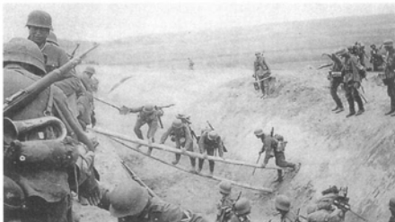
Солдаты пехотного полка «Лист» перебираются через противотанковый ров в период наступления в Советском Союзе. Ни у одного на полевых куртках не видно нарукавных лент. Любопытно, что ротный горнист (слева) все еще носит свой музыкальный инструмент в боевых условиях. (Роберт Носс)