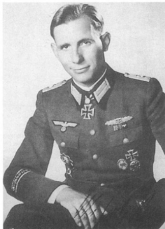
Майор Отто Эрнст Ремер из дивизии «Великая Германия» сфотографирован после вручения дубовых листьев к Рыцарскому кресту. Он был сразу же произведен в генерал-майоры и назначен командиром Дивизии сопровождения фюрера. Ремер принимал участие в «чистках» в Берлине после неудачного покушения на Гитлера, 20 июля 1944 г.

Наиболее заметным знаком отличия большинства элитных частей были нарукавные ленты. Впервые они появились в июне 1939 года: по темно-зеленой полосе из искусственного шелка шла вышитая машинным способом алюминиевой нитью надпись « Großdeutschland ». Шрифт надписи был готическим; по краям ленты проходили вышитые такой же алюминиевой нитью каемки. Ленту полагалось носить на