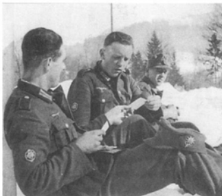
Горные егеря на отдыхе. Хорошо видны нарукавные нашивки с изображением эдельвейса и металлический значок на отвороте горного кепи. (Ян Джевисон)

Помимо обычной символики горных войск, в 5-й горной дивизии существовал неофициальный значок, который носили