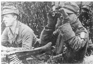
Солдаты 3-й горнострелковой дивизии на Восточном фронте, 1942 г. Ober-ефрейтор (с биноклем) — ветеран сражения за Нарвик, на что указывает Нарвикский щит на левом рукаве шинели. На левой стороне отворотов горных кепи с короткими козырьками видны значки-едельвейсы.

В тяжелейших погодных условиях горные егеря стойко обороняли свои позиции, удерживая периметр от атак польских, французских, норвежских и британских войск. Гитлер, не знавший, что его командиры готовят отступление, предложил эвакуировать горно-егерские части или предоставить им возможность прорываться в нейтральную Швецию, чтобы быть интернированными, но избежать плена. Но командир дивизии, генерал Эдуард Дитль, убедил Гитлера в том, что его егеря должны удержаться; к этому моменту по-