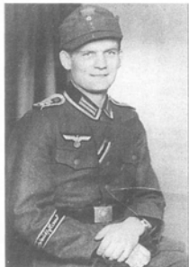
Этот фельдфебель из дивизии «Великая Германия» сфотографирован в период, когда он был откомандирован в охранный полк Берлина. Унтер-офицер сохранил дивизионную нарукавную ленту, но шифровка на погонах временно заменена на готическую литеру «W». (Крис Бунцейер)