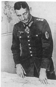
Генерал Эдуард Дитль, «герой Нарвика» и командир 3-й горнострелковой дивизии, после вручения ему дубовых листьев к Рыцарскому кресту. В верхней части левого рукава — Нарвикский щит.

ной атаки американских бомбардировщиков на ее позиции обрушилось более 4000 тонн бомб: американцы в южной Нормандии готовились к началу операции «Кобра». Командир дивизии генерал Байерлейн описывал позиции дивизии после бомбового удара как усеянный кратерами лунный пейзаж. Установлено, что до 70% личного состава дивизии было убито, ранено или выбыло из строя в результате контузий и шока.