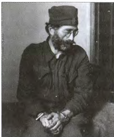
В марте 1946 г. органы государственной безопасности титовской Югославии захватили Д. Михайловича, скрывавшегося в горах Восточной Боснии