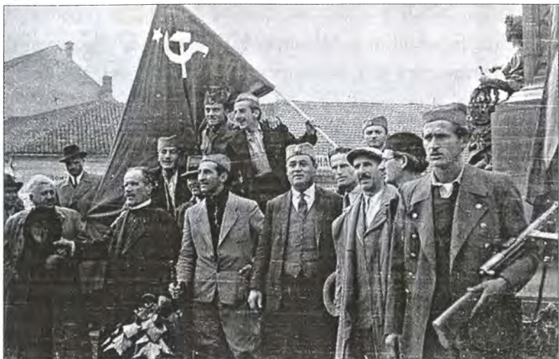
Четники полковника Д. Кесеровича

себе группу охраны, и разослал по четырем выделенным ему приказом волостям по надежному офицеру. Каждому офицеру он дал чету из 25 вооруженных четников и приказ нарастить четы до батальонов 71 .