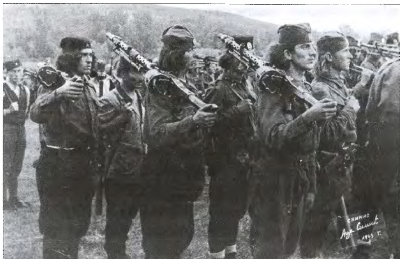
Пулеметчики 3-й жичской ударной летучей бригады 2-го равногогорского корпуса в районе города Кралево

В июле 1943 г. немцы провели силами отдельной команды из состава дивизии «Бранденбург», частями 297-й дивизии, 5-го полицейского полка СС и болгарских частей, в координации с местными представителями СД, еще одну крупную операцию, «Моргенлуфт», с целью захвата штаба движения Д. Михайловича, который они лоцировали на г. Суворбор. Эта операция была подготовлена основательно — вплоть до того, что немецким солдатам из «Бранденбурга» раздали народную сербскую одежду, чтобы они могли инфильтрироваться на линии отхода без привлечения внимания местных жителей, изображая четников. Впрочем, и этот план не помог ликвидировать штаб ЮВвО, хотя после недельных действий немцам удалось убить 11 четников и арестовать 453 подозрительных человека. Параллельно с этой операци-