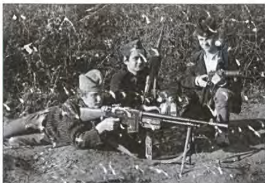
Четники с пулеметом WZ-28, карабином Маузер K98, автоматом Стэн МКIII. Сербия, 1943 г.

Восточной Герцеговины к Сербии, где под властью М. Недича прекратились бы насилия над мирным населением 258 . Вслед за ним группы офицеров ЮВВо (в основном уроженцев мест, где им предстояло действовать) были направлены в Западную Боснию, Северную Далмацию, Лику, Банию, Кордун. Исключением была Центральная Босния (район Санский Мост — Ключ — Мркониц-Град — Яйце), Бания и Славония, где сербам противостояли только усташи, а итальянцев и выбора между гуманными и негуманными оккупантами не было. Там раздоров между повстанцами было немного, местные повстанцы приняли власть коммунистов и в большинстве своем стали убежденными партизанами. Стоит отметить, что численность местного сербского населения сократилась тут намного сильнее, чем на территориях НГХ, контролируемых четниками, где в большей мере сократилась численность хорватов и особенно мусульман.