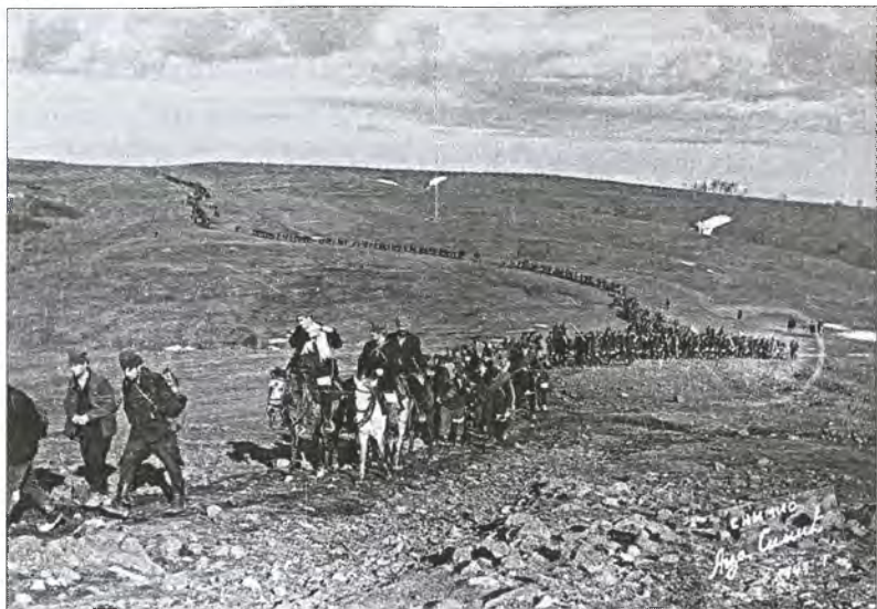
2-й равногорский корпус ЮВВО на марше

службы и координации разлетевшихся от удара немцев отрядов четников. Эта вторая часть штаба также поддерживала связь между первой частью штаба, размещавшейся в районе Равна-Горы, и группой Д. Михайловича, отделившегося от своего штаба и перемещавшегося инкогнито от села к селу по склонам занесенной снегом горы Вуян, гордо возвышающейся над Горни-Милановцем. Затаившись с пятеркой своих приближенных в небольшом домике у с. Ябланица, Д. Михайлович с удивлением узнал от своего радиста, что эмигрантское правительство поспешило присвоить ему звание армейского генерала и назначить министром армии, флота и воздухоплавания. После этого сообщения Д. Михайлович, сидевший с горсткой своих подчиненных на застланном соломой полу горной хижины, печально заметил: «Не знаю,