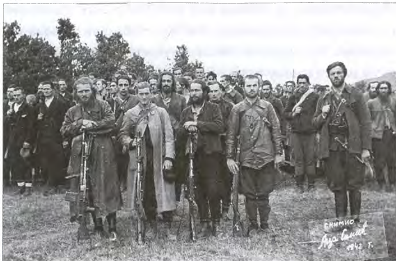
Бойцы 2-го равногорского корпуса ЮВвО

сеть подполья по системе «упряжки» — один находил двух доверенных лиц, из них каждый следующий — еще двух, и т.д., при этом каждый должен был знать лишь 3 человек из организации — двух найденных им подчиненных и своего старшего 69 . Таким образом, к концу 1942 г. в Сербии существовало 6 командных областей формирования и размещения четнической армии: Сербия, Восточная Сербия, Южная Сербия, Старый Рас, Воеводина и Белград, причем последние две действовали ограниченно и имели на своей территории в основном только разведывательную сеть ЮВвО. В 1942—1943 гг. были сформированы следующие корпуса: Авальский, Валеvский, Ябланичский, Варваринский, Делиградский, Златиборский, Иванковацкий, Ястребацкий,