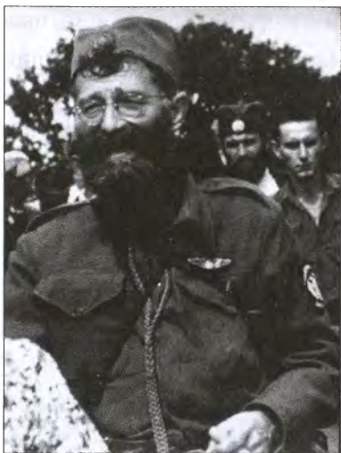
Д. Михайлович, глава военно-четнических отрядов Югославского войска в годы Второй мировой войны

у доверенных лиц. Такой доверенный пособник (серб. «ятак») доставлял скрывающемуся «хайдучу» провиант, размещал его у себя дома в зимнее время, снабжал информацией, получая взамен часть награбленного. Грабеж был одним из основных занятий участников «хайдучии», однако здесь также имелись свои правила и ограничения, которые защищали бедных («честным» считалось лишь нападение на торговцев и сборщиков налогов) и ограничивали убийства (убийства допускались лишь из мести за предательство, а также из «самообороны» при нападении властей и в случае сопротивления жертв грабежа). Кроме грабежей еще одним из занятий участников «хайдучии» было похищение с целью выкупа. Иногда участники «хайдучии» объединялись в отряды — «четы», во главе которых стоял атаман — «харамбаша» 31 . Во времена турецкого господства «хайдучия» представляла собой аналог настоящей повстанческой деятельности в миниатюре. Она была одним из спосо-