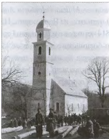
Четники защищали свое право быть православными против усташей и коммунистов. Лика, 1942 г.

Бирчанин получил звание «четнического воеводы» в годы Первой мировой войны, благодаря чему имел право посвящать в «воеводы» четнических командиров в годы Второй мировой войны. В межвоенное время он руководил четническим обществом «Сербская народная оборона». Он прибыл в Сплит в сентябре 1941 г., установил связи с ЮВвО и начал собирать вокруг себя сербских националистов, немало которых укрылось от усташских злодеяний в приморских городах в итальянской зоне оккупации. В марте 1942 г. Бирчанин получил письменное приказание от Д. Михайловича организовывать военные и политические акции в Далмации, Лике, Кордуне и Приморье, что было подтверждено 22 июля 1942 г. во время встречи с Д. Михайловичем в с. Пустополье в районе города Гацко в Восточной