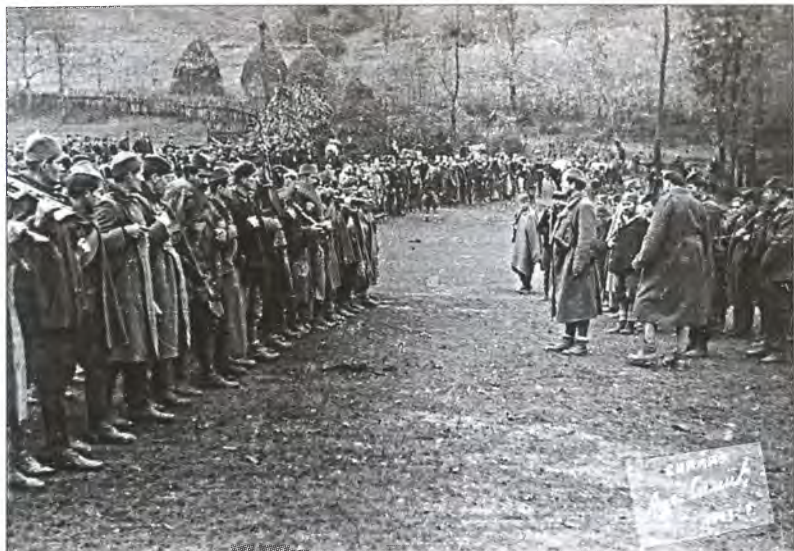
Территориальные части четников ЮВвО Центральной Сербии. 1943 г.

100 мин на миномет; 20 000 комплектов югославской военной формы и 20 000 пар югославских военных сапог. Конкретных договоренностей на этой встрече достигнуто, разумеется, не было. Здесь уместно вспомнить, что на подобное вооружение сербских отрядов полностью лояльного оккупантам М. Недича Гитлер согласился лишь в 1944 г. Осенью 1941 г. немцы были уверены в своих силах и настаивали на безоговорочной капитуляции, которой и потребовал глава немецкой делегации полковник Когарт 97 . Немецкие переговорщики пунктуально отметили в резюме переговоров с Д. Михайловичем, что по-