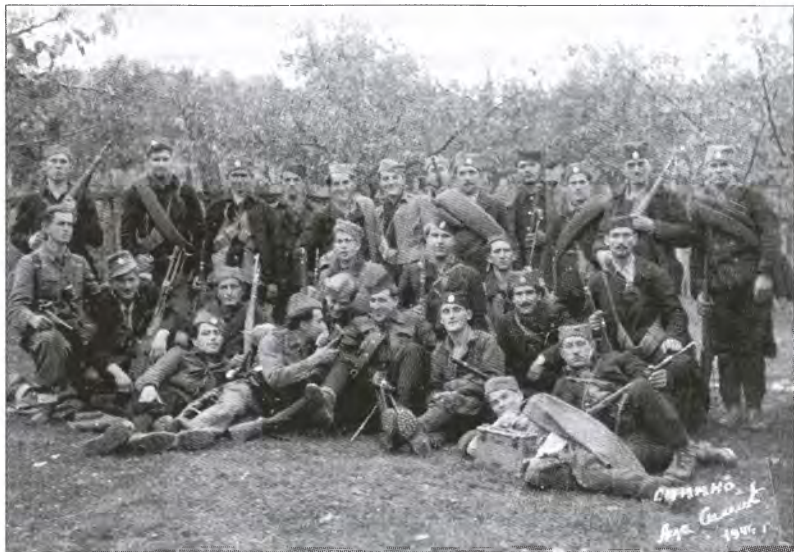
Четники одного из отрядов ЮВВО. 1943 г.