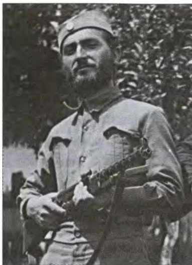
Четник с автоматом ZK-383, Сербия