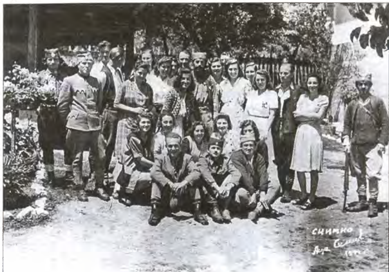
Девушки из организации «Женская равногорская молодежь — Санитарки»

ЮРАМ была организована по приказу Д. Михайловича от 7 ноября 1942 г. До этого на территории Сербии существовали лишь отдельные формации четников, которые в силу молодости большинства своих членов могли быть отнесены к неформальным предшественникам этой организации. ЮРАМ формировался не по образцу партийных молодежных движений, а по модели Молодежного отделения Сербского культурного клуба. Молодежь Сербского культурного клуба в