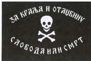
Флаг четников времен борьбы за освобождение Косова и Македонии 1903—1912 гг. Использовался бойцами ЮВВО и в годы Второй мировой войны

В октябре 1912 г. началась Первая балканская война. Сербия, Черногория, Болгария и Греция, благодаря немалым дипломатическим усилиям решили заключить