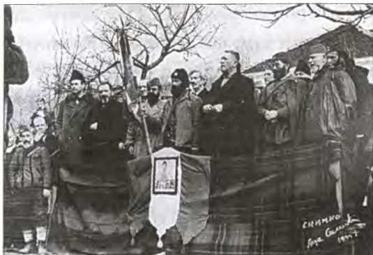
Конгресс равногорцев в селе Ба. В первом ряду справа налево стоят ведущий идеолог ЮВВО Д. Васич, военный лидер ЮВВО генерал Д. Михайлович и офицеры Верховного командования ЮВВО. Январь 1944 г.