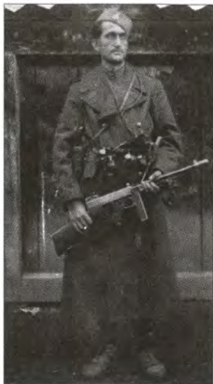
Четник с автоматом Томсон М1928А1, Сербия, 1943 г.

В этой ситуации немцы решили перейти ко второй части своей операции и, изрядно потрепав партизан, переключились на четников. П. Джуришич и его силы внезапно столкнулись с силами наступавшей с направления Печь — Новый Пазар 1-й горной дивизии вермахта и 4-м полком дивизии «Бранденбург», представлявшими значительный контраст с нерешительными итальянцами. Находившийся рядом с П. Джуришичем