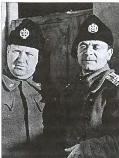
Официальная довоенная униформа четнических отрядов Королевской югославской армии. Характерны череп и кости на петлицах и меховой головной убор с кисточкой

не исчезала из сердец его населения и их соплеменников из сопредельных империй, сохраняясь в менталитете в форме представлений о возможности (в случае необходимости) вмешательства частного лица (частных лиц) в sancta sanctorum любого государства — применение вооруженной силы (насилия) для решения внутренних и внешних конфликтов 34 .