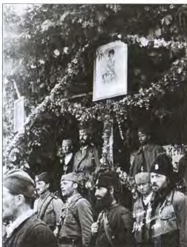
У четников, как у иррегулярных частей, не было стандартной формы

армии. «Справка о составе и дислокации Югославской армии, немецких войск на Балканах на 19 сентября 1944 г. и реакционных войск Павелича, Недича, Михайловича и Рупника на 5 сентября 1944 г.» — оценивала их численность следующим образом: «Войска Михайловича /четники/. На 05.09.44 численность войск составляла около 30 000 человек. Основные силы четников /до 10 000 человек/ находились в Сербии... До 10 000 четников