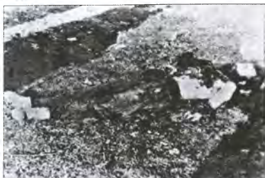
Генерал Михайлович был убит в июле 1946 г., его останки были уничтожены

ной группы ложных повстанцев из офицеров контрразведки, использование этой группы, в состав которой включен один или несколько завербованных боевиков, для поимки лидеров движения. Такую тактику спецгрупп использовали против лидеров националистов на