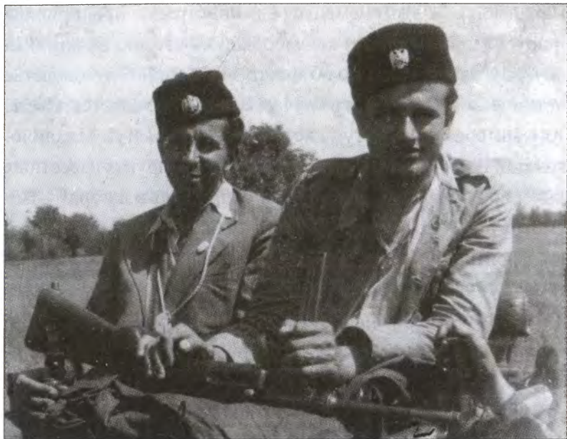
Четники с автоматом МР-41, Босния 1943 г.

командования на Юго-Востоке (Европы, т.е. на Балканах), в одной из операций были убиты 3 офицера ЮВВО и 17 рядовых бойцов, при этом 6 военнослужащих вермахта погибли, а 5 были ранены; в той же сводке было указано, что 23 декабря в результате удачного окружения был ликвидирован целый отряд четников в составе 28 человек.