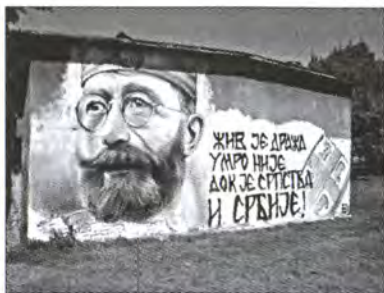
Современные уличные граффити «Дража жив. Он не умрет, пока живы сербы и Сербия»

В Сербии память о генерале Д. Михайловиче стала активно возрождаться в течение последних двадцати лет, после того как Югославия окончательно рухнула, оставив миллионы сербов за границами Сербии. За теми искусственными границами, против проведения которых коммунистами боролся генерал Д. Михайлович и его бойцы.