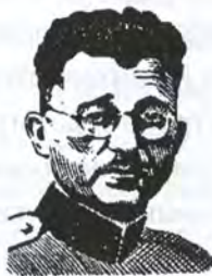
130.000 РАЈХСМАРКА У ЗЛАТУ ДОБИЋЕ ОНАЈ КОЈИ ДОВЕДЕ ЖИВА ИЛИ МРТВА ВОЂУ БАНДИ ДРАЖУ МИХАЈЛОВИЋА

Как уже упоминалось, в своем багаже Д. Михайлович имел окопный опыт боевого офицера Первой мировой войны, который довлел над ним в ходе его руководства Югославским войском в Отечестве (ЮВВО), как официально называлось его движение. Перед начальством он не чурался выразить свое мнение, за что частенько подвергался наказаниям. С другой стороны, неоспоримое личное мужество и основательное знание военной науки не дали его карьере увянуть окончательно. В общении с товарищами и сослуживцами Михайлович обладал удивительной про-