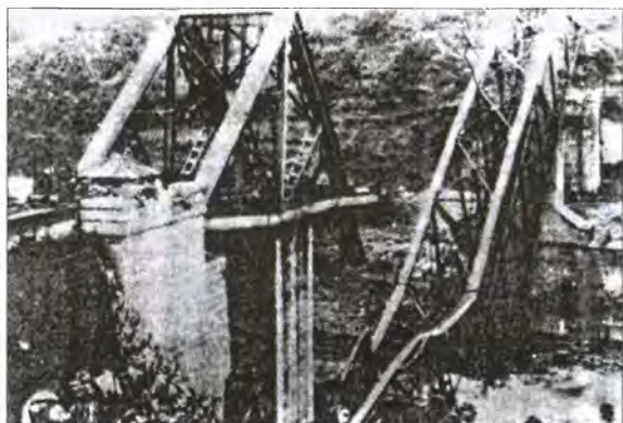
Железнодорожный мост в районе г.Вышеград (Восточная Босния), взорванный четниками в 1943 г.