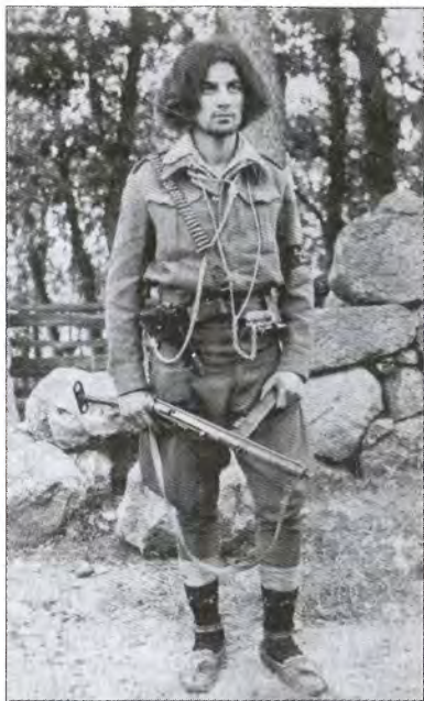
Четник с автоматом Стэн МКIII, Сербия