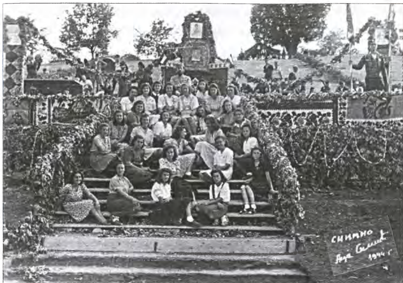
Женская равногогорская молодежь — Санитарки, 2-й равногогорский корпус