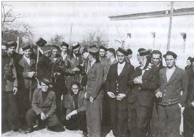
Сербы из области Лика восстали против террора в Независимом государстве Хорватия, образовав первые отряды повстанцев-четников. Лето 1941 г.

было много на территории НГХ) до конца 1942 г. большей частью попали под командование Д. Михайловича, который постепенно заменял их командные кадры своими людьми. Небольшая часть этих «самостоятельных» отрядов влилась в партизанские отряды. Большинство названий отрядов четников на территории Сербии и Черногории носило название по местным географическим названиям — по горам, городам или рекам, в районе которых действовали отряды. На территории НГХ большинство отрядов четников носил имена выдающихся людей из сербской истории, чтобы таким образом не только подчеркнуть сербский характер отрядов, но и укрепить боевой дух повстанцев.