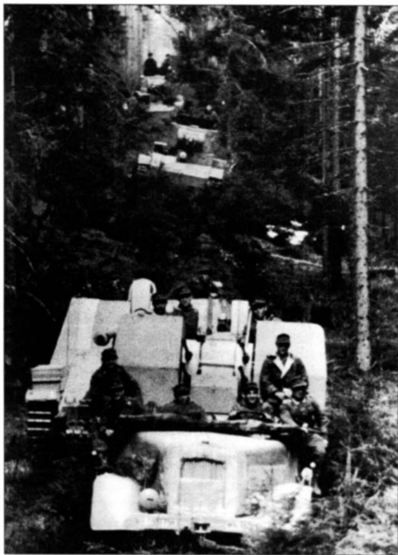
Антипартизанская операция в белорусских лесах