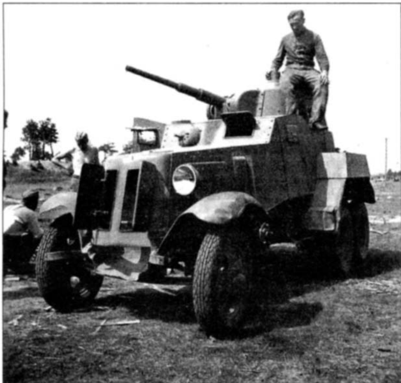
Трофейные советские автомобили активно использовались оккупантами и коллаборационистами при проведении антипартизанских операций

ского и Михайловского районов Курской области и имела три фазы: с 10 по 25 октября, с 3 по 11 и с 17 по 20 ноября 1942 г. Операция сопровождалась прочесыванием лесных массивов и населенных пунктов 1 .