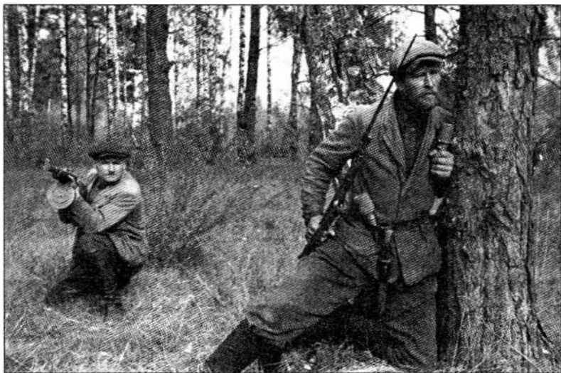
Партизаны Брянщины. Советский пропагандистский снимок 1943 года

Нерусса разрезать лесной массив на ряд изолированных участков, разобщить партизанские бригады, лишить их общего руководства и, оттеснив к Десне, уничтожить. Предполагалось, что часть партизан будет пытаться выйти из окружения, поэтому были заранее созданы сильные заслоны на окраинах леса. Для блокирования партизан построили фортификационные сооружения по правому берегу Десны 1 .