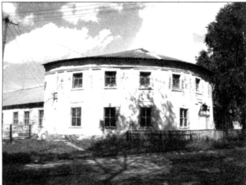
Локотская тюрьма (конезавод № 17). Современный снимок