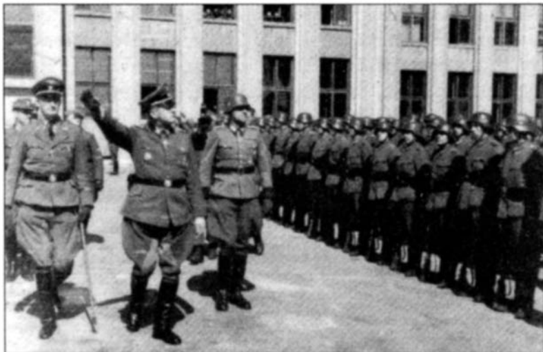
Высший фюрер СС и полиции в Центральной России Э. фон дем Бах-Зелевский (второй слева), его заместитель К. фон Готтберг (первый слева) и командующий полицией порядка генерального комиссариата Беларусь В. Клепш (третий слева). Минск, 1943 год

8-й пехотной дивизии, 31-й полк германской полиции порядка, 720-й запасной полк, 743-й и 858-й восточные батальоны, 314-й и 513-й запасные пехотные батальоны. Хотя партизаны понесли тяжелые потери, им все-таки удалось избежать разгрома.