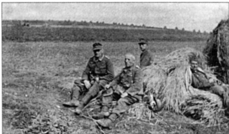
Немецкие унтер-офицеры из организационного штаба и рядовые каминцы. Лето 1943 г.

Севска в Клинцы, в ближайшее время с первым транспортом возвратятся обратно и примут участие в восстановлении родного города» 1 .