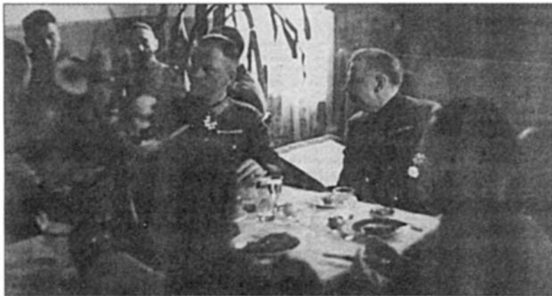
Пасхальный банкет у Каминского, слева от Каминского начальник штаба 3-й танковой армии генерал-майор Отто Гейдкампер

Перед немецкими соединениями, частями полиции и войск СС ставились следующие задачи: