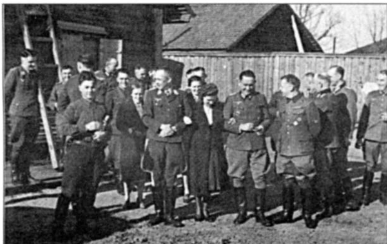
Празднование Пасхи в лепельской резиденции Каминского, 16.04.1944 г.

Храменки. Но атаки не принесли успеха. Тогда, во второй половине дня, по позициям народных мстителей был нанесен удар с воздуха: 15 самолетов в течение трех часов «утюжили» оборонительные порядки бригады «Алексея». Когда налет закончился, под прикрытием артиллерийско-минометного огня батальоны РОНА пошли в наступление. Через два часа сопротивление партизан было сломлено.