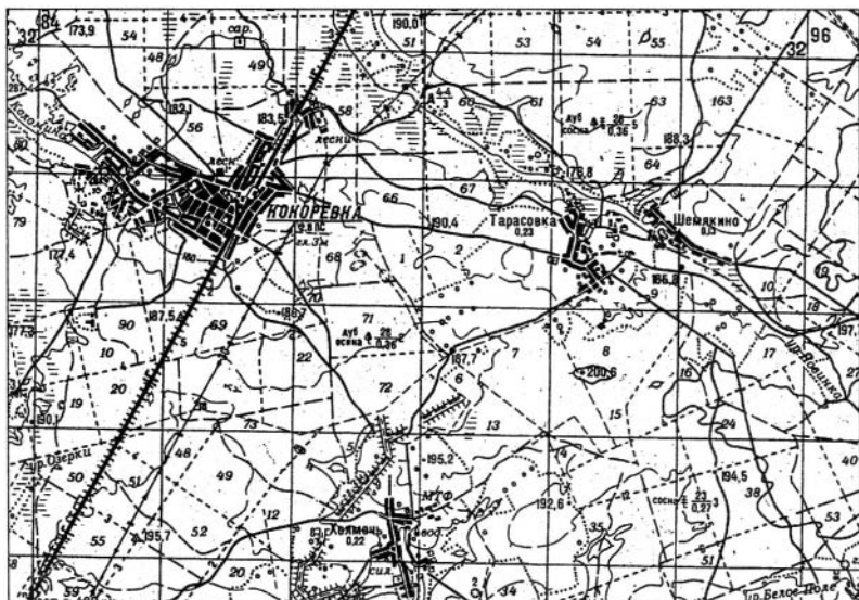
Деревни Тарасовка и Шемякино. С послевоенной карты

внушительные гарнизоны «народной милиции» (оттуда периодически начинались антипартизанские операции). Брянский чекист М.А. Забельский после войны вспоминал: «Под носом у партизан... в деревнях Шемякино и Тарасовке вольготно жилось более чем ста пятидесяти полицейским. Полиция ухитрилась собрать все оружие и боеприпасы, оставленные нашими воинскими частями при отходе, и перетащила в свои деревни» 1 .