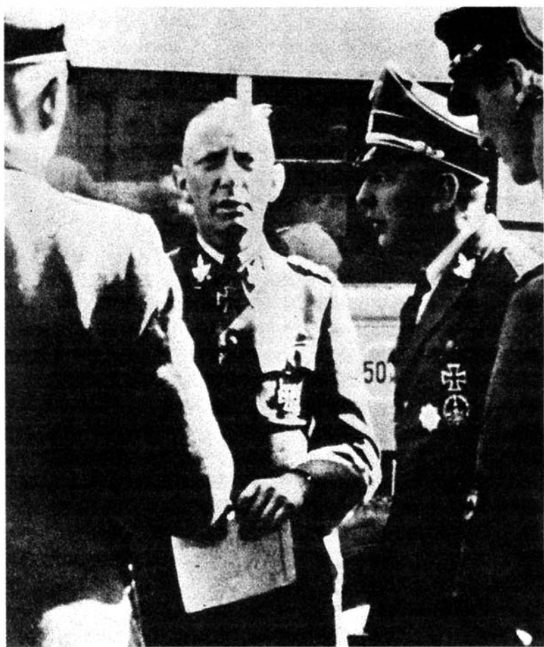
Группенфюрер СС Х. Рейнефарт и ваффен-бригадефюрер Б.В. Каминский. Варшава, август 1944 года