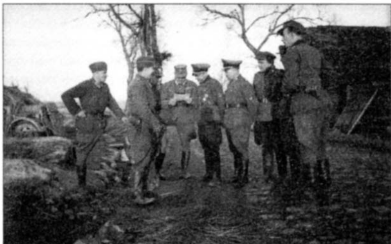
Командиры РОНА и сотрудники германской полиции. Весна 1944 года

О. Гейдекпера, который отмечает, что с 11 апреля по 15 мая потери партизан составили 14 288 человек 1 .