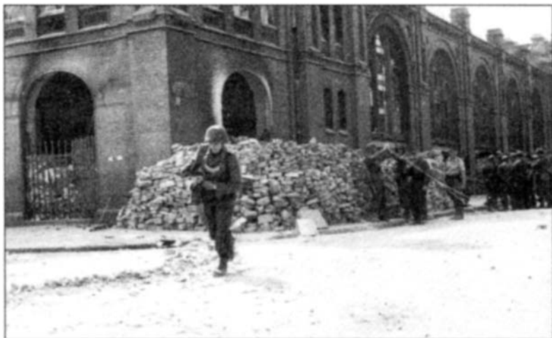
Огня из варшавских улиц в минуту затишья

войска, целью летнего наступления которых, как полагал Коморовский, является взятие польской столицы, завершат разгром немцев.