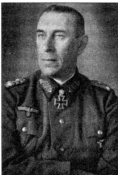
Командующий 2-й танковой армией вермахта генерал-полковник Р. Шмидт