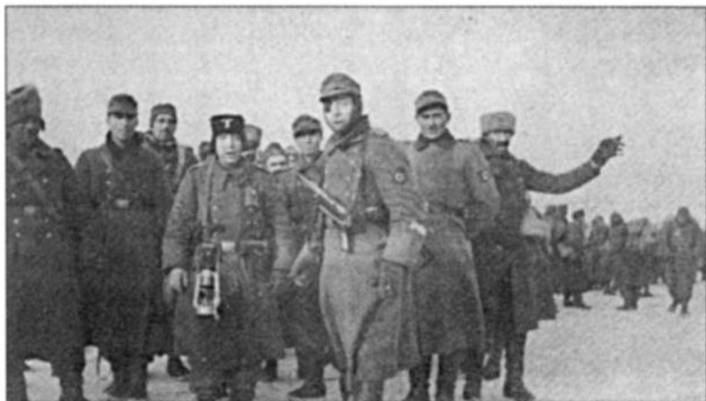
Каминцы с чинами северо-кавказского батальона во время антипартизанской операции

чи), отмечается, что к началу боев в бригадах насчитывалось 17 185 человек 1 .