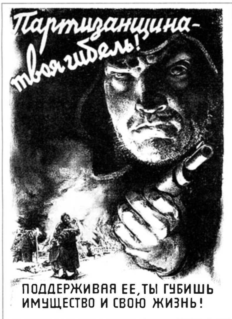
Германский оккупационный плакат