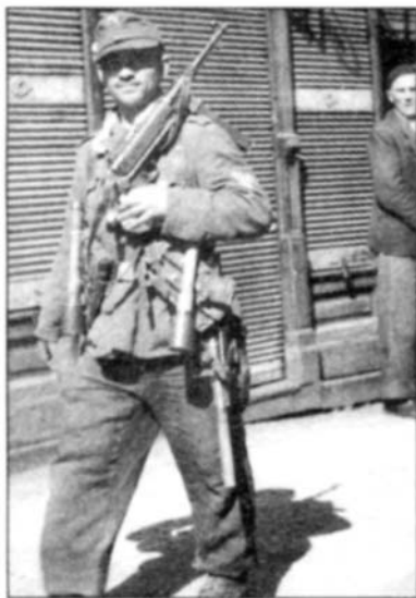
Боец РОНА. Варшава, август 1944 года