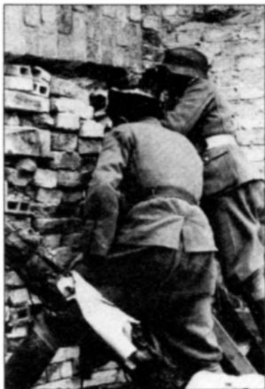
Военнослужащие РОНА в Варшаве

ми. В последующем полк терял ежедневно от 5 до 20 человек 1 .