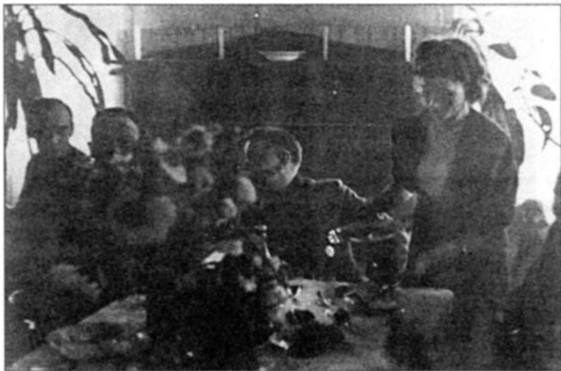
Супруга Каминского ухаживает за гостями

по партизанам наносили удар 50 бомбардировщиков, после чего «каминцы» овладели позициями народных мстителей и пленили начальника штаба бригады «Алексея» Ф.И. Плоскунова 1 .