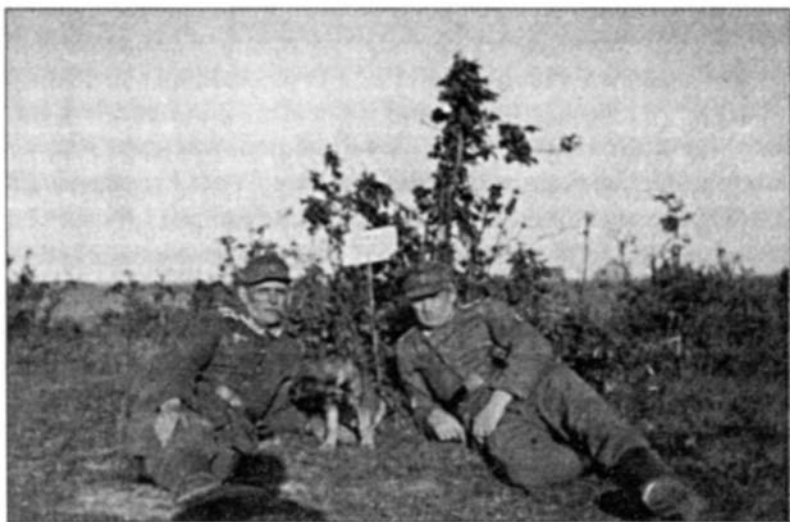
Немецкие унтер-офицеры из организационного штаба при РОНА. Лето, 1943 г.

нием начальника штаба полка А.Н. Демина. Эти подразделения были усилены 30 танками и самоходными орудиями 1 .