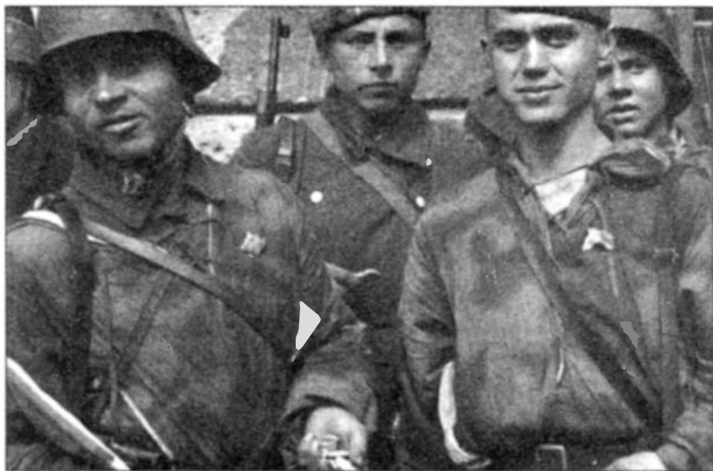
Солдаты РОНА. Август 1944 года

подчинение командованию РОА и его деятельность, по словам энтээсовцев, компрометировала «русское освободительное движение». Однако по ряду причин операцию по устранению Каминского осуществить не удалось 1 .