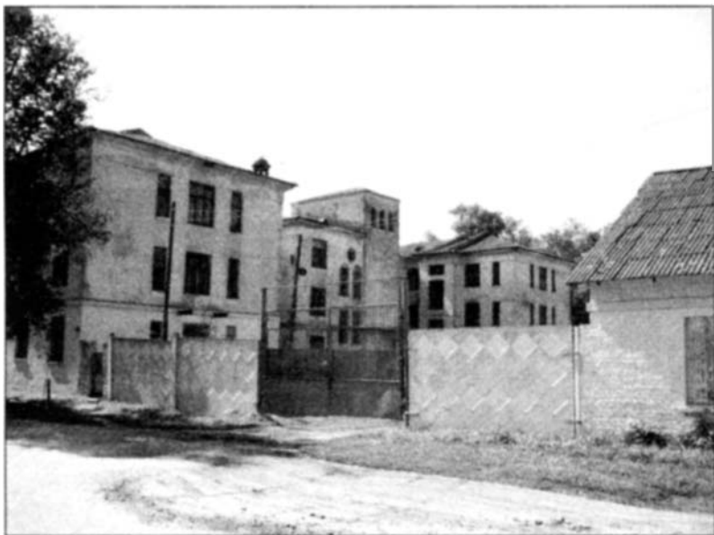
Казармы «народной милиции» (здание бывшего Лесохимического техникума). Современный снимок