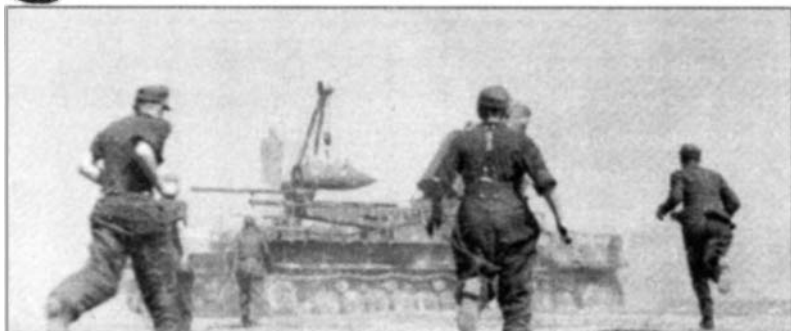
Сверхтяжелая мортира «Карл» ведет огонь по восставшему городу