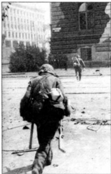
Уличные бои в Варшаве

В исторической литературе встречается мнение, что подчиненные Каминского были не готовы к ведению боев в городе, поэтому они несли за пределами высокие потери и, в сущности, не воевали, а занимались убийством мирного населения, грабежами и т.д. Данное утверждение, на наш взгляд, не совсем объективно. Определенный опыт ведения боевых действий в населенных пунктах городского типа у «каминцев» был (можно вспомнить бои в Севске, Лепеле и Чашниках). В Варшаве у «каминцев», безусловно, возникли