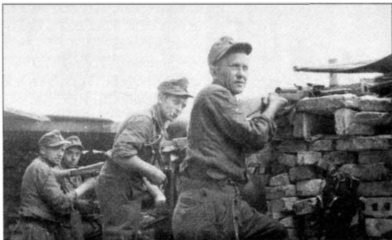
Одна из немецких баррикад в Варшаве

чтобы вооружить 10 % участников восстания. В последующем повстанцы получили помощь со стороны союзников и Красной армии. Им было доставлено 3247 единиц стрелкового оружия, 169 минометов, 55 тысяч мин и гранат, 5 млн 700 тыс. патронов, 35 тысяч тонн продовольствия 1 . Эта помощь позволила полякам продержаться дольше, чем они сами рассчитывали, но трагический финал был неизбежен.