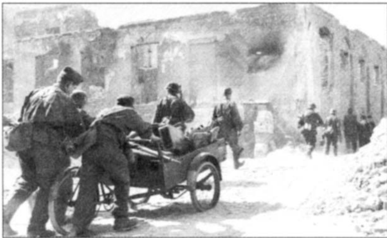
Боевая группа СС выдвигается на новую позицию в Варшаве