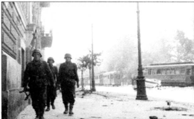
Немецкие солдаты в перерыве между боями

сообщил, что его постоянно обстреливали странные на вид войска СС, скорее всего, русские. У него уже есть факты нападения, а он связаться с ними не может. Вторым звонком был от поляка, который в этом районе обращался в немецкую полицию за помощью. Поведение русских было столь бесчеловечным, что мирные жители обращались за срочной помощью. Родевальд пояснил ему, что мы окружены восстанием, а расположенная рядом полиция слишком слаба и плохо вооружена, чтобы могла вступить. Затем я узнал через Штагеля от его штабного офицера, что банды Каминского специально избегают серьезных сражений, не продвигаются вперед, а только грабят, пьют и насилизуют. Право грабить, скорее всего, им дал Гиммлер» 1 .