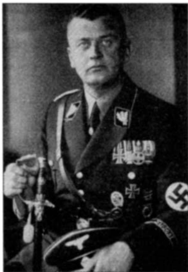
Э. фон дем Бах-Зелевски

Собственно говоря, пока- янные свидетельства фон дем Баха уже давно вызывают у историков сомнения на пред- мет их искренности. Его по- слевоенные сетования насчет непропорционального при- менения силы войсками СС, и «каминцами» в том числе, следует признать лицемерны- ми, тем более что сам фон дем Бах совершил во время войны столько кровавых дел, что они не идут ни в какое сравнение с варшавскими событиями. Так, можно вспомнить варварские расправы, устроенные фон дем Бахом в ноябре 1941 г. под Мо-