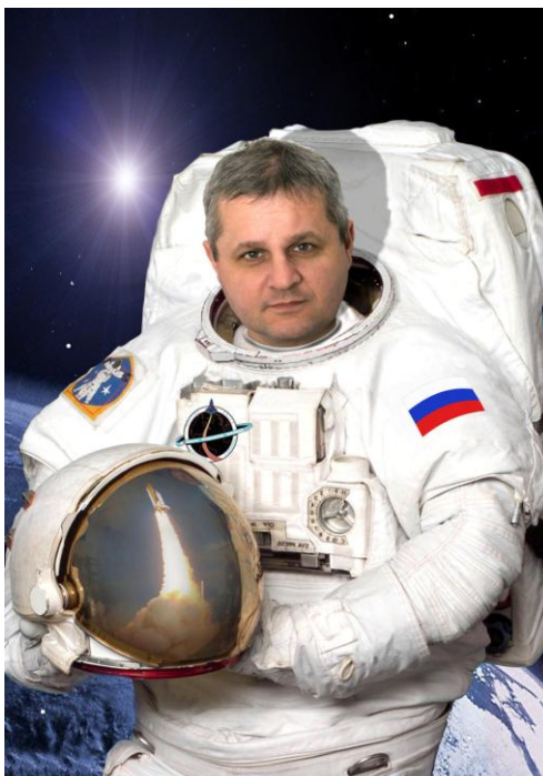
L una * O leg * V ladimirovich * E rmakov

In the beginning was the Word, and the Word was with God, and the Word was God.