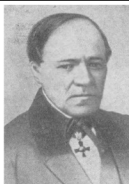
Н.Е. Зернов (1804 – 1862)

Он пошел по стопам отца: в 1837 г. с отличием окончил физико-математический факультет Петербургского университета, в 1885 – защитил кандидатскую диссертацию, в 1888