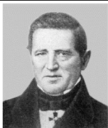
Н.Д. Брашман (1796 – 1866)

Вскоре после окончания университета О.И. Сомов женился, в 1840 г. у него родилась дочь, а затем и сыновья. Из них только Павел Иосифович Сомов (1852–1919) оставил заметный след в науке.