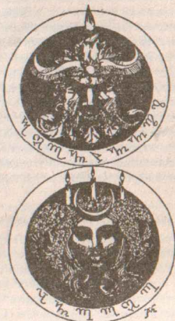
The witch god and witch goddess 10/9

Конечно, обряды жертвоприношения существовали на многих примитивных этапах развития общества. Однако возможно, что слух о жертвоприношениях специально распространен стараниями официального духовенства. О том, что подобные жертвоприношения совершались Друидами, было написано Цезарем, а Секретные колдовские хроники молчат (не упоминают) об этом.