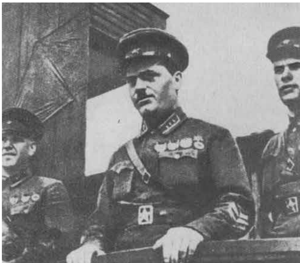
На маневрах. Белорусский военный округ. 1937 г.