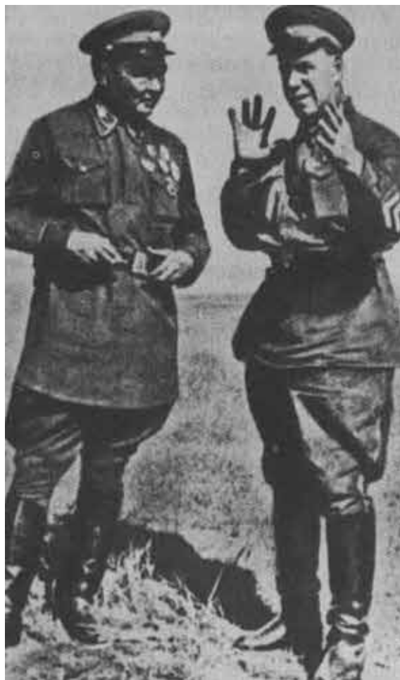
Г. К. Жуков и Чонбалсан.