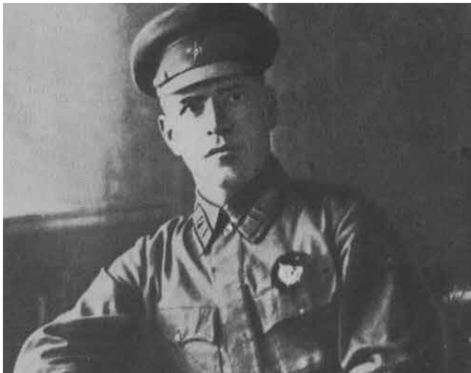
Командир полка Г. Жуков. 1924 г.