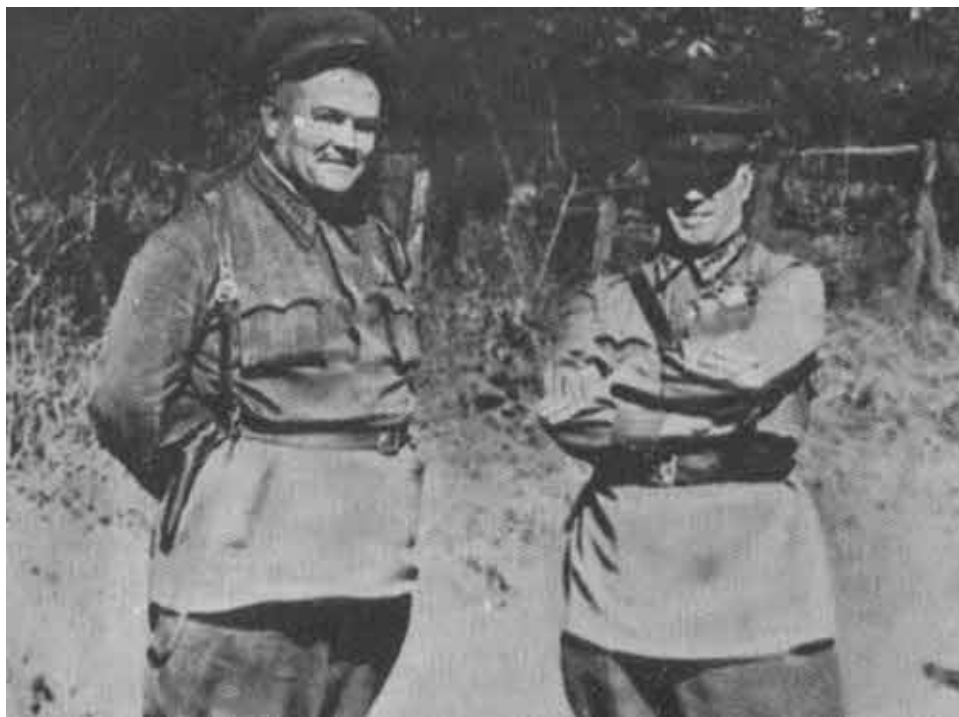
В Бессарабии. 1940 г.