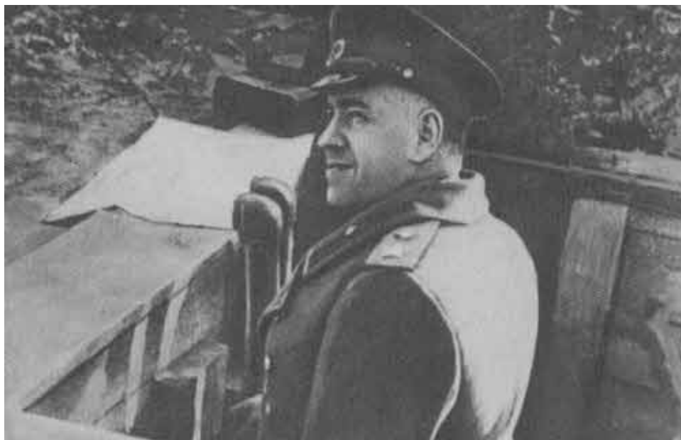
Наблюдательным пункт под Берлином.