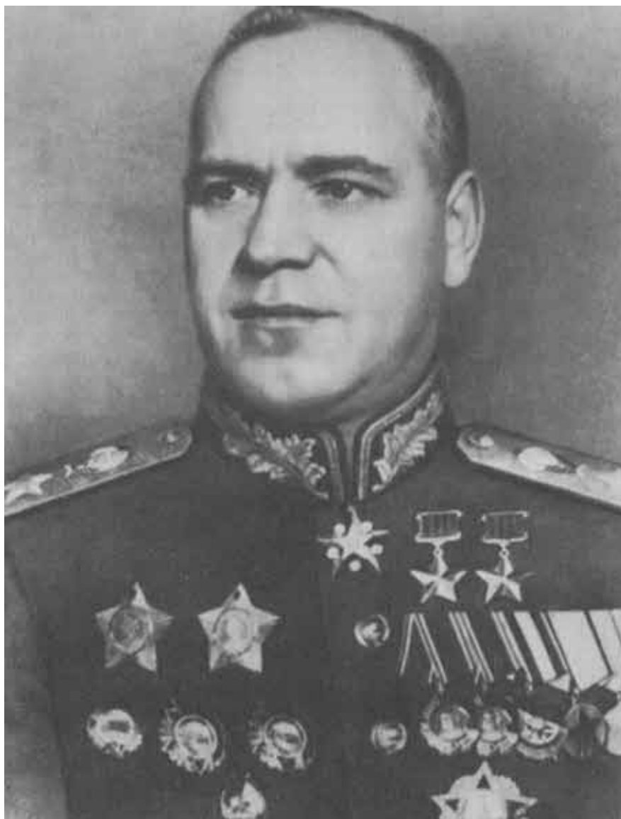
Г. К. Жуков. 1944 г.