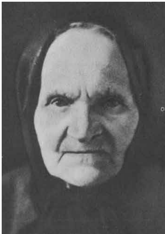
Устинья Артемьевна — мать Г. К. Жукова.