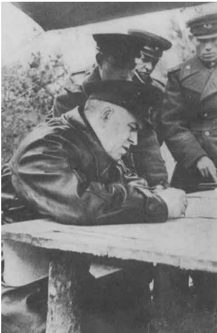
На командном пункте.