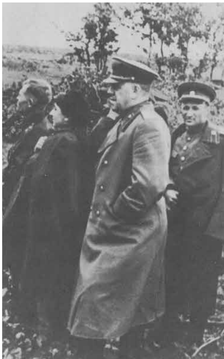
Фронт. 1944 г.