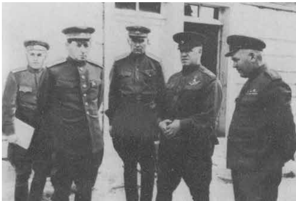
После совещания. 1942 г.