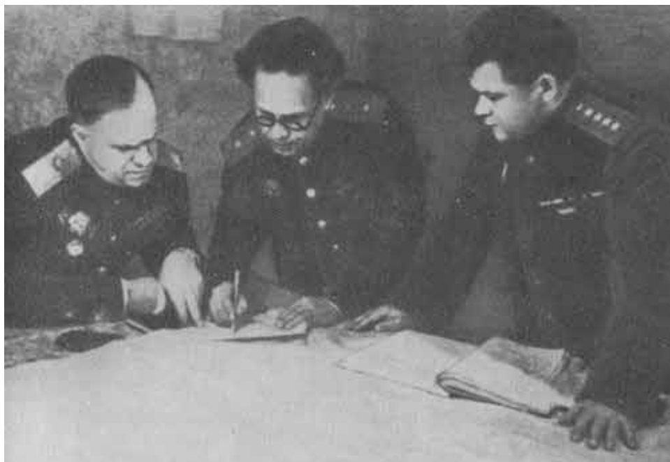
Г. К. Жуков на 1-м Украинском фронте