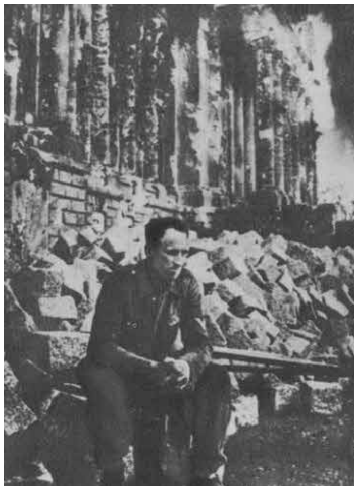
У рейхстага. Май 1945 г.