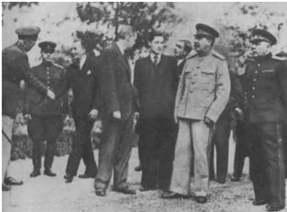
В Потсдаме. В перерыве между заседаниями.