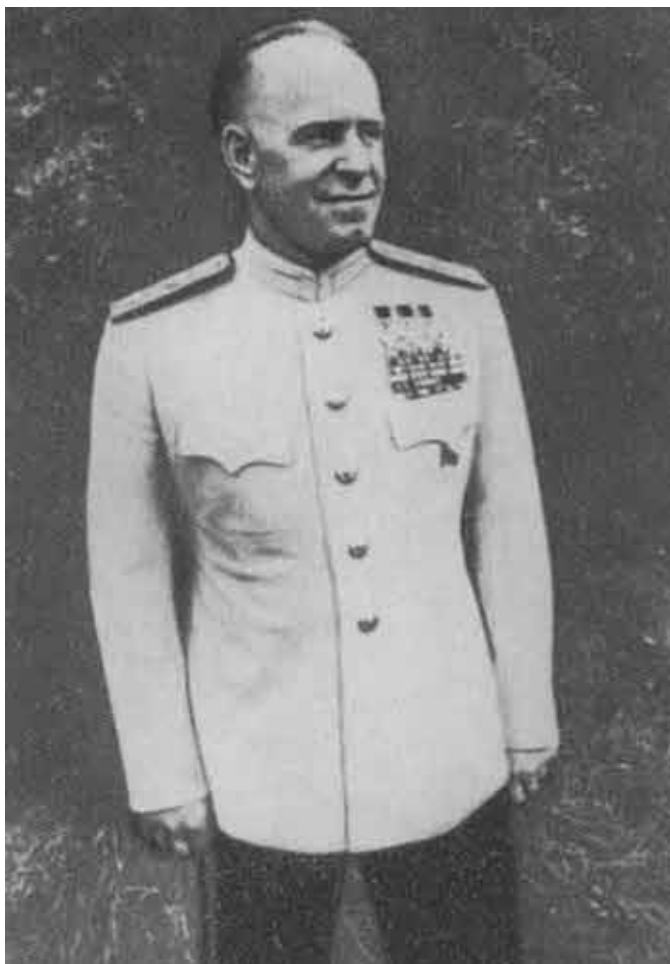
Г. К. Жуков в Германии.