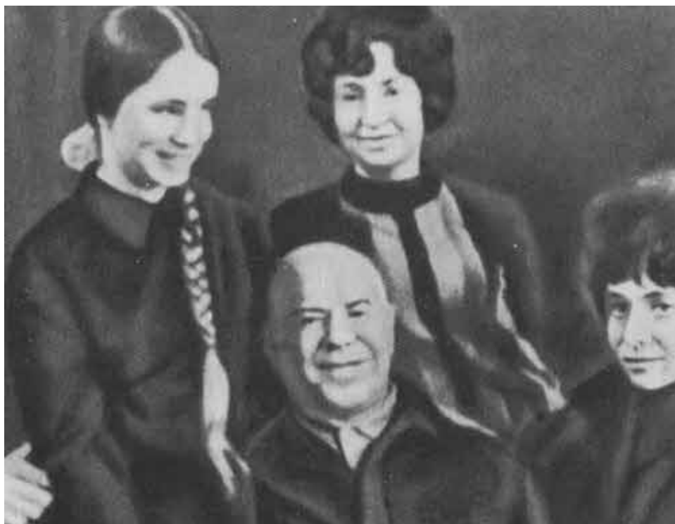
Дочери Г. К. Жукова — Маша, Эра, Элла.