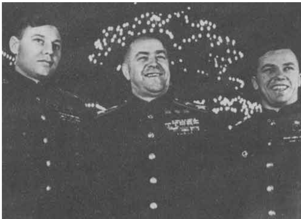
Трижды Герои Советского Союза А. Покрышкин, Г. Жуков, И. Кожедуб на сессии Верховного Совета СССР. 1946 г.