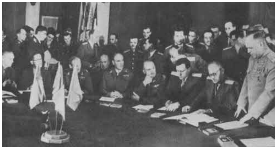
На Потсдамской конференции.