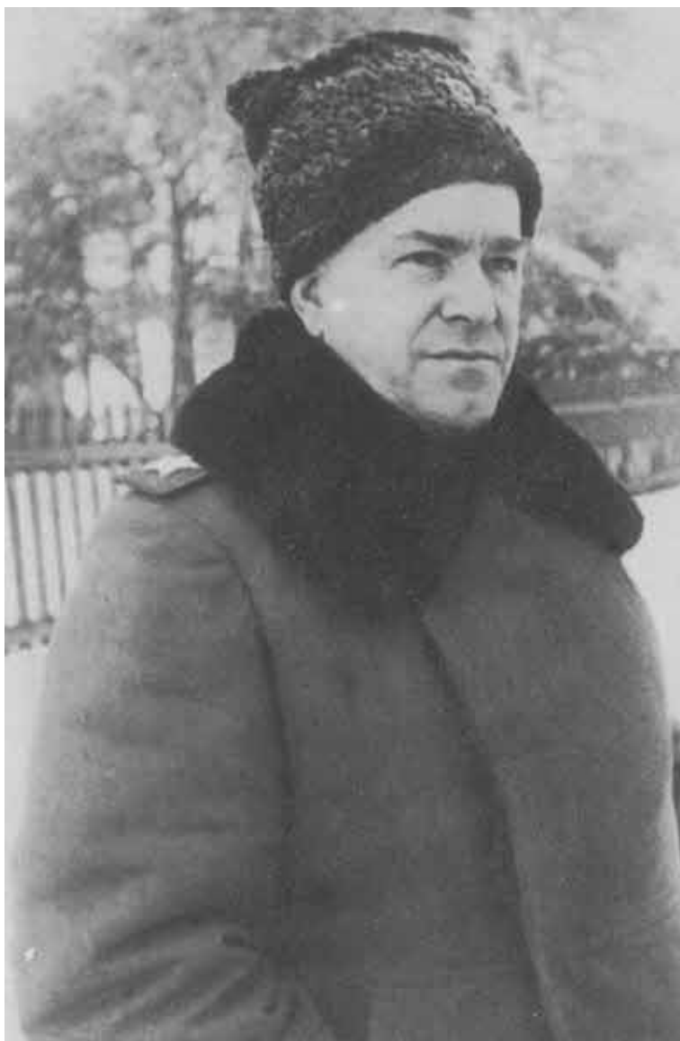
Г. К. Жуков на фронте. 1945 г.