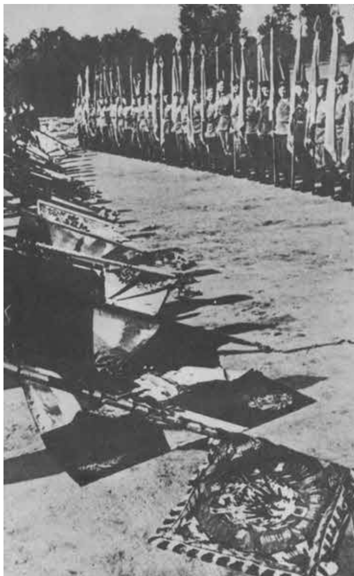
Перед знаменами победителей. 1945 г.