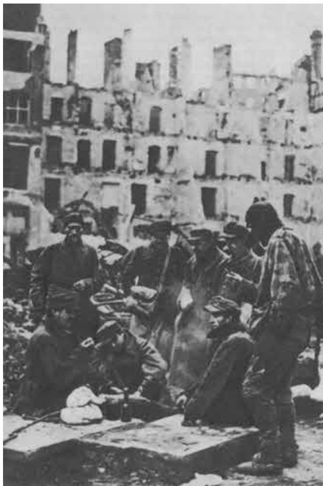
Довоевались. Берлин, май 1945 г.