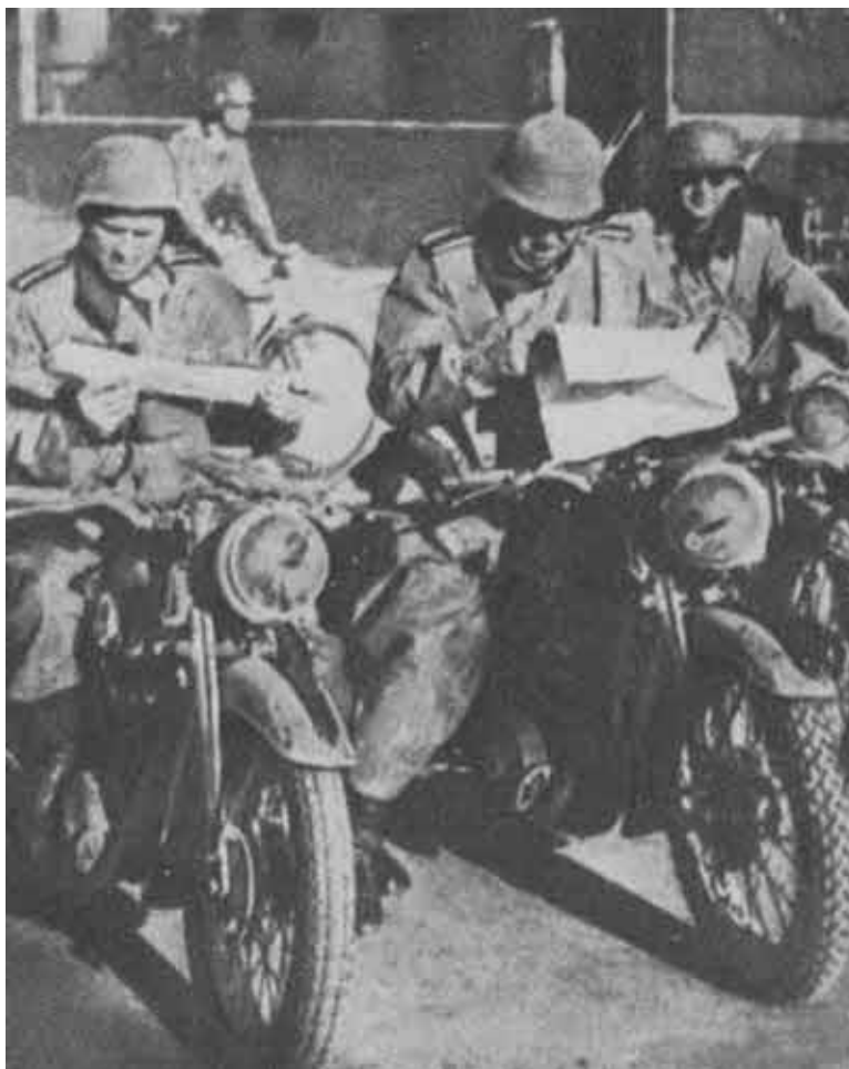
Нашествие фашистов. Июнь 1941