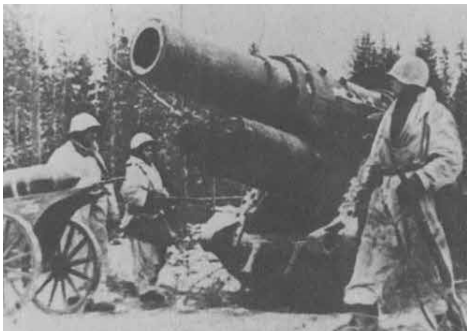
Захваченное немецкое орудие под Ленинградом.