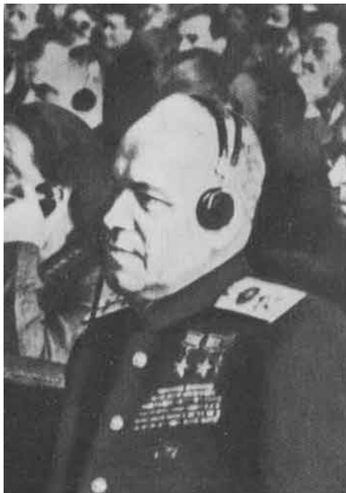
Г. К. Жуков на сессии Верховного Совета СССР. 1946 г.