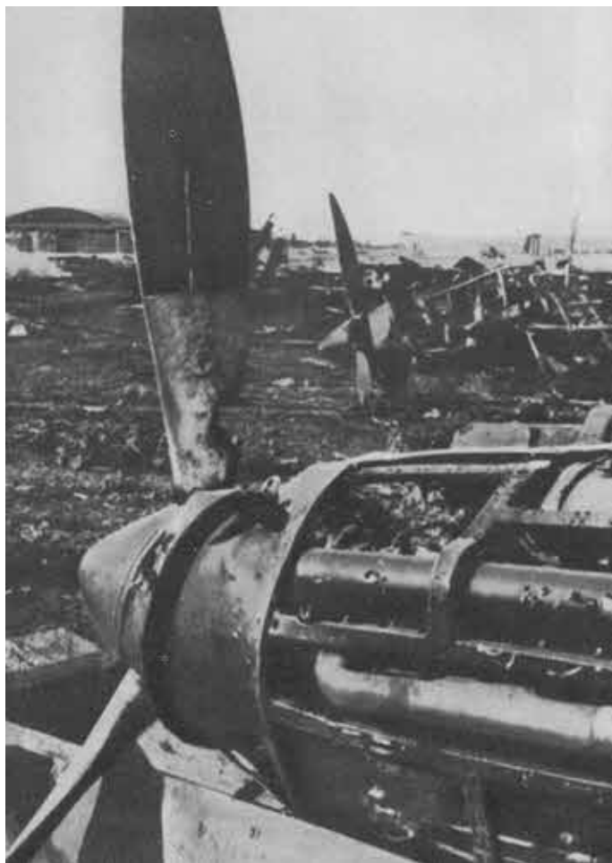
22 июня. После налета люфтваффе.