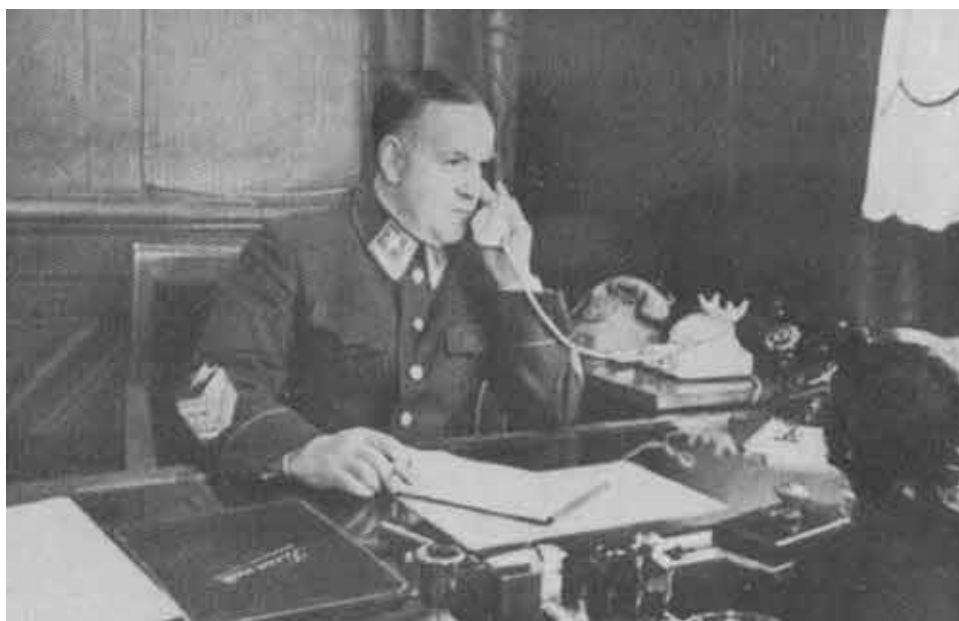
Г. К. Жуков. 1943 г.