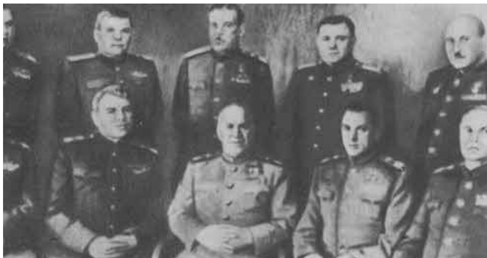
Командующие фронтами. 1945 г.