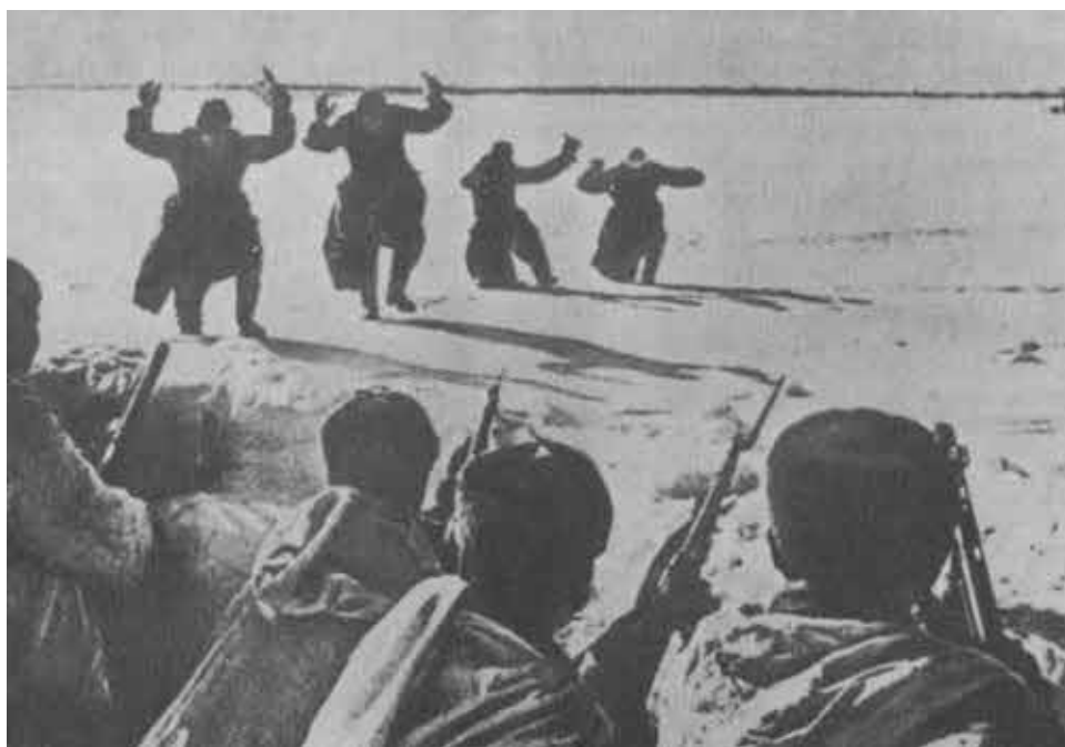
Враг поднял руки. Сталинград