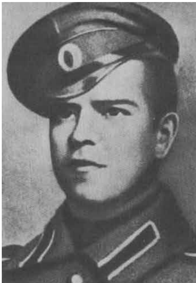
Вице-унтер-офицер Г. Жуков. 1916 г.