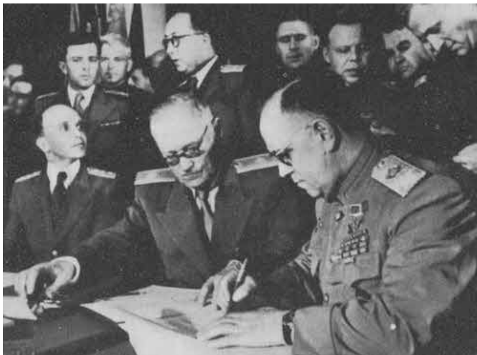
Акт о капитуляции Германии.