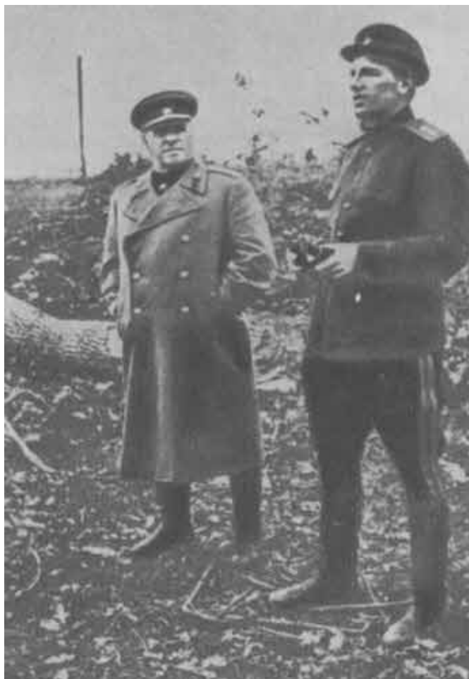
Жуков и Голованов.