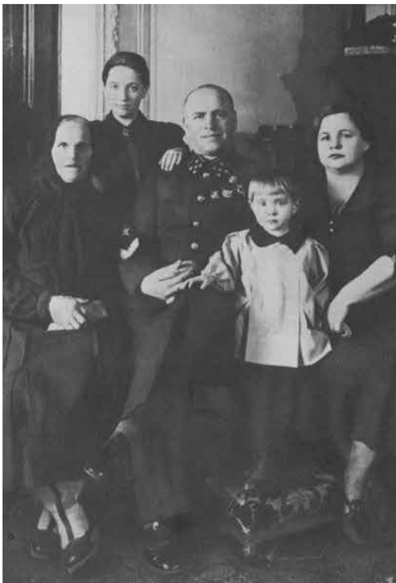
Семья Г. К. Жукова. 1940 г.