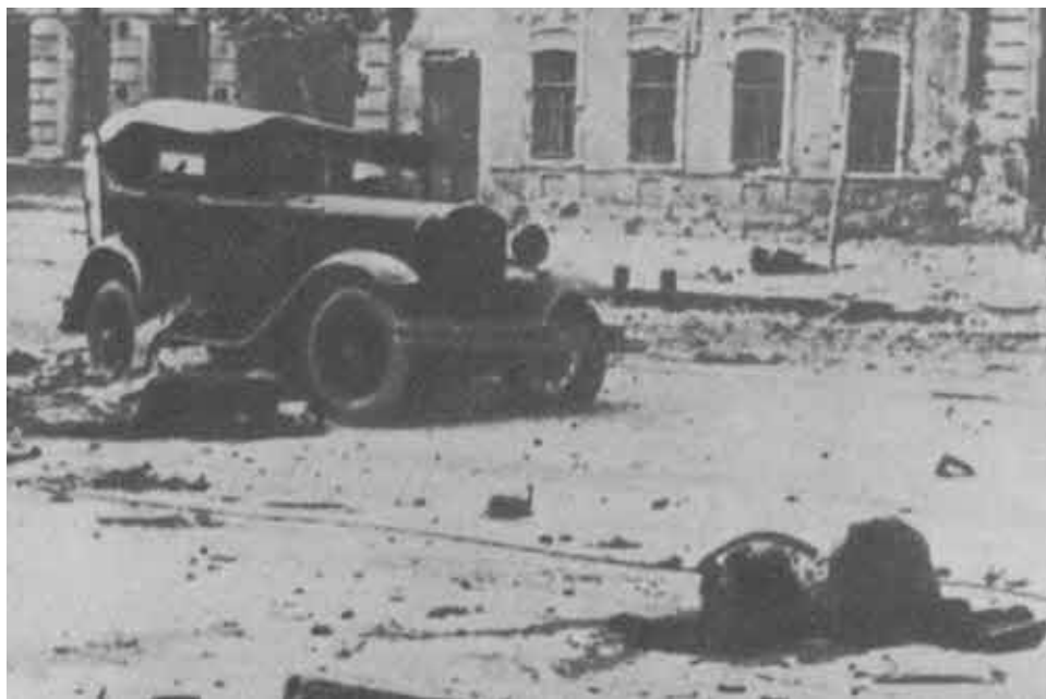
Немцы в городе.