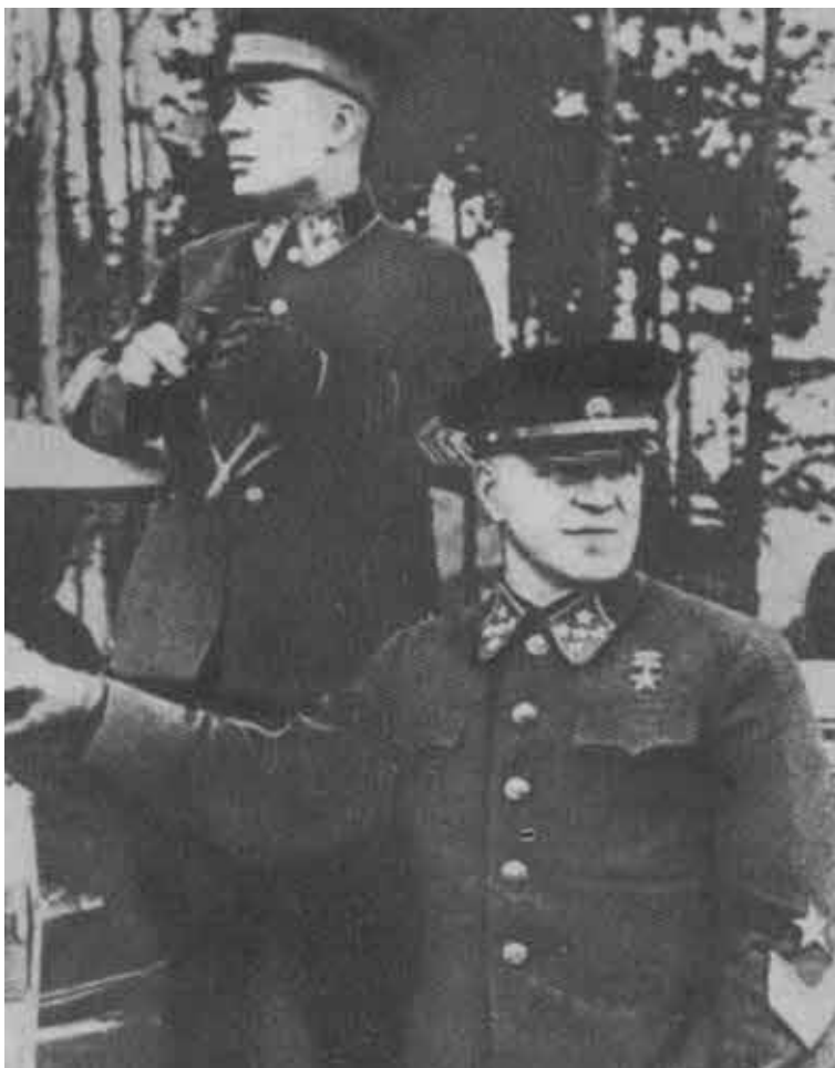
Киевский Особый военный округ. На учениях. 1940 г.