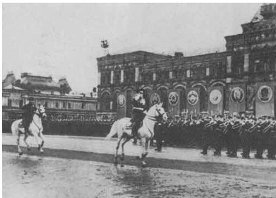
Парад Победы. Москва. 24 июня 1945 г.