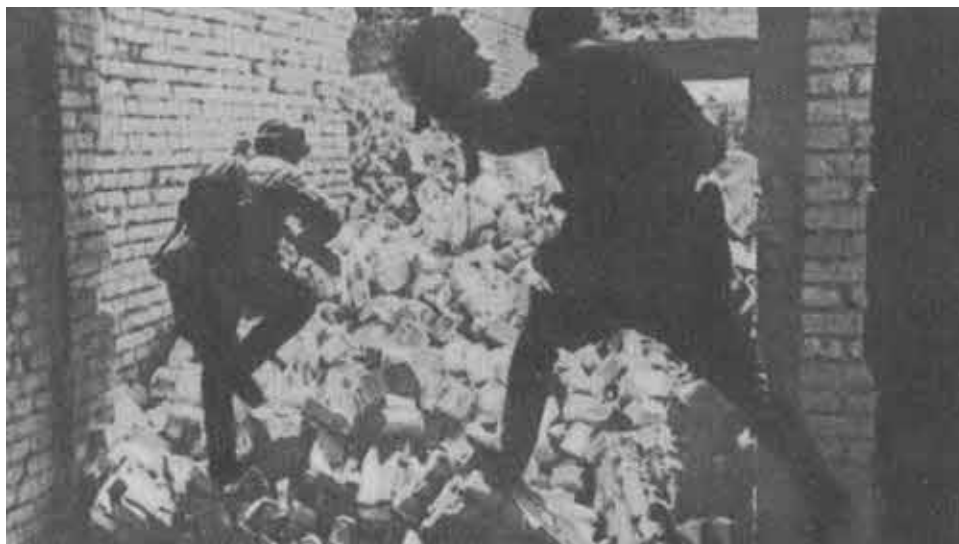
Бои за каждый дом. Сталинград.