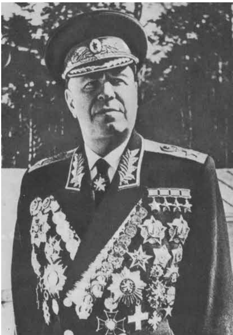
В парадном мундире Г. К. Жуков.