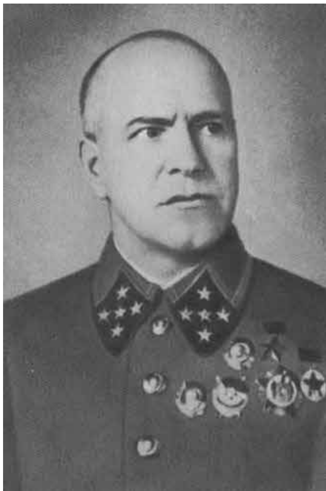
Г. К. Жуков — начальник Генерального штаба.