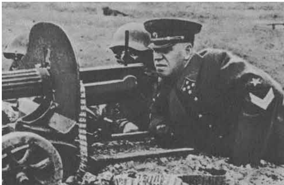
На учениях в КОВО. 1940 г.