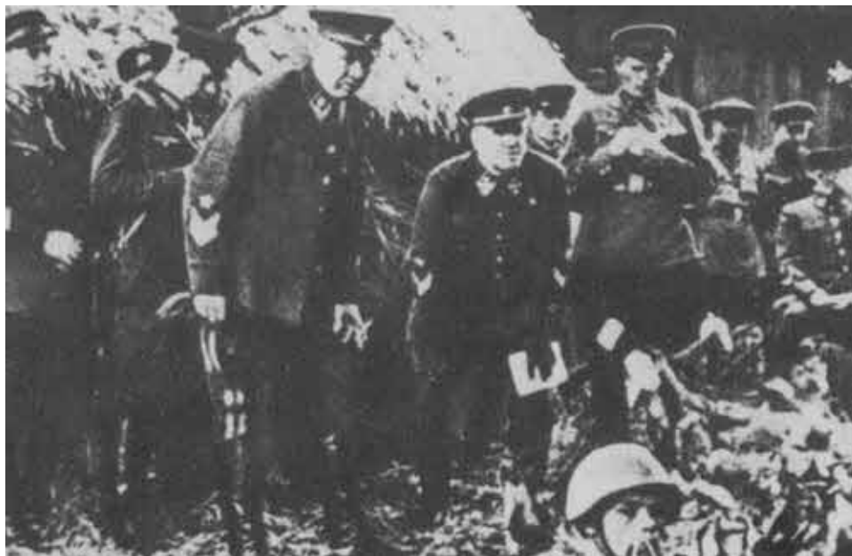
С наркомом обороны С. К. Тимошенко. 1940 г.