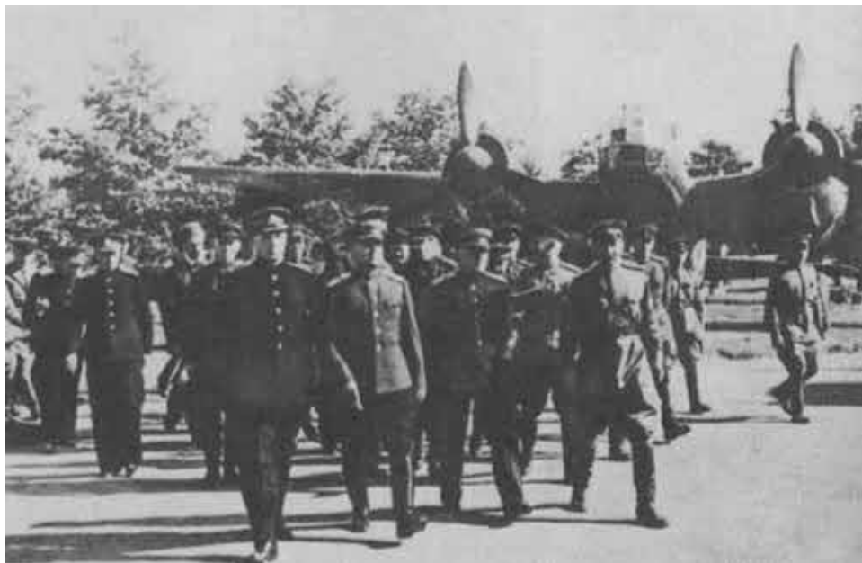
Приезд Г. К. Жукова.