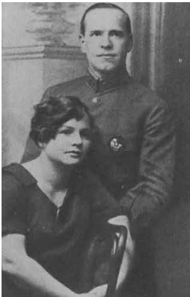
Георгий Жуков с женой Александрой Диевной.