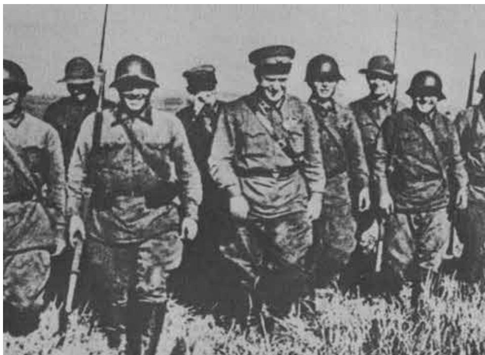
Г. Жуков среди бойцов на Халхин-Голе.