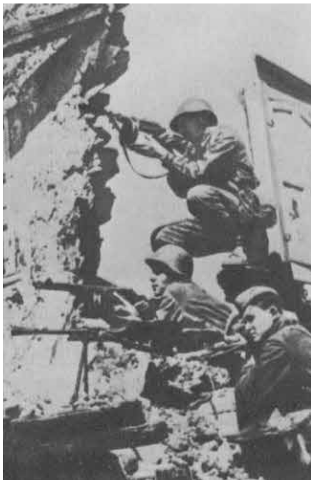
Уличный бой. Сталинград.