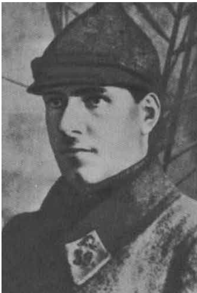
Командир полка Г. Жуков. 1927 г.