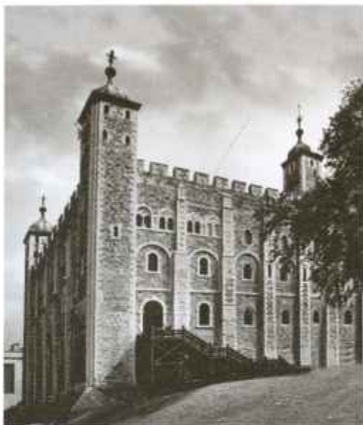
Белый Тауэр, построенный Вильгельмом