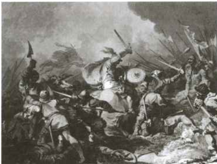
Битва при Гастингсе. Гравюра XIX в.