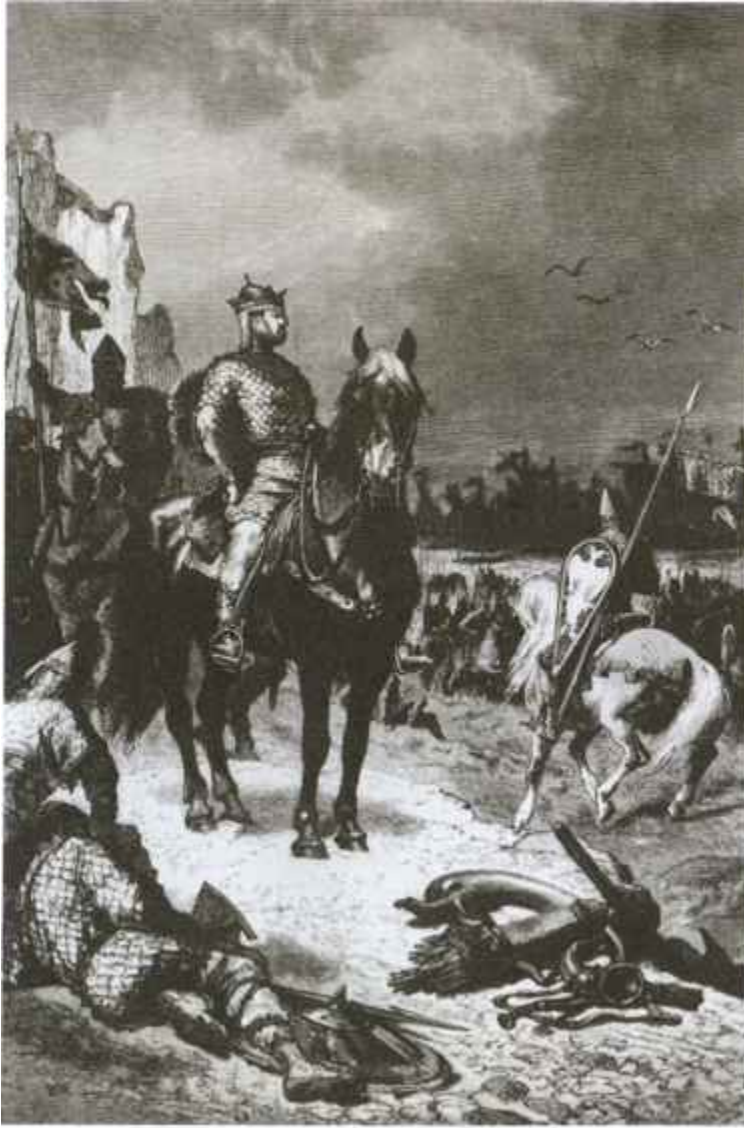
Вильгельм на смотре своего войска перед вторжением в Англию. Гравюра XIX в.