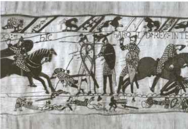
Гибель короля Гарольда