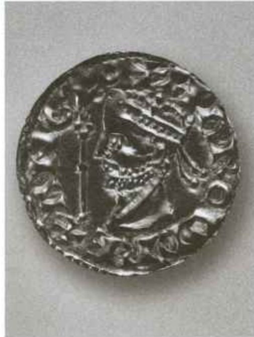
Монета короля Гарольда