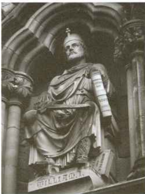
Памятник Завоевателю в Личфилде