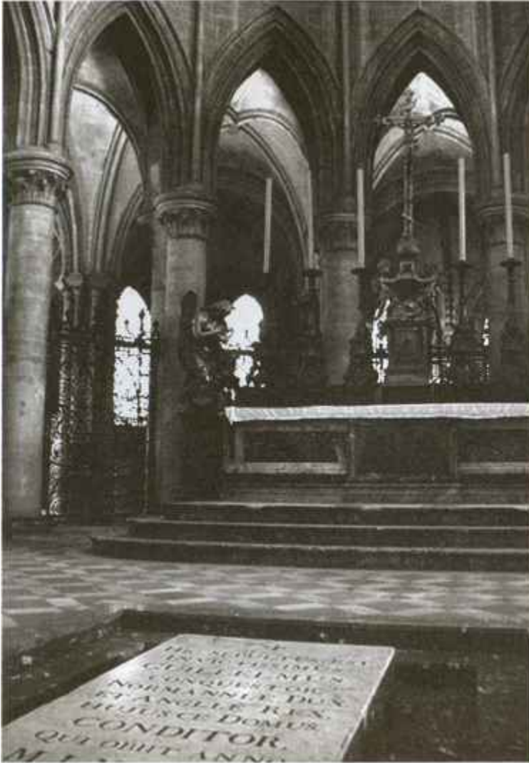
Гробница Вильгельма Завоевателя в Кане.

Победа при Валь-эс-Дюне в принципе обеспечила Вильгельму суверенную власть над классом феодалов в целом, отныне слишком разобщенным, чтобы вновь пускаться на подобного рода авантюры. Деятельность центробежных сил была решительным образом пресечена. Если в дальнейшем и возникали волнения, то они более не ставили под вопрос достижений молодого герцога. Тогда же Вильгельм воздал по заслугам и мятежному руанскому купечеству, в порядке наказания лишив его привилегий — по крайней мере, тех из них, которые были вырваны у него в момент