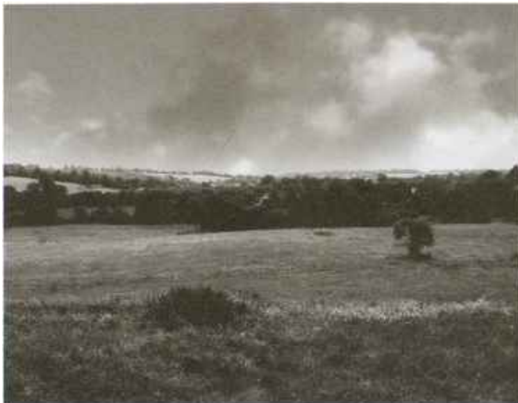
Поле битвы при Гастингсе. Современный вид