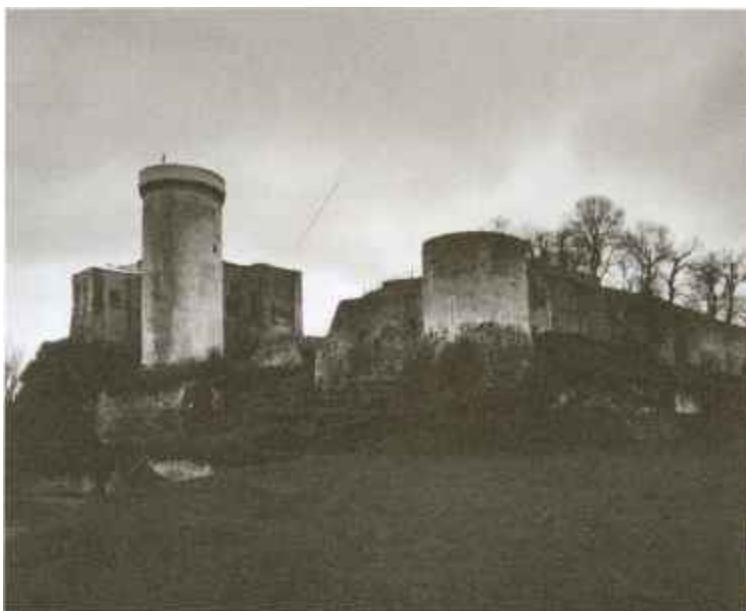
Фалезский замок — место рождения Вильгельма