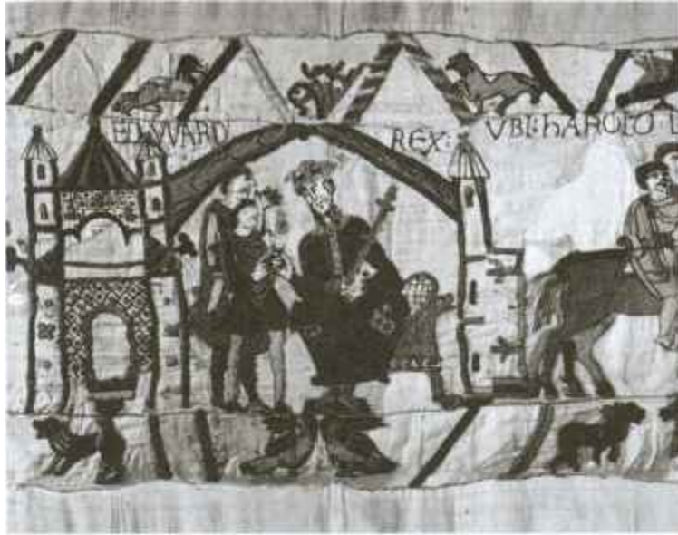
Король Англии Эдуард Исповедник с приближенными