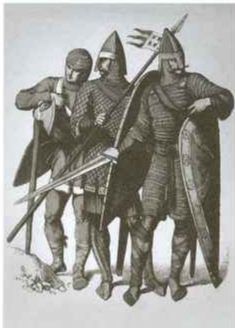
Нормандские рыцари. Рисунок XIX в.