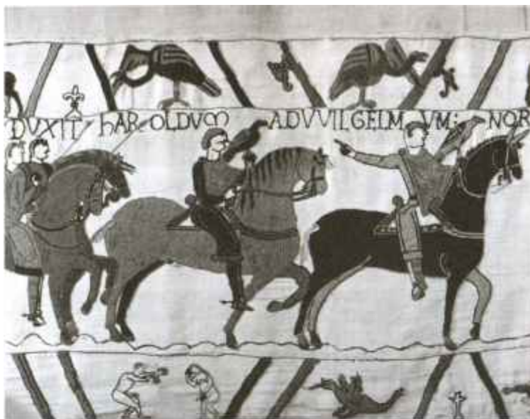
Вильгельм в походе