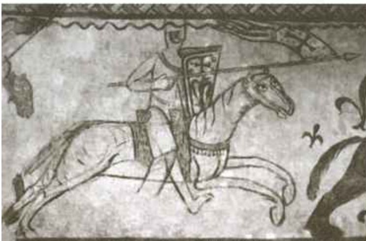
Граф Анжуйский Жоффруа Мартель