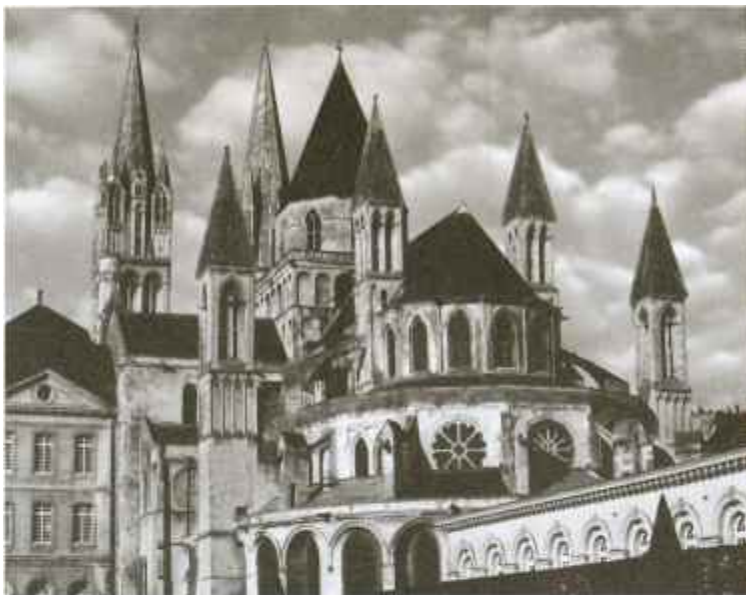
Собор в Кане, где похоронен Вильгельм