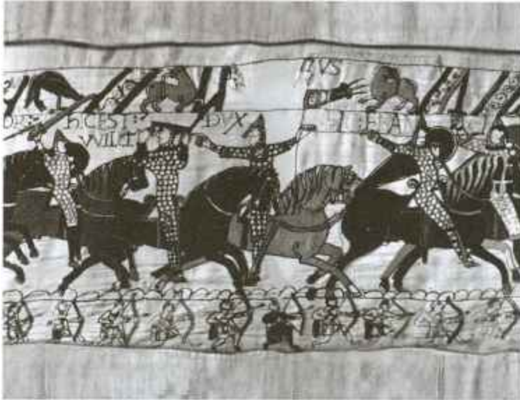
Нормандская конница атакует англосаксов