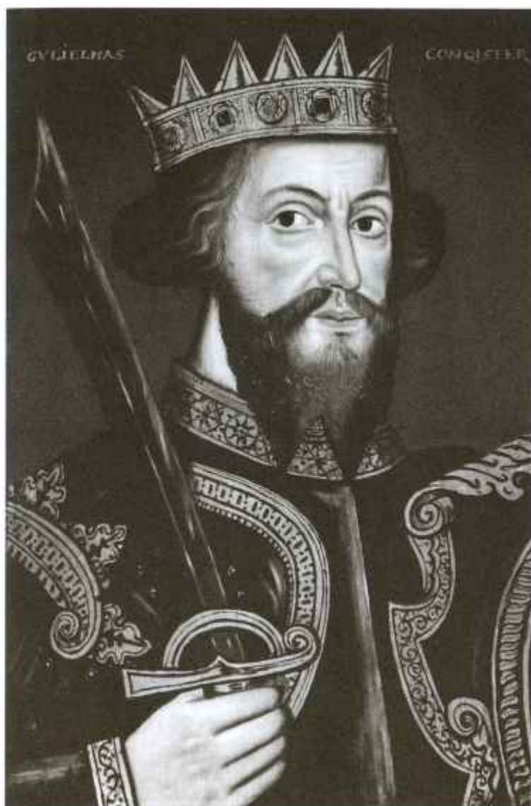
Идеализированный портрет Вильгельма. XVI в.