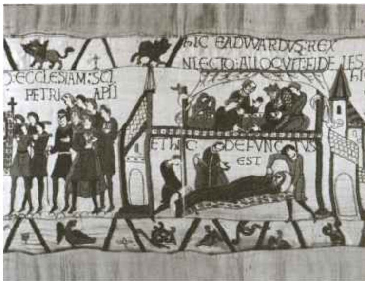
Смерть короля Эдуарда