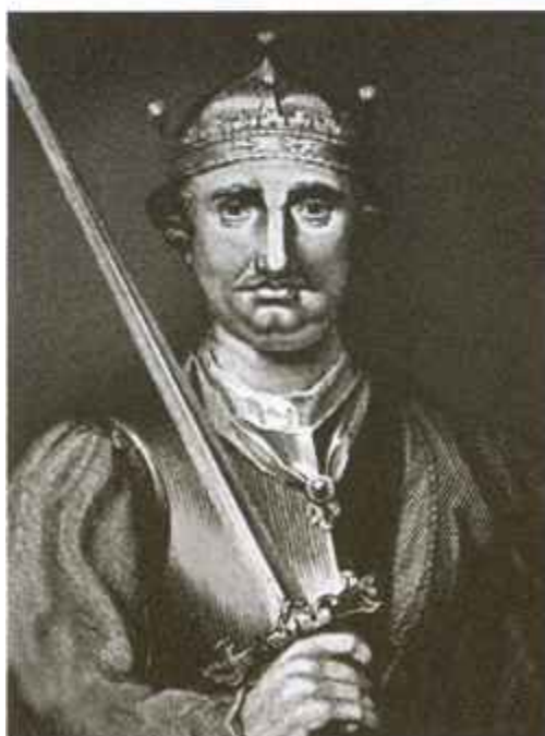
Одна из реконструкций облика Вильгельма