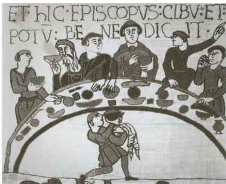
Герцог Нормандский на пиру. Фрагмент ковра из Байё