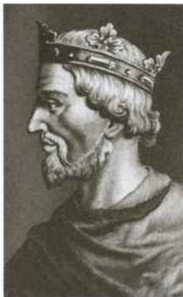
Сыновья и наследники Вильгельма — Вильгельм II Рыжий и Генрих I Боклерк