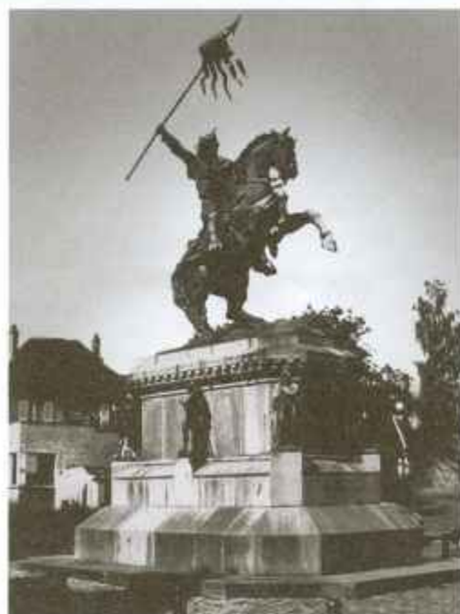
Памятник Вильгельму в Фалезе.