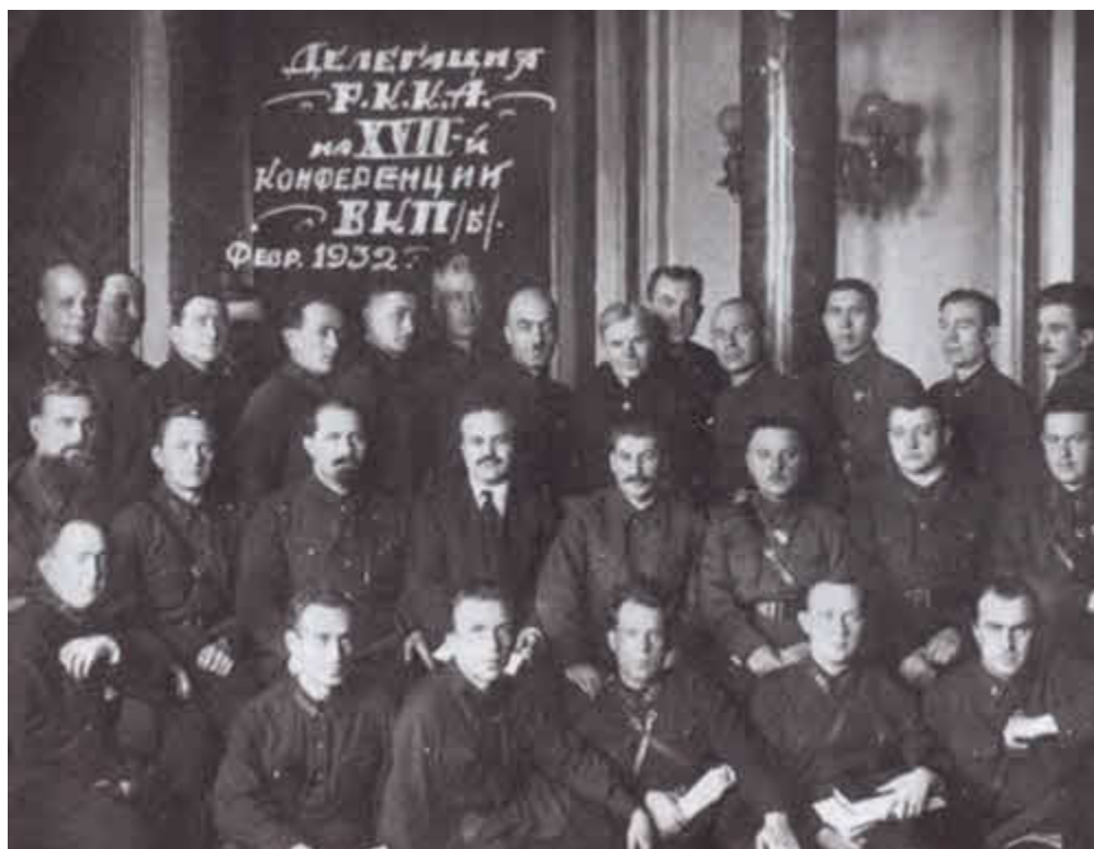
Делегация РККА (в центре — И. В. Сталин, справа от него — К. Е. Ворошилов).