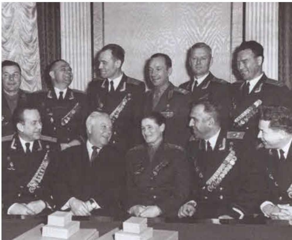
К. Е. Ворошилов (в первом ряду второй слева) среди заслуженных советских летчиков. 1959 г.