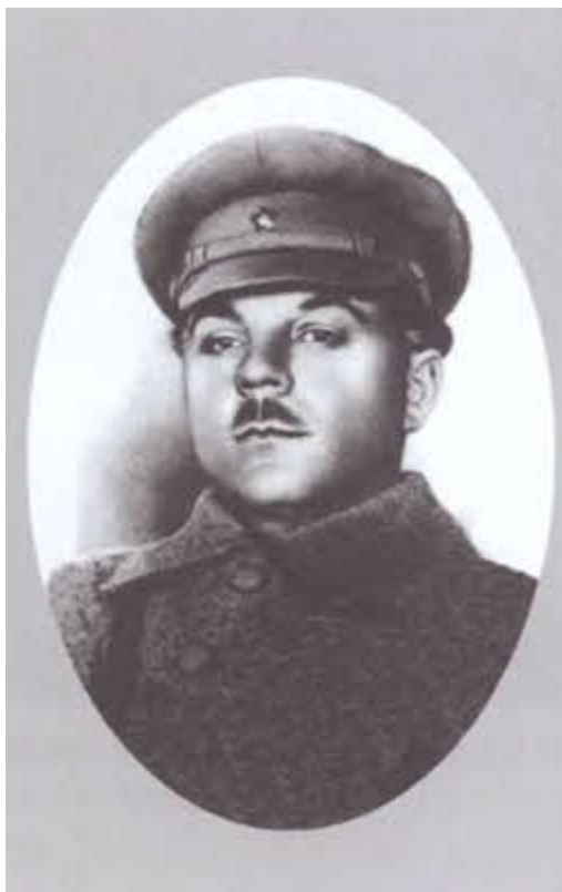
Климент Ефремович Ворошилов — член Революционно-военного совета 1-й Конной армии