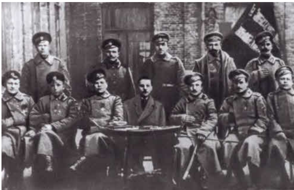
К. Е. Ворошилов среди членов исполнительного комитета Измайловского полка