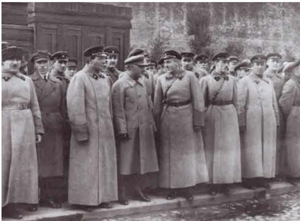
К. Е. Ворошилов и командный состав ВОХР на Красной площади.