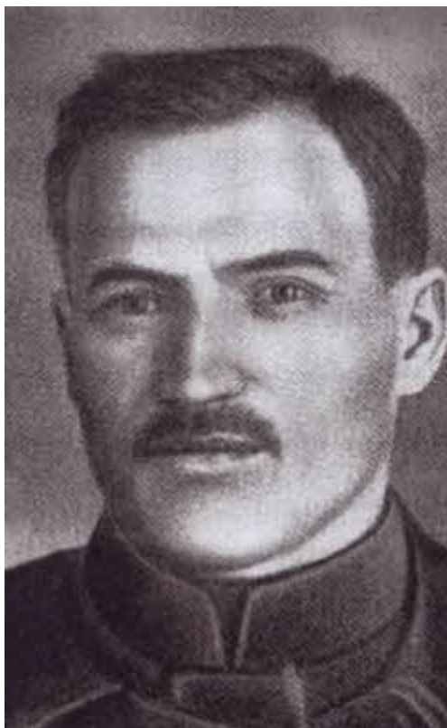
Товарищ Артем (Федор Андреевич Сергеев)