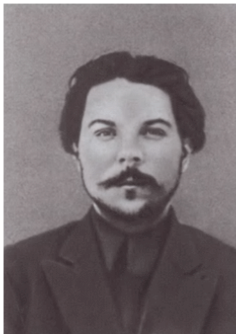
Снимки Ворошилова из охранного отделения. 1907 г.