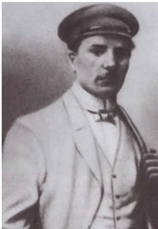
Климент Ворошилов. 1905 г.