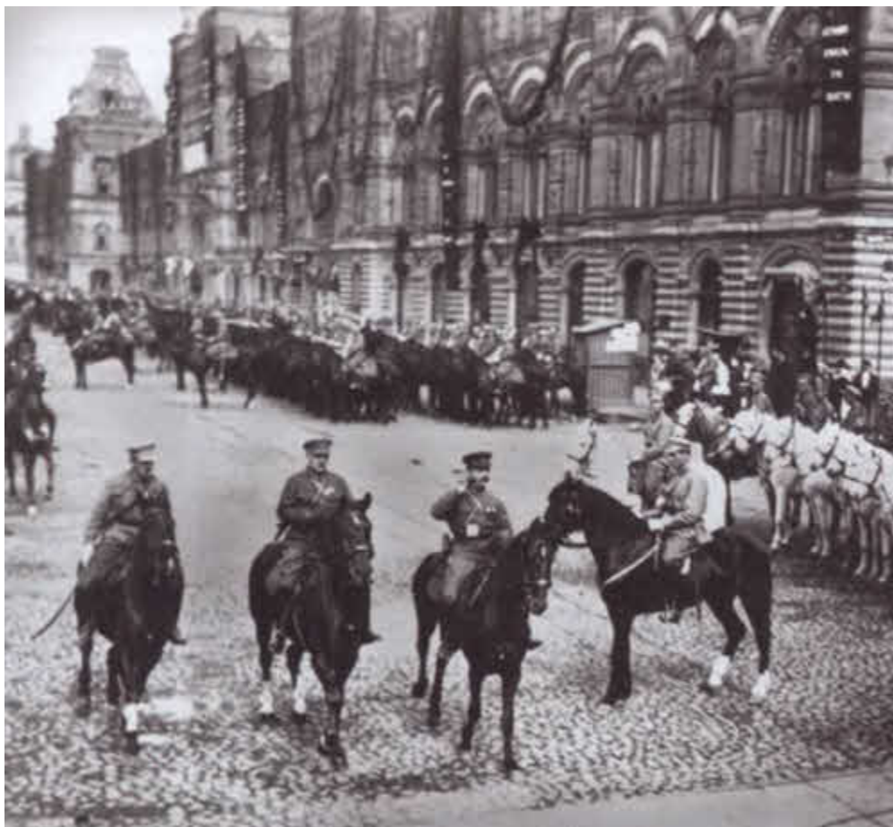
Михаил Фрунзе и Клим Ворошилов на параде в Москве. 1924 г.