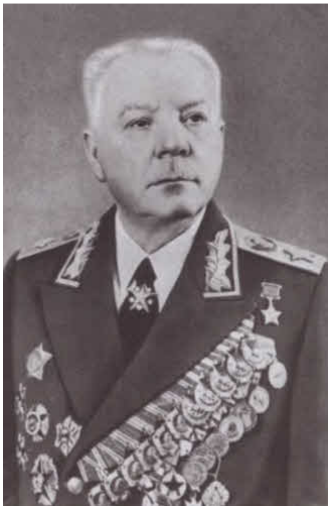
Маршал К. Е. Ворошилов