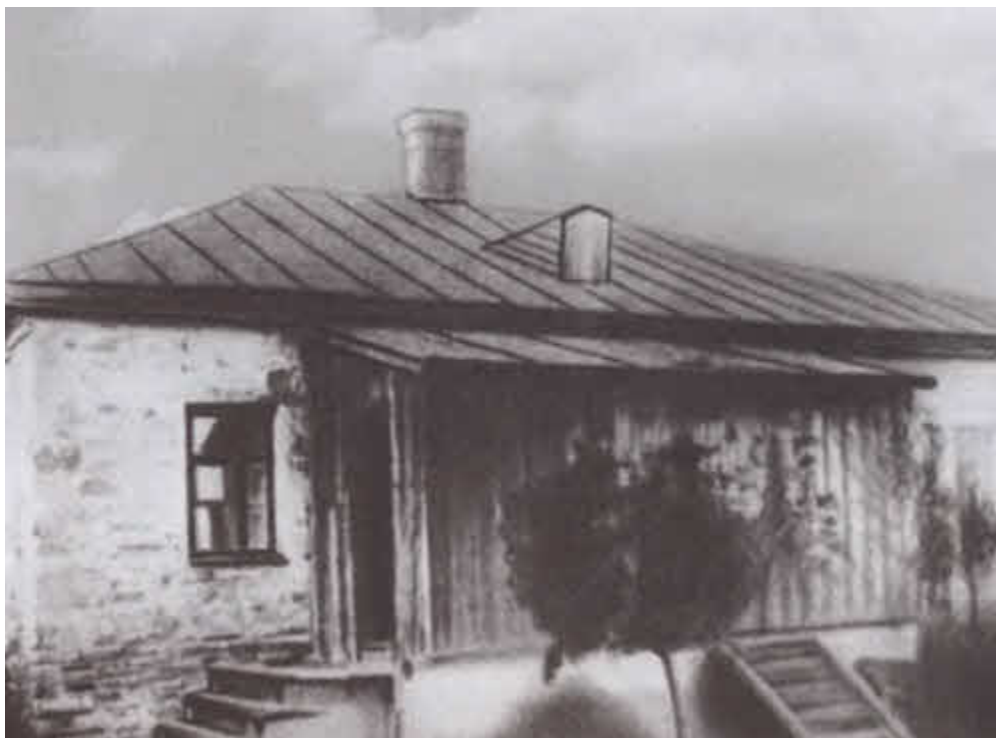
Хата в селе Васильевка, где прошли детские годы Климента Ефремовича Ворошилова