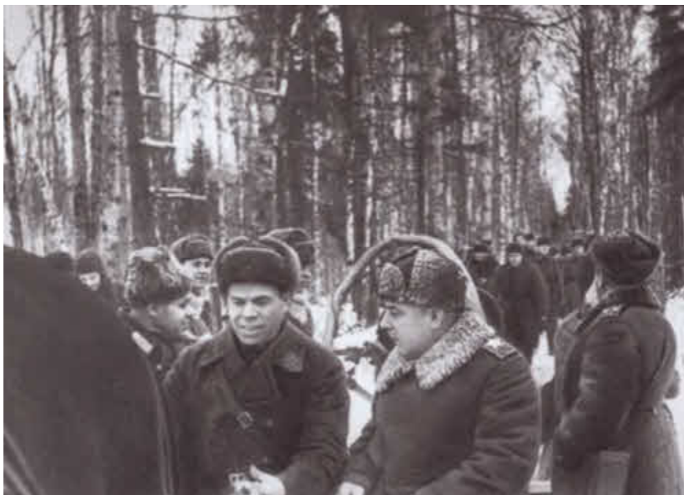
К. Е. Ворошилов на одном из участков Ленинградского фронта в годы войны