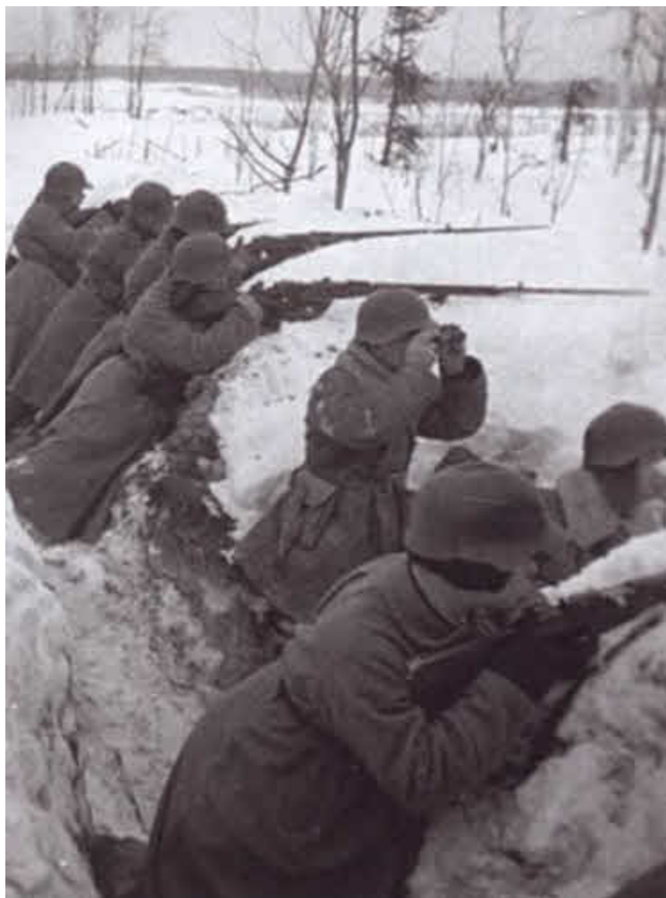
Советско-финляндская война. Бойцы 7-й армии ведут огонь по врагу из винтовок.