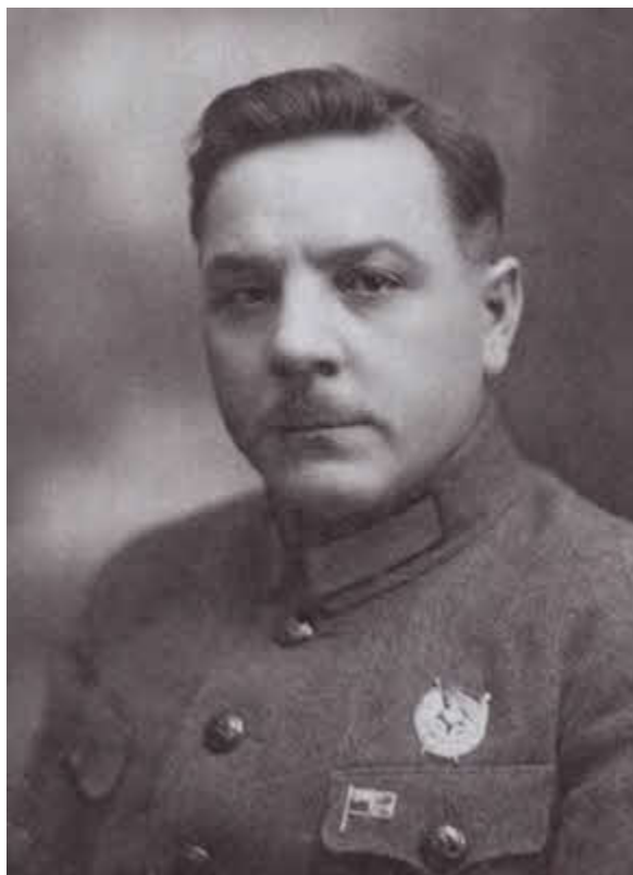
Климент Ефремович Ворошилов.