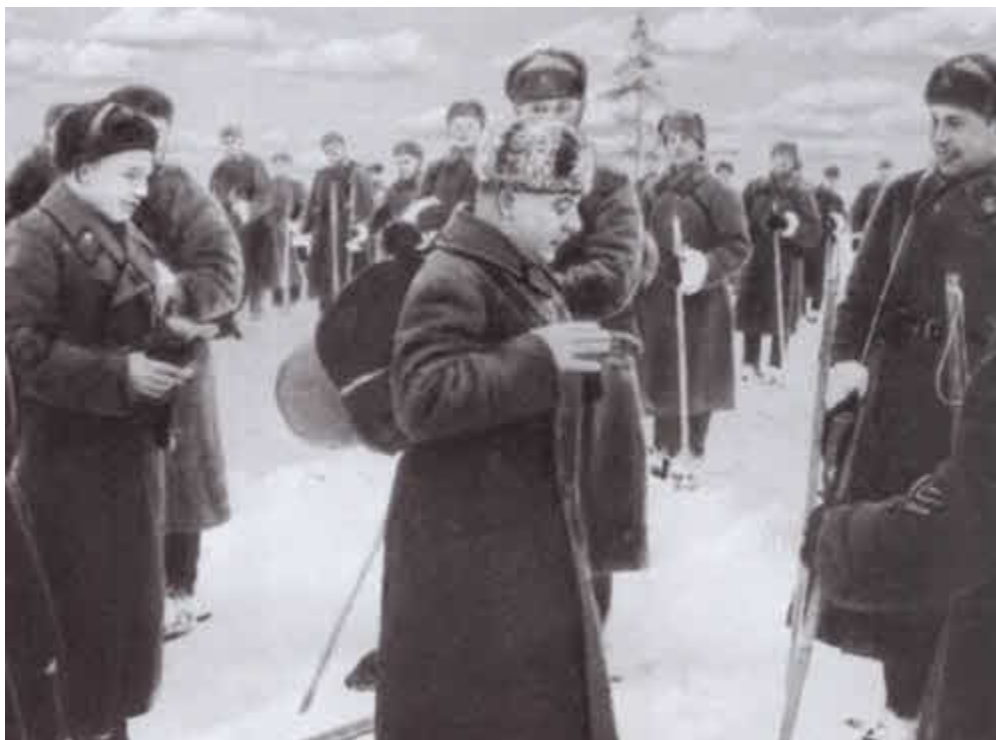
К. Е. Ворошилов с группой лыжников в зоне формирования резервов. 1942 г.