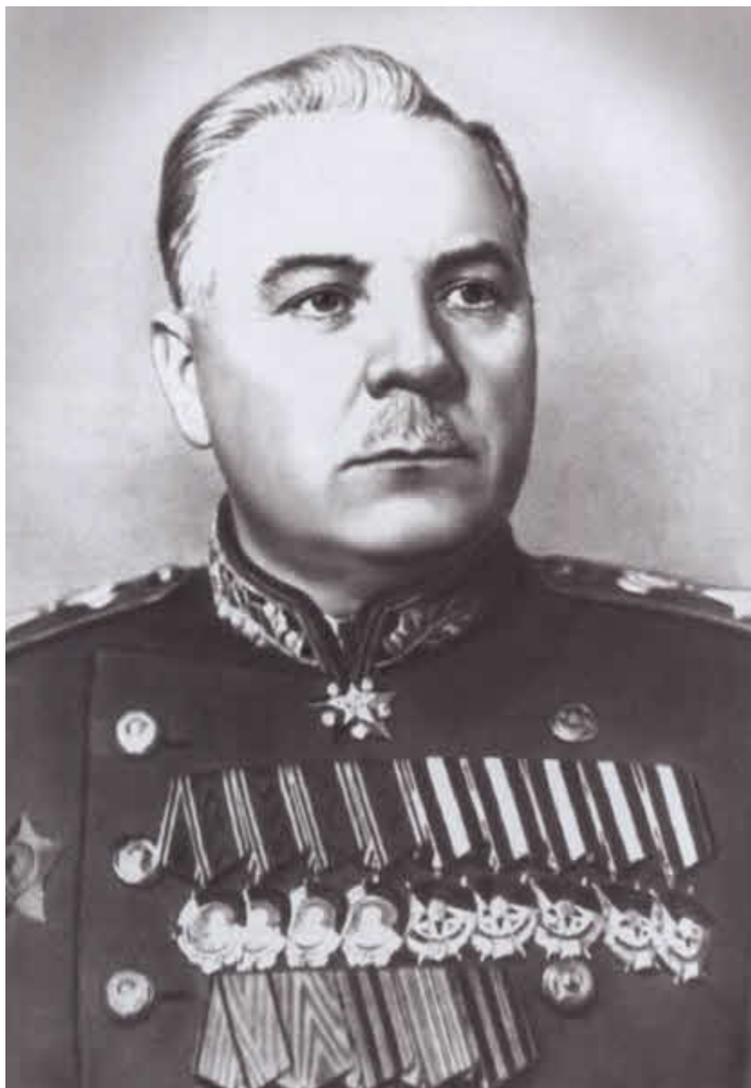
Маршал Советского Союза Климент Ефремович Ворошилов