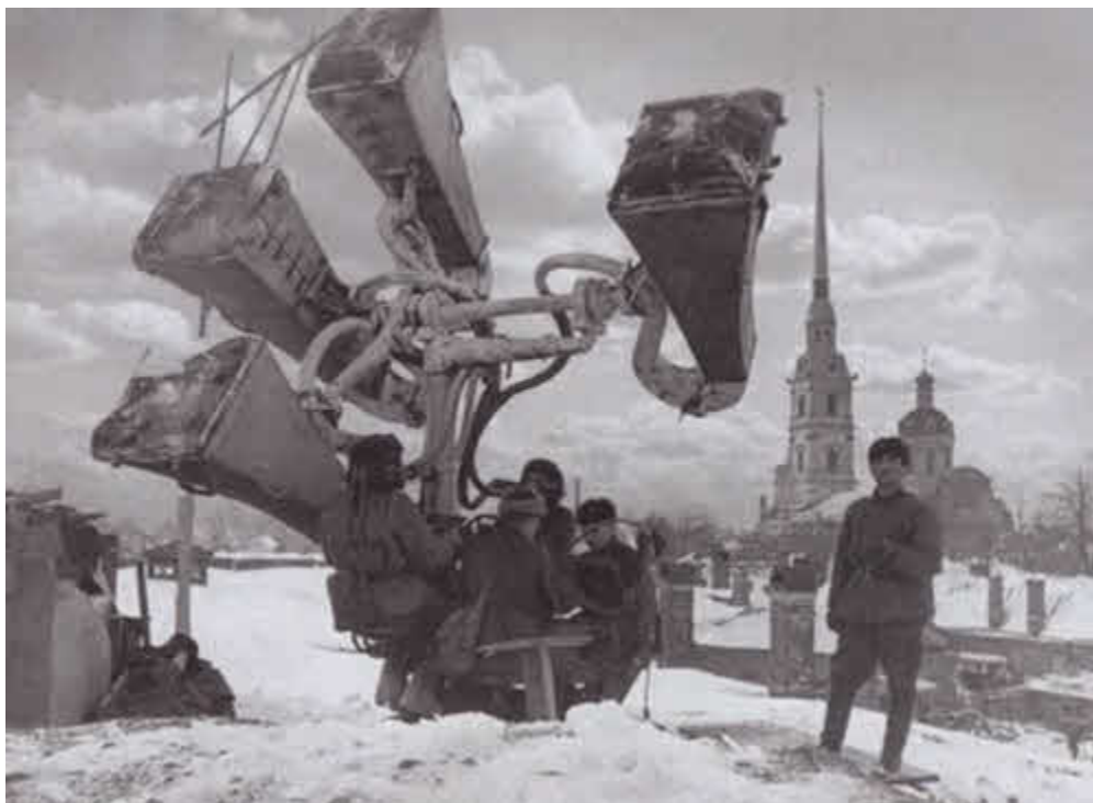
Боевой расчет звукоулавливающей установки сторожит ленинградское небо