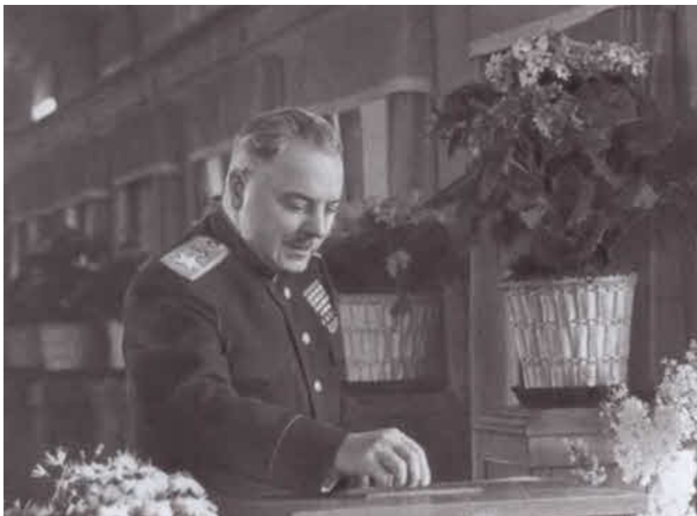
К. Е. Ворошилов на избирательном участке. 1946 г.