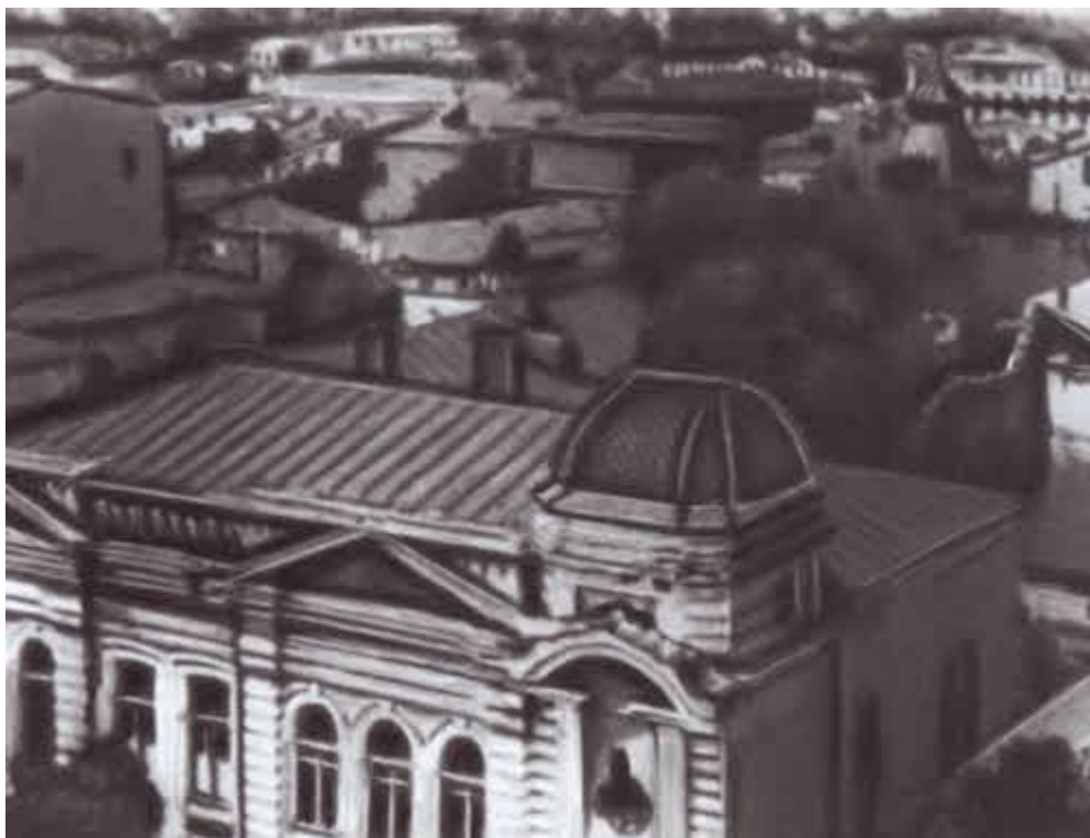
Общий вид старого Луганска