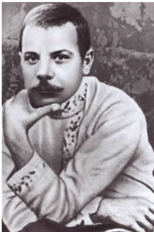
Клим Ворошилов в молодости