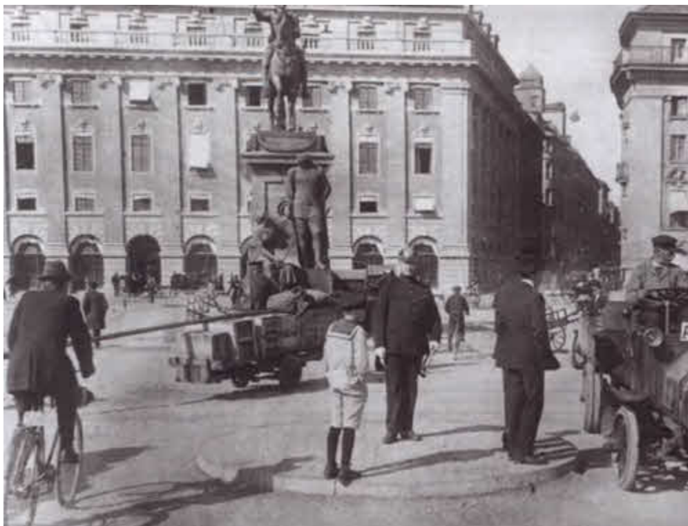
Стокгольм в 1906 году, во время IV (объединительного) съезда РСДРП