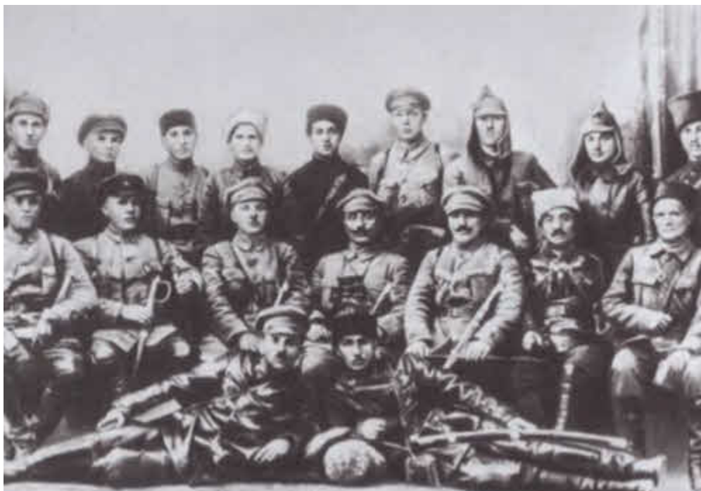
К. Е. Ворошилов и С. М. Буденный с командирами и политработниками 1-й Конной армии. Майкоп. 1920 г.