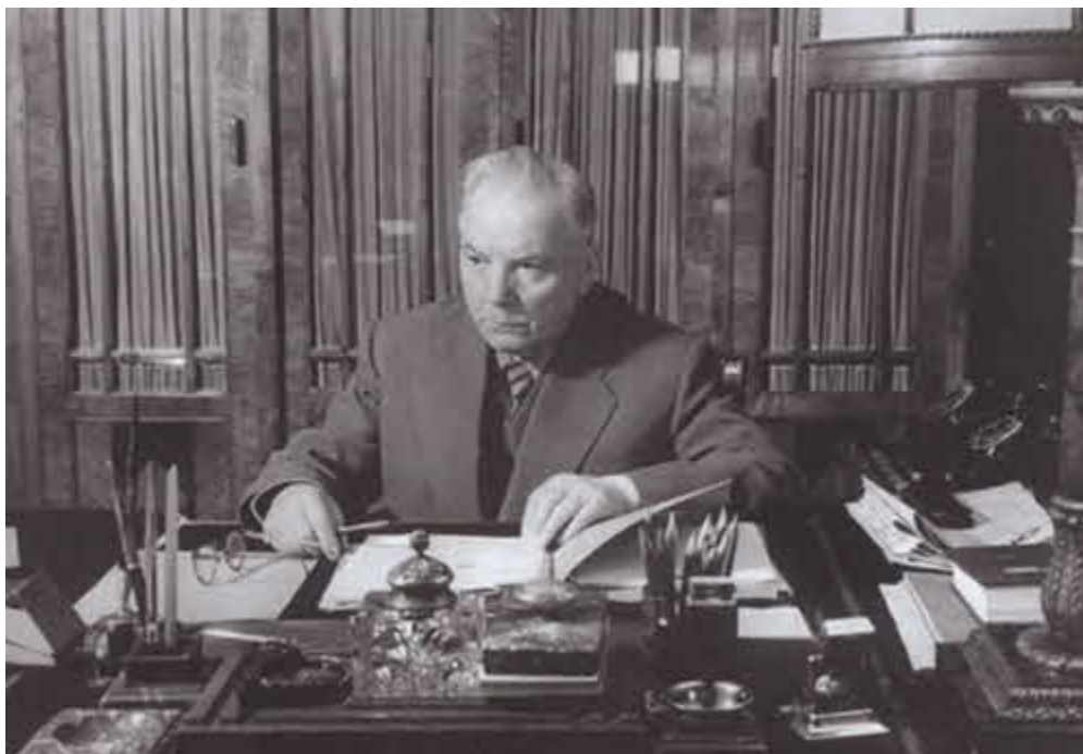
Председатель Президиума Верховного Совета СССР К. Е. Ворошилов