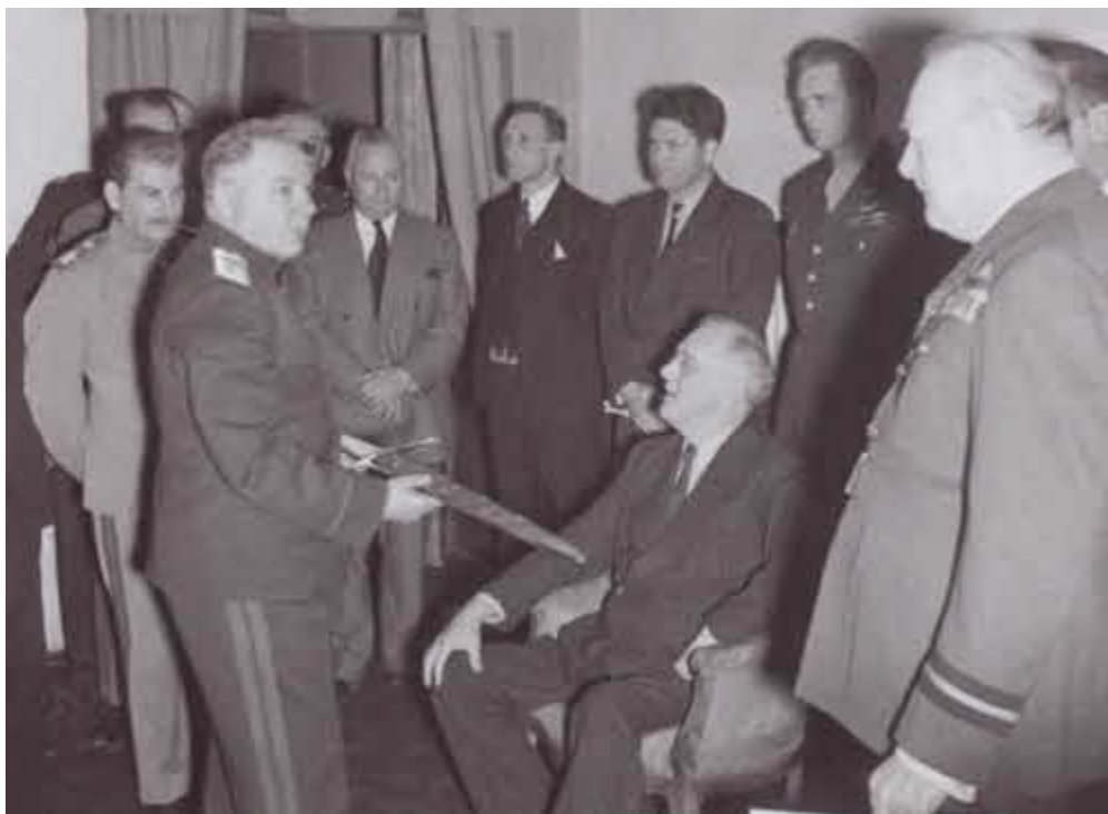
Маршал Ворошилов держит почетный меч — дар короля Георга VI, преподнесенный Уинстоном Черчиллем Иосифу Сталину на Тегеранской конференции. 1943 г.