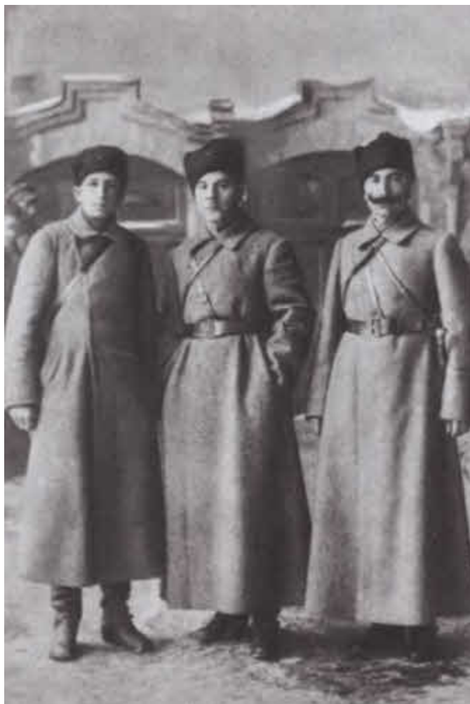
А. С. Бубнов, К. Е. Ворошилов и С. М. Буденный.