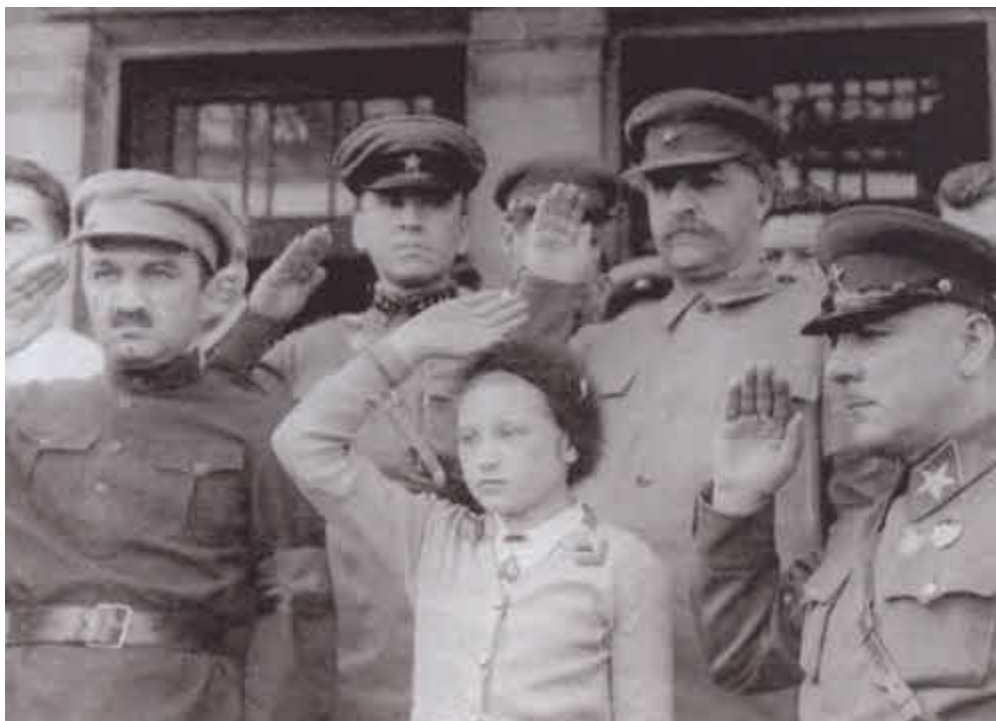
Климент Ефремович Ворошилов (справа), Георгий Константинович Орджоникидзе (за плечом Ворошилова), дочь Орджоникидзе и Анастас Иванович Микоян