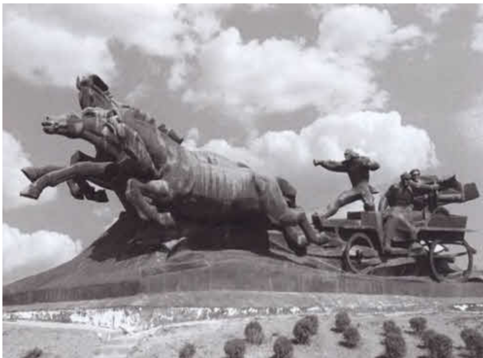
Пулеметная тачанка 1-й Конной армии.

Памятник установлен на южном въезде в Ростов-на-Дону, где в начале 1920 года проходили жестокие бои между красной кавалерией и белогвардейцами