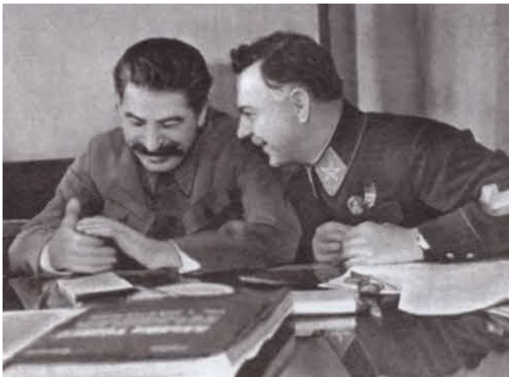
Сталин и Ворошилов