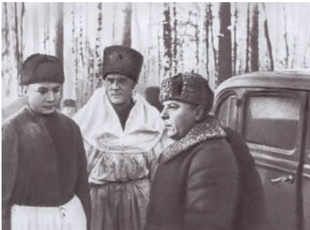
К. Е. Ворошилов на Волховском фронте.