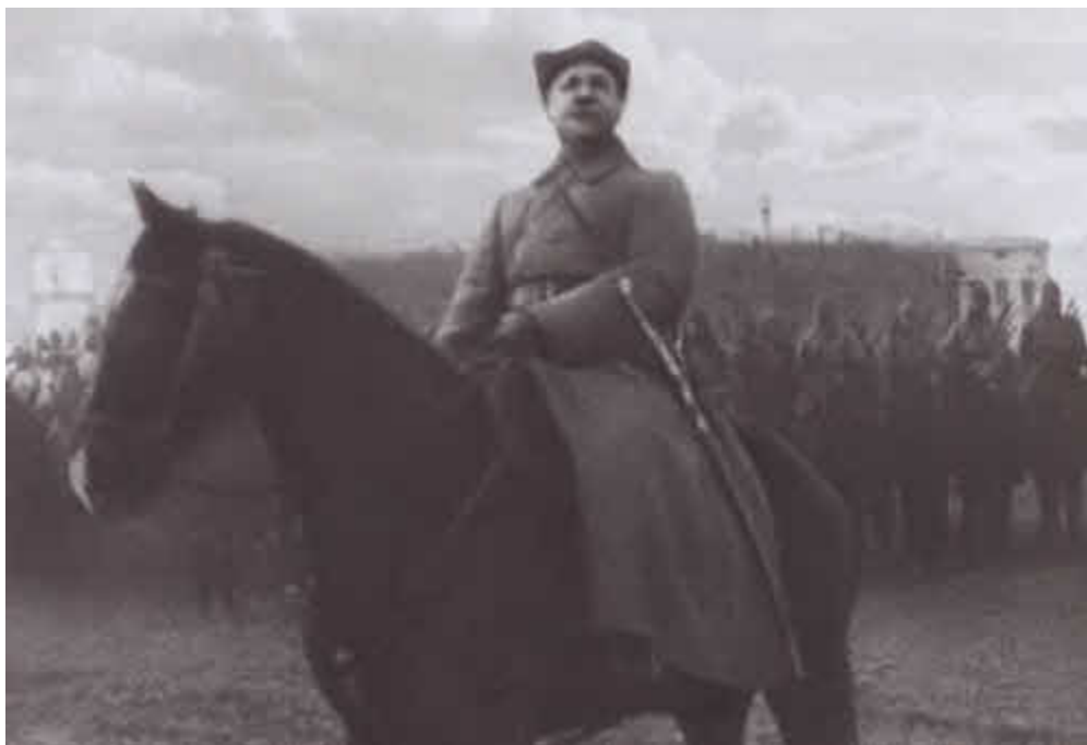
Климент Ефремович Ворошилов на Южном фронте