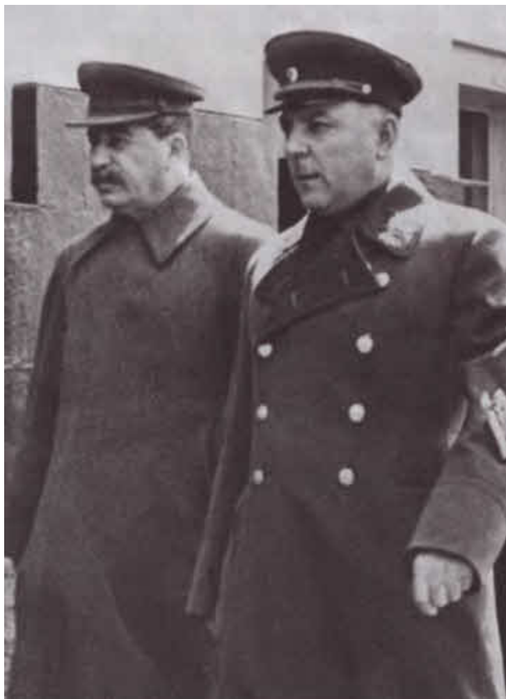
И. В. Сталин и К. Е. Ворошилов в Кремле. 1947 г.