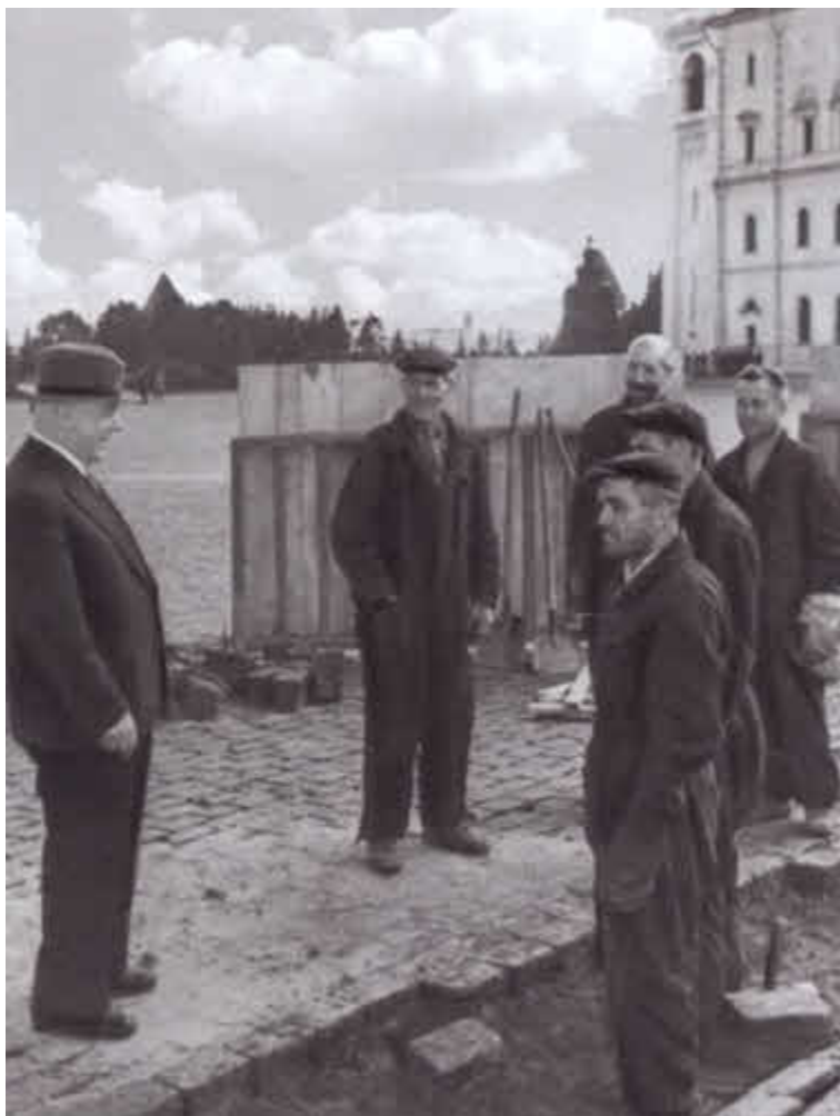
К. Е. Ворошилов беседует с рабочими, ремонтирующими мостовую в Кремле.