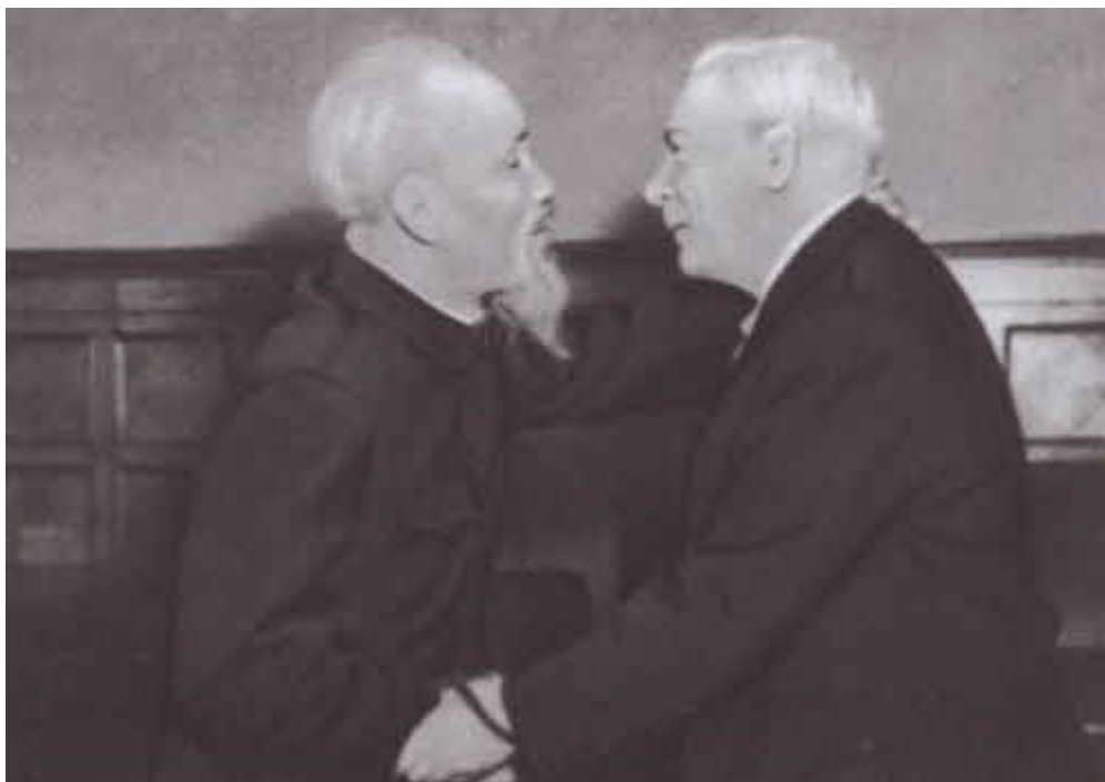
К. Е. Ворошилов и президент Вьетнама Хо Ши Мин.