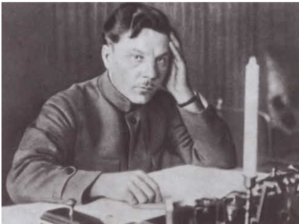
Народный комиссар внутренних дел Украины Климент Ефремович Ворошилов.