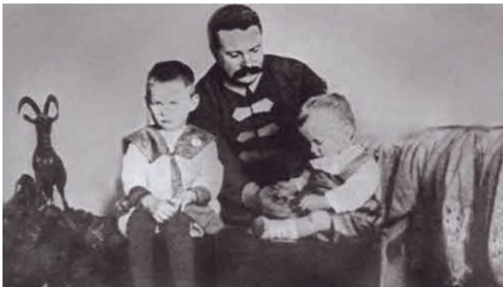
Михаил Васильевич Фрунзе с детьми Тимуром и Татьяной в 1924 году.

С 1931 года они будут воспитываться в семье Ворошиловых