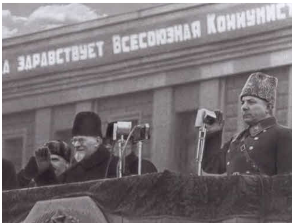
М. И. Калинин и К. Е. Ворошилов на трибуне во время парада 7 ноября 1941 года в городе Куйбышеве