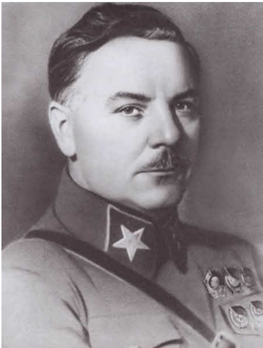
Первый маршал Советского Союза Клим Ворошилов