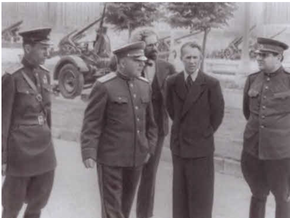
К. Е. Ворошилов осматривает выставку трофейного оружия. Москва. 1944 г.