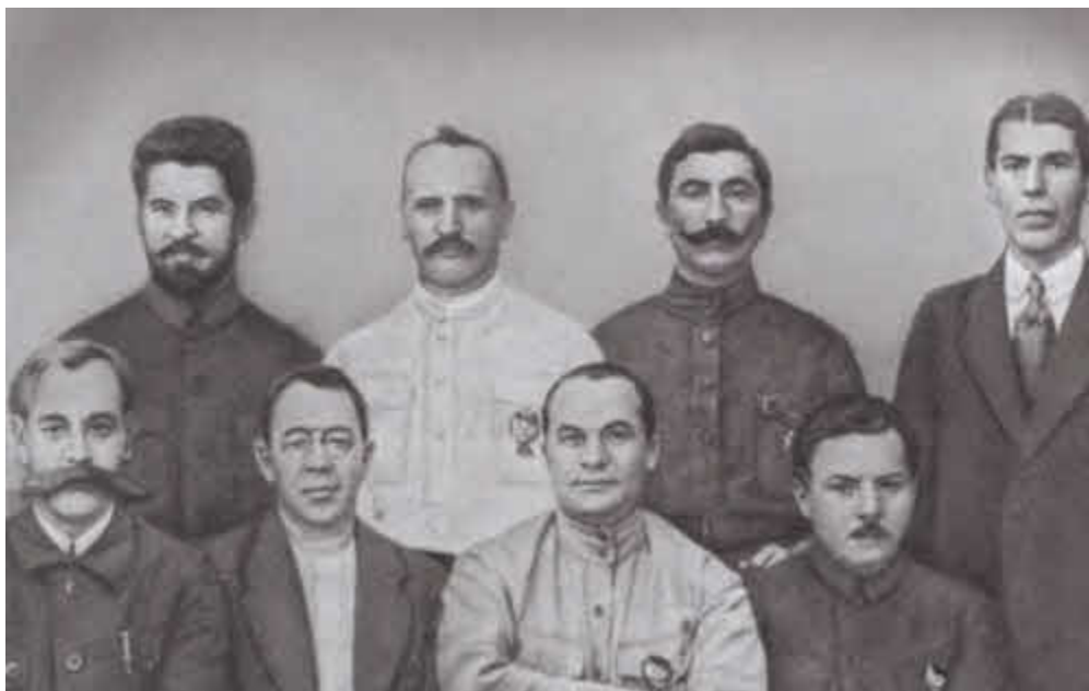
К. Е. Ворошилов (в первом ряду справа) среди командования 1-й Конной армии