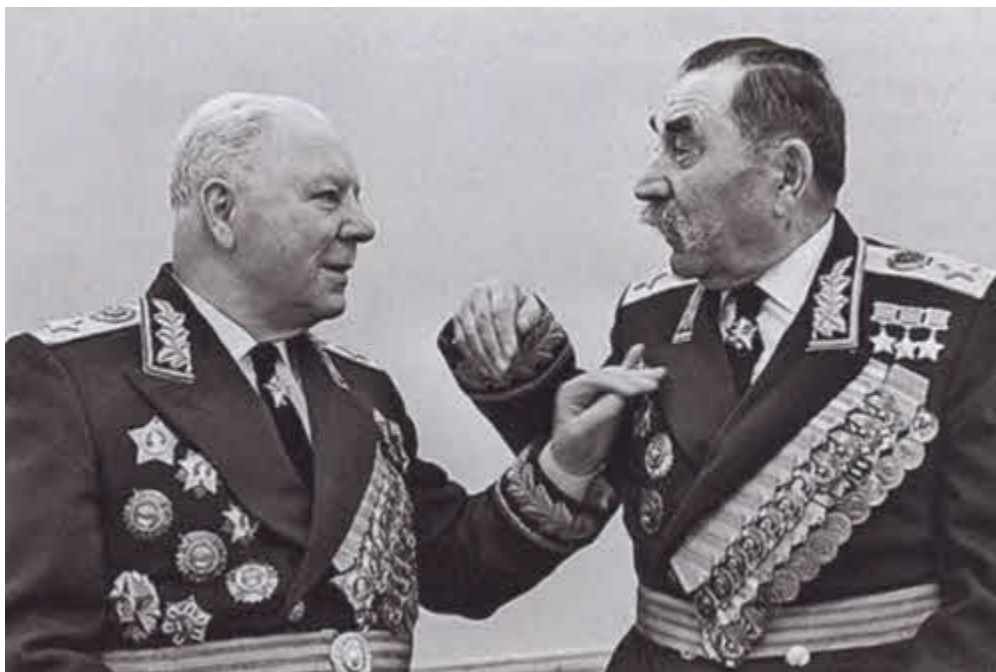
«А помнишь...». Друзья-маршалы, бывшие первоконники: К. Е. Ворошилов и С. М. Буденный