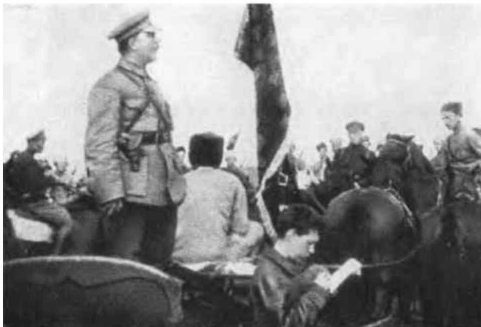
К. Е. Ворошилов выступает перед бойцами 1-й Конной армии. Май 1920 г.