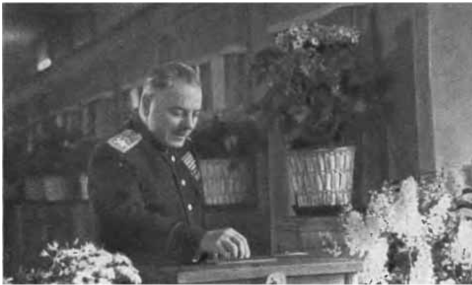
К. Е. Ворошилов на избирательном участке. 1946 г.