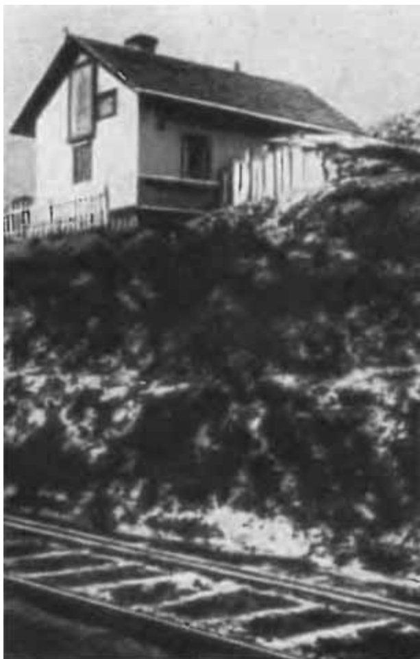
Железнодорожная будка на линии Екатерининской (ныне Донецкой) железной дороги, где родился К. Е. Ворошилов.