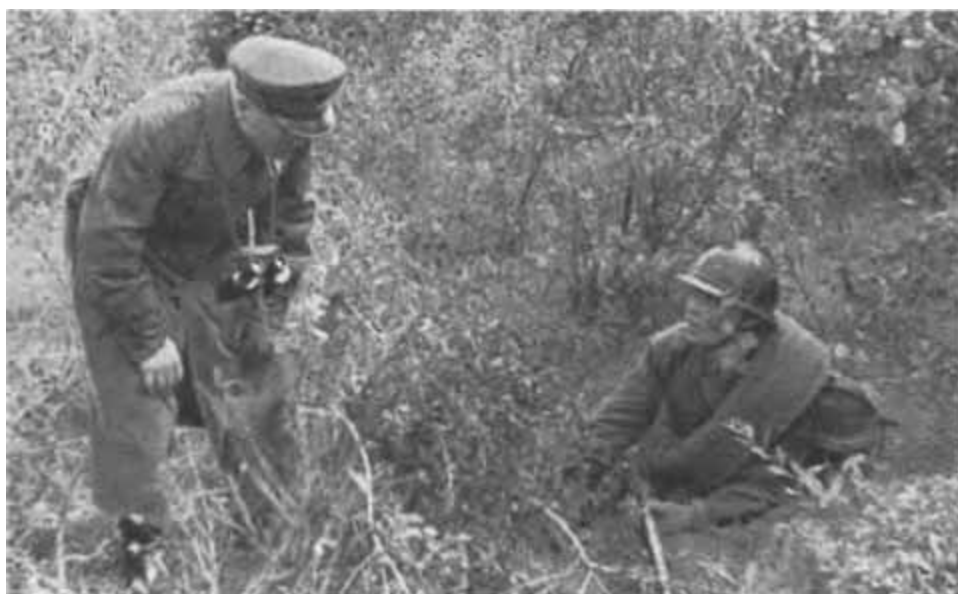
К. Е. Ворошилов на маневрах БВО беседует с бойцом. 1936 г.