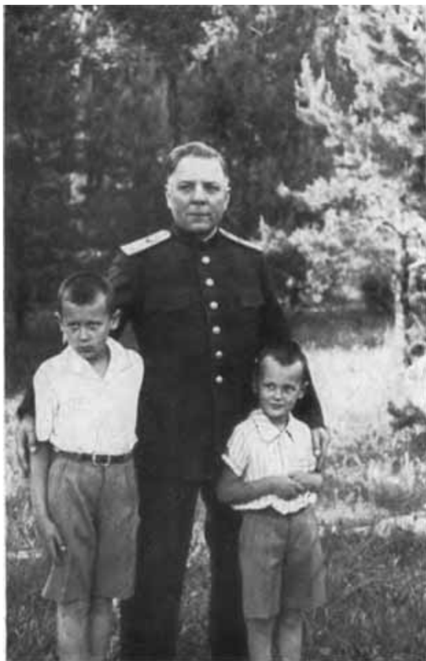
К. Е. Ворошилов с внуками Климом и Володи́ей.