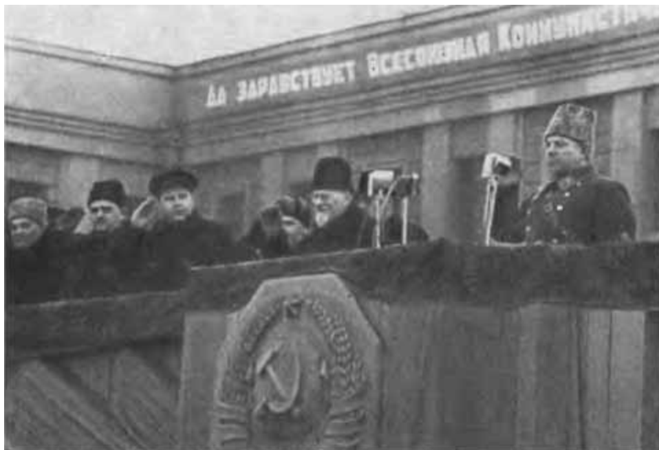
К. Е. Ворошилов, М. И. Калинин, А. А. Андреев, Н. А. Вознесенский, Н. М. Шверник, М. Ф. Шкирятов на трибуне во время парада в Куйбышеве 7 ноября 1941 г.