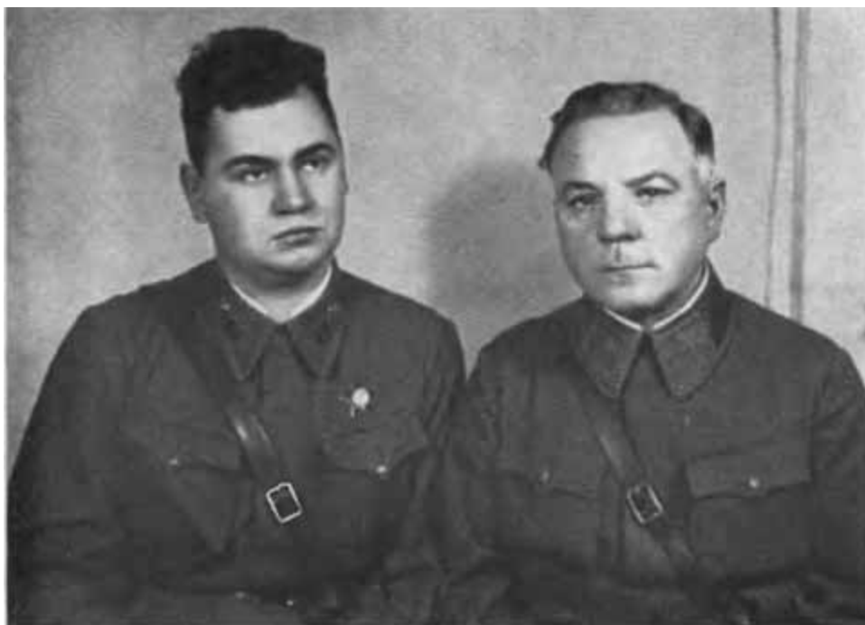
К. Е. Ворошилов с сыном Петром. Конец 30-х годов.

К. Е. Ворошилов принимает рабочих в Наркомате обороны. 1936 г.