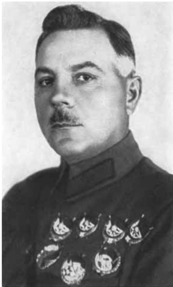
К. Е. Ворошилов. Октябрь 1933 г.