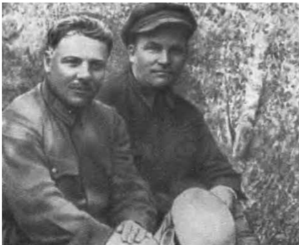
К. Е. Ворошилов и С. М. Киров на инспекторских стрельбах ЛВО. 1929 г.