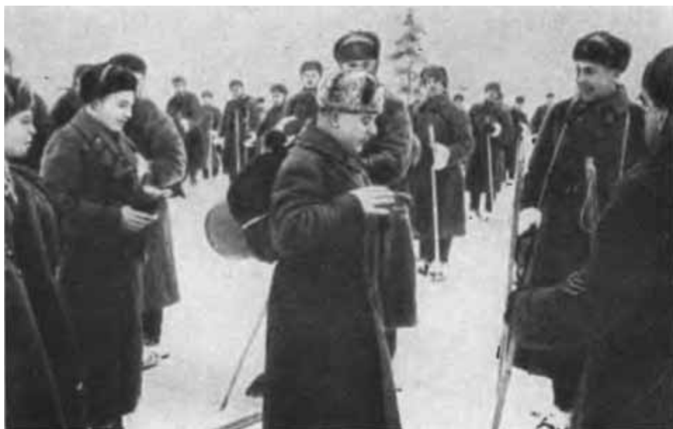
К. Е. Ворошилов с группой лыжников в зоне формирования резервов. 1942 г.