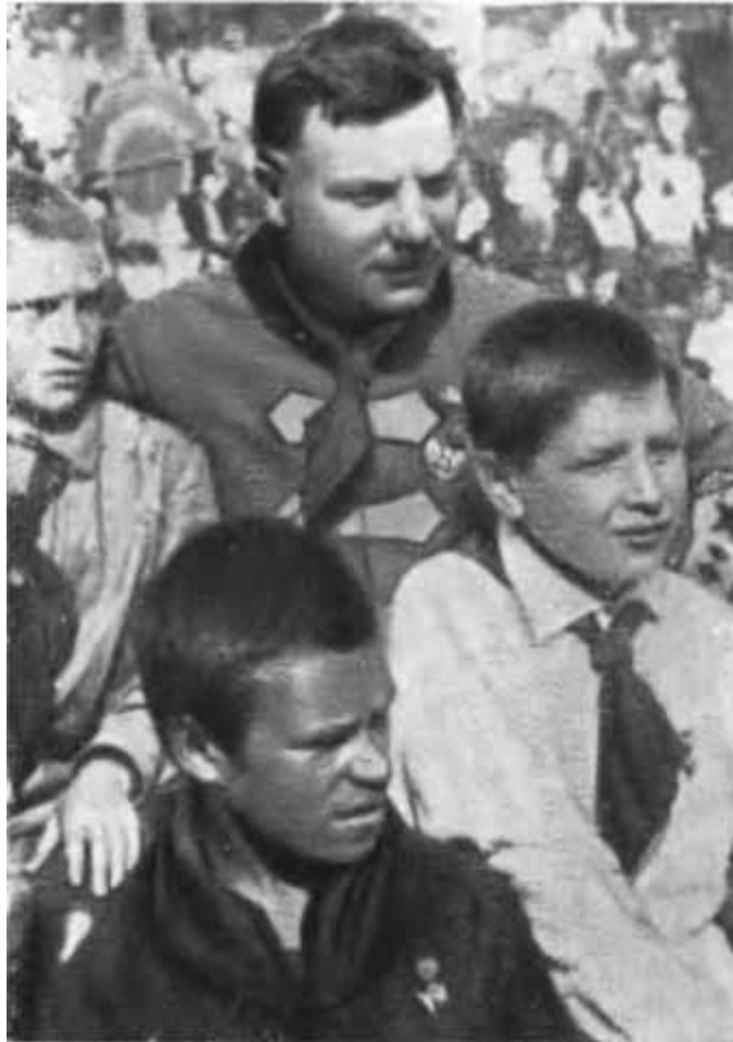
К. Е. Ворошилов среди пионеров. 1925 г.