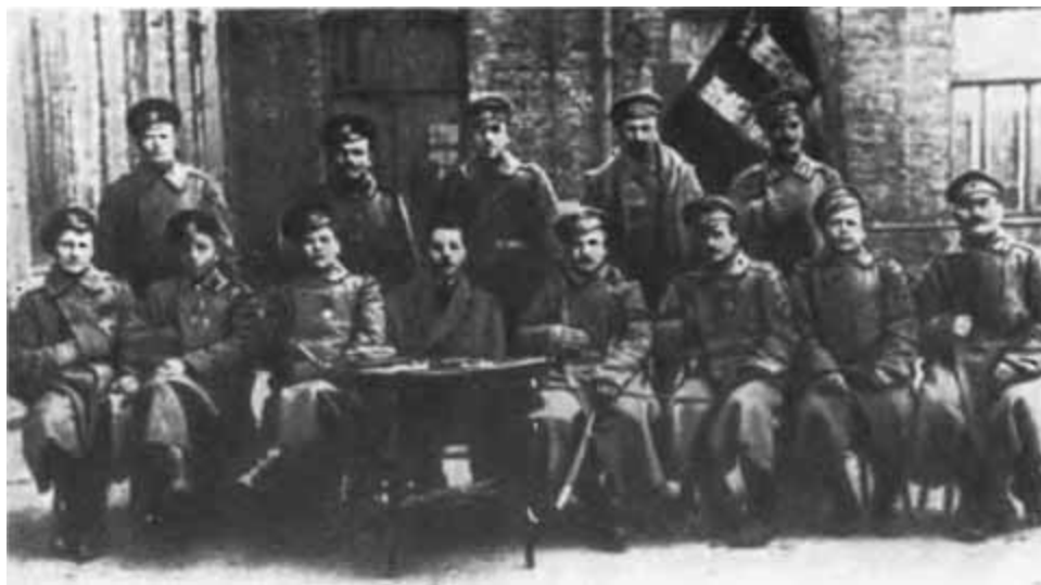
К. Е. Ворошилов среди членов полкового комитета Измайловского полка. 1917 г.