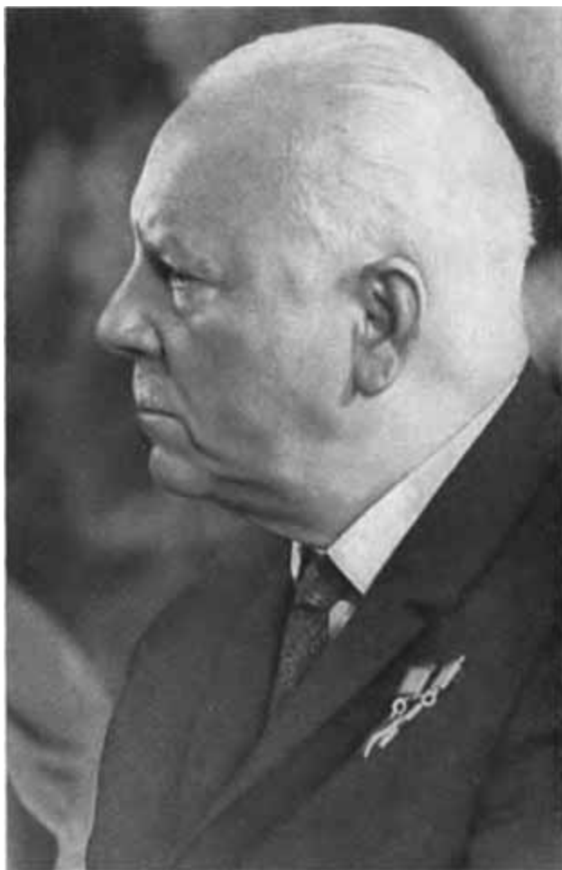
К. Е. Ворошилов. 25 августа 1966 г.