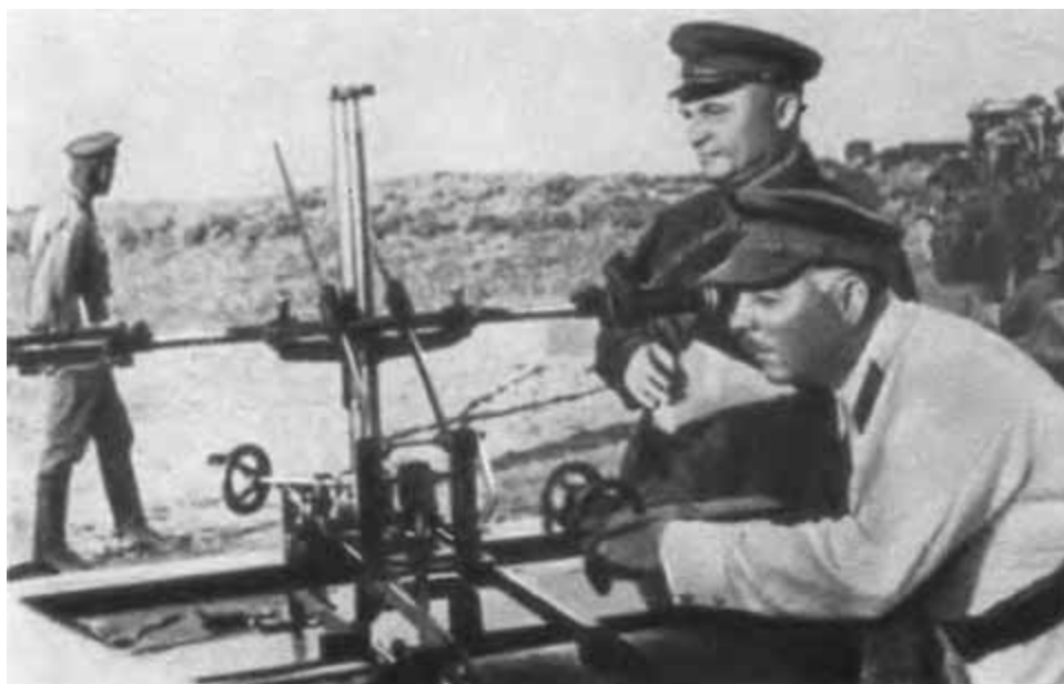
К. Е Ворошилов и А. И. Егоров на береговой артиллерийской батарее. 1932 г.