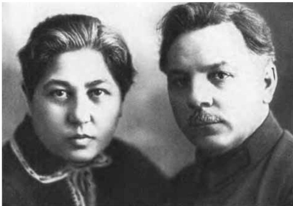
К. Е. Ворошилов и Е. Д. Ворошилова. Май 1930 г.