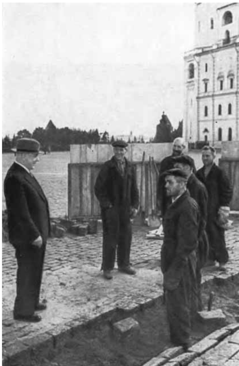
К. Е. Ворошилов беседует с рабочими, ремонтирующими мостовую в Кремле. 4 сентября 1956 г.