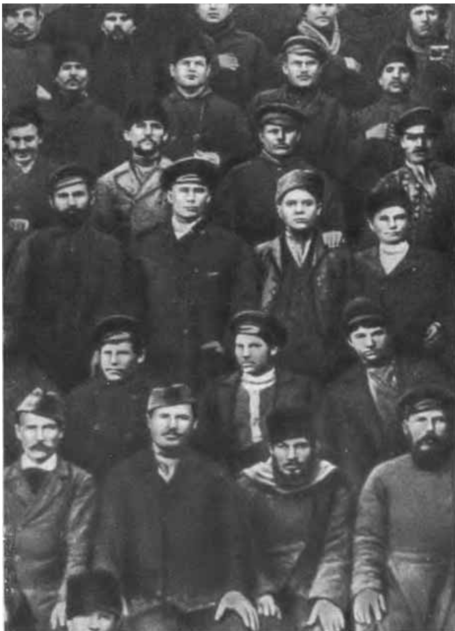
К. Е. Ворошилов (второй справа в третьем ряду) в группе рабочих завода ДЮМО. 1896 г.