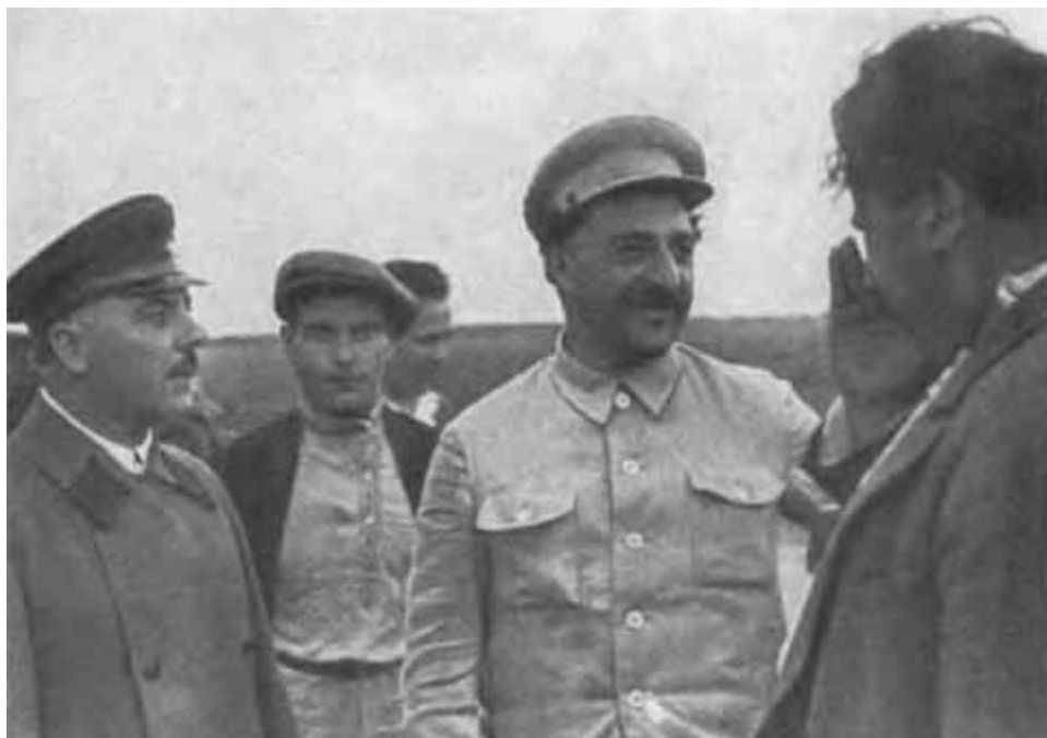
К. Е. Ворошилов и С. Орджоникидзе на Центральном аэродроме. 1935 г.