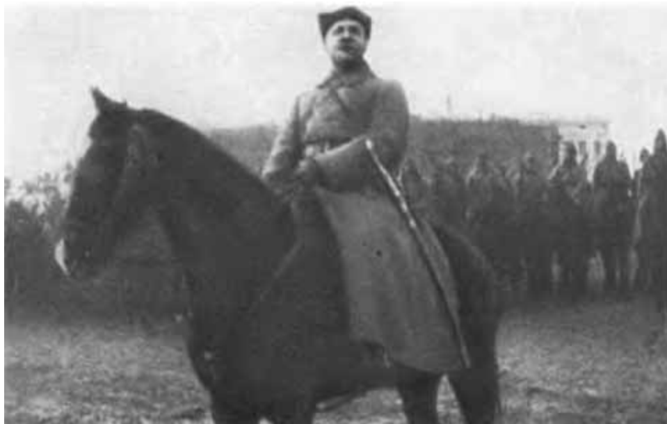
К. Е. Ворошилов. Южный фронт.