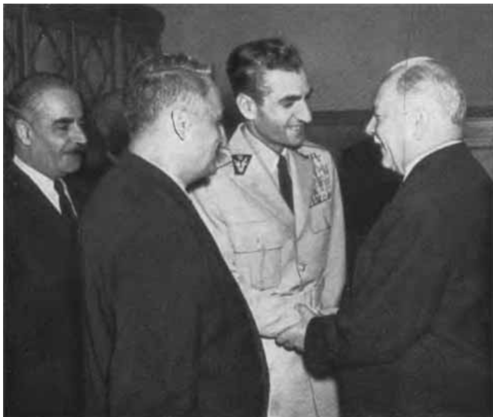
К. Е. Ворошилов принимает в Кремле шахиншаха Ирана Мохамеда Реза Пехлеви. Июнь 1956 г.