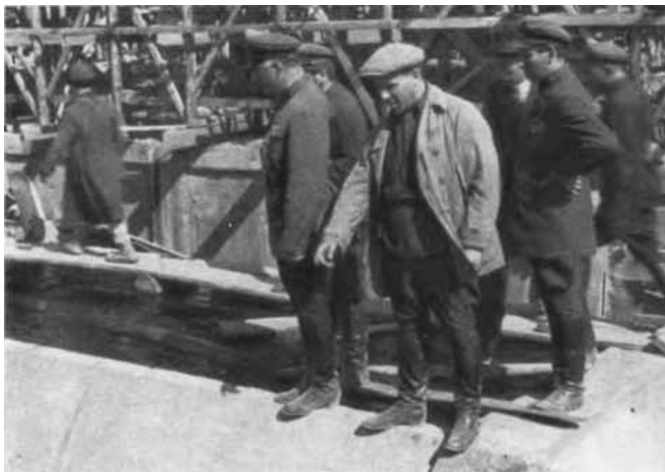
К. Е. Ворошилов на Магнитострое. 1931 г.