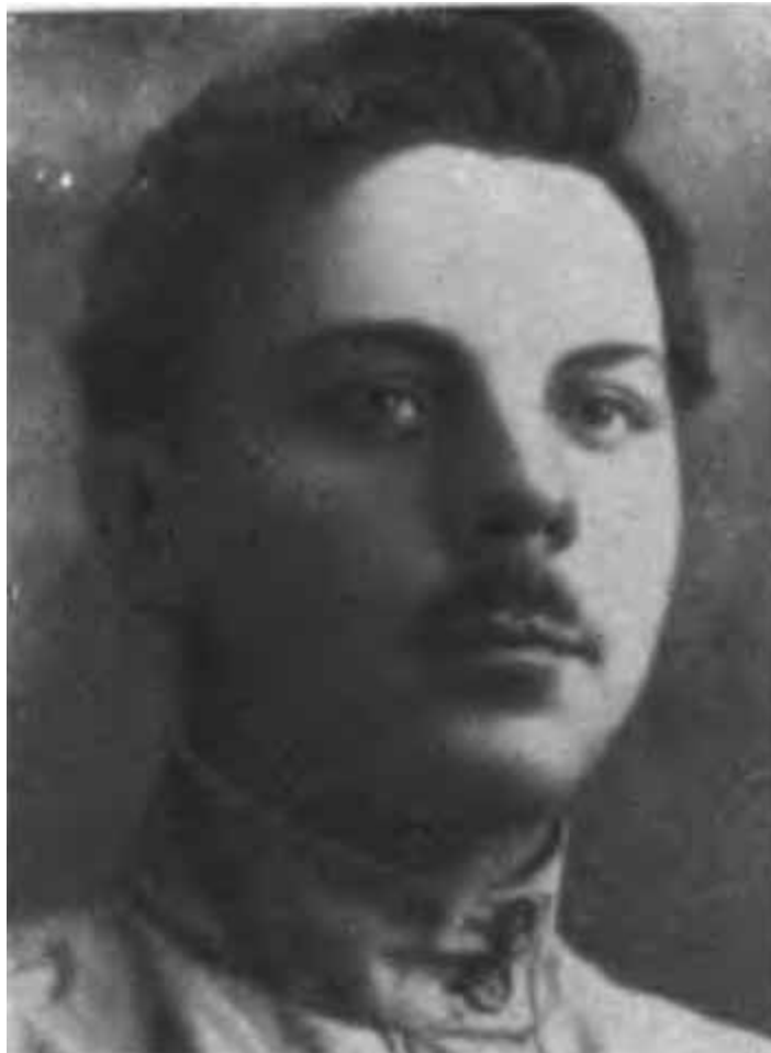
К. Е. Ворошилов — рабочий завода Гартмана. 1903 г.