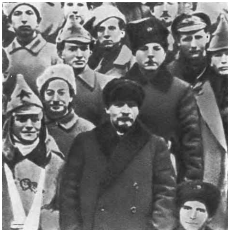
В. И. Ленин и К. Е. Ворошилов среди делегатов X съезда РКП(б) — участников ликвидации кронштадтского мятежа. 1921 г.