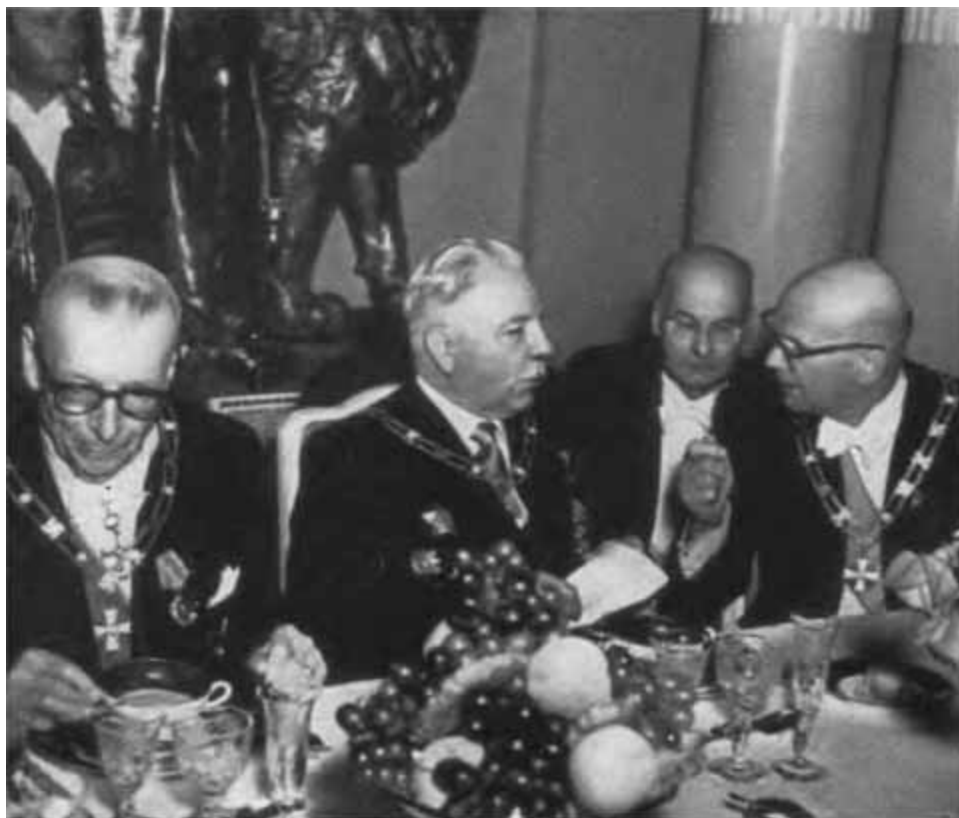
На торжественном обеде в честь К. Е. Ворошилова у президента Финляндской Республики У. К. Кекконена (справа). Слева — Ю. К. Паасикиви. 21 августа 1951 г.