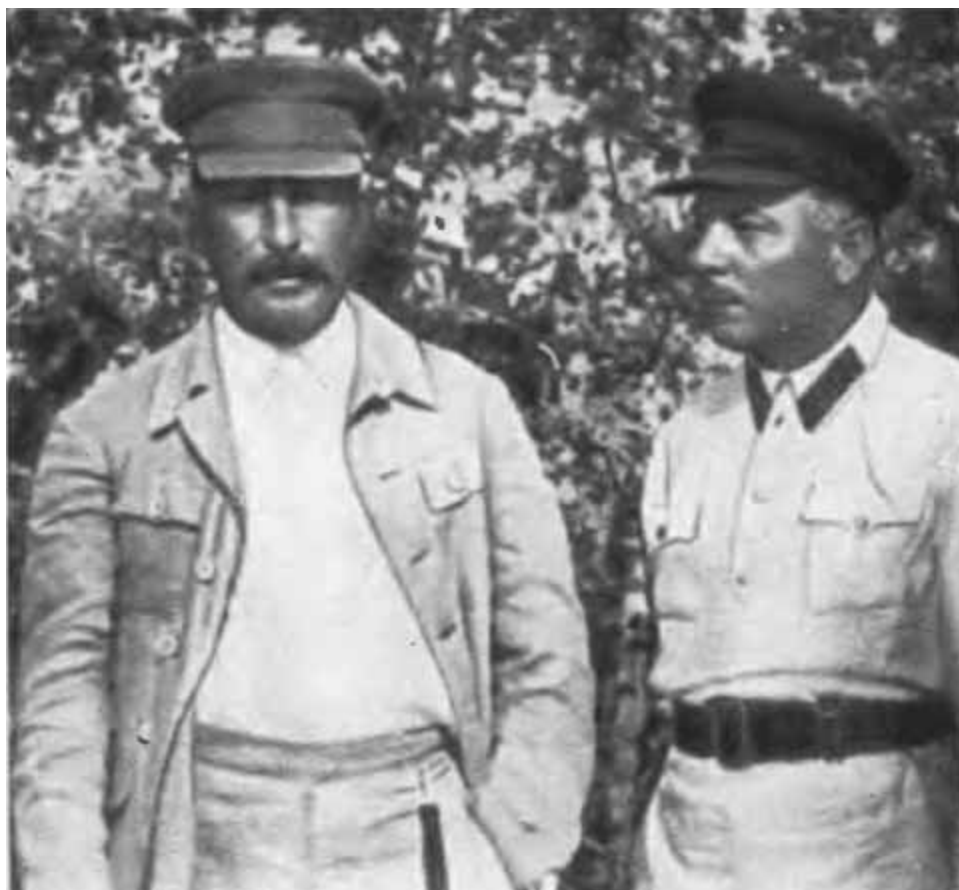
К. Е. Ворошилов и И. В. Сталин.