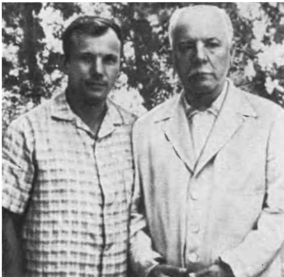
К. Е. Ворошилов и Ю. А. Гагарин. Сочи, 1961 г.