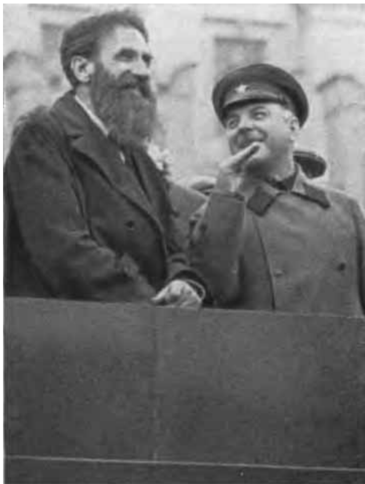
К. Е. Ворошилов и О. Ю. Шмидт на трибуне Мавзолея. 1934 г.