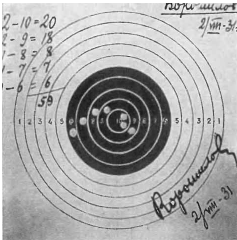
Мишень, по которой стрелял К. Е. Ворошилов 2 августа 1931 г.