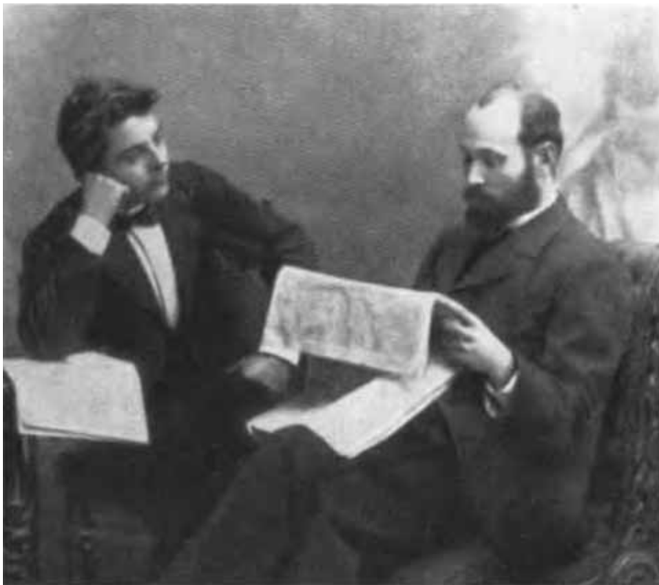
К. Е. Ворошилов и С. М. Рыжков. 1898–1901 гг.