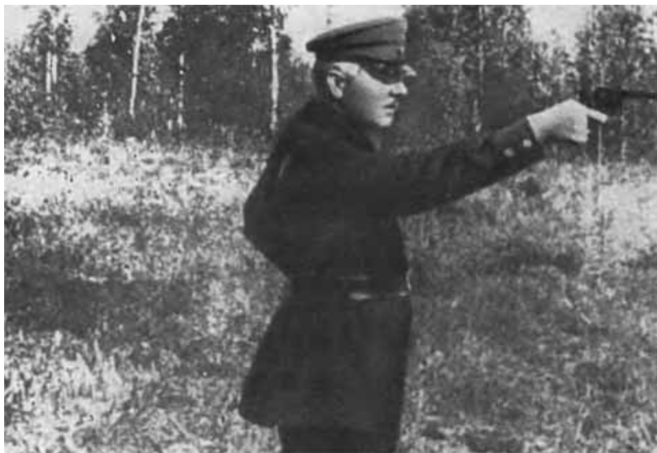
К. Е. Ворошилов стреляет из нагана. 1931 г.