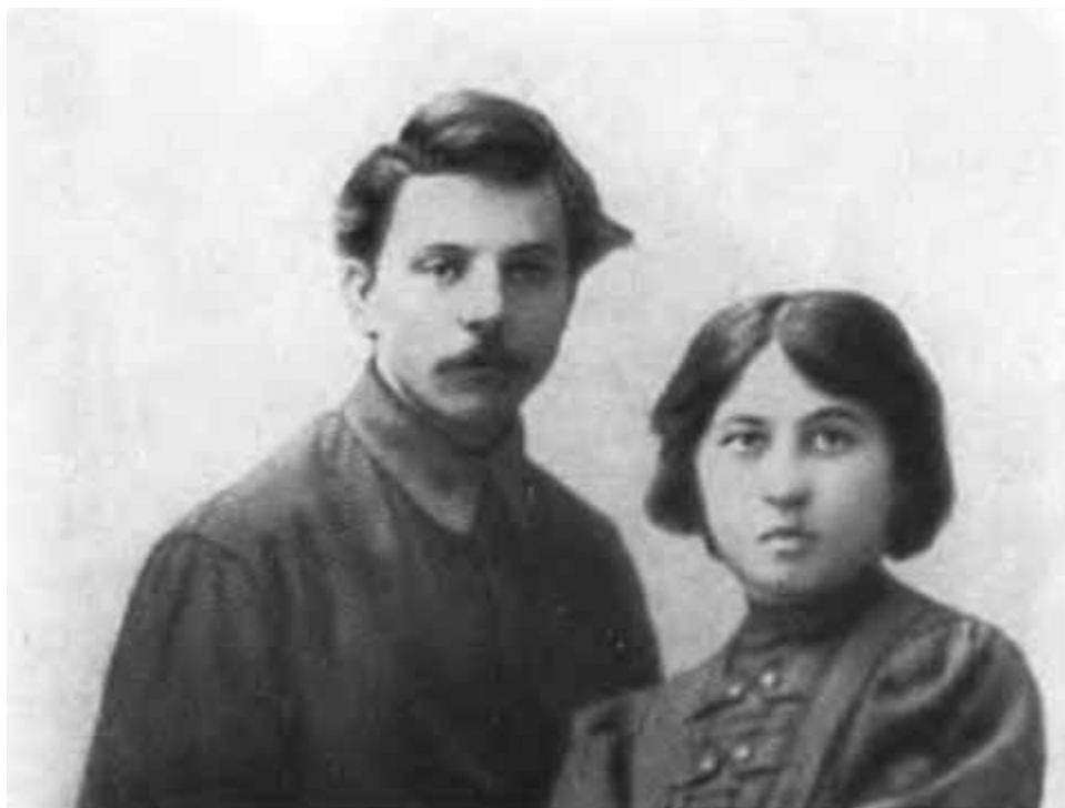
К. Е. Ворошилов и Е. Д. Ворошилова в ссылке.