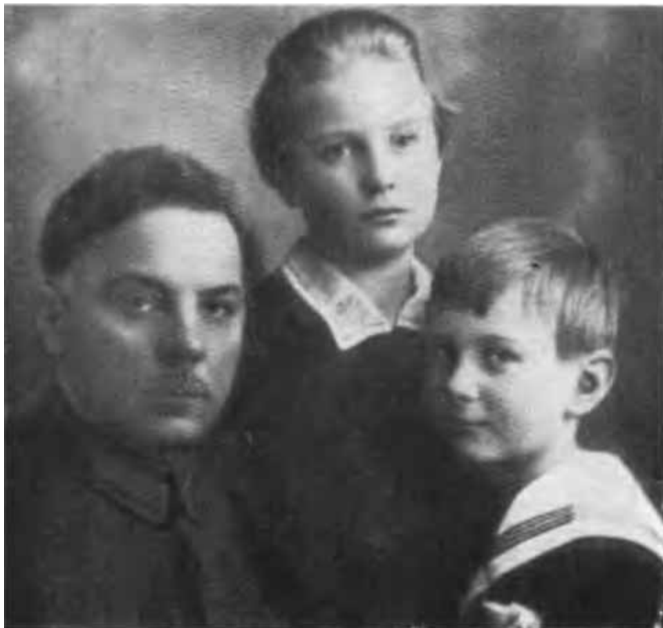
К. Е. Ворошилов с детьми М. В. Фрунзе Татьяной и Тимуром. 1926 г.