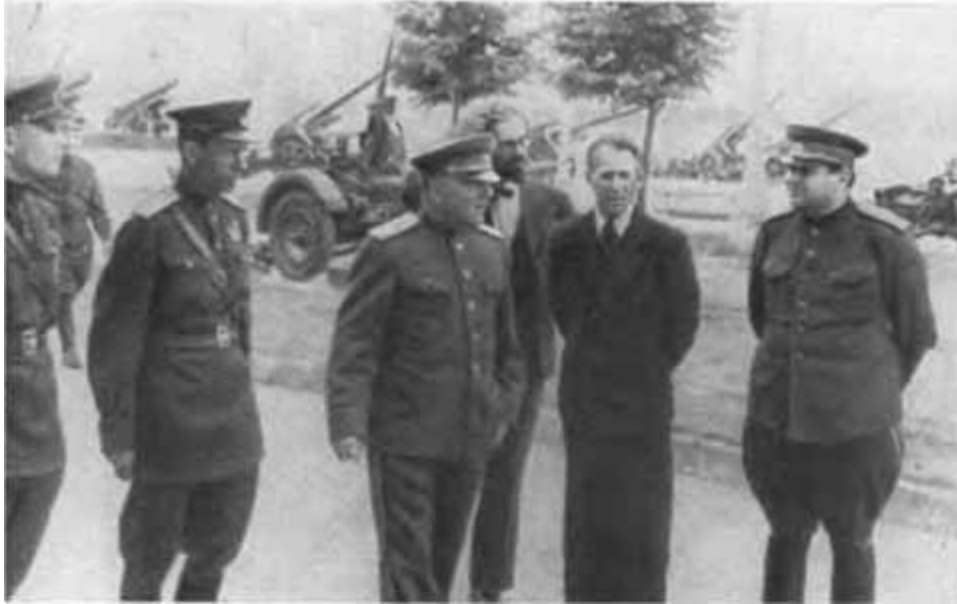
К. Е. Ворошилов осматривает выставку образцов трофейного оружия. Москва, 1944 г.