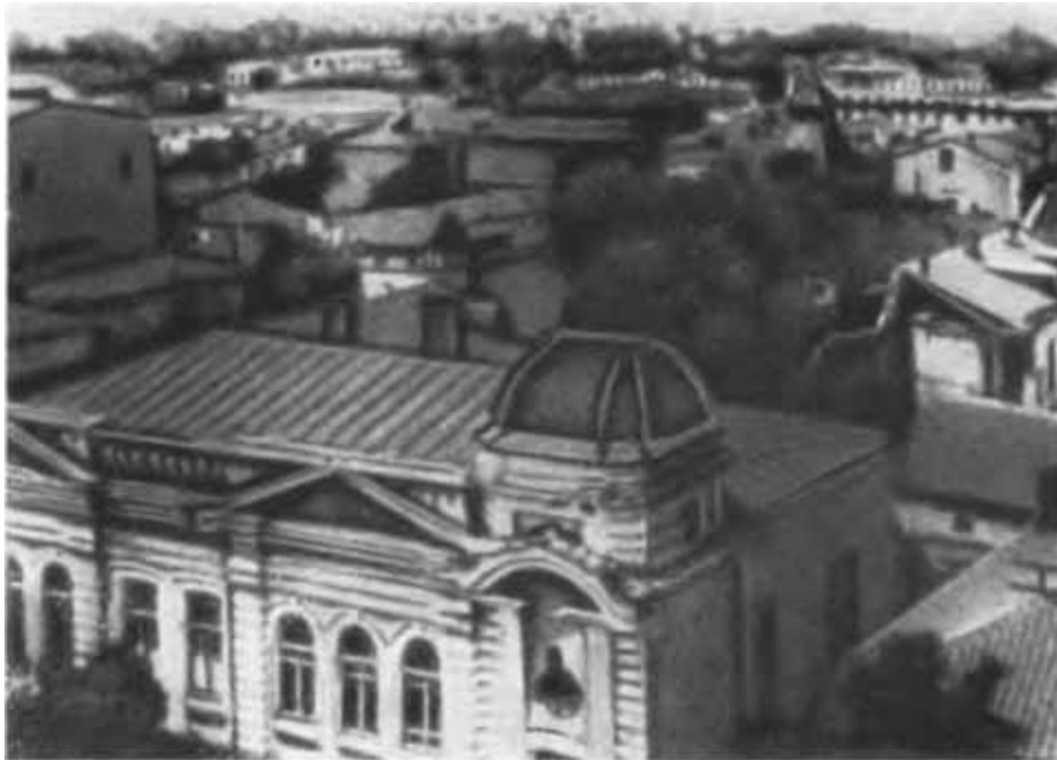
Общий вид старого Луганска.