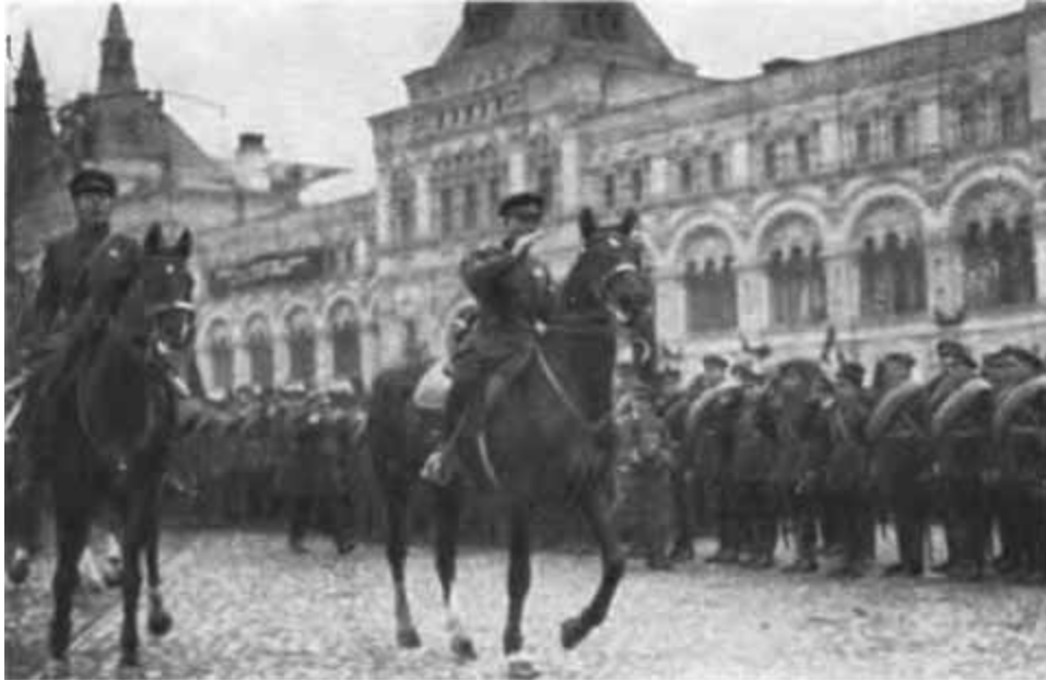
К. Е. Ворошилов и Б. М. Шапошников объезжают войска на первомайском параде. Москва, 1928 г.