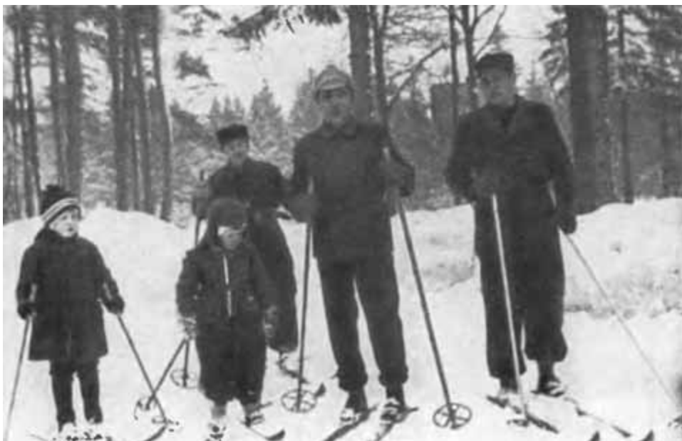
К. Е. Ворошилов на лыжной прогулке.