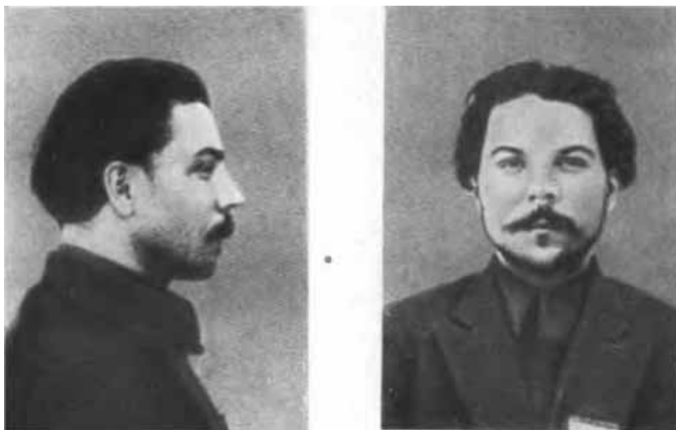
К. Е. Ворошилов в Архангельской ссылке. Снимок охранного отделения. 1910-1912 гг.