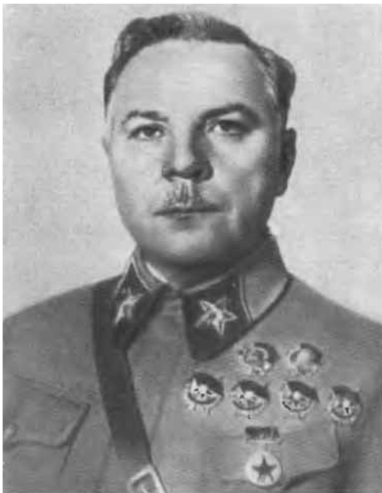
К. Е. Ворошилов. 1939 г.