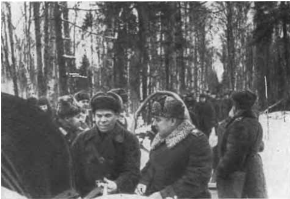
К. Е. Ворошилов на одном из участков Ленинградского фронта.