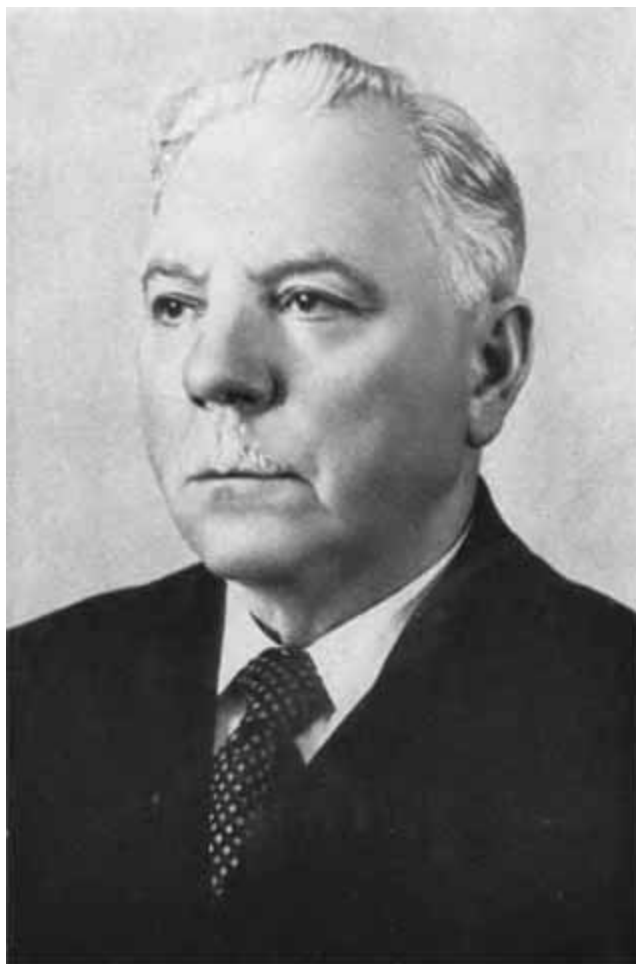
К. Е. Ворошилов. 1956 г.