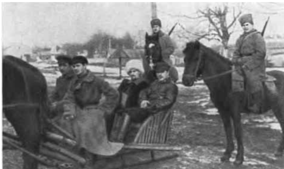
К. Е. Ворошилов и А. И. Седякин в дни ликвидации кронштадтского мятежа 1921 г.