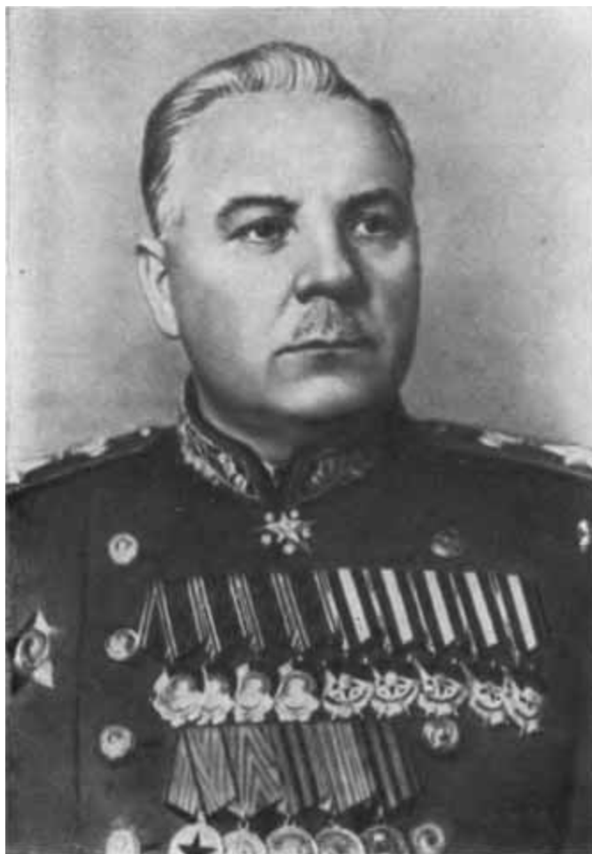
К. Е. Ворошилов. Февраль 1945 г.