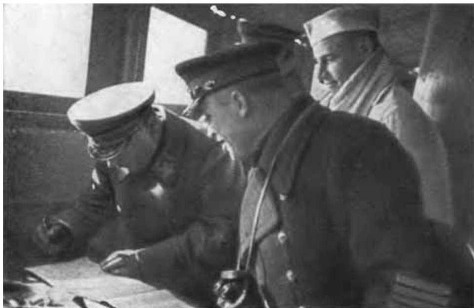
К. Е. Ворошилов делает запись в журнале после пробы пищи на матросском камбузе во время маневров Балтфлота. 1936 г.