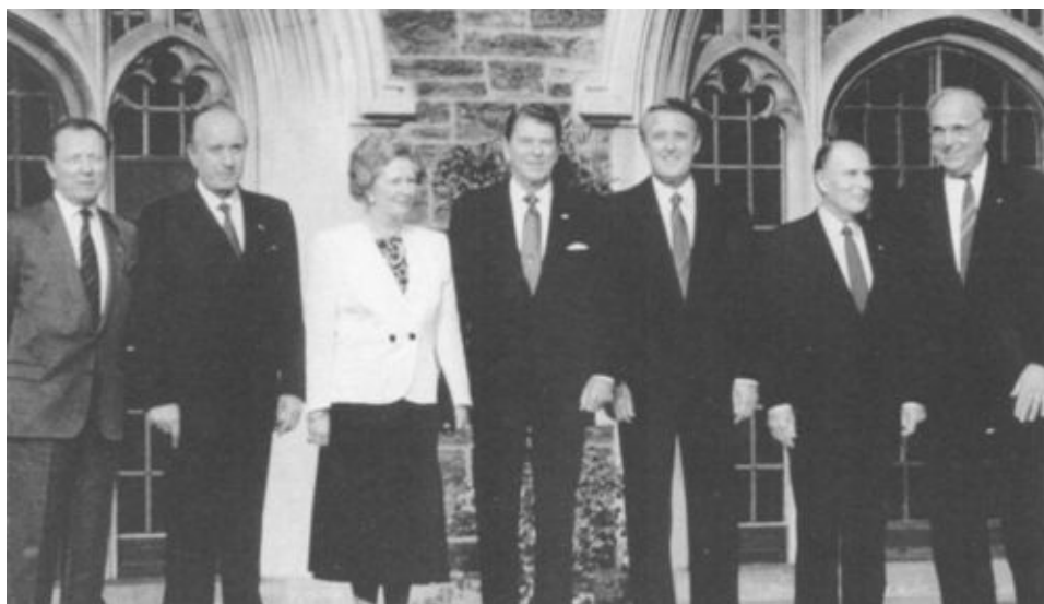
Маргарет Тэтчер на встрече «Большой семерки». 1987 г.