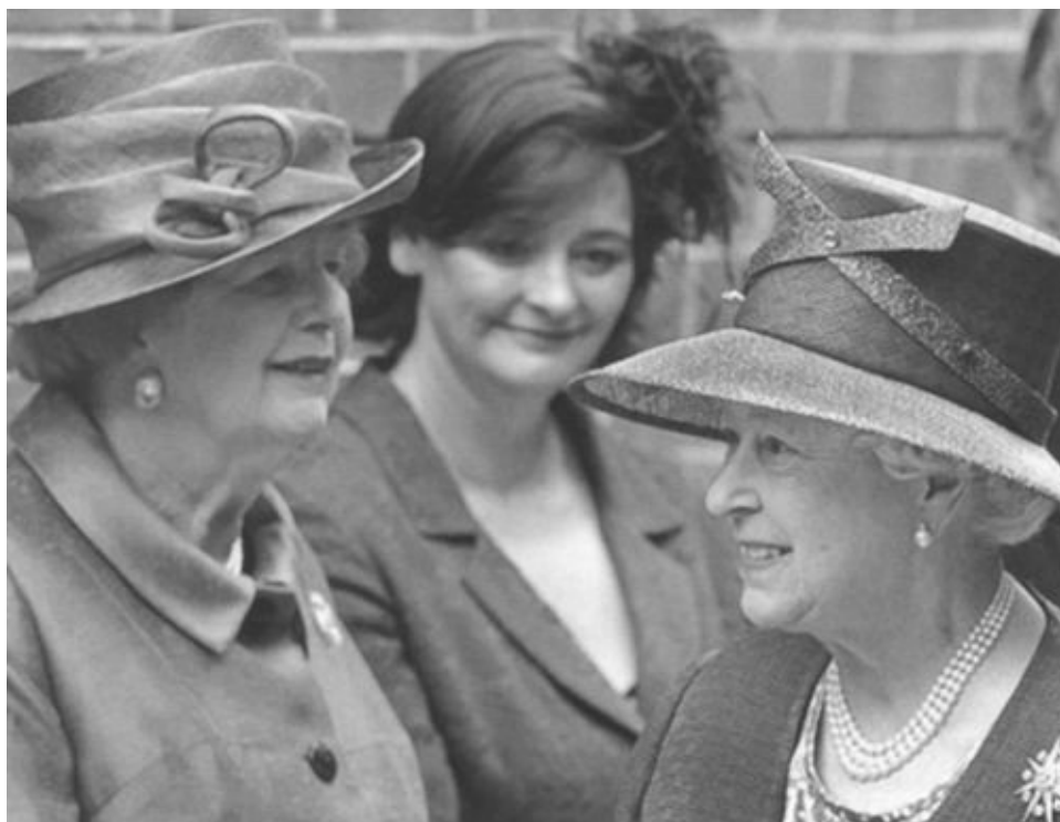
Самые влиятельные леди Британии — Маргарет Тэтчер, Чери Блэр и королева Елизавета II