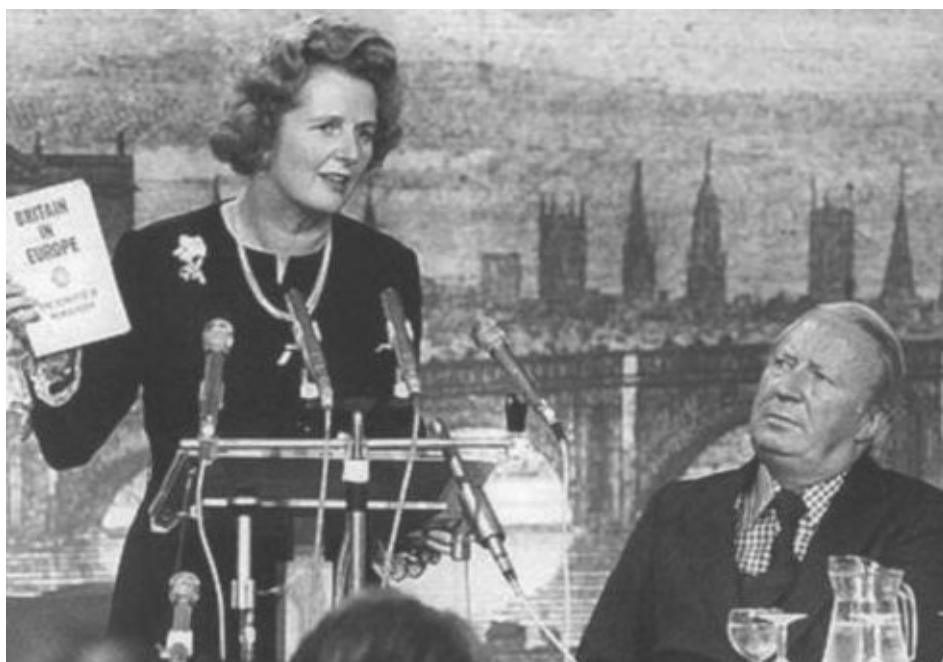
Теледебаты перед выборами 1974 года