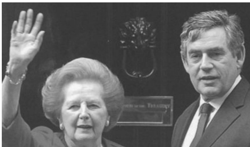
С действующим премьер-министром Великобритании Гордоном Брауном. 2008 г.