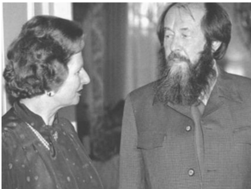
Премьер-министр Великобритании Маргарет Тэтчер принимает в своей резиденции на Даунинг-стрит Александра Солженицына. Лондон. Май 1983 г.