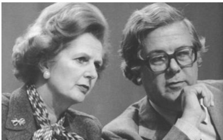
Маргарет Тэтчер и Джеффри Хау