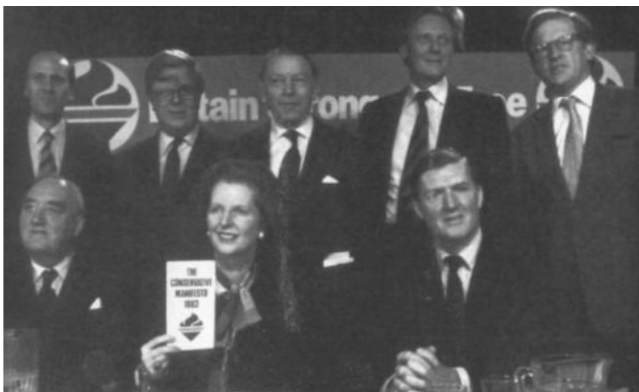
Представление партийного манифеста 1983 года. Сидят: Уильям Уайтлоу, Маргарет Тэтчер, Сесил Паркинсон; стоят: Норман Теббит, Джеффри Хау, Фрэнсис Пим, Майкл Хезлтайн, Том Кинг