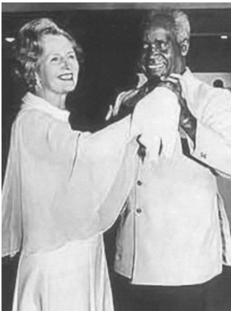
Британское Содружество — прежде всего. С президентом Замбии Кеннетом Каундой