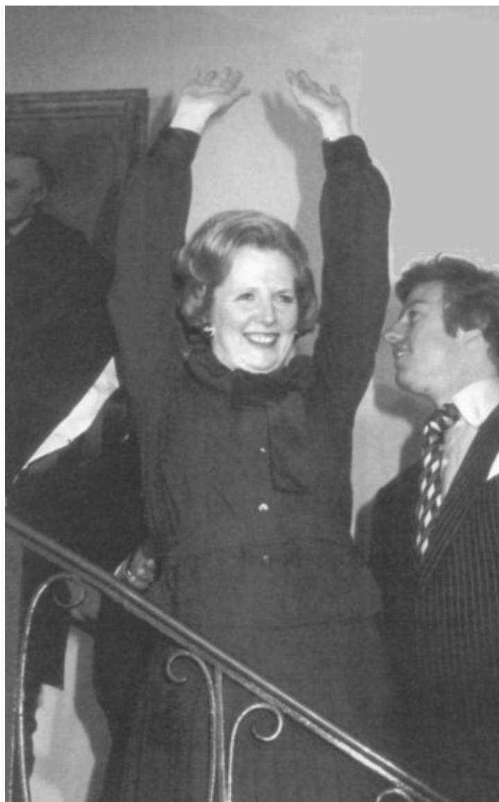
Маргарет Тэтчер празднует победу в Центральном бюро Консервативной партии; рядом сын Марк. 3 мая 1979 г.