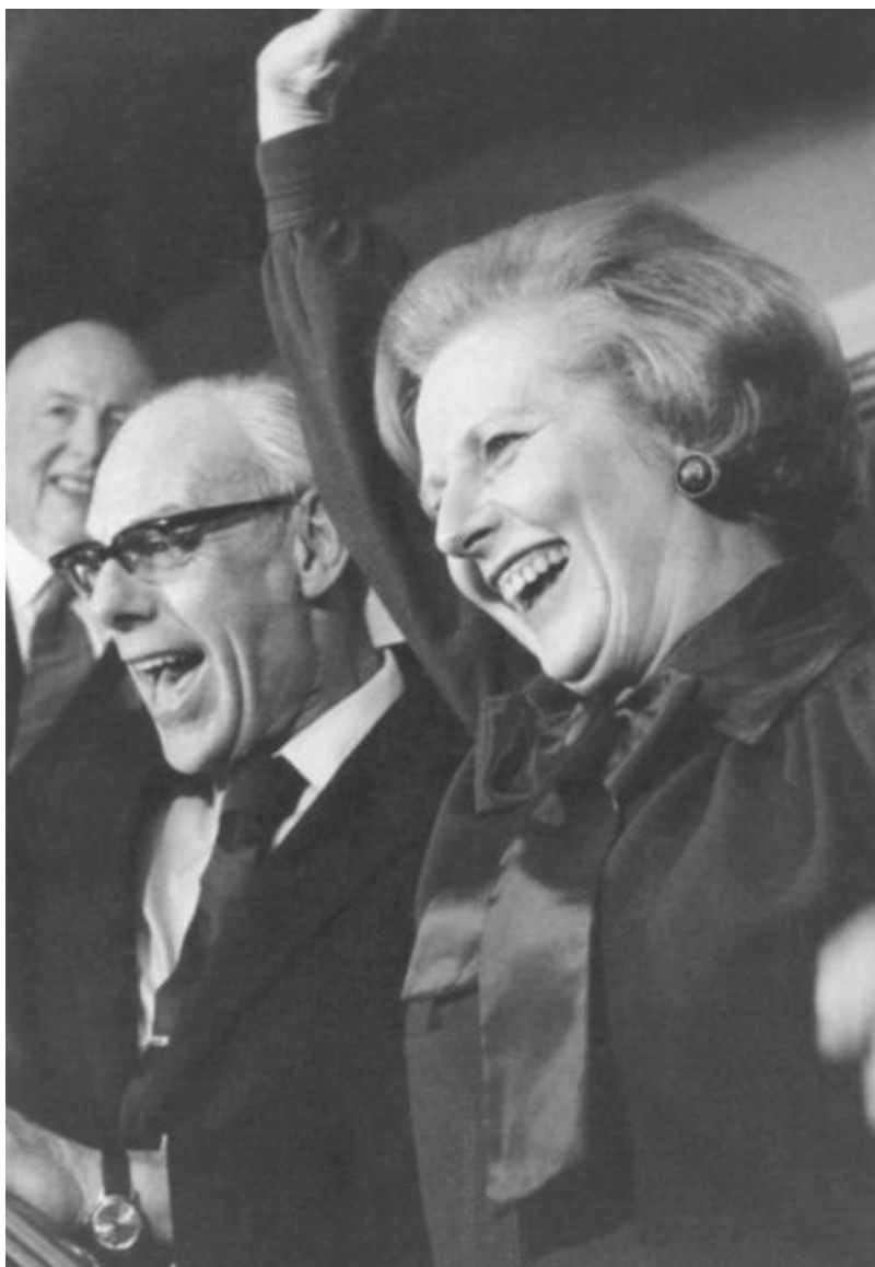
Тэтчер с мужем после третьей победы на выборах. Июнь 1987 г.