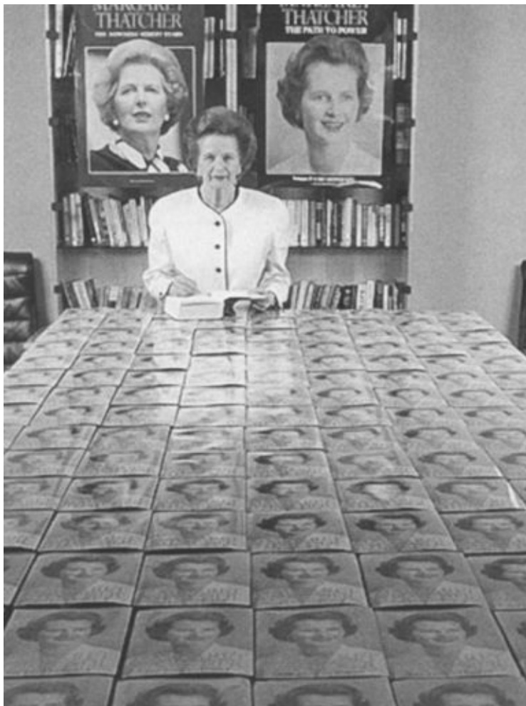
Экс-премьер в окружении своих мемуаров. 1995 г.