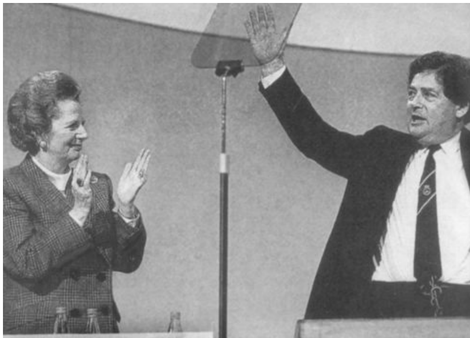
Маргарет Тэтчер аплодирует Найджелу Лоусону, кого в 1986 году называли «канцлером Казначейства, сотворившим чудо»