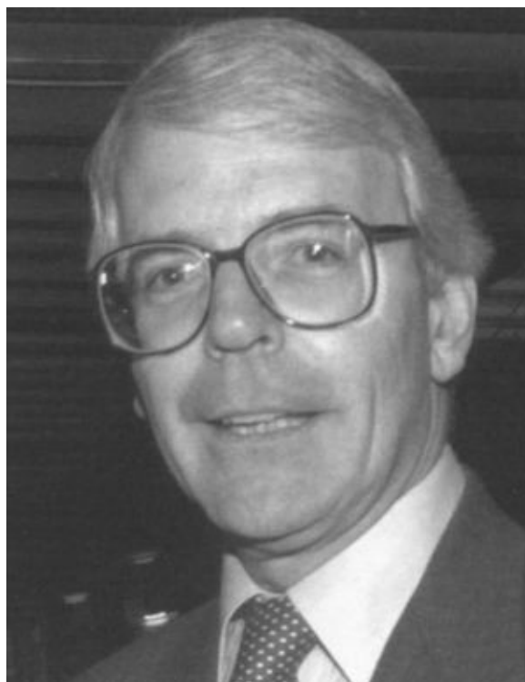
Джон Мейджор — преемник Тэтчер