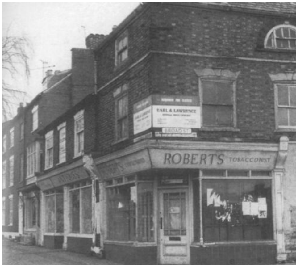
Отцовская бакалейная лавка в Грантеме