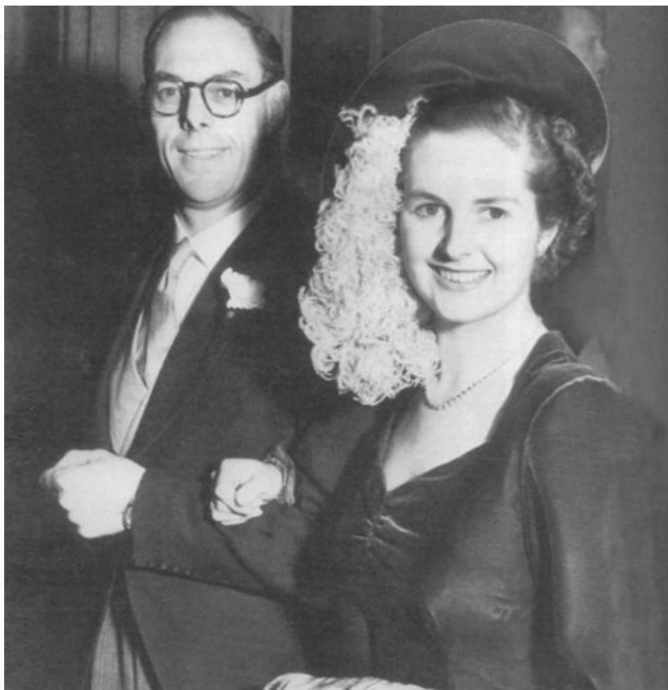
Свадьба Маргарет Робертс и Денниса Тэтчера. 13 декабря 1951 г.