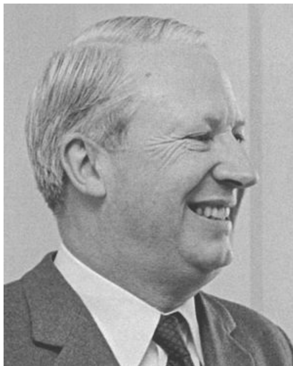
Эдвард Хит, премьер-министр Великобритании в 1970–1974 годах, в правительстве которого Тэтчер была министром образования