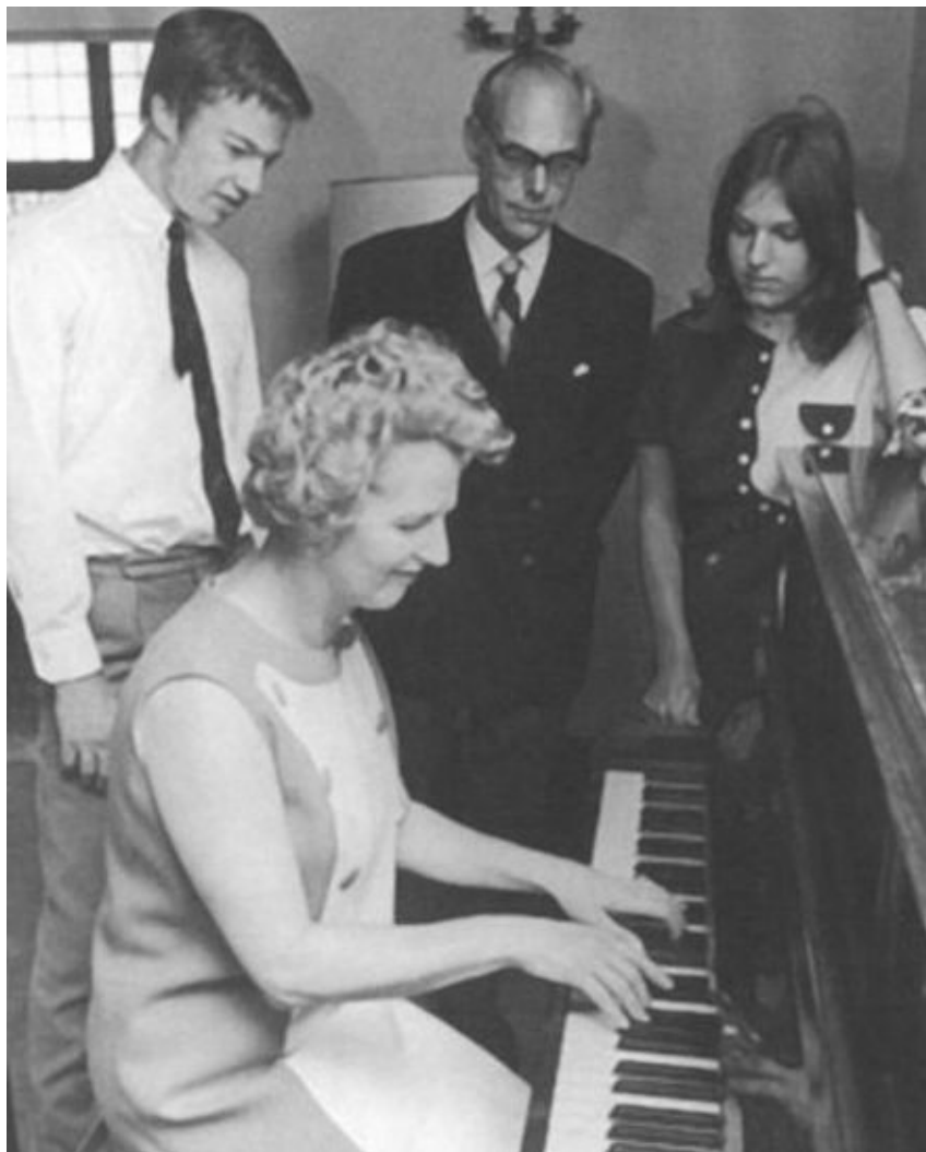
Отдых в кругу семьи