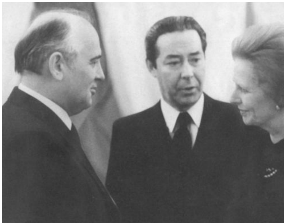
Первая встреча с Михаилом Горбачевым