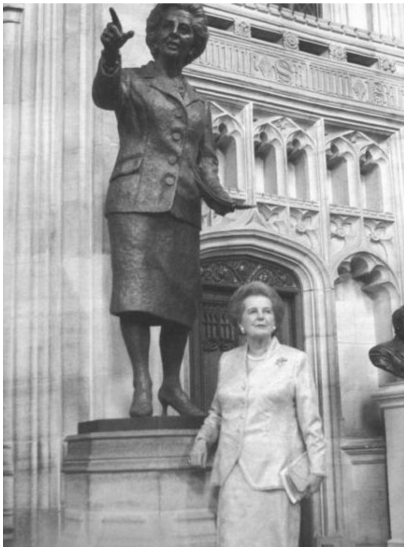
Статуя Маргарет Тэтчер, установленная в парламенте Великобритании. Такой почет при жизни не оказывали никому из британских политиков