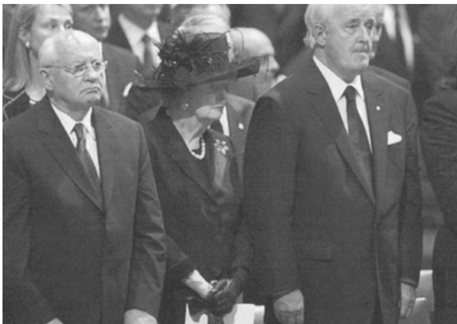
Уходящая натура. Экс-президент СССР М. Горбачев, экс-премьер Великобритании М. Тэтчер и экс-премьер Канады Б. Малруни на похоронах Р. Рейгана. 2004 г.