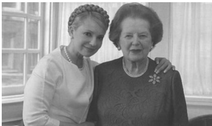
Тэтчер охотно передает свой опыт женщинам-политикам. С украинским премьером Юлией Тимошенко