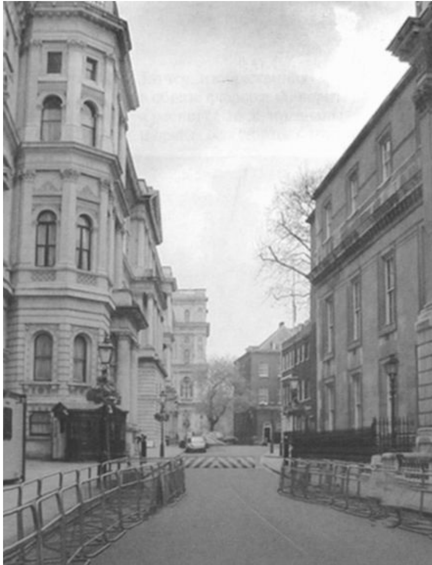
Знаменитая Даунинг-стрит, где располагается резиденция британских премьер-министров. Лондон