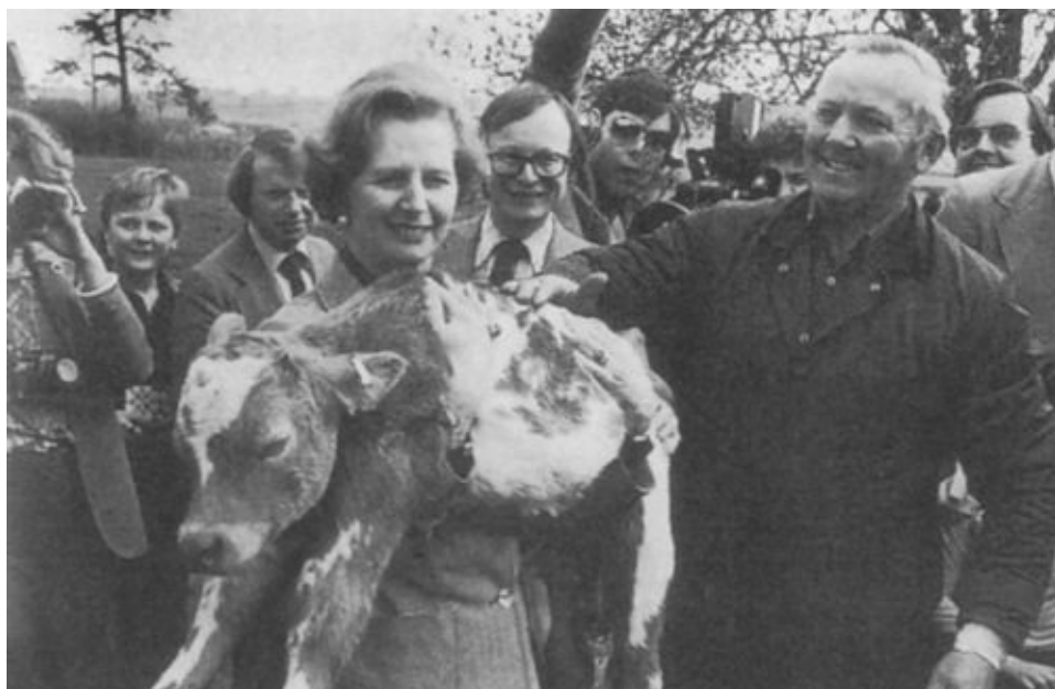
Маргарет Тэтчер во время избирательной кампании 1979 года