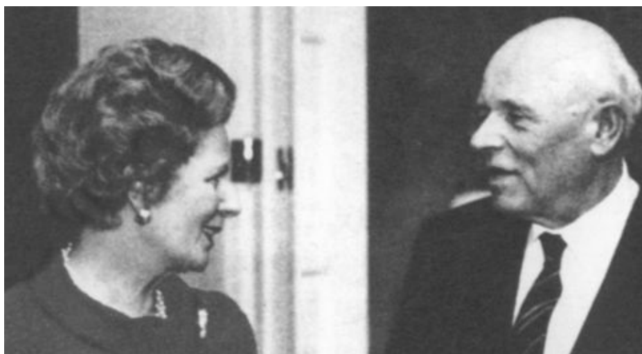
Беседа с Андреем Сахаровым. Вашингтон. Ноябрь 1988 г.