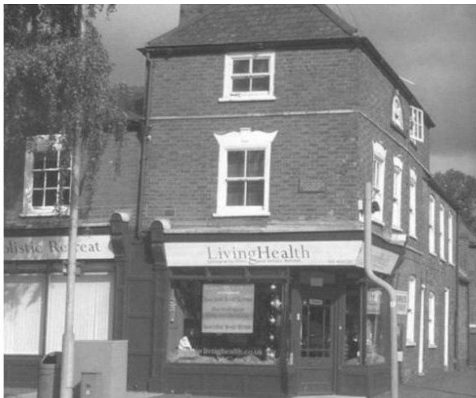
Дом, где родилась Маргарет Робертс, в будущем Тэтчер. Грантем