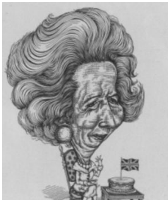
Одна из карикатур на «Железную леди», публиковавшихся в английских