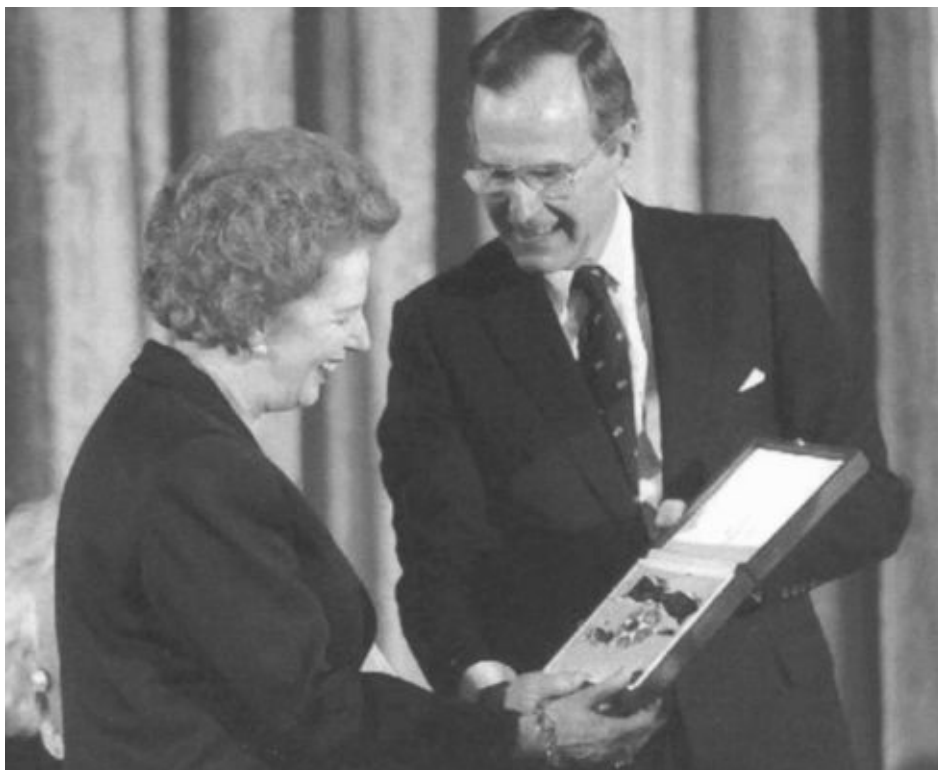
Президент США Джордж Буш-старший вручает Маргарет Тэтчер высокую награду — Медаль свободы