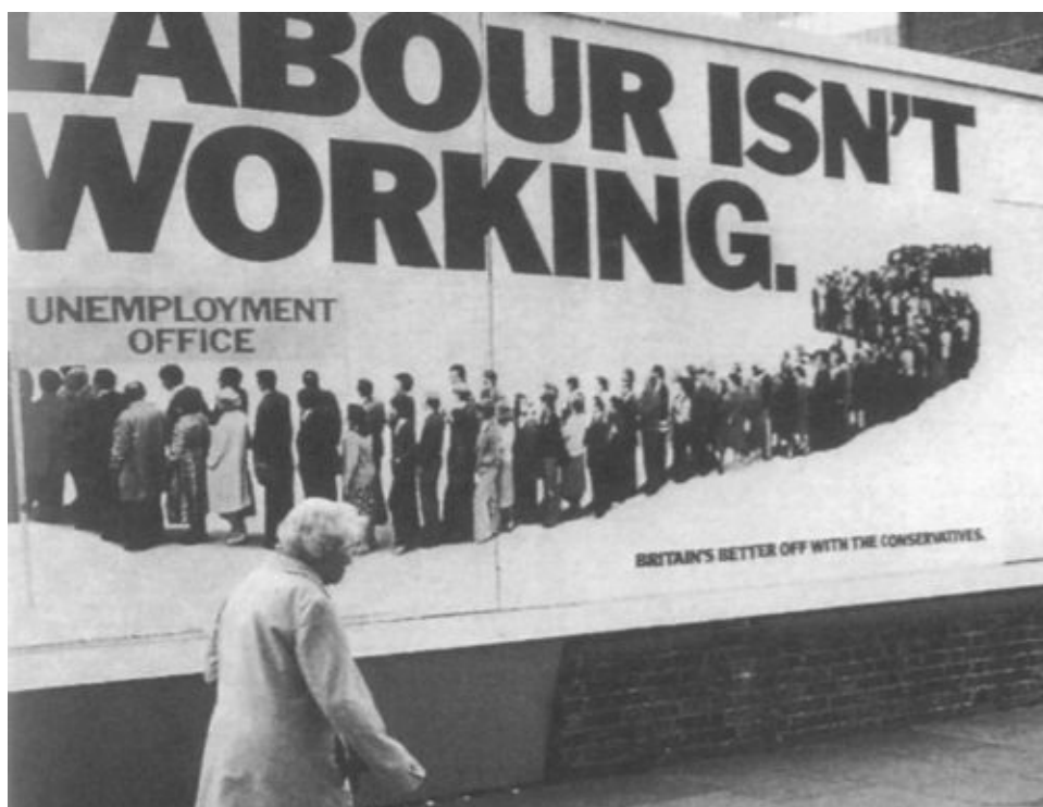
Плакат, так много заставивший о себе говорить: «Лейборизм — это не работает!» Конец лета 1978 г.