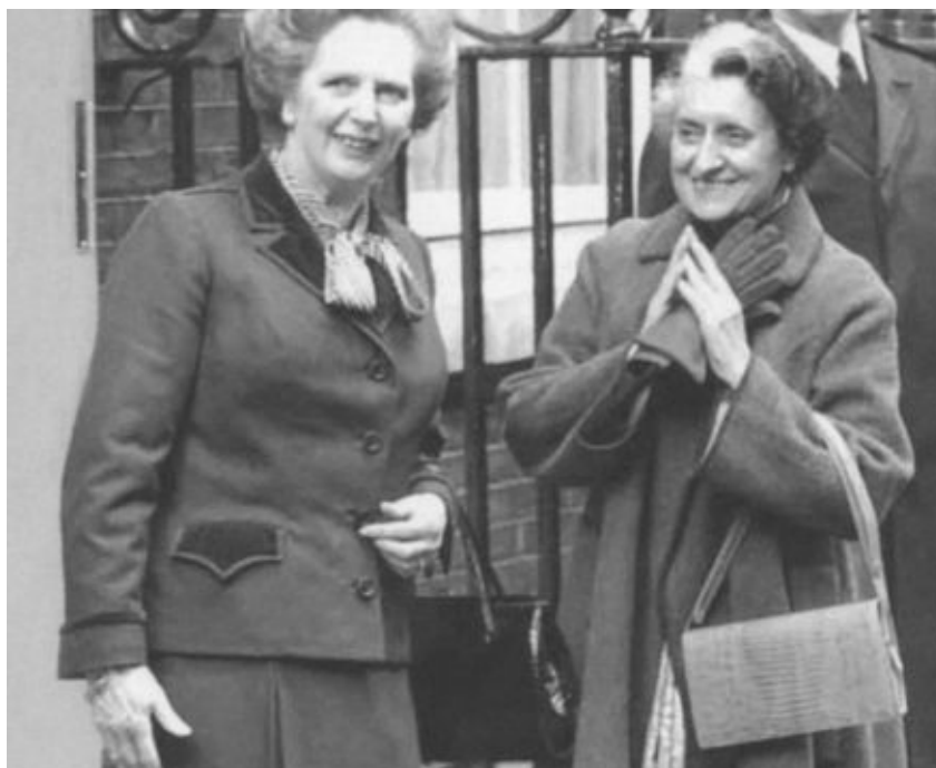
Две «железные леди» — Маргарет Тэтчер и Индира Ганди