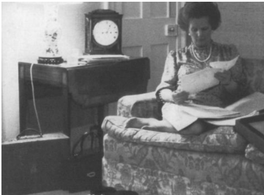
«Железная леди» за работой в личных апартаментах. На полу (слева) один из знаменитых «красных чемоданчиков» с вензелем королевы, в которых доставляют министерские документы