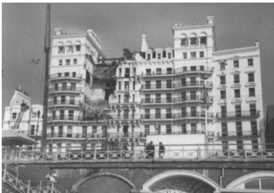
«Гранд-отель» в Брайтоне, взорванный ирландскими террористами. В