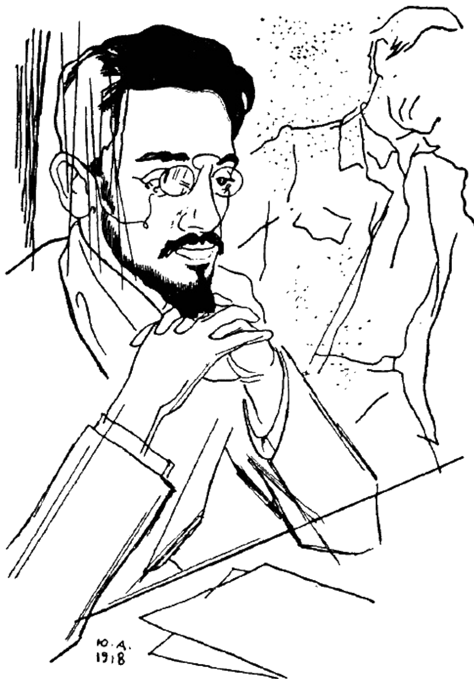
Я. М. Свердлов. Рисунок Ю. Анненкова. 1918 г.

В. Голионко: „Чарующая доброжелательность“.