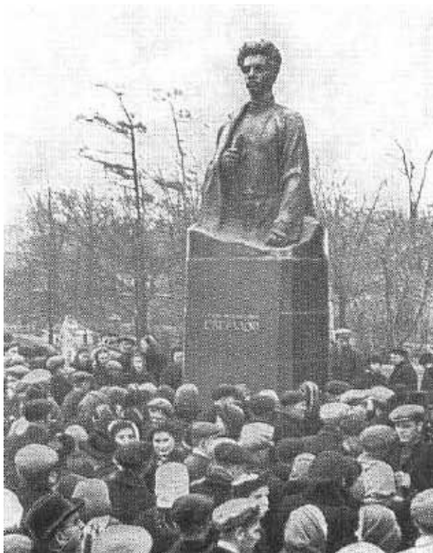
Открытие памятника Я. М. Свердлову в Горьком. 1957 г.