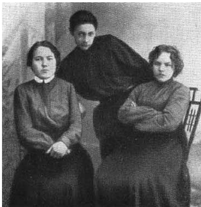
Я. М. Свердлов с участницами с.-д. кружка в Нижнем Новгороде. 1902 г.