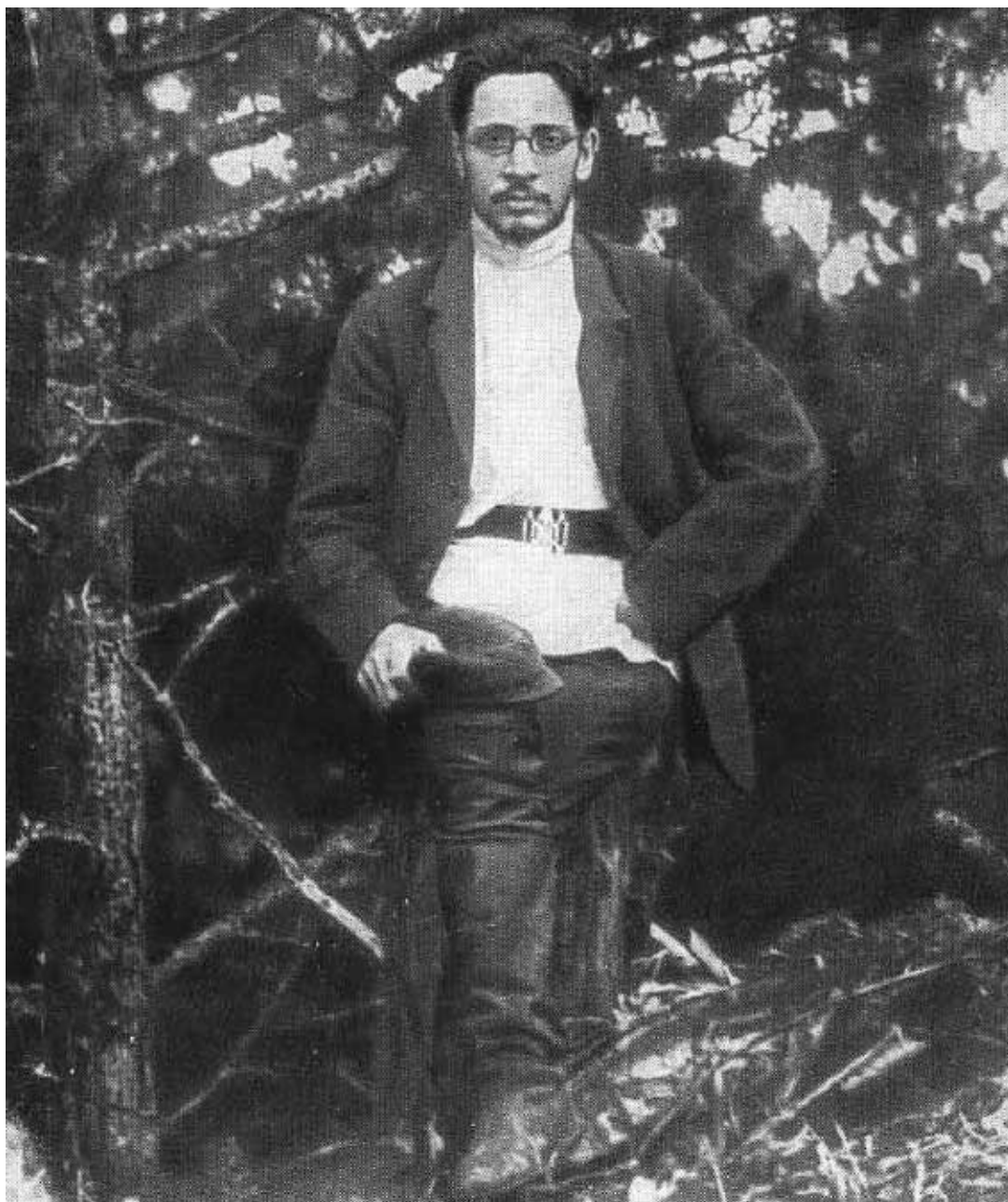
Я. М. Свердлов в нарымской ссылке. 1910 г.