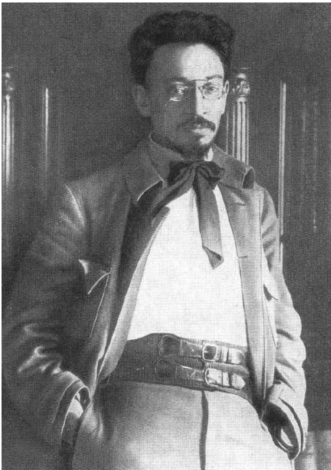
Я. М. Свердлов