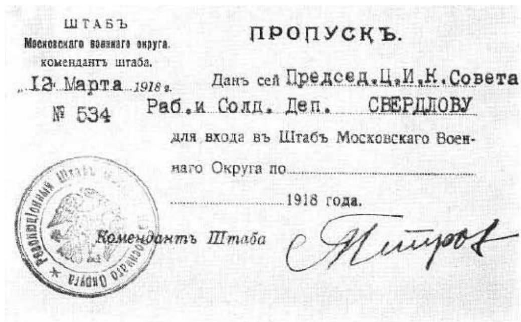
Пропуск Я. М. Свердлова в штаб Московского военного округа. 1918 г.