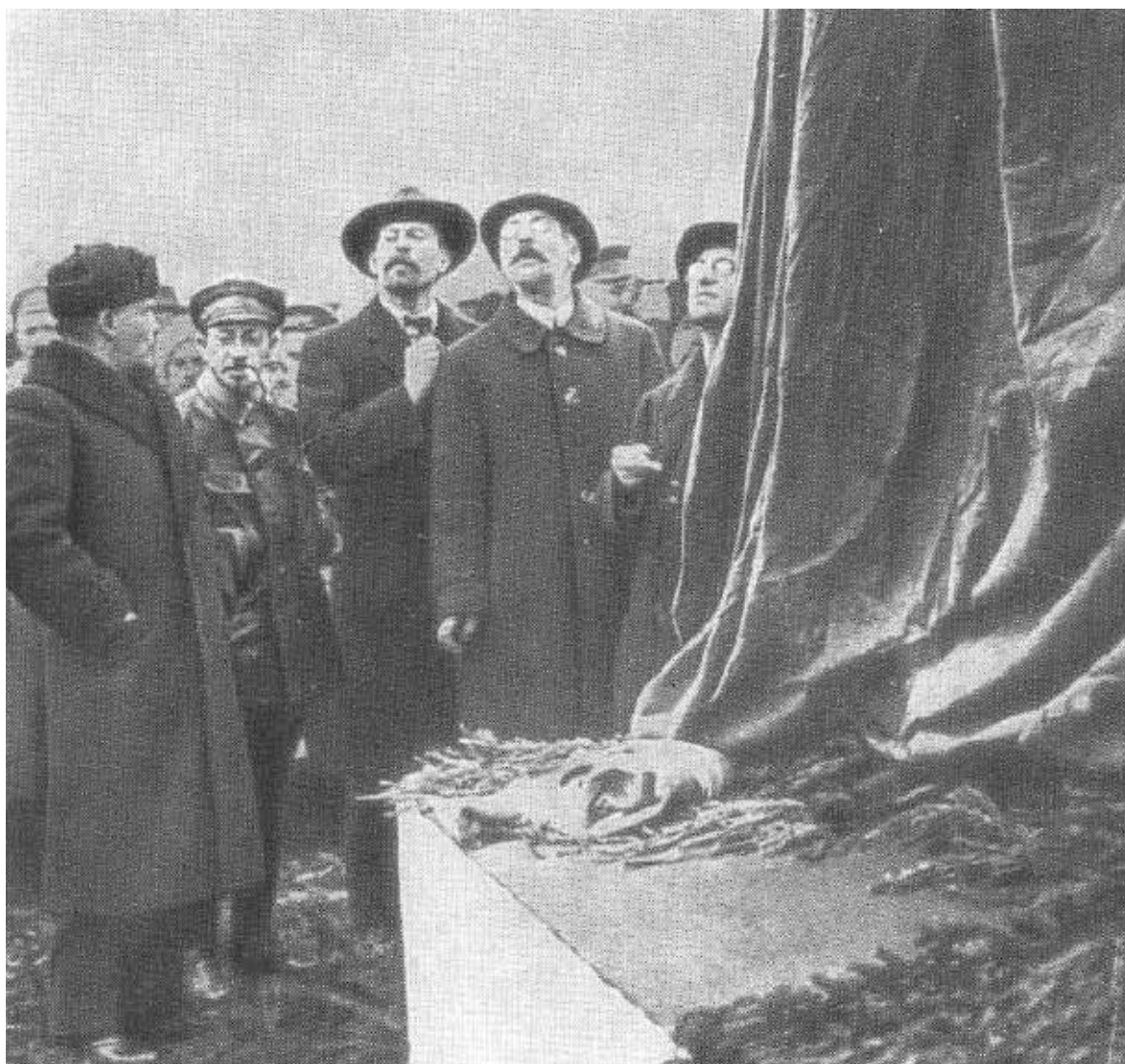
В. И. Ленин и Я. М. Свердлов на открытии временного памятника Карлу Марксу в Москве. Ноябрь 1918 г.