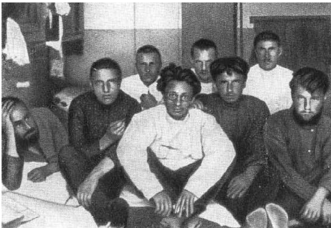
Я. М. Свердлов в группе заключенных в пермской тюрьме.