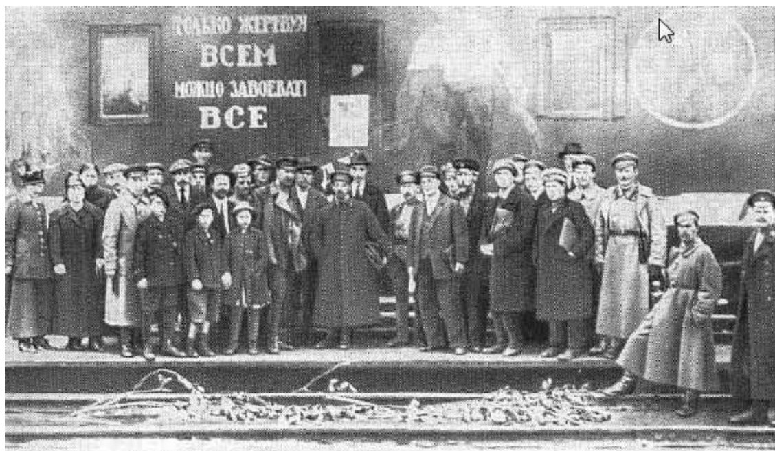
Я. М. Свердлов в группе товарищей у агитпоезда ВЦИКа.