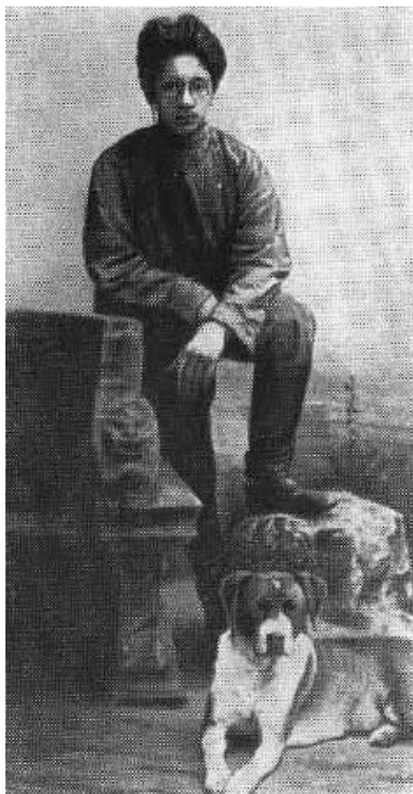
Я. М. Свердлов. 1904 г.