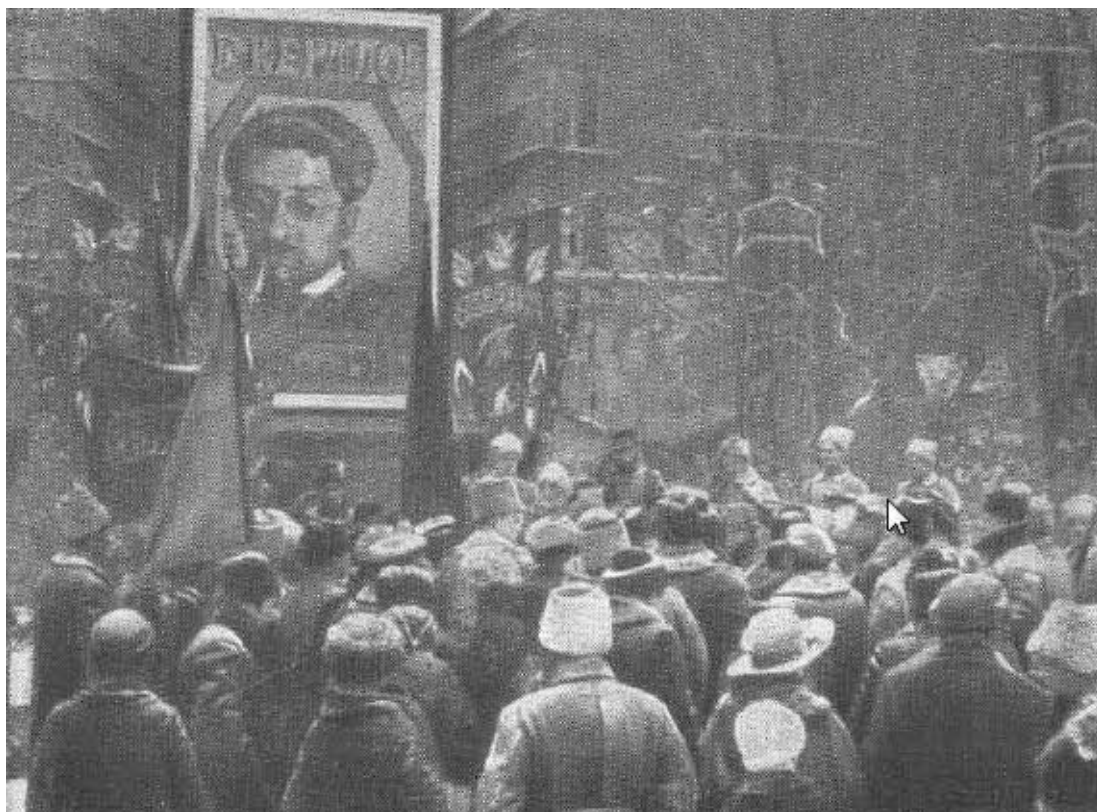
Похороны Я. М. Свердлова.