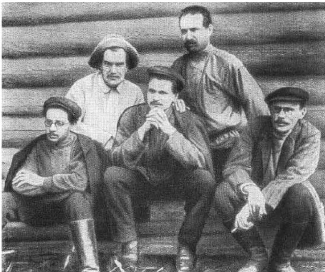
Я. М. Свердлов и В. В. Куйбышев в группе большевиков в Нарыме. 1912 г.