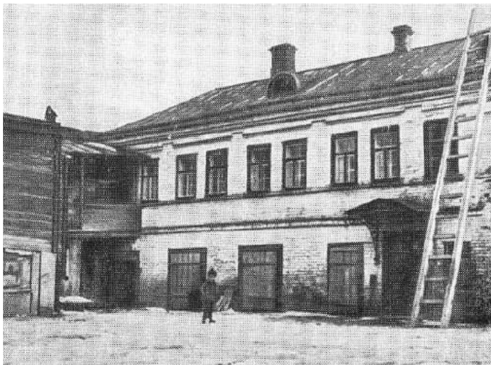
Дом в Нижнем Новгороде, где прошло детство Я. М. Свердлова