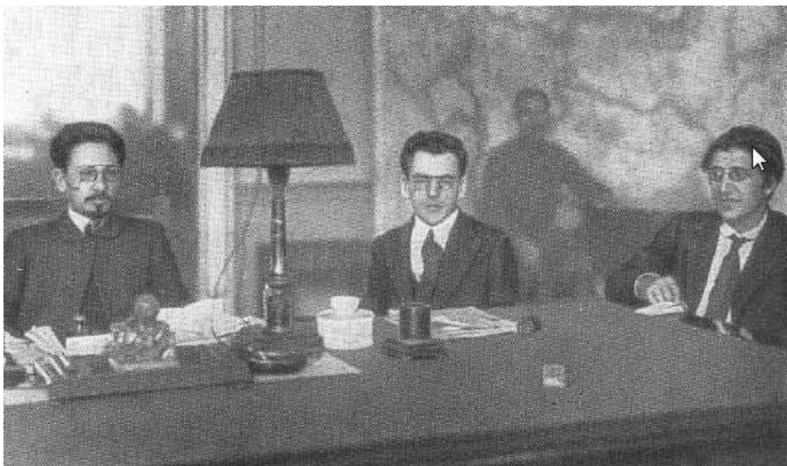
Я. М. Свердлов с сотрудниками в своем кабинете. 1918 г.