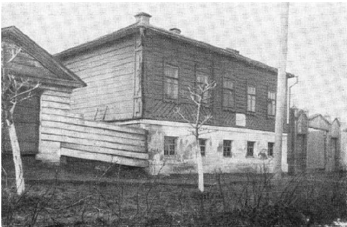
Штаб-квартира Екатеринбургского комитета РСДРП.