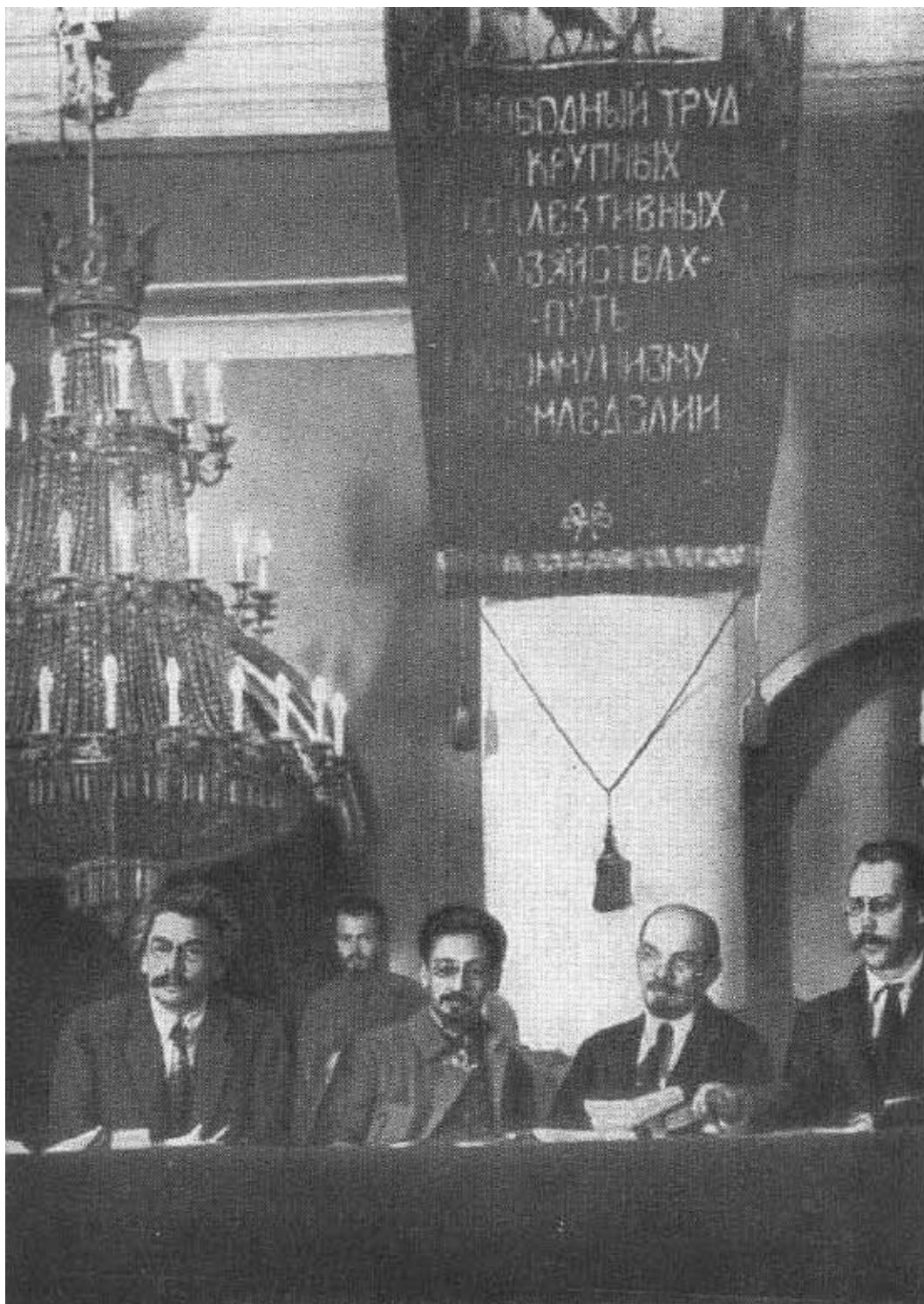
В. И. Ленин и Я. М. Свердлов в президиуме съезда сельскохозяйственных коммун и комбедов.