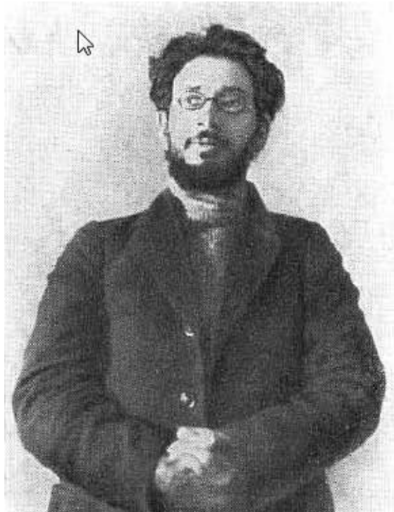
Я. М. Свердлов в туруханской ссылке. 1915 г.