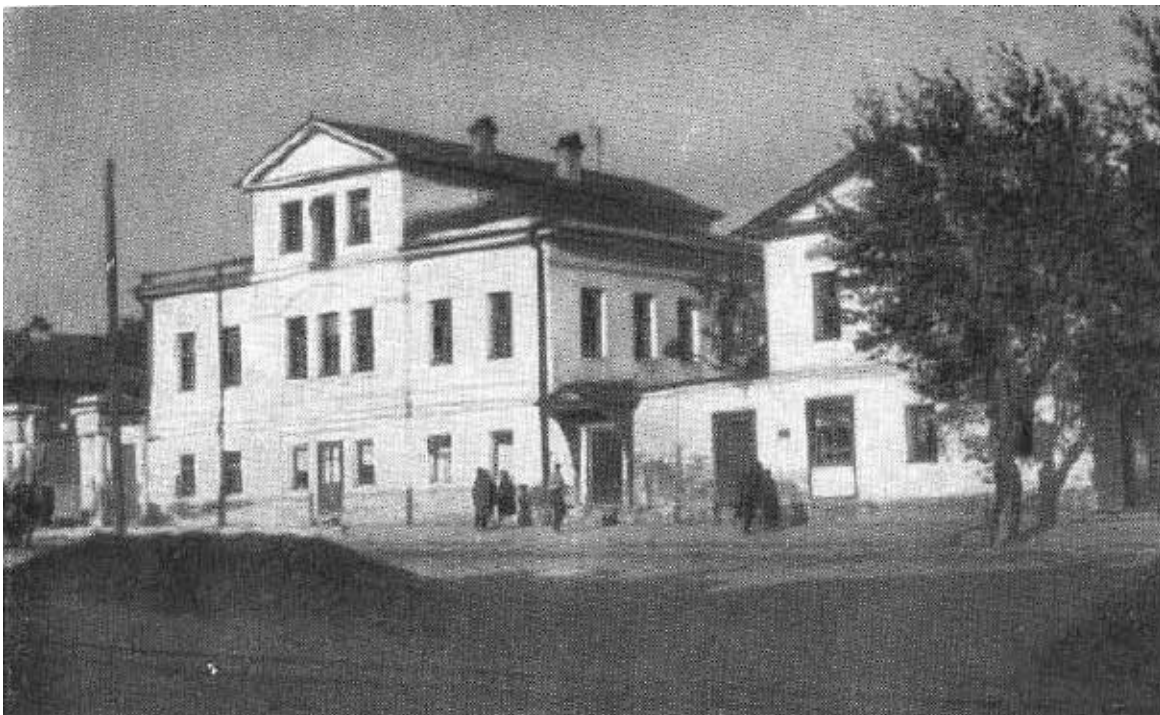
Дом, в котором находилась нелегальная партшкола Екатеринбургского комитета РСДРП в 1905 году