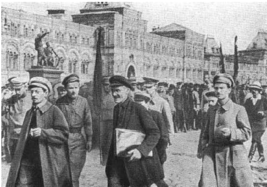
Я. М. Свердлов на параде Всевобуча. Москва, 1918 г.