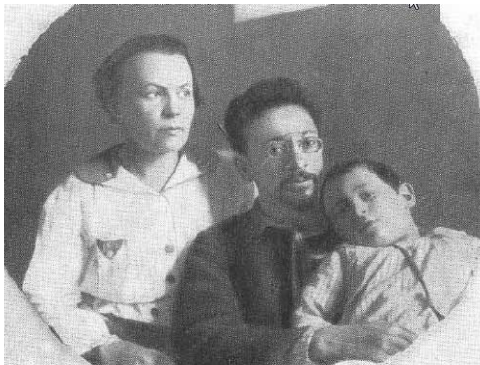
Я. М. Свердлов и К. Т. Новгородцева (Свердлова) с дочерью Верой. Конец 1918 — начало 1919 г.