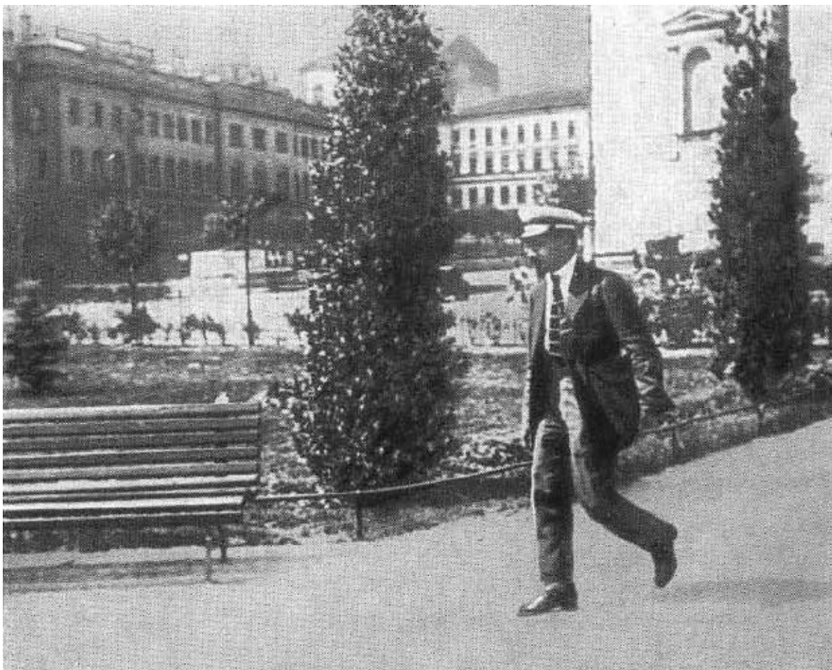
Я. М. Свердлов возвращается с заседания V съезда Советов. Июль 1918 г.