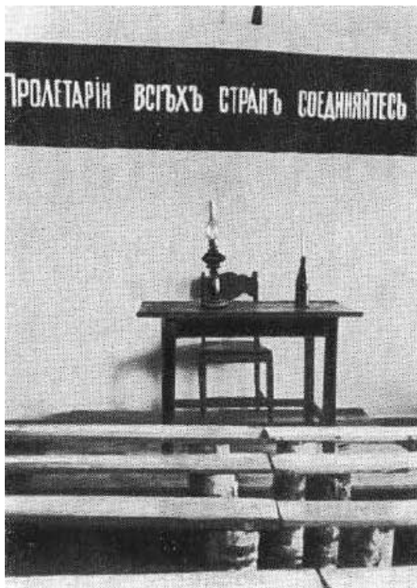
Комната, в которой проводились занятия партийной школы в Екатеринбурге в 1905 году.