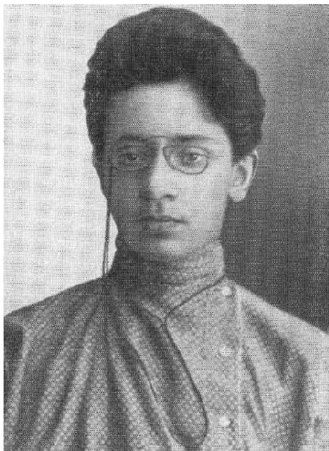
Я. М. Свердлов на Урале. 1905 г.