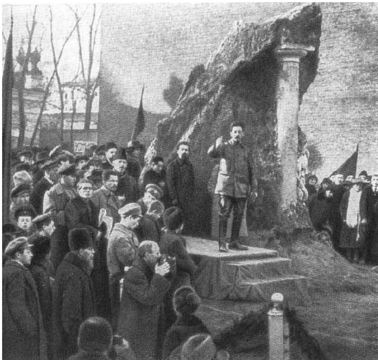
Я. М. Свердлов выступает с речью на закладке Дворца рабочих в Москве. Ноябрь 1918 г.