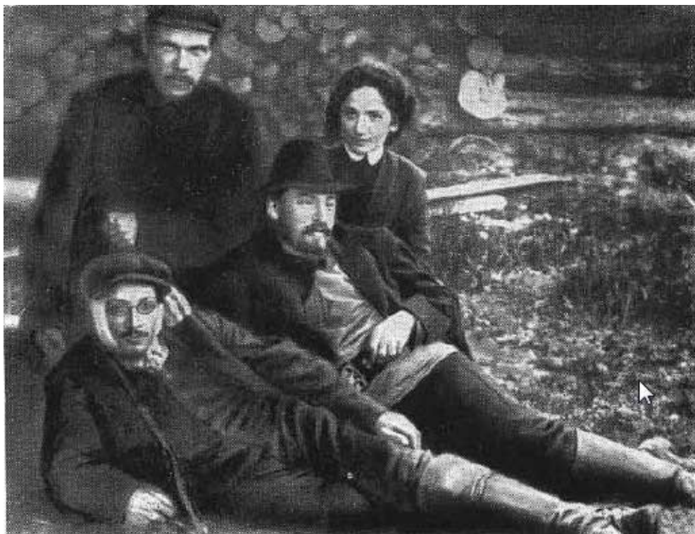
Я. М. Свердлов в группе ссыльных большевиков. Нарым. 1910 г.