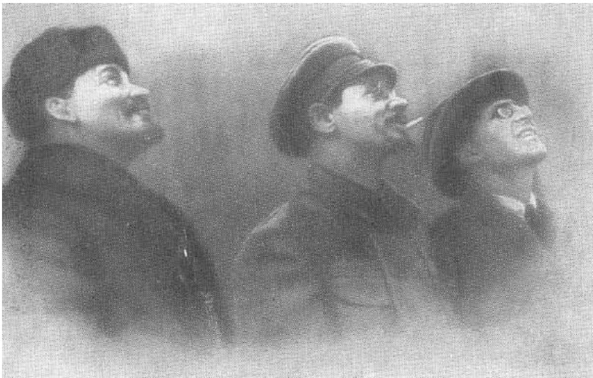
В. И. Ленин, Я. М. Свердлов, В. А. Аванесов наблюдают за полетом аэроплана во время демонстрации