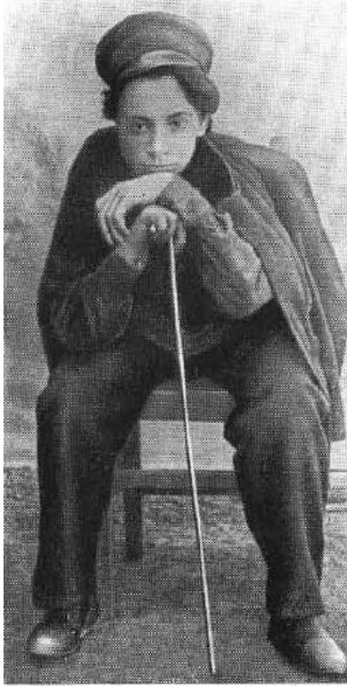
Я. М. Свердлов. 1900 г.