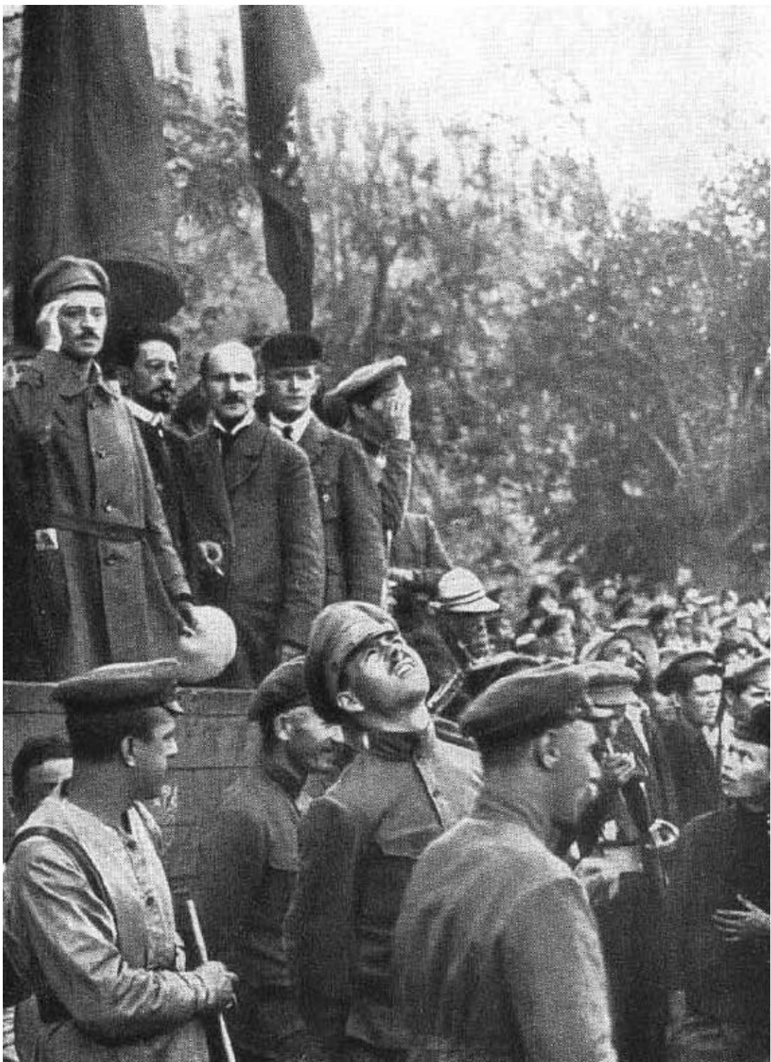
Я. М. Свердлов на трибуне во время проведения Дня красного офицера.

Москва, Красная площадь, 11 августа 1918 г.