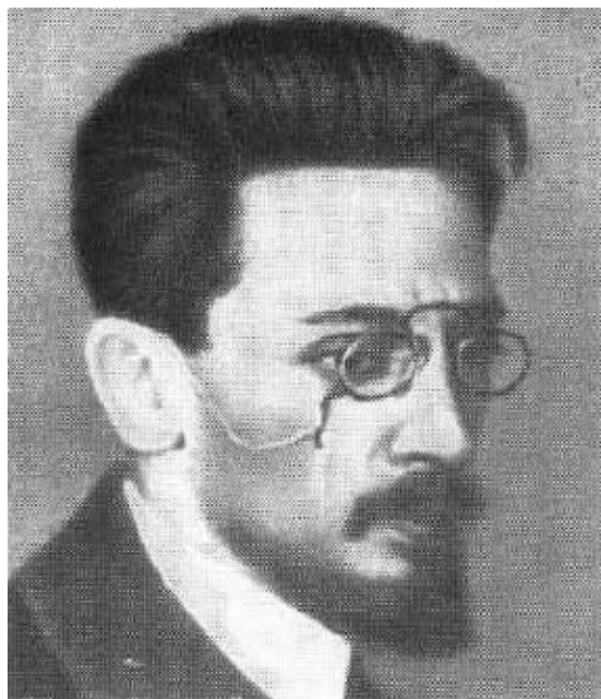
Я. М. Свердлов