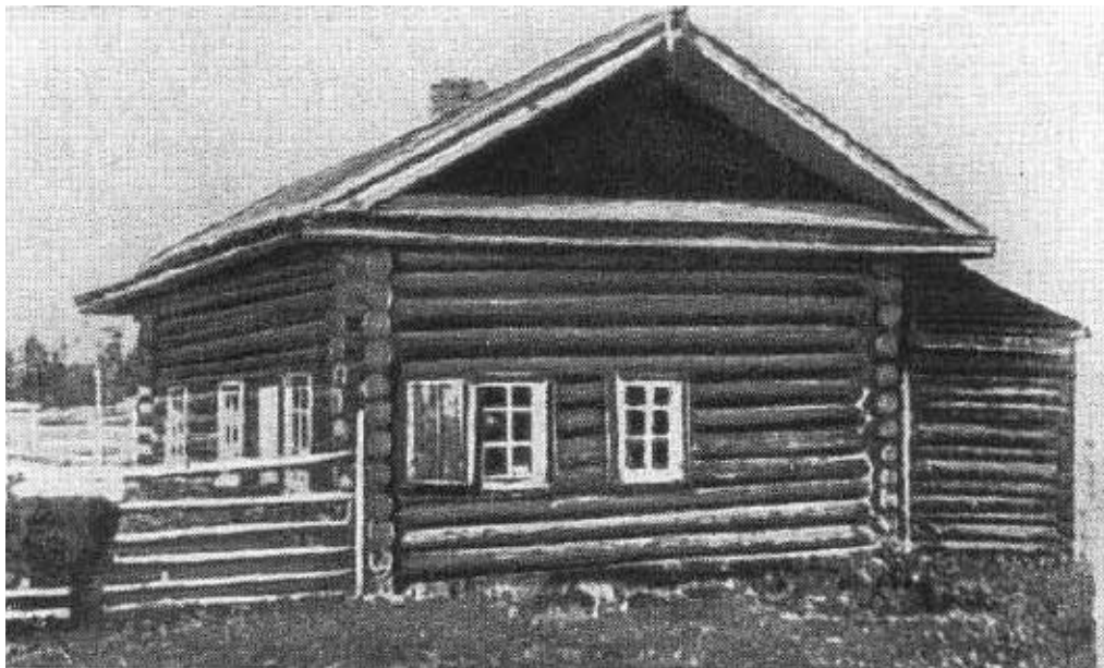
Дом в селе Максимкин Яр, где жил Я. М. Свердлов. 1911 г.