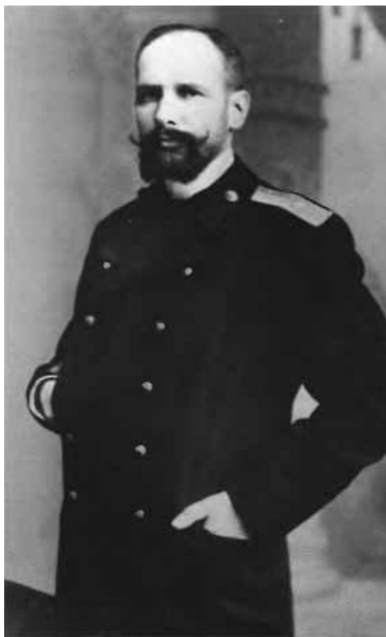
Петр Аркадьевич Столыпин — саратовский губернатор.