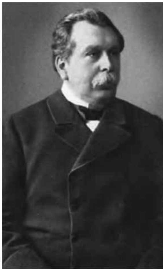
Вячеслав Константинович фон Плеве.