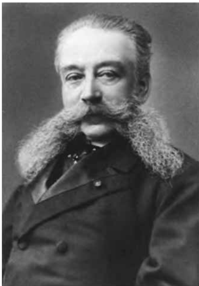
Иван Логгинович Горемыкин.