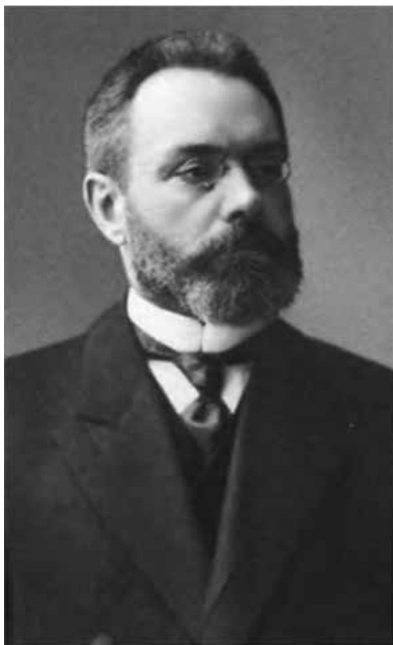
Александр Иванович Гучков.