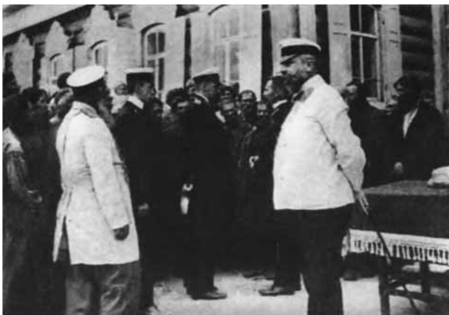
П. А. Столыпин беседует с крестьянами села Булгаковка Вольского