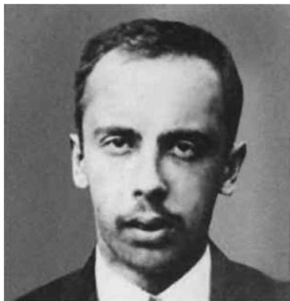
Дмитрий Григорьевич (Мордко Гершкович) Богров после покушения на П. А. Столыпина.