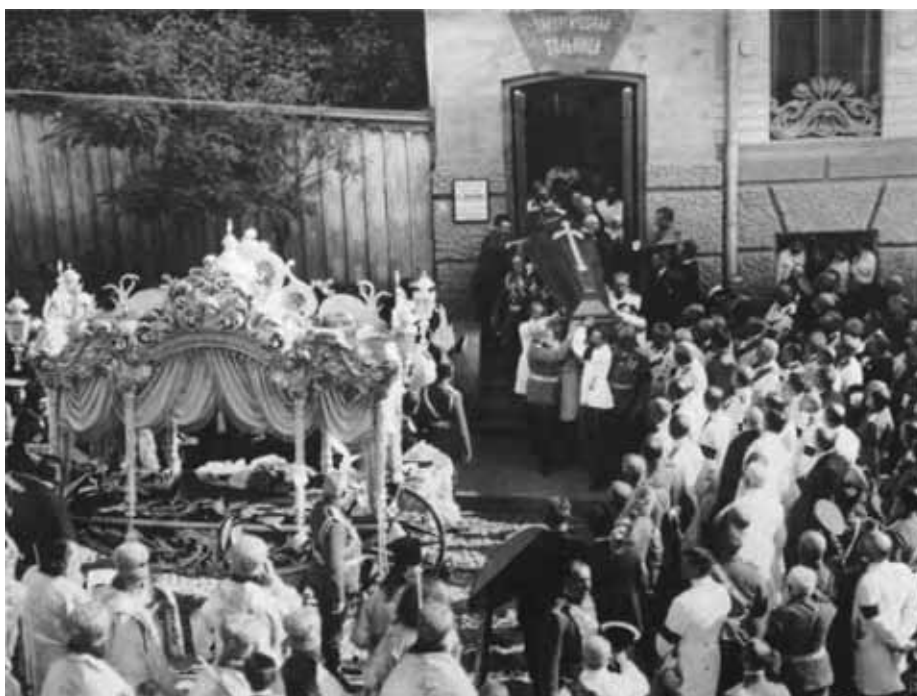
Перенесение гроба с телом П. А. Столыпина из частной хирургической больницы.