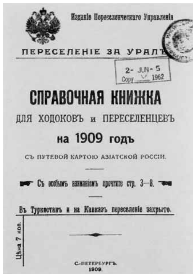
Справочная книжка для ходоков и переселенцев на 1909 год.