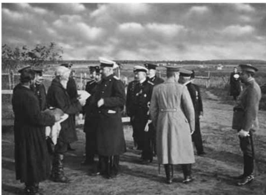
Поднесение адреса и хлеба-соли П. А. Столыпину на хуторах близ