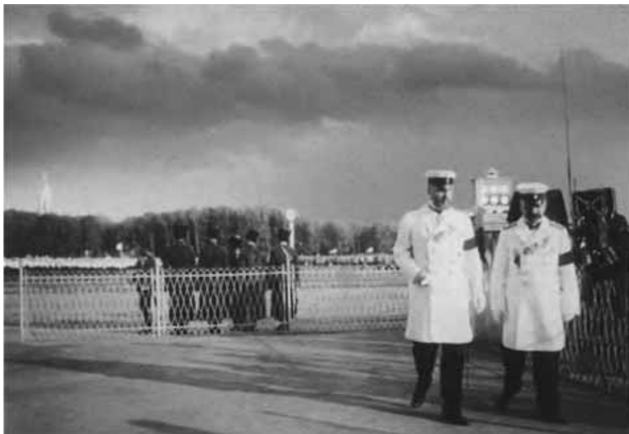
П. А. Столыпин и киевский генерал-губернатор А. Гирс перед Высочайшим смотром «потешных» в Киеве, за шесть часов до трагической катастрофы. 1 сентября 1911 г.