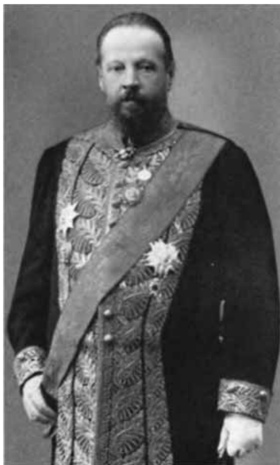
Сергей Юльевич Витте.