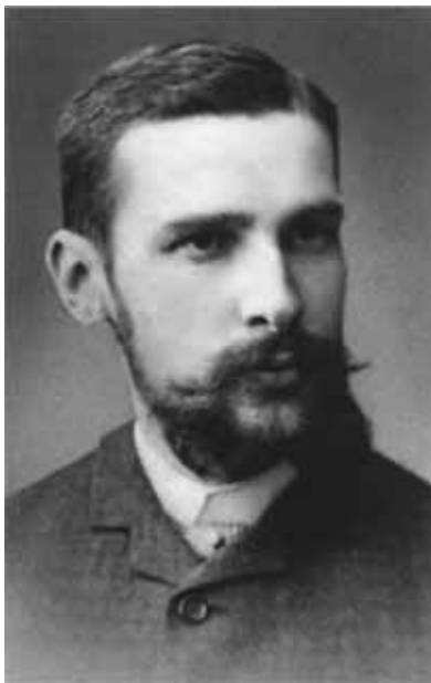
Петр Аркадьевич Столыпин — студент Санкт-Петербургского университета. 1881 г.