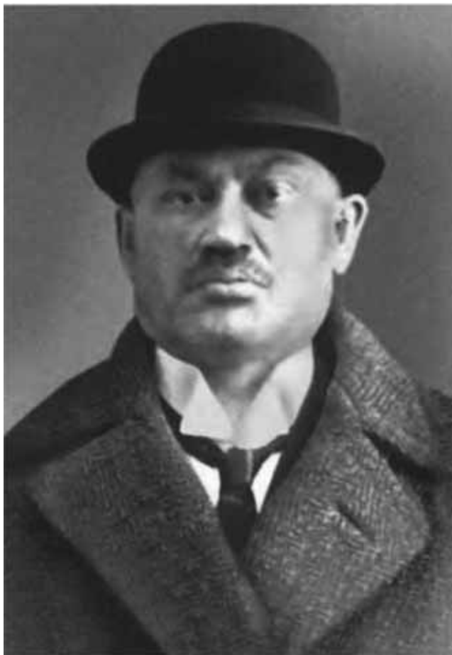
Секретный сотрудник охранного отделения Евно Фишелевич Азеф.