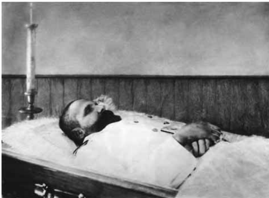
П. А. Столыпин скончался. 5 сентября 1911 г.