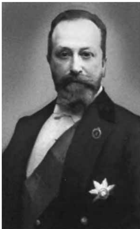
Владимир Николаевич Коковцов.