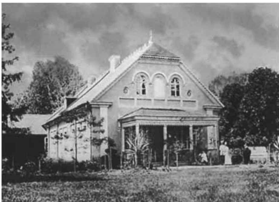
Дом в Колноберже.