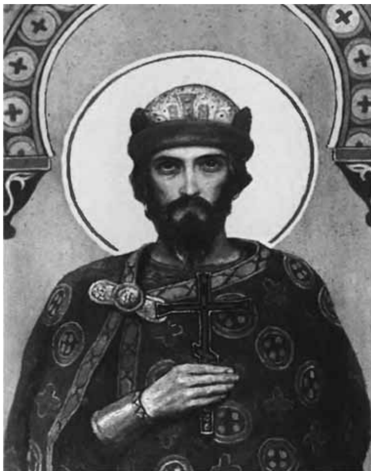
Святой благоверный князь Михаил Черниговский. В. М. Васнецов. Роспись Владимирского собора в Киеве. 1890-е гг.