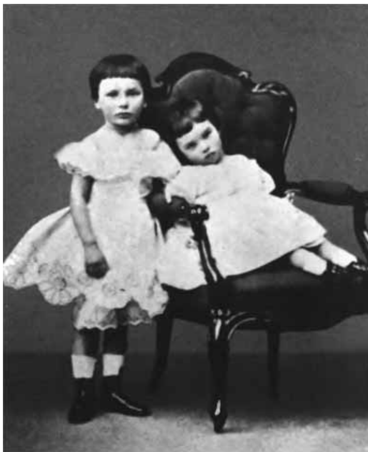
Братья Петр и Александр Аркадьевичи Столыпины. 1866 г.