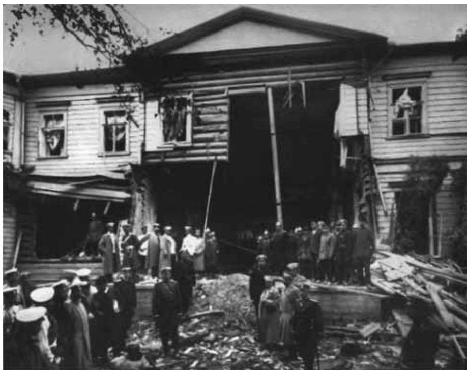
Дача Столыпина на Аптекарском острове после взрыва. 12 августа 1906 г.