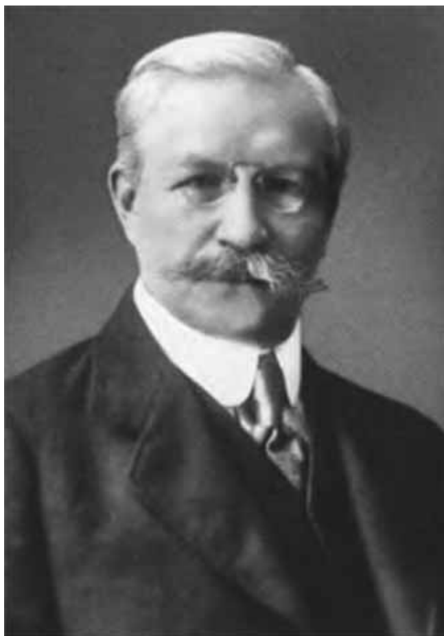
Павел Николаевич Милюков.