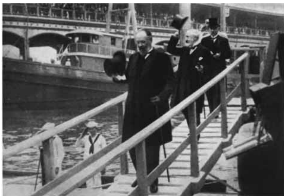
Русская делегация на переговорах в Портсмуте. 1905 г.