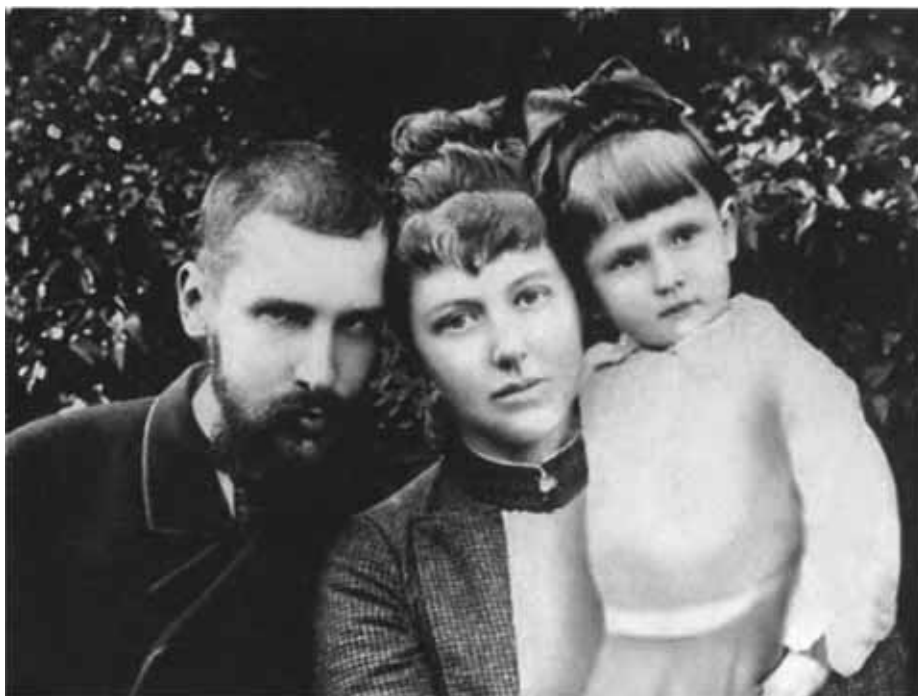
Петр Аркадьевич Столыпин с супругой Ольгой Борисовной и дочерью Марией. 1889 г.