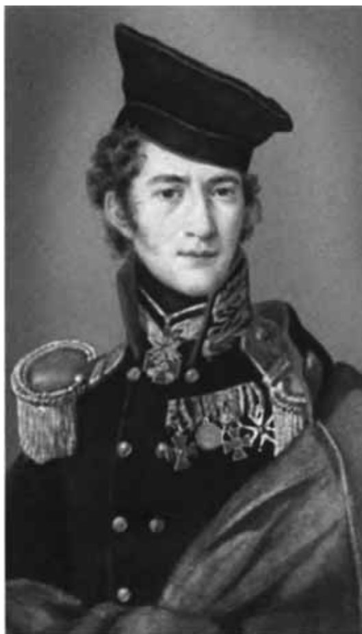
Генерал-майор Дмитрий Алексеевич Столыпин. Неизвестный художник Начало XIX в.