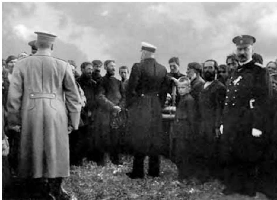
П. А. Столыпин разговаривает с хуторянами близ Москвы. Август 1910 г.