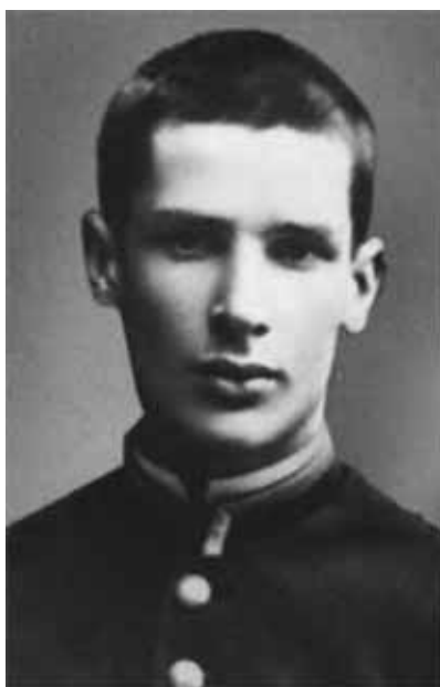
Петр Аркадьевич Столыпин — учащийся Виленской гимназии. 1876 г.